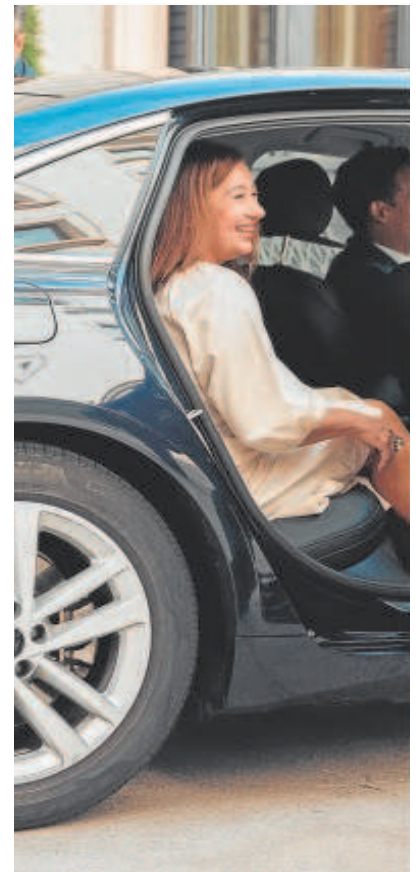
Francina Armengol, a su llegada al Congreso en el coche oficial

Es cierto que la tradición dicta que se espere a la conformación del Gobierno para que las comisiones se ajusten a las carteras del Ejecutivo, pero tam-