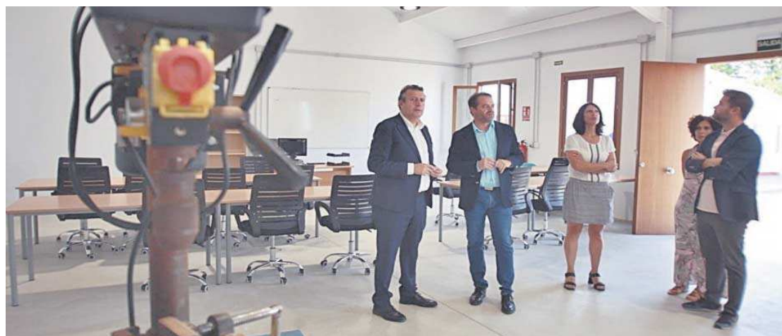
Momento de la visita del presidente de la Diputación al Centro de Formación y Empleo junto al alcalde de Mairena del Aljarafe.

La Hacienda Porzuna ha compatibilizado estas mejoras con los cursos, que en el periodo 2022-23 sumaron 11 a través del PEAPE, seguidos por 90 alumnos. Fueron muy diversos, desde atención a personas dependientes a inglés, administración o atención a per-