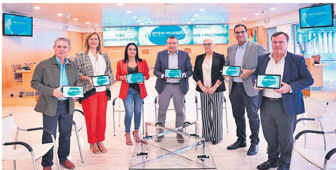
La junta de gobierno de la Diputación presentó el anteproyecto de presupuestos para 2024.

● La excelencia social y hacer de Sevilla una marca empresarial e industrial son los principales pilares