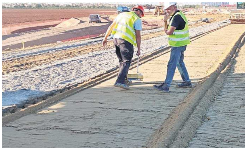
Obras de la línea 3 del Metro de Sevilla en la zona Norte del Higuerón.

Oficialmente esta petición de retraso de la aportación estatal se debe a las supuestas “dificultades que supone la constitución de la garantía para la Junta de An-