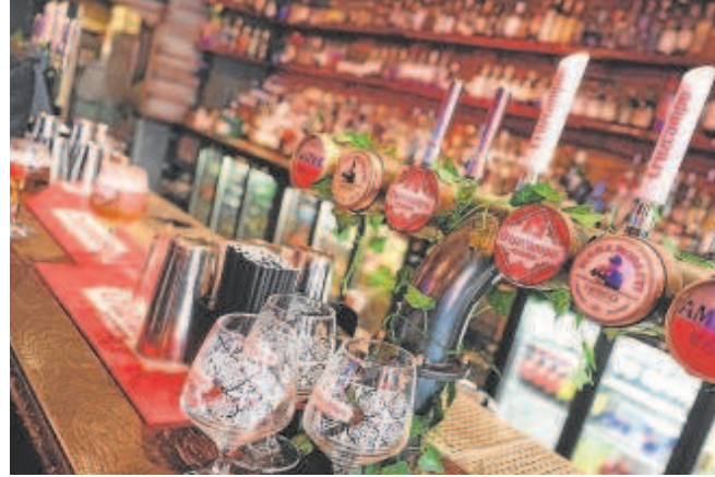
Tiradores de cerveza en el canal de hostelería