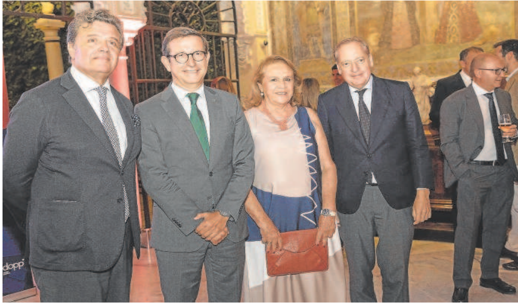
Acto de conmemoración del 60 aniversario de Dopp Consultores en la Casa Guardiola