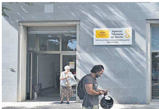
La Agencia Tributaria de Sevilla, en las oficinas del Prado.

“Sumando las bonificaciones del 5% en esos recibos más comunes de los hogares sevillanos, el contribuyente no tendría que pagar 28 euros de media. Y al menos en una parte podría compensar el tarifazo inicial del 30% en el agua que pla-