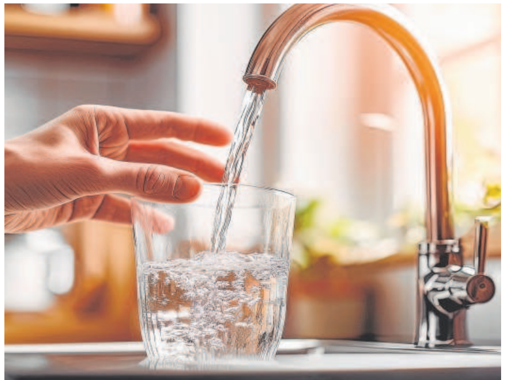
Una persona llena un vaso de agua desde un grifo