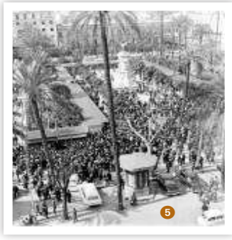
1 Pasar la tarde en la Plaza Nueva 2 Engalanada en 1950 3 San Fernando cubierto de nieve en 1954 4 Vista aérea de Sevilla en 1934 5 La Feria del Libro de 1968

vida cotidiana de este espacio era muy similar a la actual. Aunque el público haya descendido, la Plaza Nueva era un lugar central para reunirse y disfrutar del tiempo libre. Los sevillanos se sentaban en las características, y ya desaparecidas, sillas metálicas verdes a pasar la tarde con los suyos. Era un lugar de encuentro, charlas entre amigos y flirteos. Al igual que sucede hoy en día, que cada tarde se llena de bullicio de chiquillos, pelotas y patines, en la fotografía tomada por Gelán el ambiente familiar y la vida sin prisas lo envolvía todo. Sevilla dormía en su propio recreo. El fotógrafo recoge las tertulias distendidas, las reuniones de niñeras y los soldados ociosos, posiblemente la imagen fuese tomada un domingo. Algo curioso, y que no puede verse desde hace más de un década, son los vehículos aparcados al fondo de la instantánea, coches que hoy diríamos «de época». De ese mismo año, 1950, es una bellísima fotografía tomada por Serrano, en la que muestra un quiosco de música en el lugar que hoy se ubica la estatua, y la plaza se encuentra engalanada con guirnaldas de luces.