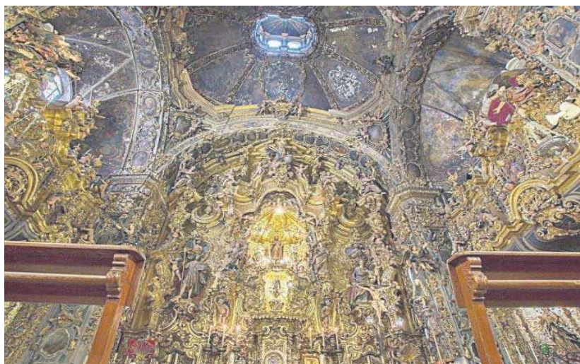
El altar mayor de la capillita de San José.

Desde el año 2018 el Ayuntamiento ha aportado 360.000 euros para la recuperación de este espacio patrimonial en la calle Jovellanos, que desde el año 1912 cuenta con la declaración de Monumento Nacional. La colaboración entre el Ayuntamiento y la Capilla de San José arrancó con un primer convenio siendo alcalde Juan Espadas a través del que se realizó una aportación de 85.000 euros para la ejecución de las obras derivadas de la Inspección Técnica de la Edificación (ITE). En esta primera actuación, se acometieron obras de consolidación estructural reparación de la instalación eléctrica y consolidación de pinturas murales en la bóveda de la iglesia y de la azulejería. La subvención total mencionada