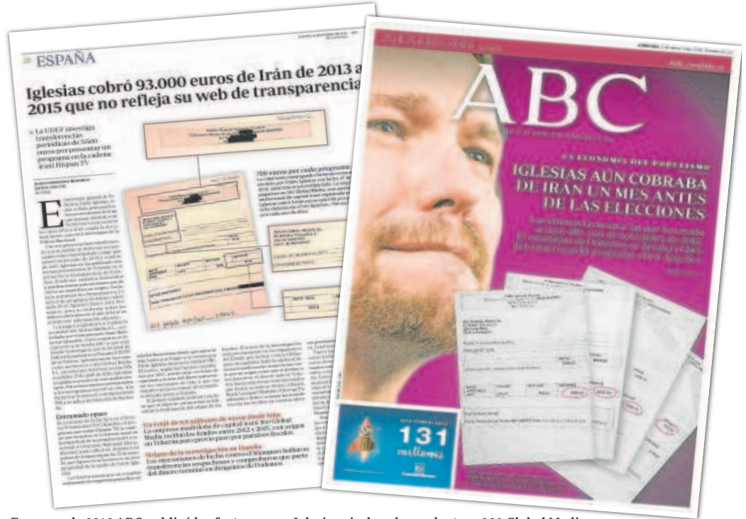
En enero de 2016 ABC publicó las facturas que Iglesias giraba a la productora 360 Global Media

Quien luego sería vicepresidente del Gobierno se convirtió en presentador de 'Fort Apache', el programa estrella de Hispan TV. Una de las ex-