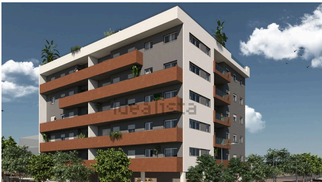
Imagen del residencial Cielo de Tomares

La promoción del Edificio Cielo de Tomares pone a la venta viviendas con trastero y plaza de garaje en la zona alta de Tomares. Las viviendas a la venta por menos de 300.000 euros son varias, por ejemplo: un piso de 3 dormitorios y 129 metros cuadrados por 295.700 euros ; aunque la vivienda más barata a la venta tiene un precio de 182.900 euros .