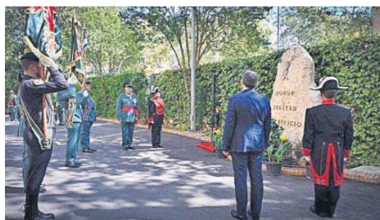
Acto de homenaje a los caídos.