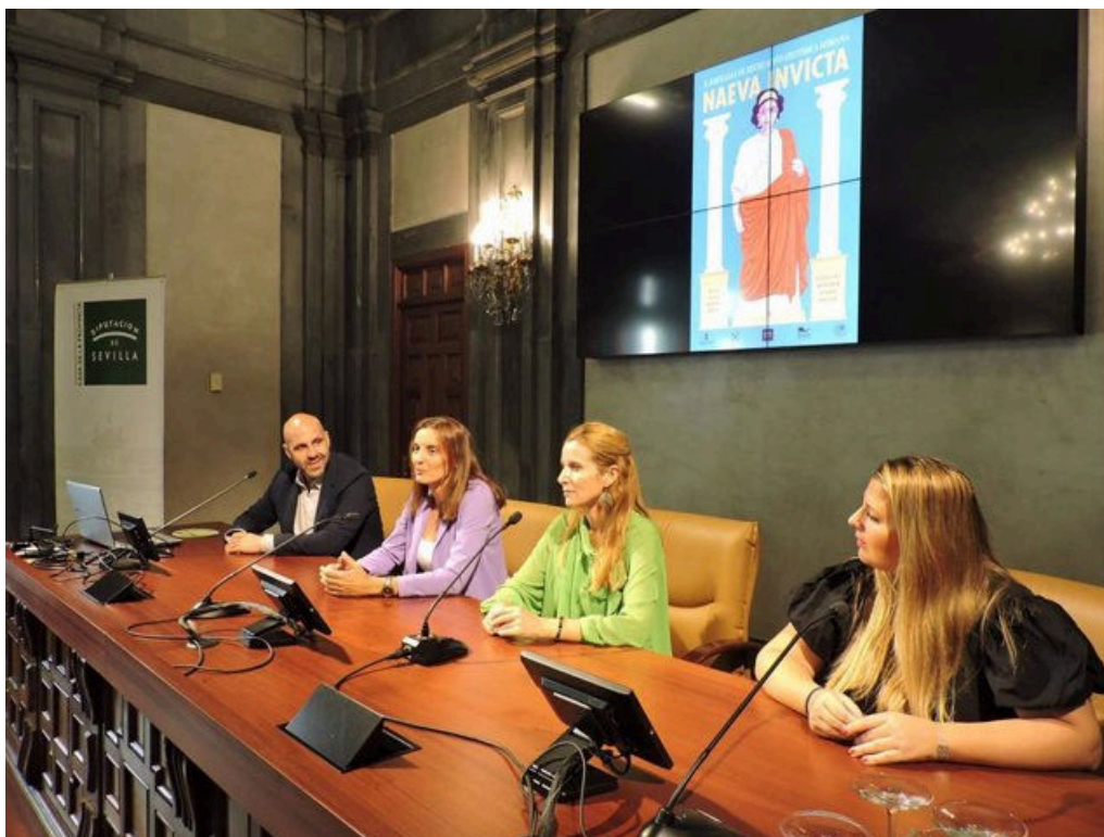
Misión comercial turística de la Diputación de Sevilla en Barcelona para consolidar la afluencia de visitantes catalanes