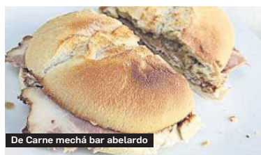
De Carne mechá bar abelardo