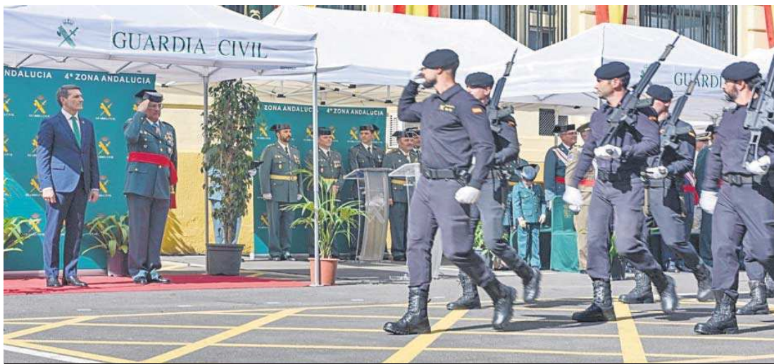
Desfile de agentes del GRS durante el día de la Virgen del Pilar en el acuartelamiento de Eritaña.