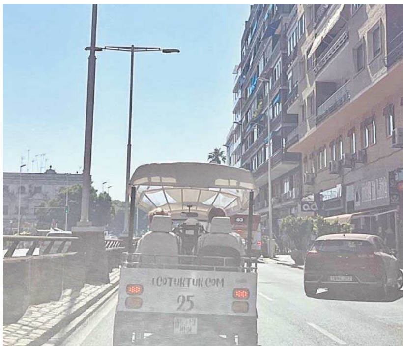
Uno de los polémicos tuk tuk circulando por la calle Arjona este jueves.

Los informes de las delegaciones competentes en la mate-