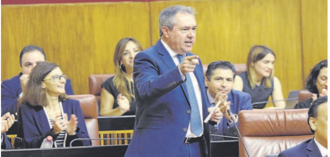
El líder del PSOE andaluz, Juan Espadas, se dirige ayer al presidente Juanma Moreno desde su escaño en el Parlamento