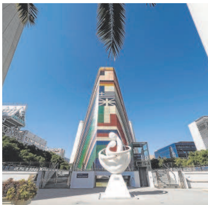
Arriba, el Pabellón de Marruecos; abajo, el de la Comunidad Económica Europea

La Expo fue única en muchos sentidos. Aunque no fue la primera que se celebraba, reunió al mayor número de participantes: 30 países europeos, 33 americanos, 21 asiáticos, 20 africanos, 8 de oceanía, 17 comunidades autónomas españolas, 23 organismos internacionales y 6 empresas. Tal fue el éxito, que se registraron cerca de 42 millones de visitas durante esta 'Era de los descubrimientos'.