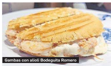
Gambas con alioli Bodeguita Romero