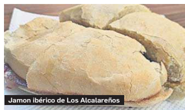
Jamon ibérico de Los Alcalareños

de salmón, de palometa y también de bacalao. Los ahumados se introdujeron en Sevilla en la segunda mitad del siglo XX y fue Juan Robles, de Casa Robles, el que los trajo. Una de las formas más habituales de presentarlos es en montaditos. En ellos el salmón o la palometa se acompañan con queso fresco, de untar o tipo Cabrales. También se encuentran realizados con anchoas o con bacalao ahumado. En los últimos años también han ganado peso los realizados con atún.