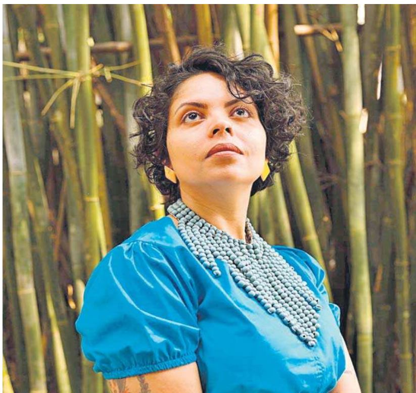
La artista brasileña Aline Bispo.