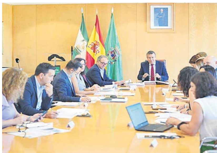
Representantes de la Junta de Gobierno de la Diputación.

Los ayuntamientos de Aznalcázar, Isla Mayor, Utrera y El Palmar de Troya (Línea 1) y Alcalá del Río, Las Cabezas de San Juan y Lora del Río (Línea 2) son los destinatarios que se beneficiarán de los 9,7 millones previstos para tal finalidad.