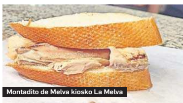
Montadito de Melva kiosko La Melva