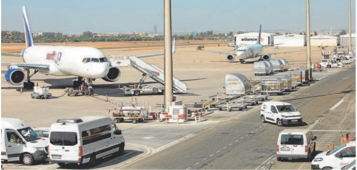
Una imagen del aeropuerto de Sevilla