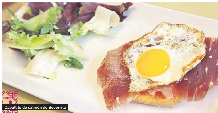
Caballito de salmón de Becerrita