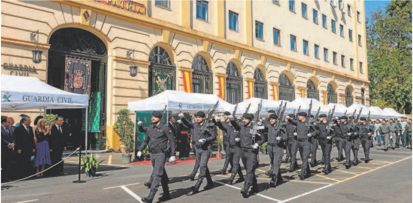
Parte de la unidad de honores que desfiló ayer en el acuartelamiento capitalino