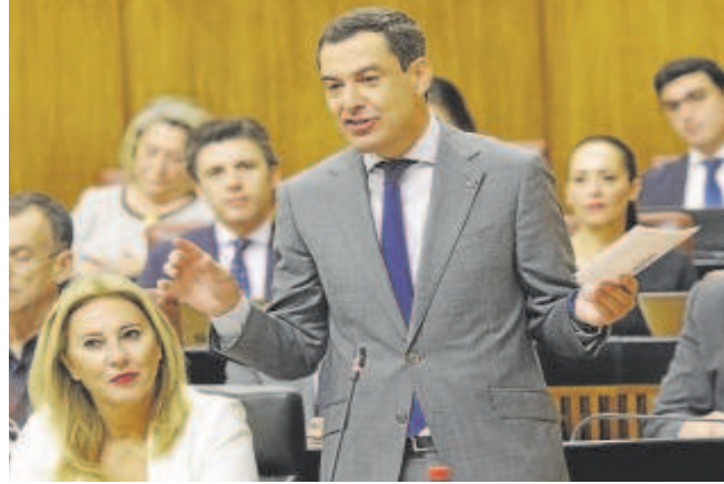
Juanma Moreno, presidente de la Junta, ayer en el Parlamento