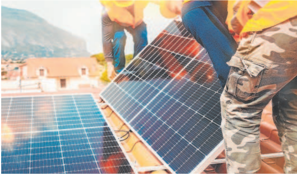
En Andalucía se han presentado más de 28.000 solicitudes de ayudas para instalar fotovoltaicas en viviendas