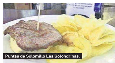
Puntas de Solomillo Las Golondrinas.