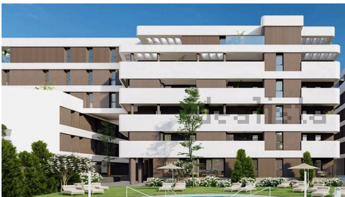
Imagen del residencial Mascareta Plaza 3

Otro de los nuevos residenciales que se construyen en Tomares y cuyas viviendas ya pueden adquirirse es Mascareta Plaza 3 , la tercera de las promociones del grupo Promar en la zona. Las viviendas de la promoción que incluye su anuncio tienen 3 y 4 dormitorios :