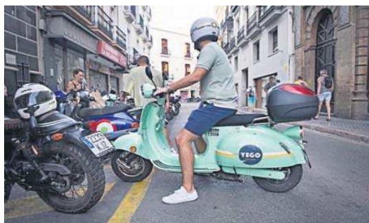
Una moto de Yego en Sevilla.

La federación había denunciado a la empresa en el marco de una campaña de control a las principales empresas de movilidad urbana tras constatar que Yego no disponía en su página web y app de modelos de hojas de reclamaciones oficiales, algo a lo que obliga la legislación andaluza de protección de los consumidores. Las otras denuncias por este motivo fueron Uber, Lime, Acciona y Cabify, contra las que la Junta de Anda-