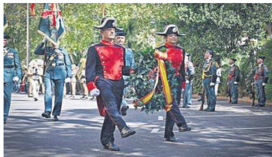
Dos agentes de gala portan una corona de laurel.

Este ascenso le ha valido también la oportunidad de dirigir a casi 15.000 hombres y mujeres, “excelentes profesionales, en tal medida que hacéis fácil la tarea de liderarlos”. Recordó el general Ortega que la Guardia Civil ha soportado desde siempre todo tipo de amenazas, “como disolución, reorganización, desmilitarización o fusión, pero una vez conocidas las funciones que se desempeñan y modo como se ejecutan los servicios, en lugar de materializarse esos propósitos, se fortalece su idiosincrasia y permanencia”.