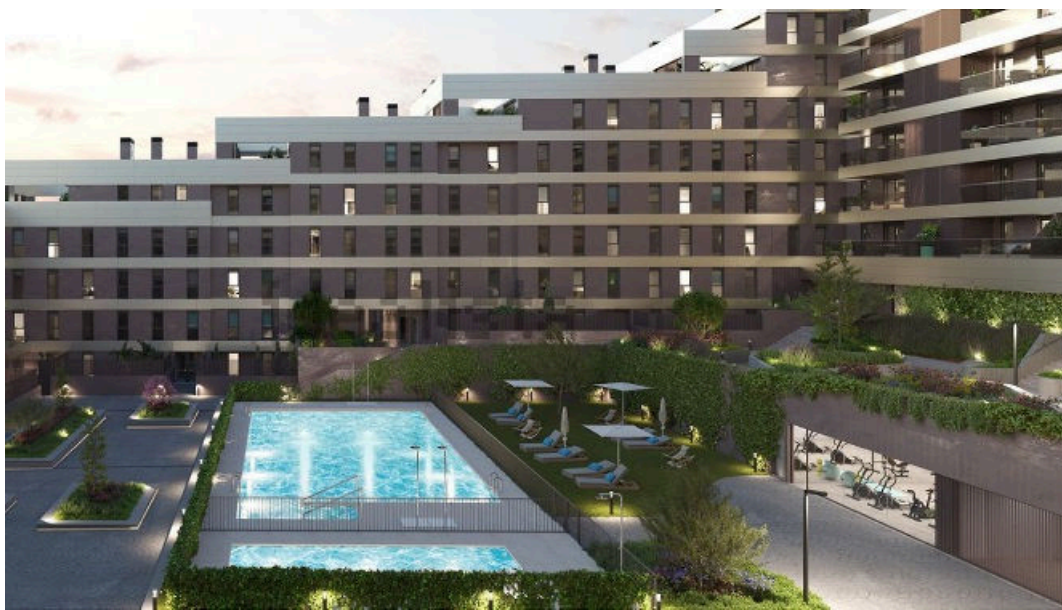
10 pisos de obra nueva en Tomares por menos de 300.000 euros / Idealista.com

El impulso inmobiliario que ha tenido lugar en Tomares en los últimos años ha convertido a la localidad como uno de los lugares de la provincia en el que se pueden encontrar viviendas de nueva construcción con muchas ventajas , buenas conexiones y cercanía de servicios , además de encontrarse a poca distancia de Sevilla capital .