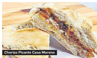
Chorizo Picante Casa Moreno