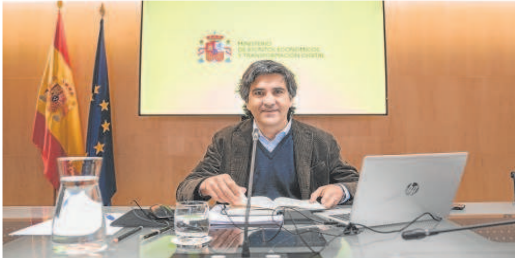
El secretario de Estado de Economía, Gonzalo García Andrés