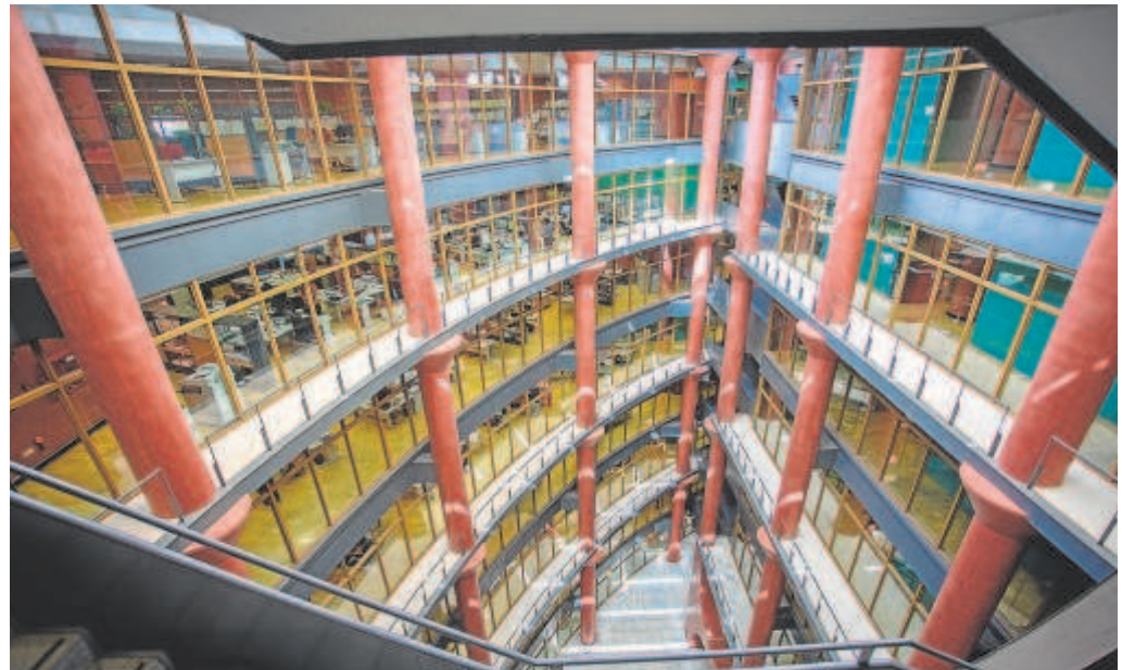
Imagen interior de la sede de la Consejería de Desarrollo Educativo de la Junta de Andalucía

Igualmente, al personal que no se encontrara en situación de servicio activo a día 1 de octubre o que hubiera perdido la condición de empleado público, y que haya mantenido entre el día 1 de enero y el 30 de septiembre alguna relación de servicio con la Administración Pública, le serán abonados los atrasos que correspondan. También en los casos de supuestos organismos extinguidos, en cuyo caso se hará cargo del pago la entidad que haya asumido sus funciones.