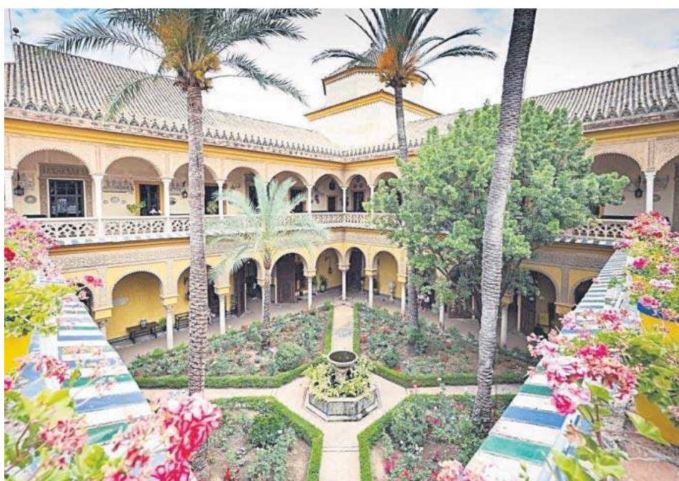
El Palacio de Dueñas de Sevilla.

● Del 20 al 22, el festival internacional de arquitectura contará con más de 40 visitas gratuitas, 10 estudios, 5 paseos y 2 actos