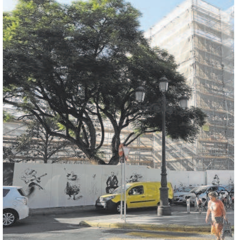
Vista actual de las obras en el futuro hotel sobre la que fuera la comisaría de la Gavidia y la iglesia de San Hermenegildo, en los extremos de la plaza de la Concordia, zonas muy concurrida del Centro Histórico y que conecta las calles comerciales con San Vicente y San Lorenzo

Las últimas propuestas van desde un museo de la Semana Santa a tenor de declaraciones del alcalde José Luis Sanz hasta diversos proyectos que hubo de centros culturales o del museo de la Autonomía ya que la iglesia había albergado durante un tiempo el Parlamento andaluz en los años 80. Hay que remontarse