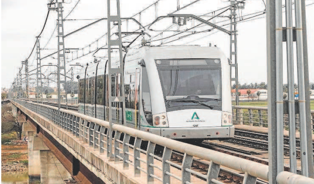
Un tren de la línea 1 del metro de Sevilla yendo hacia el Aljarafe