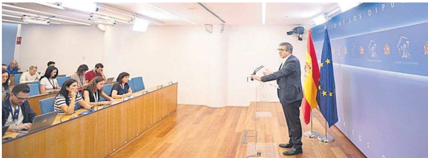
Patxi López atiende a los medios en el Congreso de los Diputados.