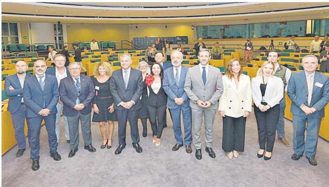
Todos los participantes en el debate sobre Sevilla, capital del Turismo Inteligente, en el Parlamento Europeo.