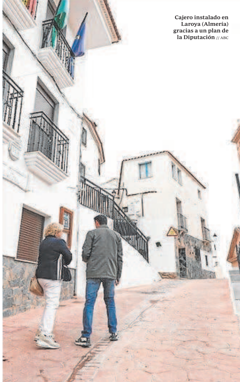
Cajero instalado en Laroya (Almería) gracias a un plan de la Diputación