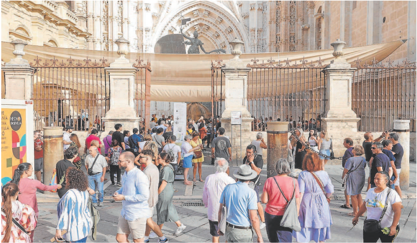
Numerosos visitantes en el entorno de la Catedral durante este pasado puente del Pilar