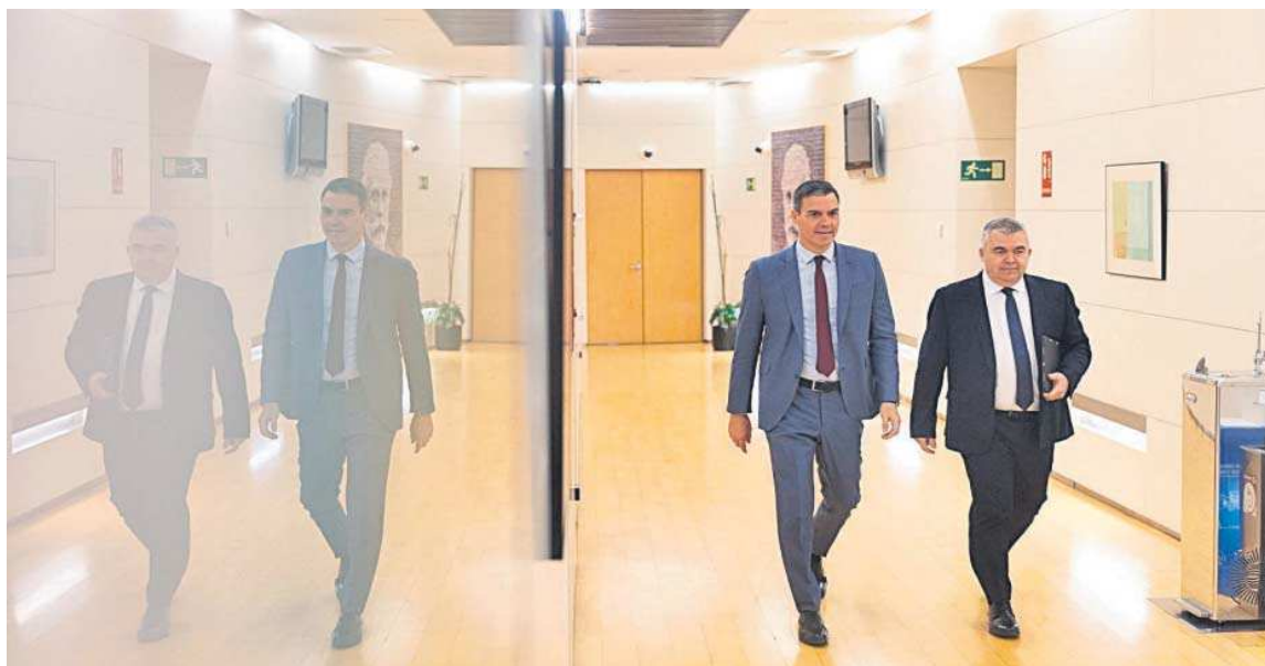
El secretario de Organización del PSOE, Santos Cerdán (dcha.), y el presidente del Gobierno en funciones, Pedro Sánchez, antes de la ronda de contactos.