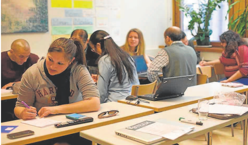
Varios alumnos en uno de los talleres del distrito de Nervión