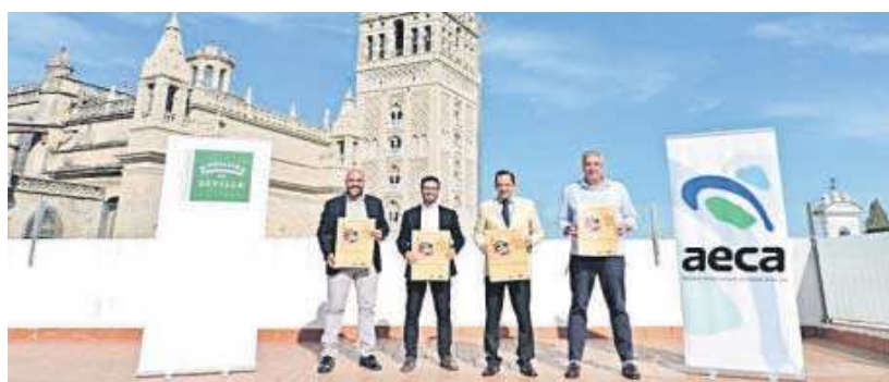
Presentación del evento cabeceño en la Casa de la Provincia.

La V Ruta de la Tapa de Las Cabezas de San Juan (organizada por Aeca Las Cabezas en colaboración con el Ayuntamiento y otras entidades) se caracteriza este año por dos factores importantes: el primero de ellos, “recuperar su esencia, que no es otra que la de dar a conocer el potencial gastro-