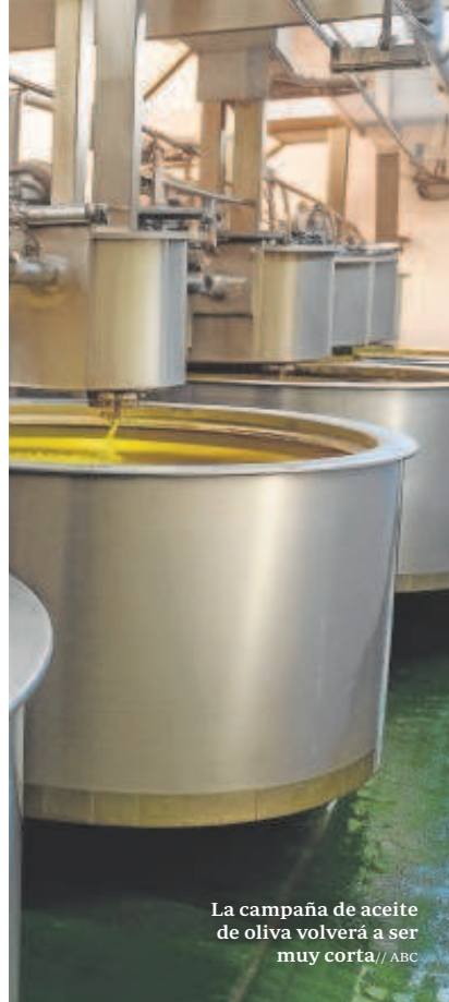
La campaña de aceite de oliva volverá a ser muy corta