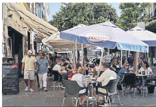
Una terraza en el centro de Sevilla.