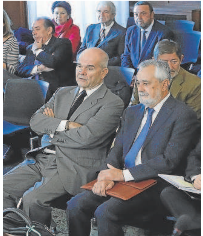
Manuel Chaves y José Antonio Griñán, durante el juicio de los ERE

Un momento clave en la instrucción de los ERE fue la salida de Mercedes Alaya del juzgado de Instrucción número 6, lo que suponía el abandono de la instrucción del caso ERE. La magistrada sevillana ganó una plaza en la sección