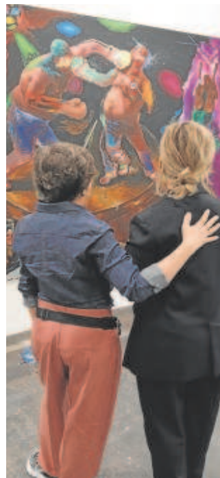
Más de 100 galerías están presentes en la muestra