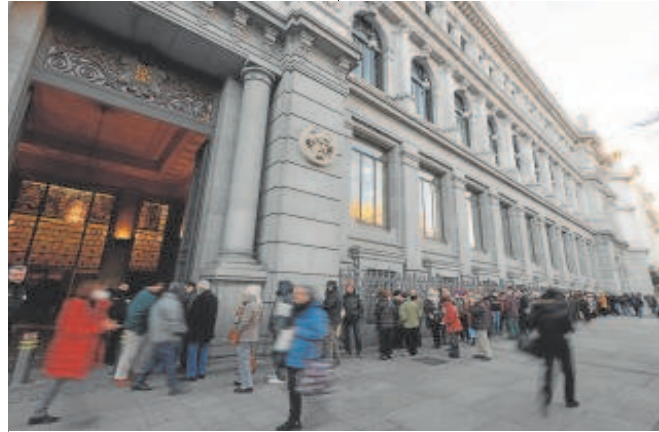
Colas ante el Banco de España para comprar deuda pública

La constatación de esta nueva realidad es lo que ha provocado el seísmo al que estamos asistiendo en el mercado de bonos. Los tipos a los que la economía y la inflación se mantienen básicamente estables son otros completamente distintos a los que pesábamos previamente.