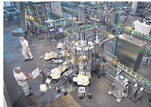
La embotelladora nazarena envasando aceite La Española para América.