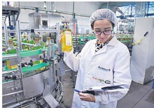
Una trabajadora del departamento de calidad, en la planta de Dos Hermanas.