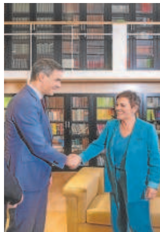
Sánchez saluda a Aizpurua (Bildu) el pasado viernes

El engaño de una investidura, que en verdad es solo una capitulación por entregas, produce extrañas ilusiones de perspectivas entre un público acostumbrado al «no será capaz» y el «eso seguro