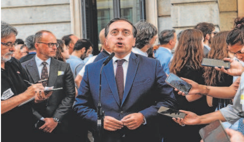
El ministro de Asuntos Exteriores, José Manuel Albares, atiende a la prensa en el patio del Congreso