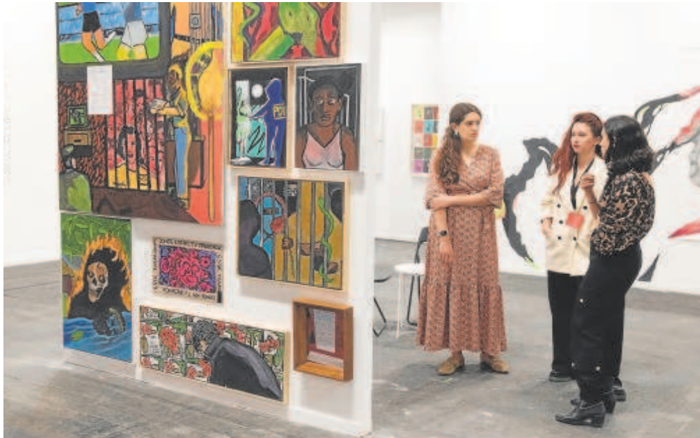
El pabellón 4 de IFEMA MADRID acogerá una nueva edición de la feria de arte contemporáneo Estampa