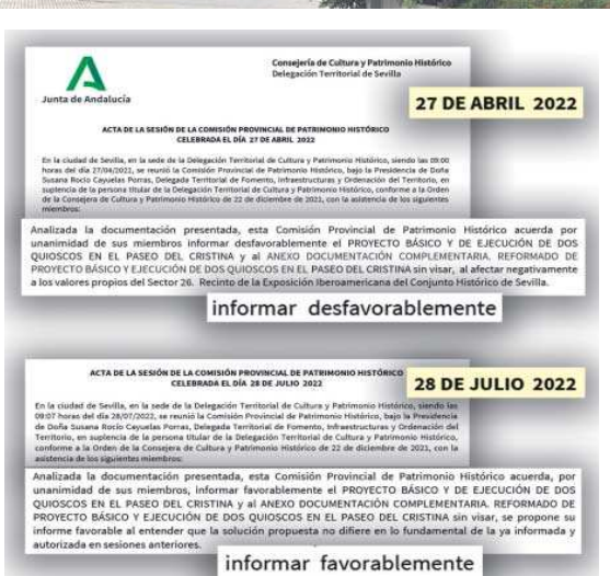
Los expedientes sobre estas líneas reproducen el dictamen de la Comisión de Patrimonio de abril y de julio de 2022.

No autoriza el proyecto por "afectar negativamente a los valores propios del sector 26", que es el del Recinto de la Exposición Iberoamericana, considerado Bien de Interés Cultural, en el "en-