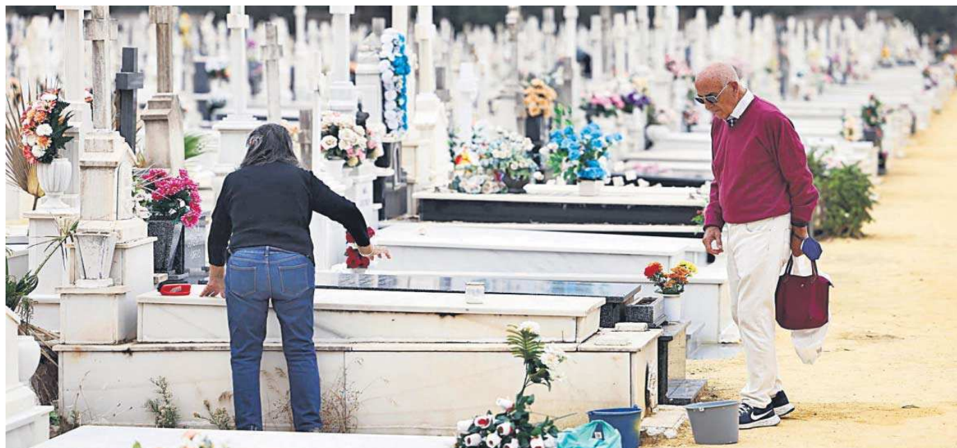
Dos personas adecuantan una lápida en el cementerio de San Fernando.