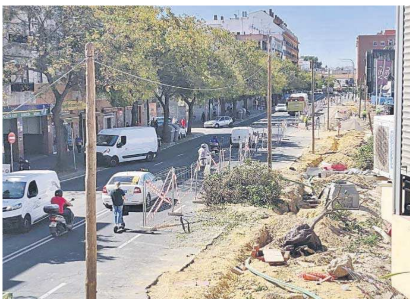
La Carretera de Carmona sin los 25 naranjos recién talados. D.S.

En un informe de Parques y Jardines, fechado el pasado 10 de julio, se asegura que "el proyecto de reurbanización fue informado en su día pero no se tuvo en cuenta estos apeos porque no se contemplaba que fueran necesarios. En la fase de ejecución aparecen gran número de servicios subte-