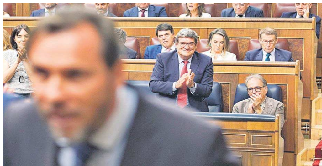
El diputado electo y secretario general del PSOE de Valladolid, Óscar Puente, en la segunda votación de la investidura del líder del PP, Alberto Núñez Feijóo.

Hemos vivido esta semana un nuevo ejemplo práctico de cómo conciben los partidos el parlamentarismo democrático. Expresan todas las prerrogativas que les concede el reglamento y la Constitución, pero no pueden evi-