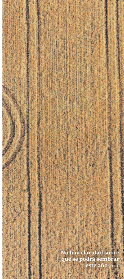
No hay claridad sobre qué se podrá sembrar este año