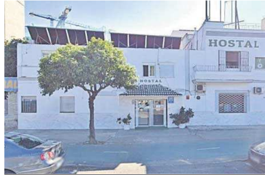
Los responsables del hostel no cometieron ningún delito, dice la Audiencia.

Una de esas personas trabajó en la cocina y efectuó faenas de albañilería, mantenimiento y cuidado de la piscina entre marzo y el 14 de julio, en “un horario no determinado que podía desarrollarse por la mañana o por la tarde, según las necesidades del servicio”. Un segundo varón que estuvo en la cocina y fue albañil si tuvo un contrato “por dos ho-