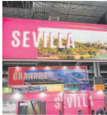
Puesto informativo de Sevilla en la cita de Fitur

«En Fitur siempre se ha colaborado con todas las instituciones, y la Diputación es clave para incrementar las pernoctaciones», añadió el presidente de la patronal. De esta forma, el sector de las empresas turísticas coincide con el planteamiento del alcalde, el 'popular' José Luis Sanz, quien la semana pasa-