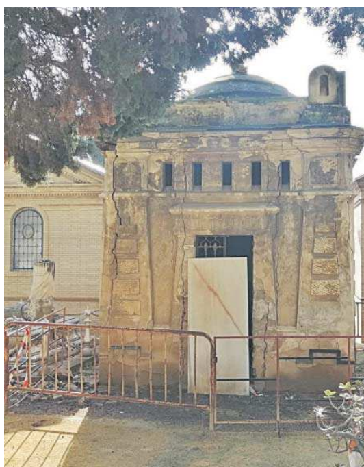
Uno de los panteones en mal estado.

las ordenanzas fiscales aparece que “las modificaciones propuestas consisten en el cambio de importe amparados con las tarifas comparadas para los servicios de incineración en otros municipios andaluces que resultan muy superiores a los del Ayuntamiento de Sevilla”. El depósito de cenizas en zonas comunes sube de los 37,79 euros a 113,38 euros. Son los espacios conocidos como pirámides, lugares construidos junto a la puerta de entrada para depositar