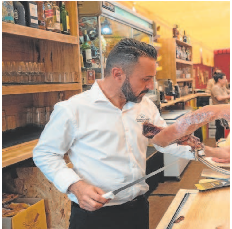
Un camarero corta jamón en una caseta en la pasada Feria de Abril

«Entiendo que a los hoteles les pueda parecer mejor el formato nuevo pero para nosotros los días de Feria son de muy poca venta porque todo