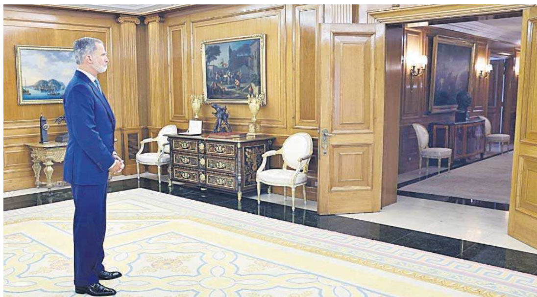
El rey Felipe, durante una anterior ronda de consultas con los dirigentes políticos antes de proponer candidato a la Presidencia del Gobierno.