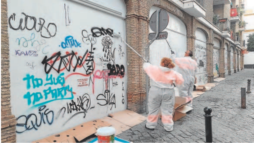
Operarios de Lipasam retirando los grafitis de la fachada de un edificio de Sevilla

Distribuido para CONFEDERACIÓN DE EMPRESARIOS DE SEVILLA * Este artículo no puede distribuirse sin el consentimiento expreso del dueño de los derechos de autor.