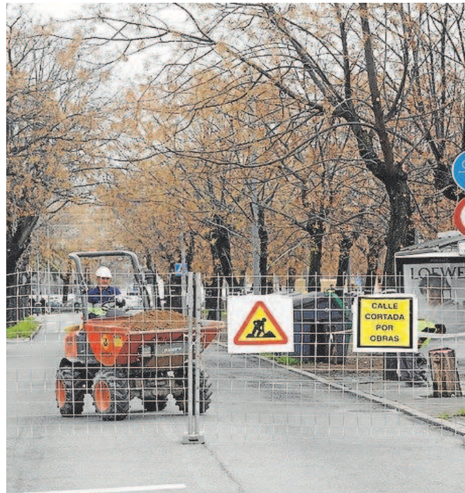
Obras públicas en la capital cordobesa

Ceacop denuncia que muchos ayuntamientos no aplican las revisiones de precios puestas en marcha por Junta y Estado