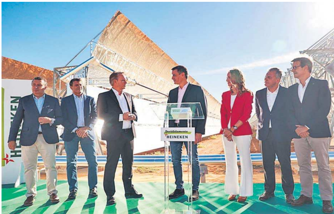
Pedro Sánchez, entre otras autoridades, asiste a la inauguración de la planta termosolar de Heineken y Engie.