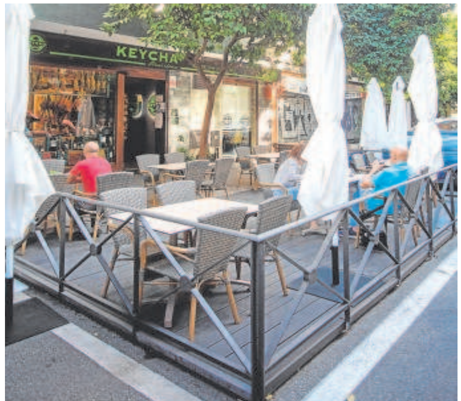
Las plataformas de veladores que se colocaron en 2020

El Ayuntamiento defiende que los veladores que se incrementaron han mejorado la accesibilidad en los viarios, lo que ha conllevado que se esté valorando técnicamente las condiciones de inclusión de estas formas de ocupación de terrazas de veladores en la modificación de la ordenanza.