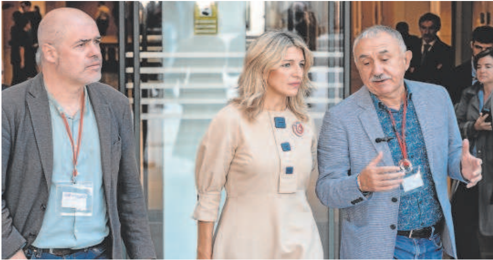
Yolanda Díaz, vicepresidenta y ministra de Trabajo, y los líderes de UGT y CC.OO. Pepe Álvarez (dcha.) y Unai Sordo

Distribuido para CONFEDERACIÓN N DE EMPRESARIOS DE SEVILLA * Este artículo no puede distribuirse sin el consentimiento expreso del dueño de los derechos de autor.