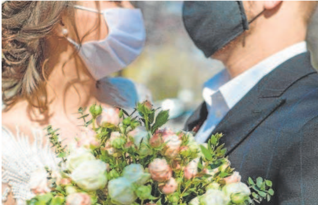
Los novios llegaron a fijar tres fechas distintas en un salón de bodas de Espartinas