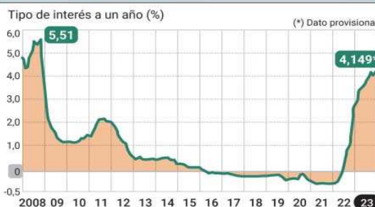
Evolución del Euríbor

FUENTE: Banco de España. GRÁFICO: Dpto. de Infografía.