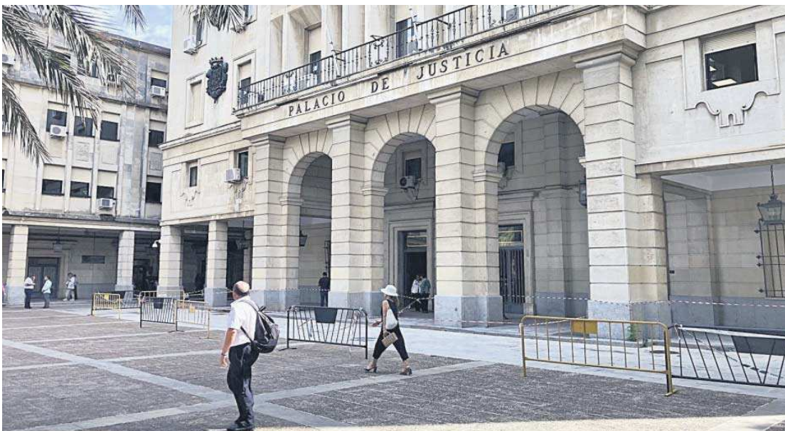
La sentencia ha sido dictada por la Sección Tercera de la Audiencia de Sevilla.

Distribuido para CONFEDERACIÓN DE EMPRESARIOS DE SEVILLA * Este artículo no puede distribuirse sin el consentimiento expreso del dueño de los derechos de autor.