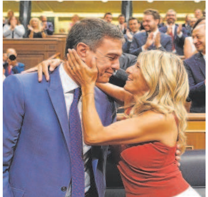
Pedro Sánchez y Yolanda Díaz, durante la sesión constitutiva de las Cortes, el pasado 17 de agosto

y desde Sumar consideran que puede ser un punto de consenso programático porque ya en 2021 Errejón alcanzó un acuerdo con el Gobierno para incluir en los Presupuestos Generales de 2022 un plan de ensayo que planteaba la semana laboral de 32 horas o de cuatro días. El Ministerio de Industria incentivó con hasta 150.000 euros a pymes que implantaran el horario sin reducir el sueldo con este proyecto.