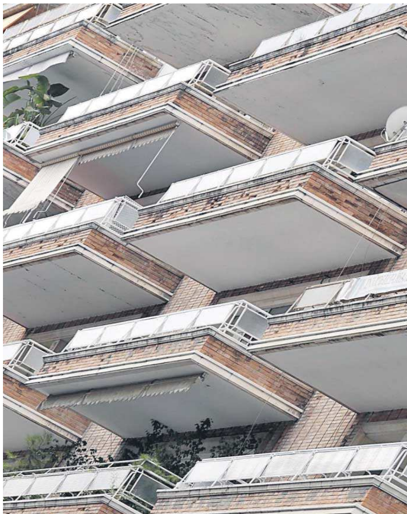
Un bloque de viviendas en el barrio de Los Remedios.

En cuanto a los precios públicos, se congelan todos con la excepción de algunas tarifas del Real Alcázar. Las entradas que se vendan en taquilla van a costar lo mismo que las de venta anticipada por internet. No sólo eso. “Ahora mismo, se cobraba lo mismo a un grupo de 50 personas por una visita nocturna que a uno de 500. Un grupo diez veces más numeroso requiere más personal, más seguridad, en definitiva, más gasto