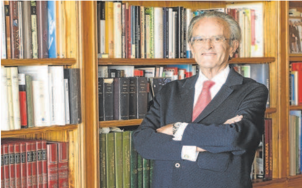
El abogado y expolítico, en su domicilio de Madrid

Distribuido para CONFEDERACIÓN DE EMPRESARIOS DE SEVILLA * Este artículo no puede distribuirse sin el consentimiento expreso del dueño de los derechos de autor.