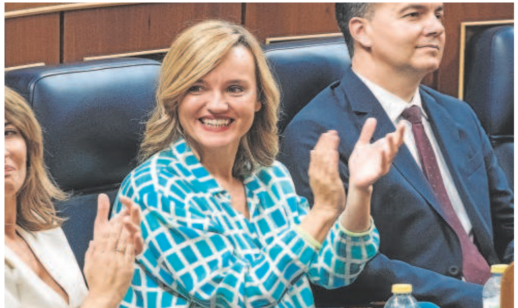
La ministra de Educación, Pilar Alegría, en el Congreso de los Diputados

Este periódico se puso en contacto con el Ministerio de Educación para