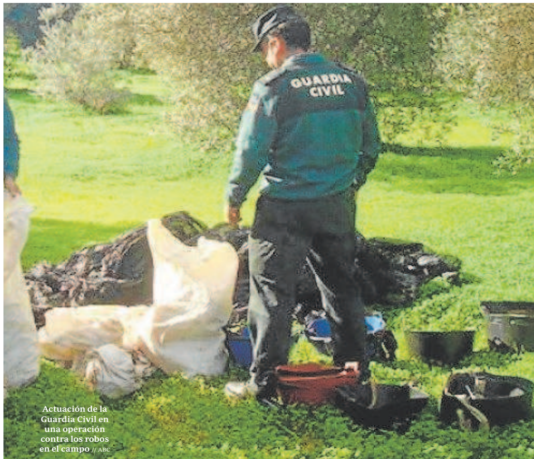
Actuación de la Guardia Civil en una operación contra los robos en el campo

En el grupo de la zona del Aljarafe, por ejemplo, hay más de 60 componentes, y más de un centenar en el de Arahal. «Es un método un poco rudimentario, pero ayuda a dar sensación de tranquilidad, a no sentirse tan solo», comentan. Sirven también de canal de comunicación entre los agricultores y los agentes, se pasan fotos de coches sospechosos que sirven, a grandes rasgos, para tener más controlada la zona. Incluso hay grupos de agricultores que han contratado seguridad privada por su cuenta.