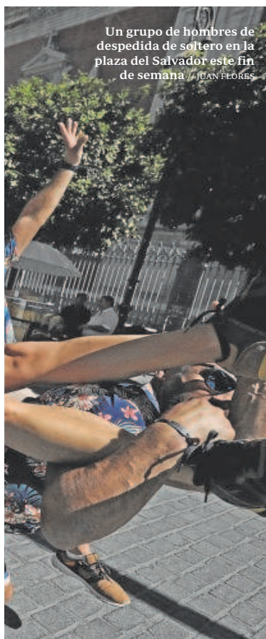
Un grupo de hombres de despedida de soltero en la plaza del Salvador este fin de semana

acogida tendrá la futura normativa, hay que recordar las propias palabras del alcalde: «Cualquiera puede celebrar su despedida de soltero en Sevilla. Lo que no vemos con buenos ojos son esos grupos de gente disfrazada de lo que sea, con la charanga detrás, molestando a los muchos vecinos de Sevilla –sobre todo en zonas del casco histórico– que también tienen derecho a disfrutar de su ciudad», dijo hace días José Luis Sanz.