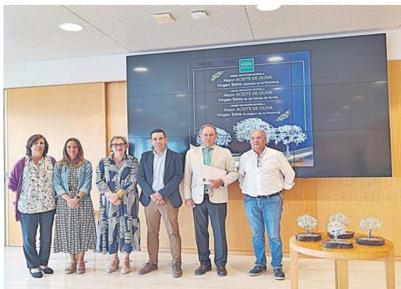
En el centro, el diputado provincial con el secretario gral. de la Diputación y técnicos del Área de Servicios Supramunicipales.

Por último, el galardón al Mejor Aceite Ecológico de la campaña 2022-2023 ha recaído en Segura y Gómez Ancestral SL, en el municipio de Pedrera. En concreto, el jurado ha premiado