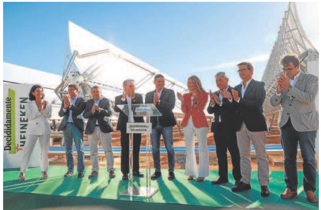
El presidente del Gobierno pusó ayer el botón de encendido de la planta termosolar de Heineken en Sevilla

«En Heineken fuimos pioneros en introducir la sostenibilidad en el sector cervecero hace más de dos décadas. Y hoy volvemos a serlo, de la mano de Engie,