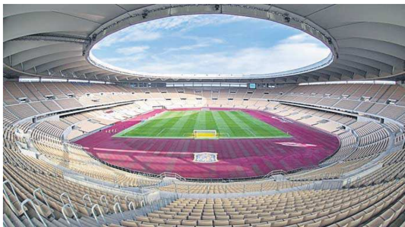
Interior del estadio de la Cartuja, en una imagen reciente.

La inversión de 20 millones de euros busca, remarcó el consejero, que el estadio de la Cartuja se convierta en el “estadio nacional” para los grandes eventos deportivos y para otro tipo de actividades multitudinarias.