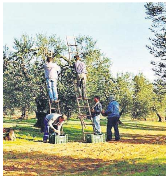
Recolección de la aceituna.

Agricultura abona todo el anticipo de la PAC, 700 millones para 200.000 productores