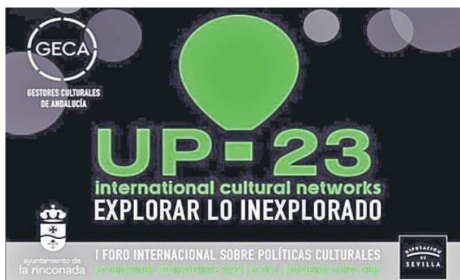
El cartel del I Foro Internacional sobre Políticas Culturales.

provincia el proyecto 106x7 (número de municipios de la provincia por siete días de la semana), que parte del proyecto 786, número de municipios que hay en Andalucía. Queremos ver la realidad de cada localidad. Tenemos que hacer una escuela activa para saber qué pueden ser, necesitar o resaltar. La Rinconada es un referente a nivel de artes escénicas, de música, pero también de gestión cultural. Tramemos este proyecto aquí porque queremos dar a conocer a La