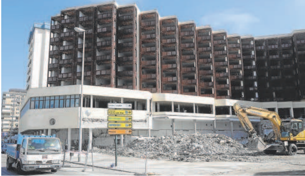
Residencia de tiempo libre de la Junta de Andalucía en Cádiz, una de las que ahora se deshace el Gobierno

UGT y Comisiones Obreras se quedaron con seis millones de euros que generaron las residencias de tiempo libre entre 2003 y 2006, dinero procedente de las tarifas públicas que no devolvieron a la Junta