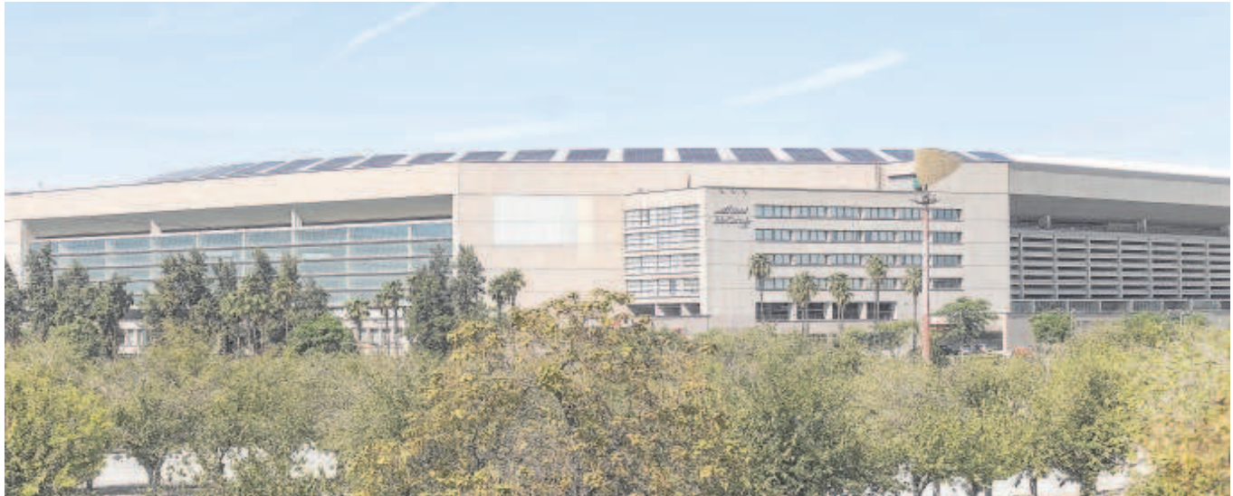
El estadio de la Cartuja de Sevilla, después de que le colocaran las placas fotovoltaicas en la cubierta