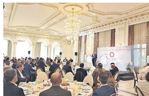
Invitados, ayer, en el Gran Hotel Miramar.