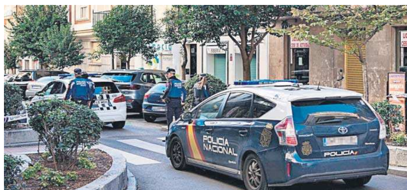
Calle Núñez de Balboa en Madrid, donde ocurrieron los hechos.