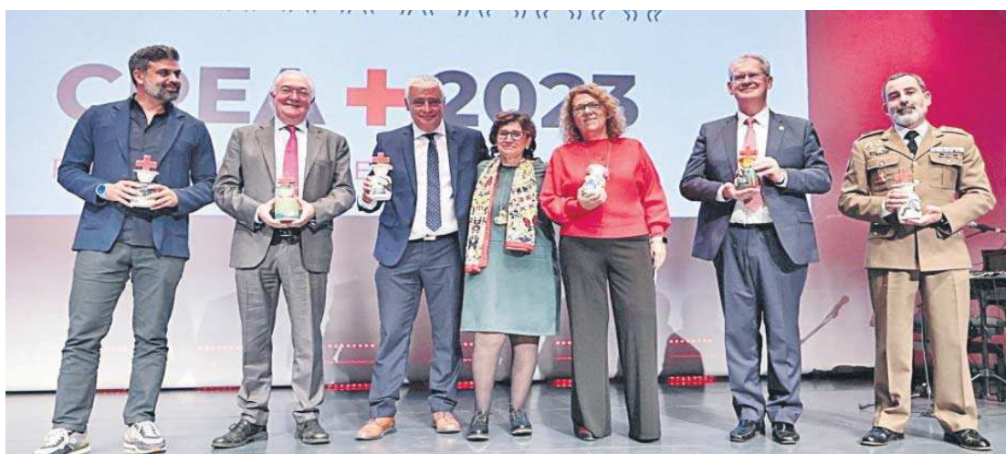
Foto de familia de los premiados por Cruz Roja Andalucía, ayer, en el salón de actos del Caixaforum.

● Cruz Roja Andalucía entregó ayer sus premios CREA+ en Caixaforum en una gala que fusionó emoción, cultura y la humanidad de seis proyectos andaluces