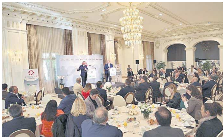
Los asistentes al Foro del Grupo Joly con el director del ICO en uno de los salones del Gran Hotel Miramar de Málaga.