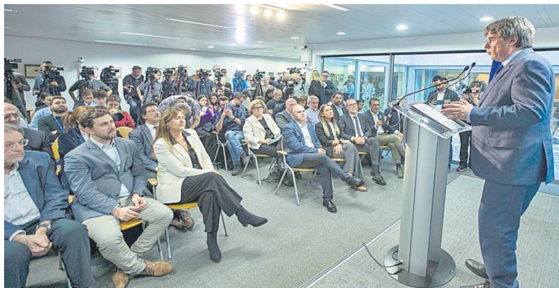
Carles Puigdemont interviene ante la plana mayor de Junts en Bruselas en la comparecencia que hizo en el Club de Prensa sin aceptar preguntas.