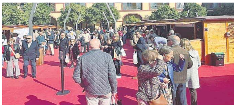
La Feria de Productos Locales 'Sabores de la Provincia' se divide en dos fines de semana en noviembre.

En este caso se trata de una muestra genérica de productos agroalimentarios locales, que tendrá su continuación, en una segunda edición, el próximo fin de semana (18 y 19 de noviembre). Es una cita muy consolidada en el calendario de la Muestra de la Provincia, con mucho éxito de público. En ella se exponen para la venta los mejores productos gastronómicos que pequeñas empresas de la provincia elaboran, producen y fabrican con dedicación, sabedoras de la alta valoración que tienen entre los consumidores”.