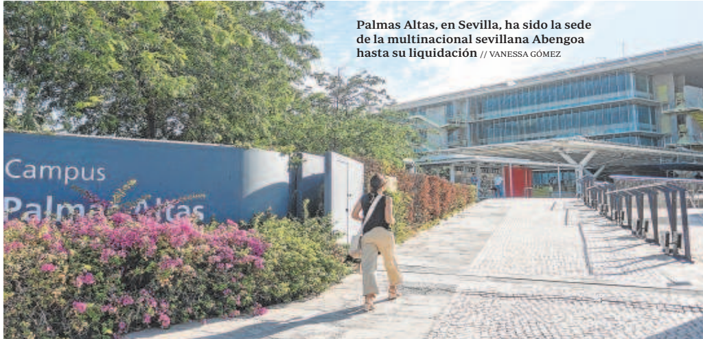
Palmas Altas, en Sevilla, ha sido la sede de la multinacional sevillana Abengoa hasta su liquidación // VANESSA GÓMEZ