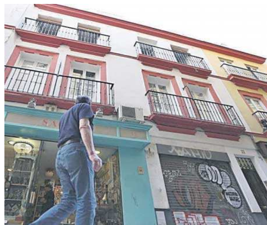
Edificio de apartamentos en la calle Francos, en una imagen de archivo.

El objetivo de la normativa será fijar unas "limitaciones proporcionadas en el número máximo de viviendas de uso turístico, tratando de armonizar el interés de los propietarios por obtener un beneficio económico de sus bienes inmuebles con otros intereses públicos, como son la protección del medio ambiente, el derecho al descanso o, la necesidad de preservar el uso urbanístico residencial", según De la Rosa.