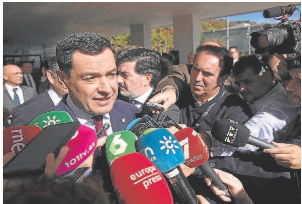
El presidente de la Junta atiende a los medios de comunicación, ayer en Málaga

Desde Vox, por último, no se hizo ningún comentario del acuerdo a nivel andaluz, ya que los líderes andaluces la cuarta formación con representación parlamentaria dejan a la discreción de Madrid cualquier opinión sobre política nacional.