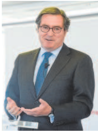
Antonio Garamendi

Los socialistas negociarán con el partido independentista «los elementos esenciales de un plan para facilitar y promover el regreso a Cataluña de la sede social de las empresas que cambiaron su ubicación a otros territorios en los últimos años». El objetivo es tratar de revertir la fuga de casi 9.000 empresas que se ha producido desde 2017 y, especialmente, recuperar a los pesos pesados del tejido productivo catalán, entre los que destaca todo el mundo que rodea a la marca Caixa y a Banco Sabadell. Desde la fundación y el 'holding' inversor de Caixa, presididos ambos por Isidro Fainé, trasladan que este asunto no está sobre la mesa. La Caixa, a través de Critería, posee más de un 30% de Caixabank –además de participaciones