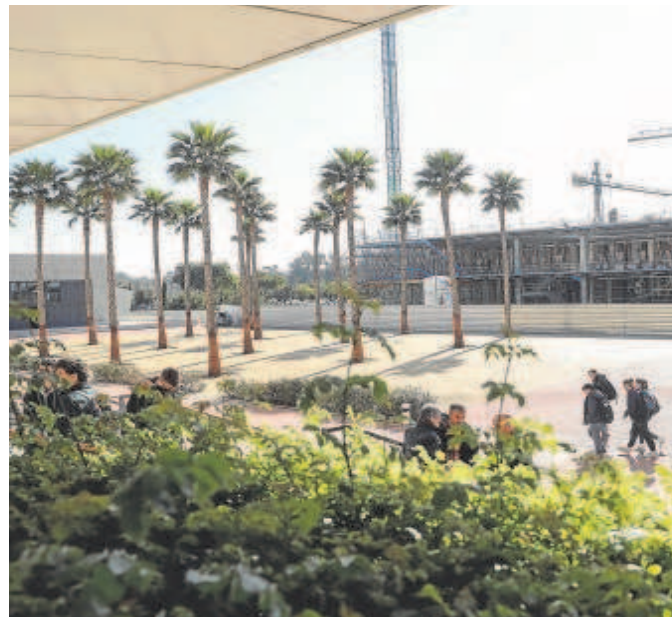
Imagen de archivo de la sede de la Universidad Loyola en Sevilla

«Efectivamente, nos ha llegado la resolución de la Comisión Permanente del Consejo de Universidades, en la que se estima la reclamación presentada por la Universidad Loyola Andalucía y se verifica positivamente el plan de estudios conducente al título oficial de graduado o gradua-