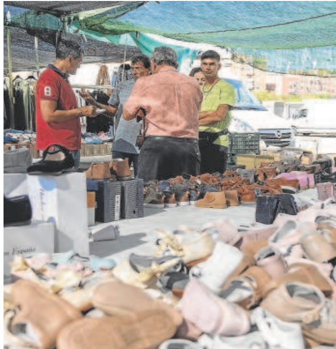
Uno de los puestos del mercadillo de Alcosa

Entre las nuevas funciones que tendrán estos controladores estará la de ser una especie de primera barrera disuasoria frente a la venta ilegal que, en muchos casos, también conlleva la