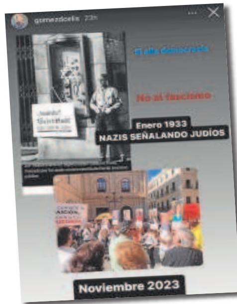
La publicación en Instagram

El socialista encuentra similitudes entre quienes portaron en sus pancartas los rostros de algunos diputados socialistas con el «boicot contra un negocio judeo-alemán, marcado por los nazis con una estrella de David» –según el pie de foto de la imagen utilizada por Gómez de Celis–. El vicepresidente del Congreso de los Diputados añade a su publicación que el Partido Popular estuvo «señalando diputados» durante la manifestación celebrada el pasado