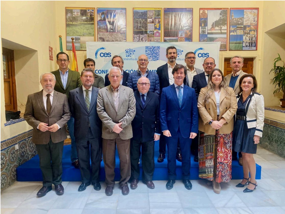
Rus con la directiva de la CES.