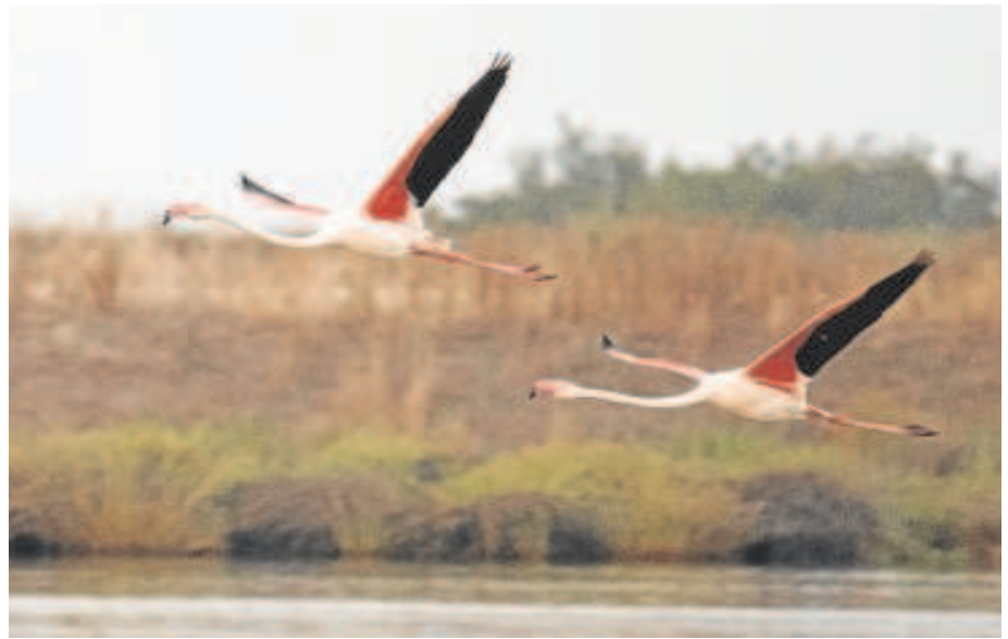
Flamencos elevan el vuelo para abandonar Doñana

Incluso sin la cita internacional, la fecha de la firma era complicada antes: había que pulir muchos detalles del acuerdo y, además, estas semanas están siendo de especial efervescencia política en España. Pero, una vez cerrada la fecha del Pleno de investidura en el Congreso de los diputados —que el PSOE confirmó ayer para mañana y pasado—, las cuentas son más sencillas.