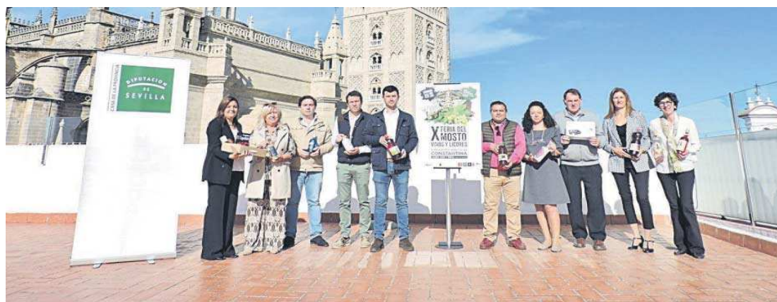
Acto de presentación en la Casa de la Provincia del certamen que tendrá lugar el próximo sábado 25 en Constantina.

La Asociación de Empresarios y Comerciantes de Constantina