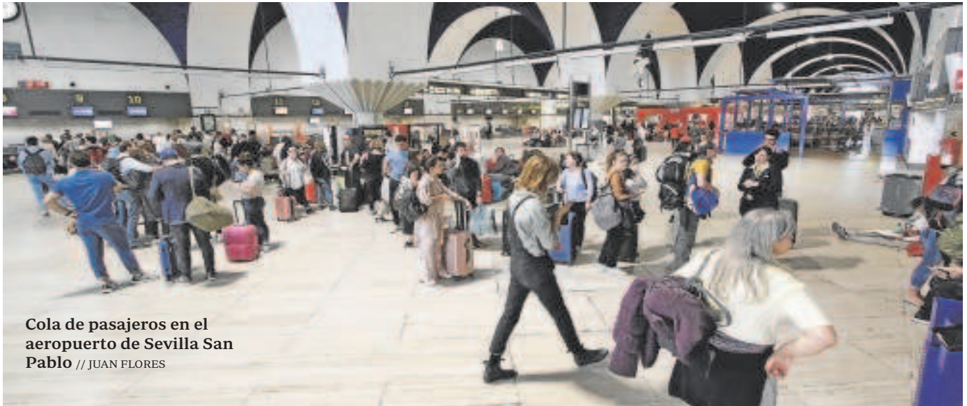
Cola de pasajeros en el aeropuerto de Sevilla San Pablo