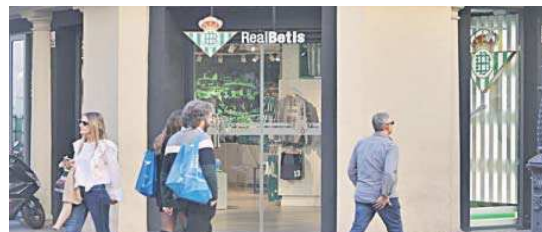
La tienda del Betis en la Avenida.

la avenida de la Constitución (frente a la Catedral de Sevilla), para disfrute tanto de béticos como de los miles de turistas que todos los años visitan la capital hispalense”.