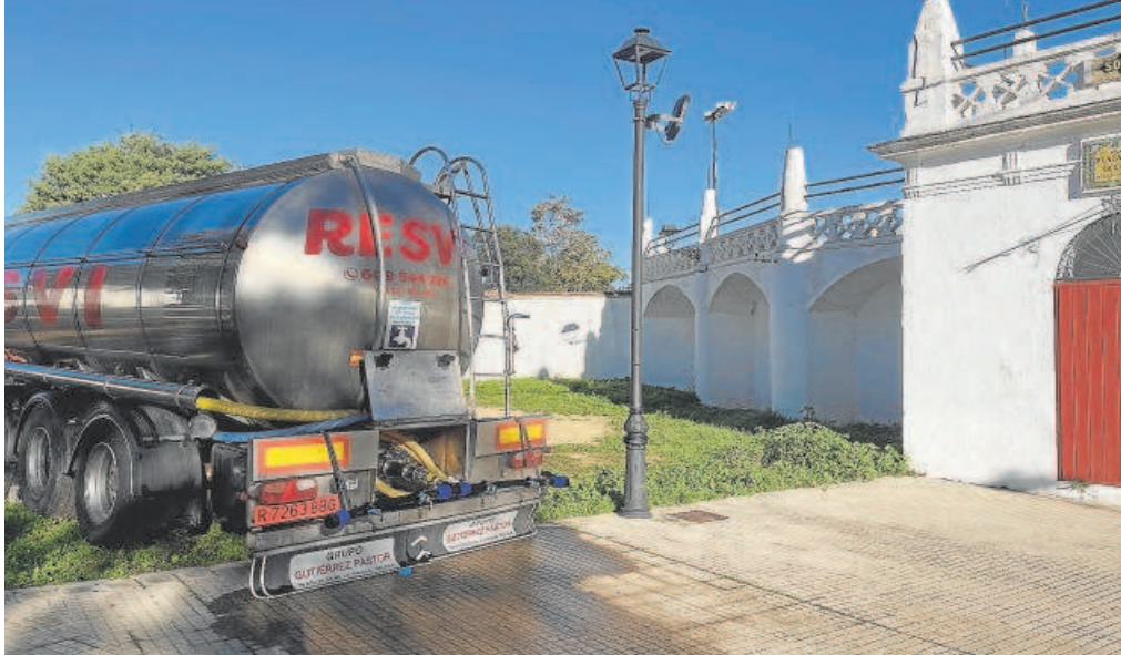
Camión cisterna aparcado junto a la plaza de toros de Cazalla de la Sierra

El aspecto del agua ha mejorado en los últimos días aunque todavía no se puede usar para consumo; los habitantes del pueblo llenan cacharros de las fuentes