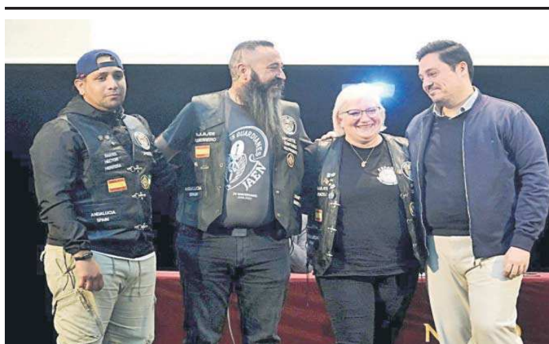
Los tres Barber Angels premiados llaman a los barberos de Sevilla a sumarse a los cortes solidarios.

El delegado asegura que este proyecto social contará con presupuesto de la Junta de Andalucía. “No llegarían a más de 20 usuarios con 25 profesiones trabajando en esta residencia de personas sin hogar que harán un trabajo integral con cada persona. Se trata de trabajar de forma individual con cada persona, intervenir para ver la problemática que tiene detrás, lo que ha vivido esa persona. Se trabajan también