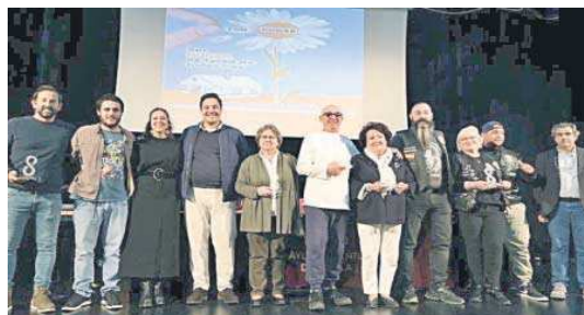
Foto de familia de todos los premiados por el sinhogarismo.