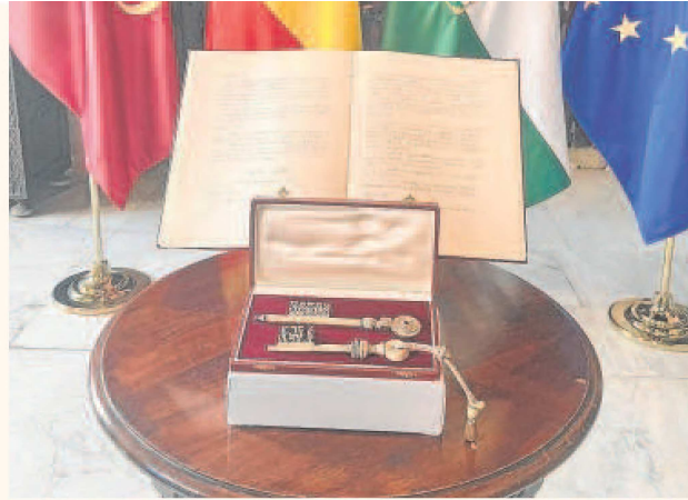
Los dos detalles que presidían las reuniones del presupuesto