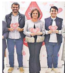
La presentación de la campaña.