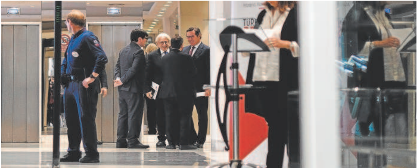
Al fondo, el presidente de la CEOE, Antonio Garamendi, junto a miembros del Comité Ejecutivo de la patronal