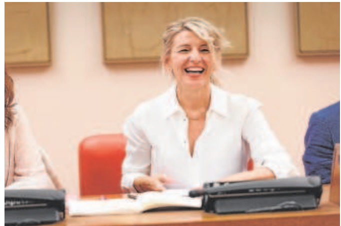
La vicepresidenta Yolanda Díaz

Los sindicatos también denuncian que las cuantías de las indemnizaciones por despidos sin causa no son «excesivas». Para un contrato temporal, la indemnización media está en 1.500 euros; para un parcial indefinido en 4.642 euros; para un fijo-discontinuo es de 4.493 euros, y un contrato indefinido, de 9.500 euros.