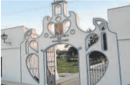
4 Cementerio de Santa Olalla del Cala, en Huelva