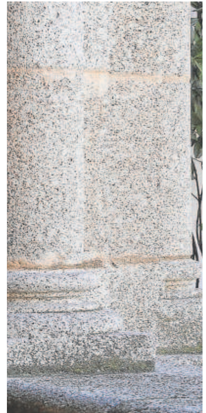
María Guardiola (PP), en la sede de la Junta de Extremadura durante la entrevista

—Por supuesto. Todos hemos visto a Vara en primera fila mientras Pedro Sánchez nos vendía la amnistía como la solución y la concordia para todos los españoles. Me parece una vergüenza que Fernández Vara, por cobrarse el precio que se ha cobrado, que es ser vicepresidente del Senado, haya vendido los intereses de todos los extremeños. Estoy convencida de que, cuando se presentó como candidato a la Junta, que-