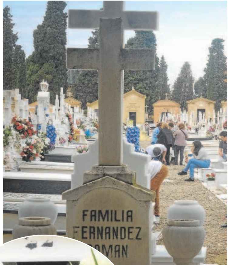
El cementerio se llenó ayer de

Seguramente por eso se veían muchos panteones abiertos, algunos los