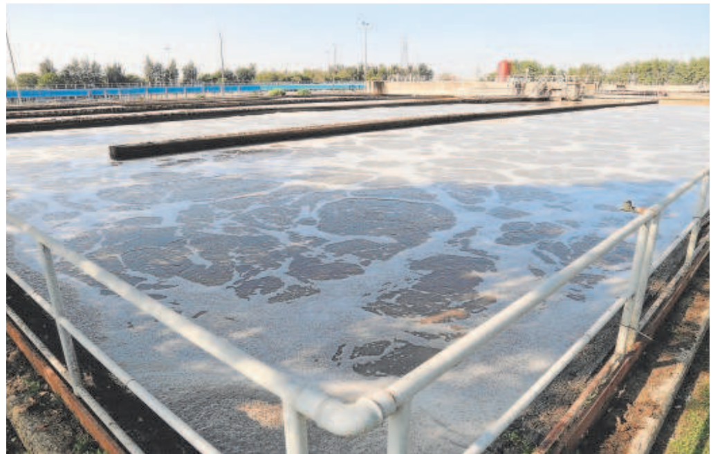
Estación depuradora de la empresa pública Emasesa de El Copero, en Sevilla

Este canon está regulado con una cuota fija de un euro al mes por recibo y una cuota variable en función del consumo. Así, se aplican 0,10 euros por metro cúbico en consumos inferiores a 10 metros cúbicos; 0,2 euros el metros cúbico en consumos hasta 18 metros cúbicos y 0,6 euros por metro cúbico en consumos superiores a 18 metros cúbicos. En los consumos no domésticos, el importe es de 0,25 euros por metro cúbico. En una familia media con cuatro personas esto implica, de acuerdo con los cálculos realizados por la Junta de Andalucía cuando se suprimió, en torno a 40 euros al año.