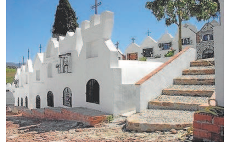
3 Cementerio de Casabermeja, en Málaga