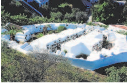
1 Recinto de Sayalonga, en la Axarquía de Málaga