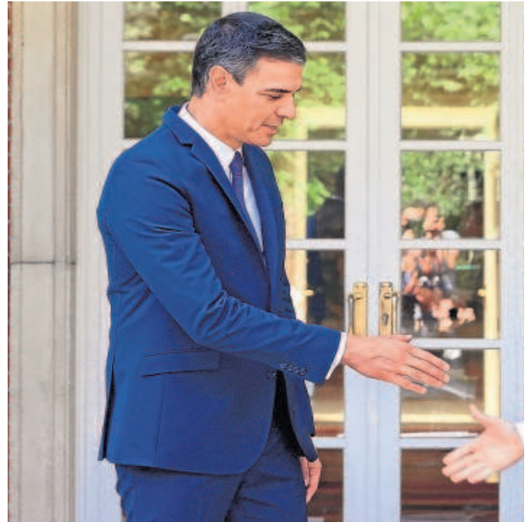
Sánchez y Aragonès, durante un encuentro en La Moncloa

A la espera del texto de la ley en sí y de la precisión de cómo se establezca el perímetro de a quién afecta en concreto -algo sobre lo que desde el primer momento de la negociación tuvieron discrepancias Moncloa y los independentistas, que siempre han tirado muy por alto sus peticiones- las palabras de Aragonès blasonando de haber logrado un acuerdo más allá de lo previsible cabe inscribirlas en la permanente pugna en el ámbito del separatismo entre ERC y Junts per Catalunya. Y sobre todo en una semana donde Puigdemont ha vuelto a tener un enorme protagonismo, singularmente a raíz de la fotografía con el número tres del PSOE, Santos Cerdán, el