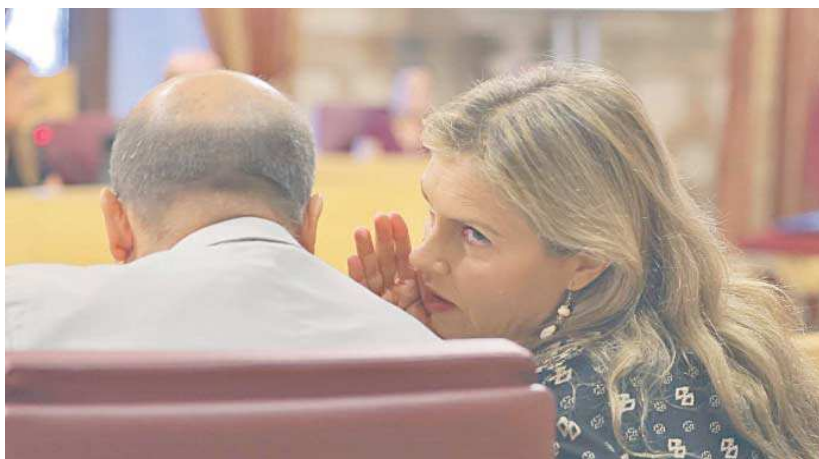
Peláez en una sesión plenaria reciente.

La portavoz de Vox destacó que “la mayoría de las tasas del cementerio municipal se van a duplicar o triplicar; casarse y formar una familia tendrá que pasar por