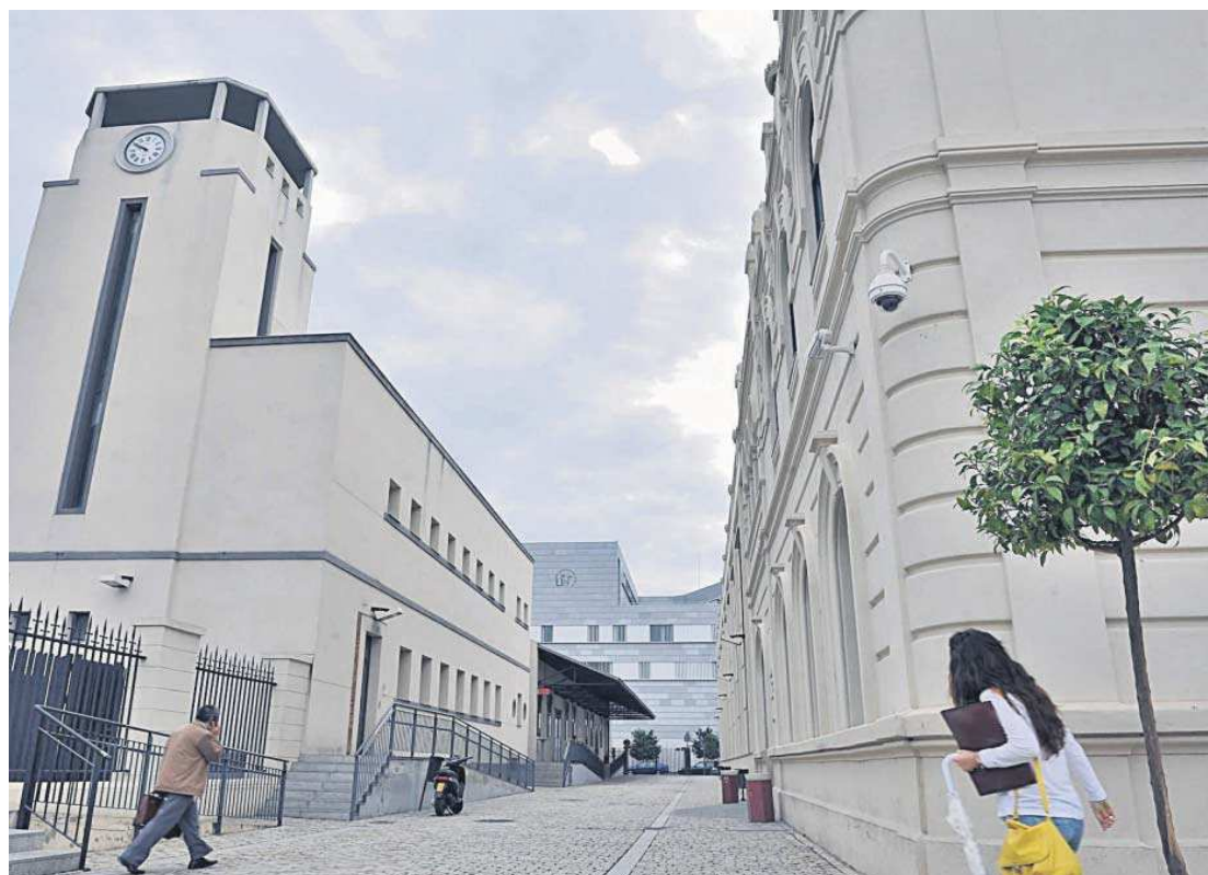
Facultad de Derecho de la Universidad de Sevilla.