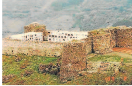
2 Cementerio del pueblo malagueño de Benadaliid