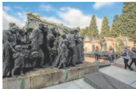
7 Cementerio de San Fernando, en Sevilla capital

El Cementerio de San Fernando abrió sus puertas al primer entierro el día 1 de enero de 1853. En las vías principales se encuentran las tumbas, mausoleos o monumentos funerarios de notable valor artístico, exponente del barroquismo, regionalismo y la espectacularidad que pueblan las