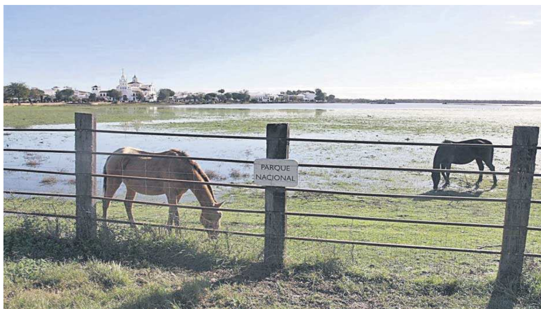
Imagen de las lagunas de las marismas de Doñana enfrente de la aldea almonteña de El Rocío tras las últimas lluvias.

Las conversaciones se llevan a cabo tanto en localidades de la provincia de Huelva, como en las sedes institucionales de ambas administraciones que intentan encajar en el texto del acuerdo los mecanismos que permitirán encontrar una salida a la situación de los terrenos afectados por la proposición de ley presentada por el PP en el Parlamento y que fue retirada en el último momento en un “gesto de buena voluntad” y después de la intervención directa del presidente de la Junta, Juanma Moreno.