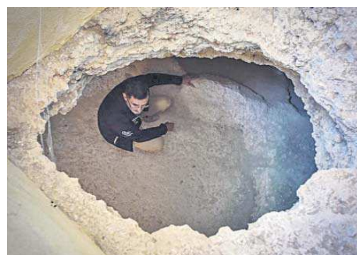
Escollo desde el que se comenzó a excavar la cueva.

cuevas de Antoniana I fueron de ambos sexos y también encontraron uno infantil. “Esta cuestión es llamativa, porque a las personas se las enterraron con su ajuar por su estatus, pero éste lo conseguían a lo largo de sus vidas. Un menor de edad apenas tenía estatus y solían enterrarse aparte”, señala Moncada. Por otro lado, también explica que “aunque en el caso de Antoniana I se ha perdido mucha información, los enterramientos del Calcolítico en el resto de la Península evidencian que se trató de una sociedad muy igualitaria”. “Los únicos enterramientos excepcionales, que han demostrado pertenecer a una clase social privilegiada son los de mujeres”, apostilla y pone de ejemplo Valencina y La Señora del Marfil .