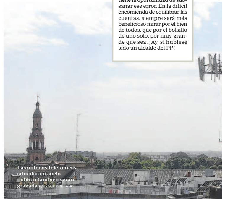
Las antenas telefónicas situadas en suelo público también serán gravadas.

Deshojando la margarita en 2017, el entonces alcalde, el socialista Juan Espadas, decidió que sí subiría los impuestos a los sevillanos y no recaudaría las tasas a las compañías telefónicas. Hoy, el PSOE tiene la oportunidad de subsanar ese error. En la difícil encomienda de equilibrar las cuentas, siempre será más beneficioso mirar por el bien de todos, que por el bolsillo de uno solo, por muy grande que sea. ¡Ay, si hubiese sido un alcalde del PP!