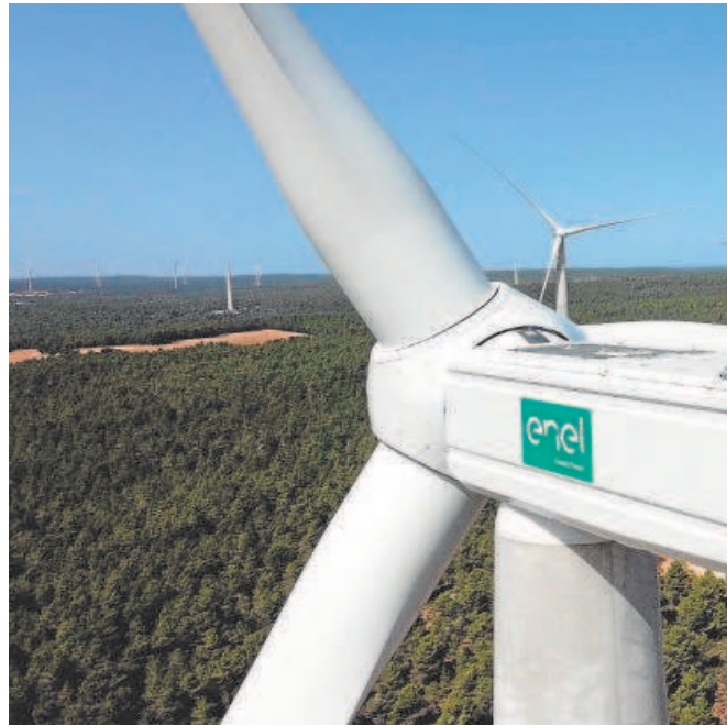
Parque eólico de Endesa

«En este caso decimos que es discriminatorio para las eléctricas españolas, ya que disminuye nuestra capacidad de inversión respecto a otros actores europeos. Tenemos una