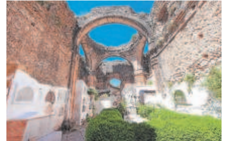
6 Cementerio de Villaluenga del Rosario, en Cádiz

cementerios en 50 ciudades de 20 países que pretenden mostrar estos espacios como grandes museos al aire libre. Lo mayor singularidad de este pequeño cementerio radica en albergar en el subsuelo el conjunto monumental de las Cisternas Romanas, una construcción hidráulica de finales del siglo I d.C., siendo las más grandes conservadas en España. El cementerio, situado junto a la parroquia de San Mateo, ocupa lo que sería la plaza del foro de la ciudad romana existente en Monturque. Responde a la arquitectura popular, con nichos encajados en torno a un patio central. Destaca, por su magnitud, la Gran Cisterna que se encuentra bajo el cementerio del pueblo. Esta cisterna fue descubierta casualmente en 1885 con motivo de unas obras de ampliación de pequeño cementerio que existía junto a la Parroquia de San Mateo.