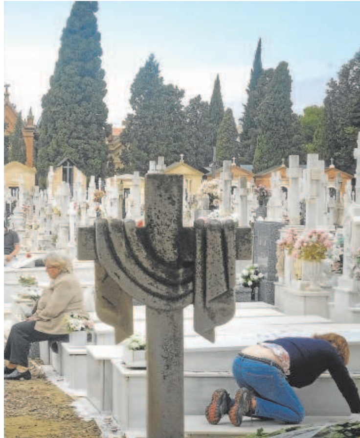
público // FOTOS: RAÚL DOBLADO