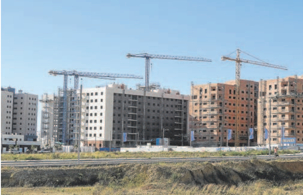
Un bloque de viviendas en una imagen de archivo