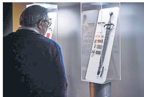
Un visitante contempla la muestra de la Colección Museográfica de Gilena.