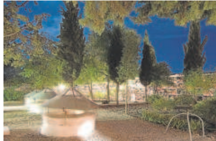
5 Cementerio de Monturque, en Córdoba