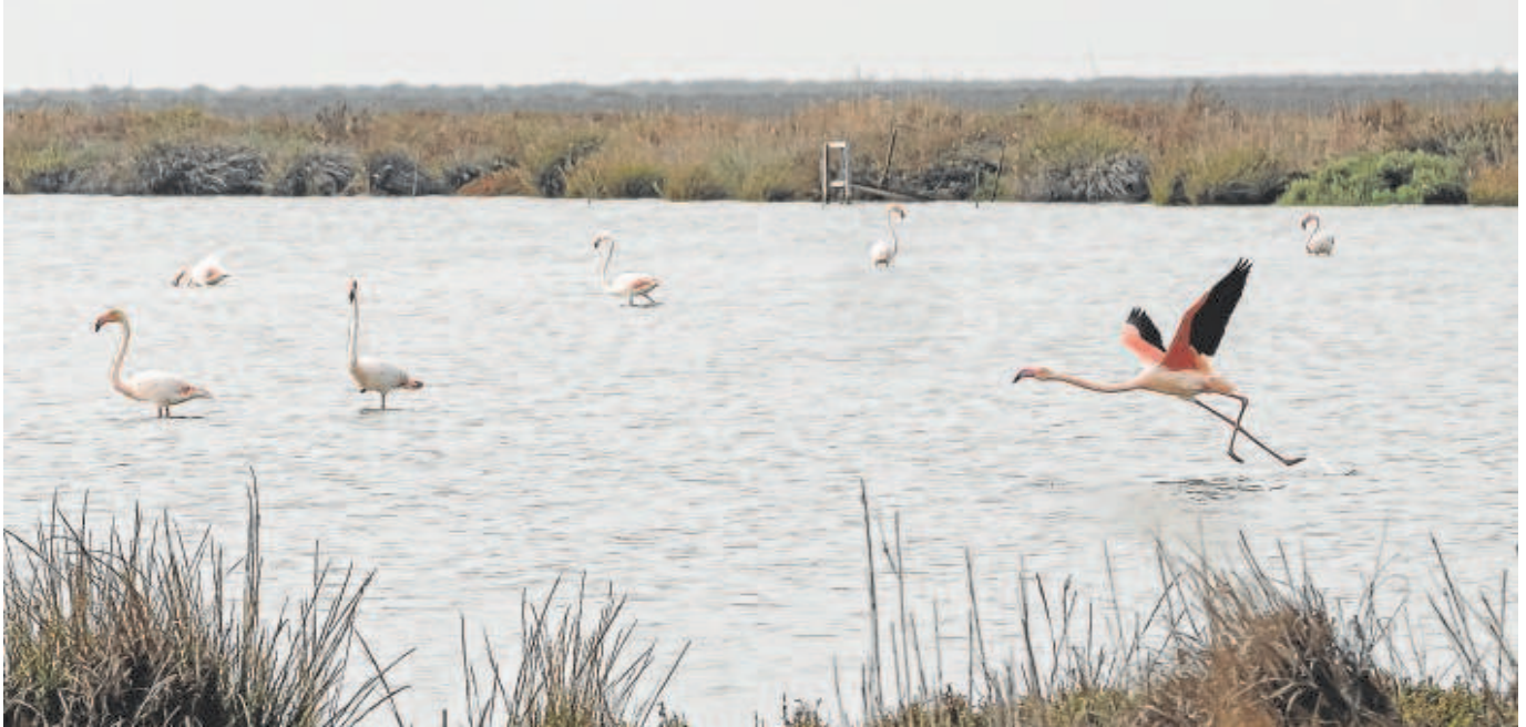
Flamencos en una de las lagunas del parque de Doñana