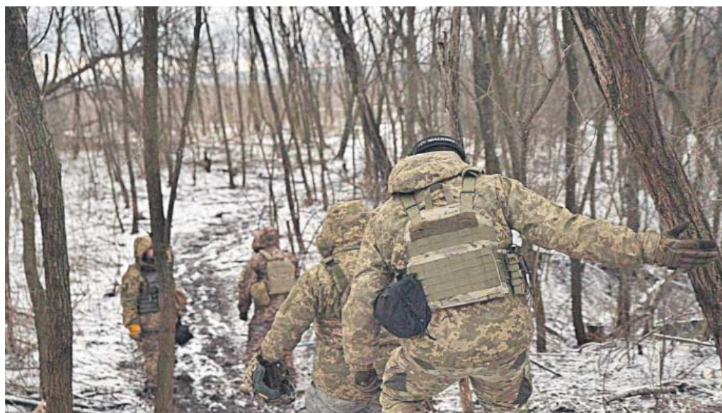
Militares ucranianos regresan a sus posiciones tras completar una misión en Jarkov.