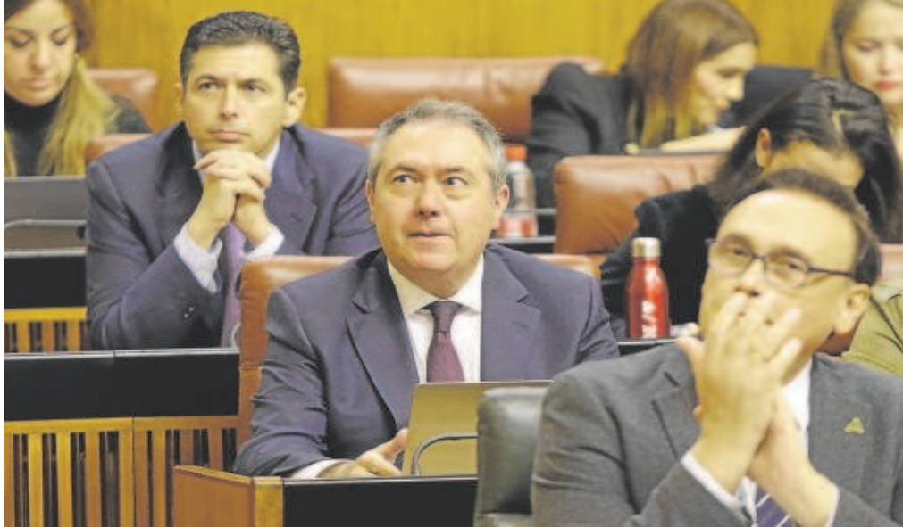
El presidente del Grupo Socialista, Juan Espadas, durante el debate en el Parlamento