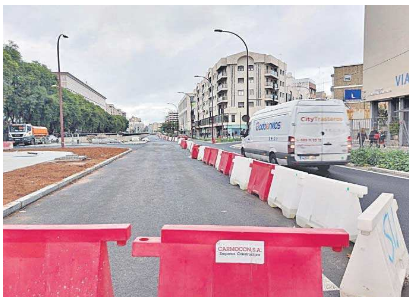
San Francisco Javier tiene hoy acceso por este carril hasta la calle Aznalcázar, antes de Eduardo Dato.

De las avenidas por las que discurre el tranvía, solo Ramón y Cajal está plenamente operativa. Tras el verano se abrió a la circulación Ramón y Cajal con importantes limitaciones para el tráfico privado, ya que este solo puede discurrir por el carril en dirección al centro de la ciudad en el tramo del túnel. Los coches que quieran circular en dirección contraria deben hacerlo por la calle Aviación Cuatro Vientos. El