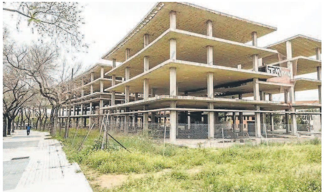
Edificio 'El Esqueleto' en Sevilla Este, abandonado desde hace 15 años

El edificio de 'El Esqueleto' de Sevilla Este es la última operación pero todavía quedan otras como el canal de la Expo de 1992 en la Isla de la Cartuja que también se ha ofertado en anteriores subastas y que todavía no ha sido adjudicado a pesar de la bajada del precio original que tuvo en la primera subasta.