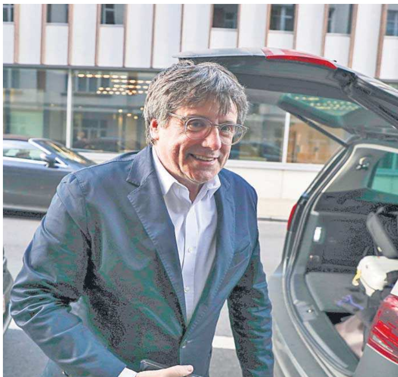
Carles Puigdemont, en una imagen reciente en Bruselas.