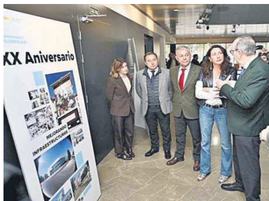
El comisionado enseña la exposición a las autoridades.

que es “muy difícil convencer a una parte de la sociedad, de gente joven sobre todo, de que el camino fácil de la droga no se puede elegir, sino de que hay que elegir el camino de esfuerzo y formación” que las administraciones y distintos colectivos ofrecen. Para luchar contra el narcotráfico hay que hacer, según el comisionado, “un esfuerzo comparti-