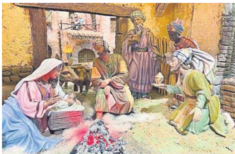
Belén de la Fundación MAS.