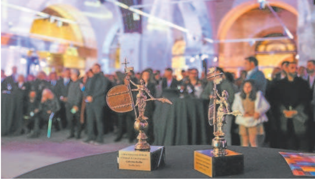
Gala de inauguración del Festival de Cine de Sevilla con un primer plano de los Giraltillos de oro