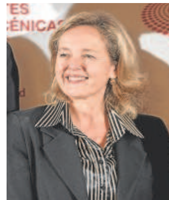
Nadia Calviño

nores de 45 años sin cargas familiares que hasta ahora carecían de protección.