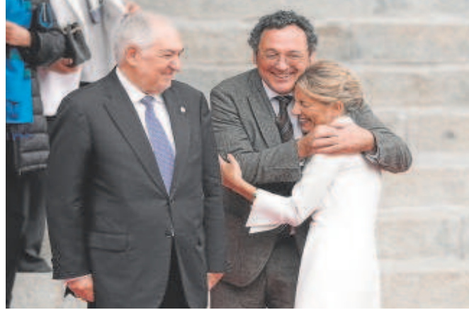
Conde-Pumpido, presidente del TC, García Ortiz y Yolanda Díaz, ayer