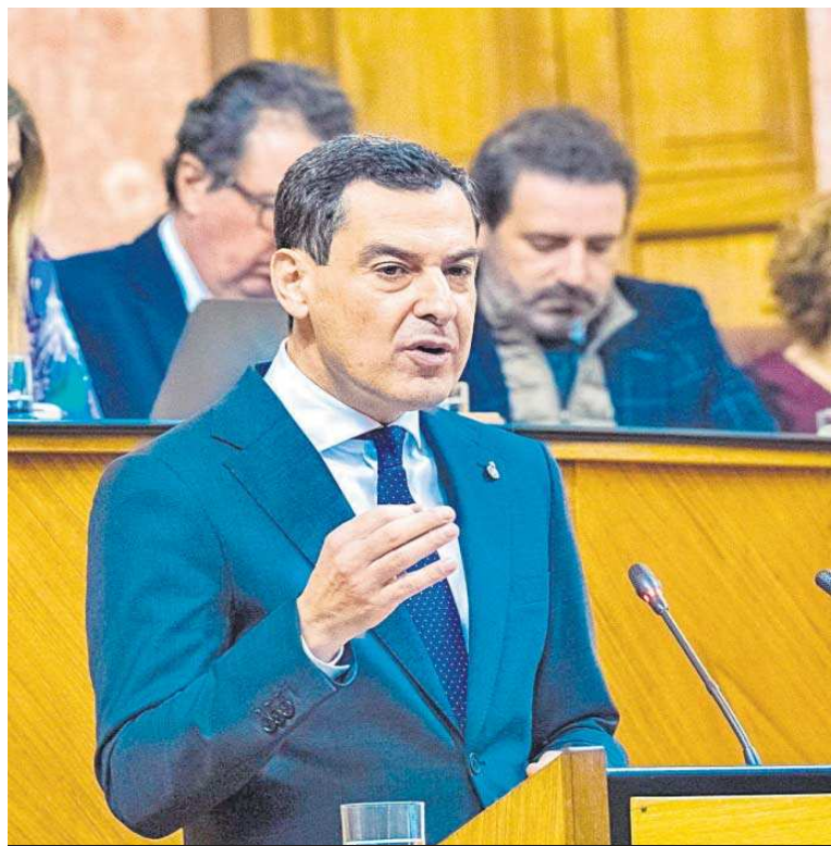
El presidente de la Junta de Andalucía durante su discurso ante el Pleno del Parlamento.

en las manifestaciones que contra la amnistía se celebraron en varias ciudades de Andalucía. El presidente de la Junta defendió que los acuerdos con Junts y ERC quiebran “los principios de igualdad y solidaridad” entre los españoles, lo que le sirve para enlazar esta actualidad con el año 1977. “¿Quién nos iba a decir –se preguntó– que 46 años después de las manifestaciones del 4 de diciembre íbamos a tener la necesidad de alzar de nuevo la voz para decir algo tan sensato como que