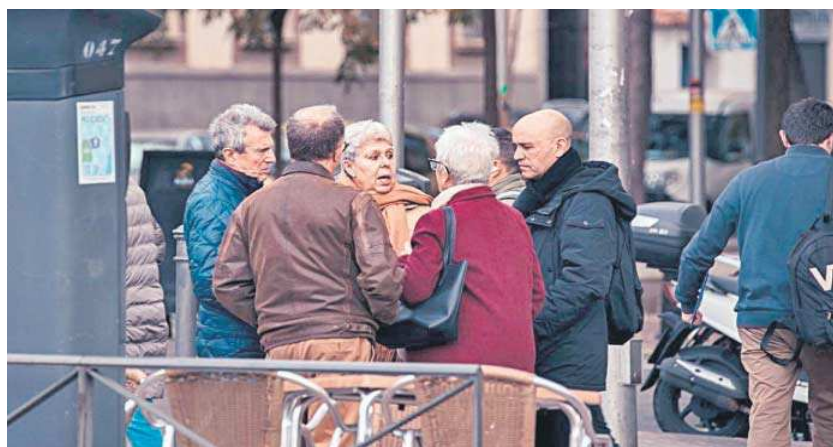
Varias personas conversan en grupo en Madrid.

El dato de inflación publicado ayer por el INE se corresponde con el índice adelantando, que deberá ser confirmado con por el índice general que se publicará el 14 de diciembre. Esta-