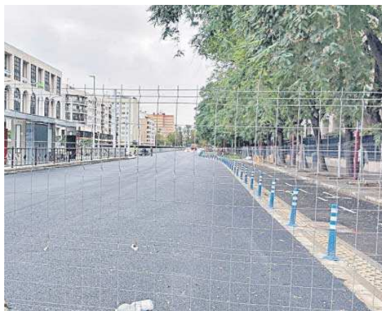
La calzada y el carril bici están asfaltados.

transporte público (taxis, autobuses y emergencias) sí cuenta con un carril en cada sentido por Ramón y Cajal.