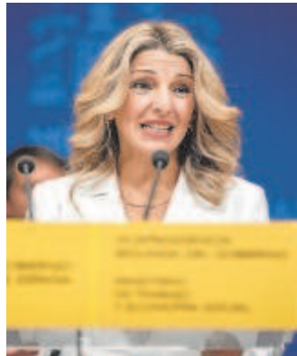
Yolanda Díaz

«La reforma que plantea el Ministerio de Trabajo va en dirección contraria de quienes plantean recortes», señalan las fuentes consultadas a cerca del planteamiento que Economía deslizó públicamente a través del secretario de Estado Gonzalo García Andrés. Así, la reformulación de las condiciones de acceso a la prestación permitirá simplificar el acceso eliminando el mes de espera y compatibilizando la ayuda con la incorporación al trabajo durante el primer mes. También ampliará la cobertura a colectivos como el de me-