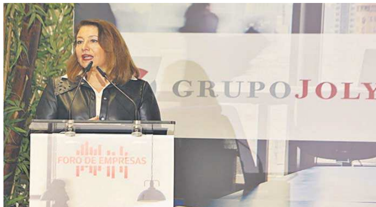
Carmen Crespo, consejera de Agricultura, Pesca, Agua y Desarrollo Rural, durante su intervención en el acto.

Crespo enfatizó que "esa agricultura del futuro" se está haciendo ya en Andalucía e instó a extenderla para que sea la forma en la que todas las explotaciones responda al reto de dotar a toda Europa de alimentos de calidad, más sostenibles y saludables. Es uno de los mensajes que la consejera reitera, que la alimentación con esos parámetros da una