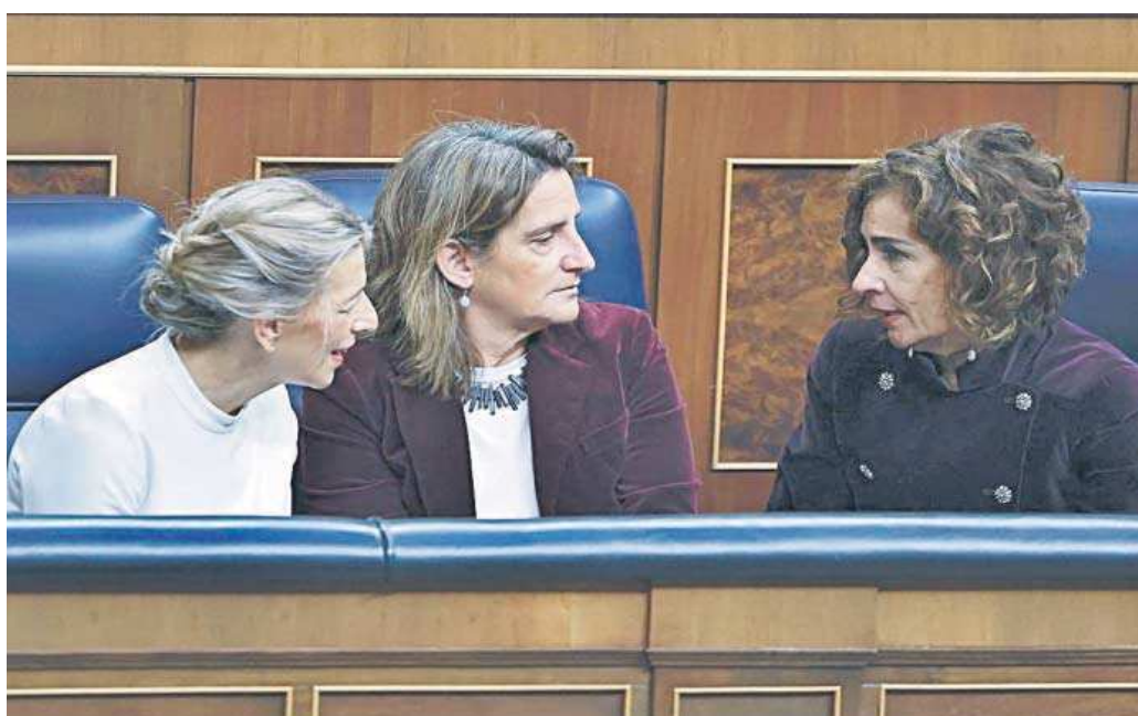
Las vicepresidentas Yolanda Díaz, Teresa Ribera y María Jesús Montero, ayer en el Congreso.