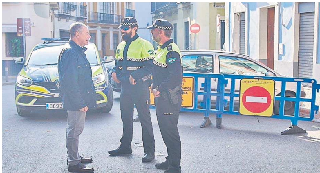
El alcalde de Sevilla, José Luis Sanz, conversa con dos agentes de la Policía Local.