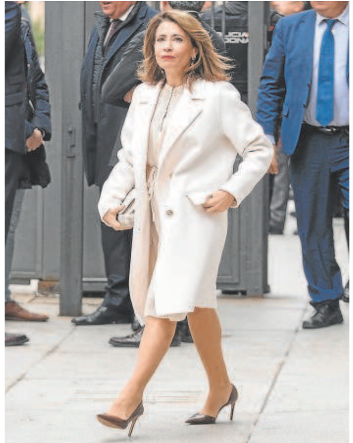
Raquel Sánchez, ministra de Transportes y Agenda Urbana

El porcentaje del préstamo que avalaría el Estado alcanzaría hasta un 25% (al máximo se llegaría con una vivienda eficiente energéticamente) del crédito. Estas garantías públicas se diseñarían para que aquellos jóvenes y familias que ahora no pueden acceder a una hipoteca porque no tienen aho-