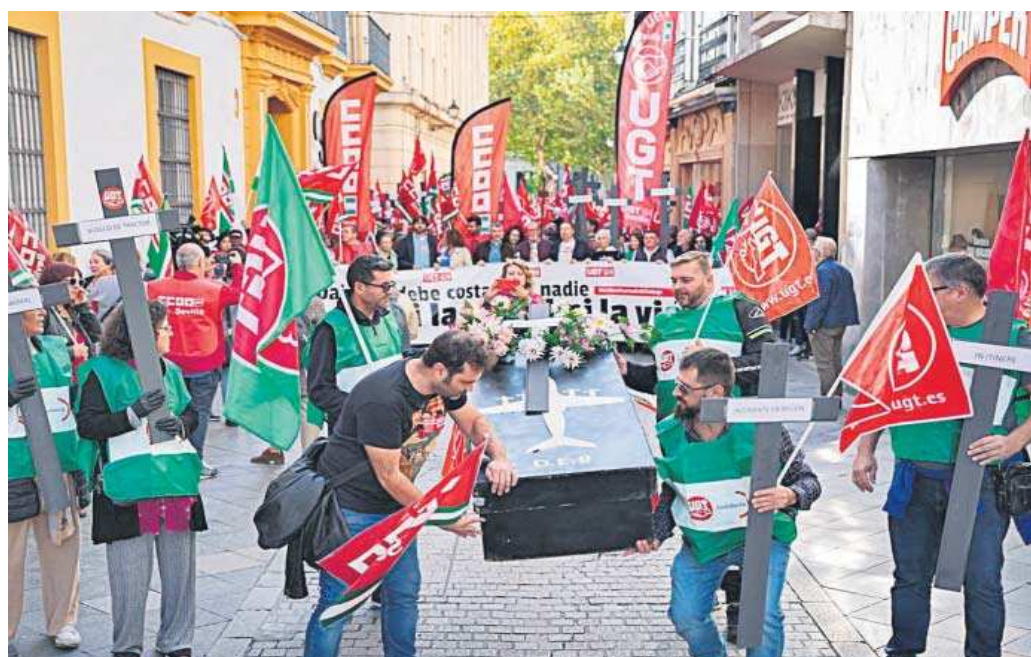
Cabecera de la marcha contra la siniestralidad laboral convocada ayer en Sevilla por UGT y CCOO.

Según los sindicatos, cada cinco minutos hay un accidente laboral en Andalucía pero el más relevante es que “cada tres días” muere un trabajador en la comunidad autó-