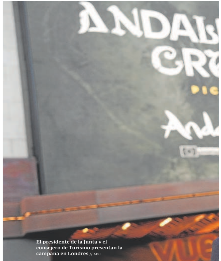
El presidente de la Junta y el consejero de Turismo presentan la campaña en Londres

La campaña de turismo Andalusian Crush se ha presentado en Leicester Square en Londres, en el marco de las actividades complementarias a la World Travel Market. El presidente andaluz, Juanma Moreno, incidió en que el objetivo es incrementar el posicionamiento en los mercados internacionales, especialmente el británico y los de larga distancia como Estados Unidos o Asia. Por este motivo, Juanma Moreno anunció que la campaña tendrá acciones de presentación también en Tokyo y en Nueva York. Según la Junta de Andalucía se «están superando todas las expectativas» y el video supera ya los dos millones de visualizaciones en redes sociales en tan solo 24 horas desde su lanzamiento.