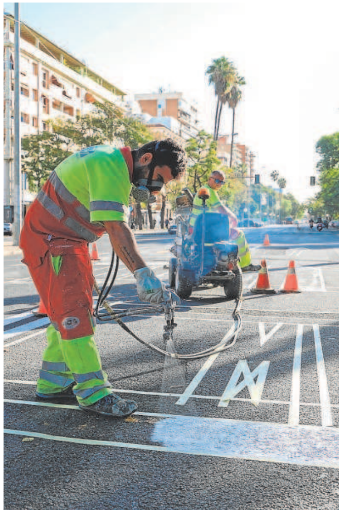
Operarios trabajando sobre la avenida de Eduardo Dato

Los operarios estuvieron pintando la señalización ayer desde primera hora de la mañana y durante todo el día