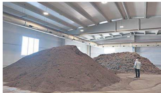
Residuos no peligrosos.