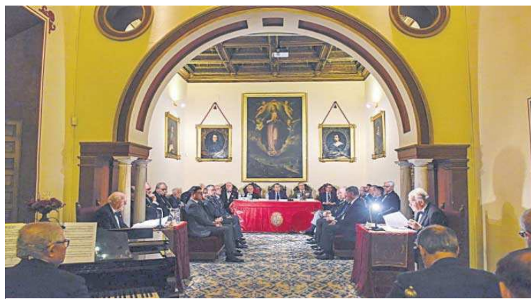
El acto celebrado en la sede de la Academia de Bellas Artes.

Para no superar la barrera de los 1,5 grados Bogas señaló que se debe alcanzar el 50% de electrificación de la economía a nivel global en 2050. Actualmente Europa está en el 22% y España, un poco mejor: en el 24%. Tras detallar las grandes cifras que permitirían alcanzar esa cota del 50%, el consejero delegado de Endesa desgranó las condiciones permi-