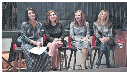
La consejera de Empleo entre la presidenta y la directora de la Fundación.

● Más de 200 alumnos se han formado en hostelería desde que comenzó el programa de la Fundación Cruzcampo, que tiene una empleabilidad total del 95%