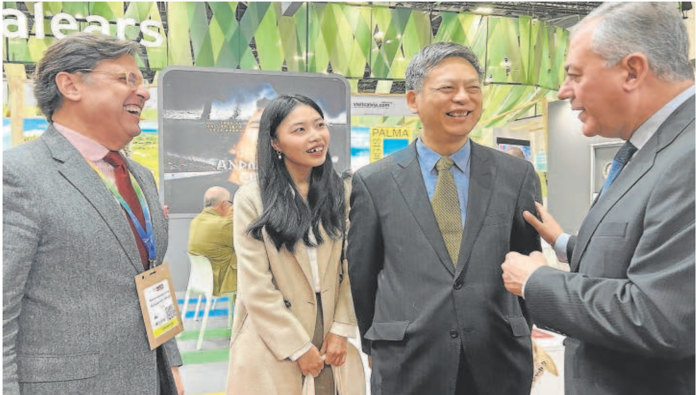
El alcalde de Sevilla, José Luis Sanz, durante su visita, ayer, a la World Travel Market de Londres