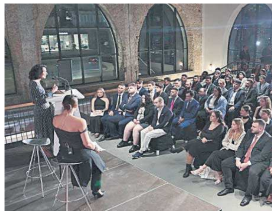
El acto de graduación se ha celebrado en la Factoría.

● Más de 200 alumnos se han formado en hostelería desde que comenzó el programa de la Fundación Cruzcampo, que tiene una empleabilidad total del 95%