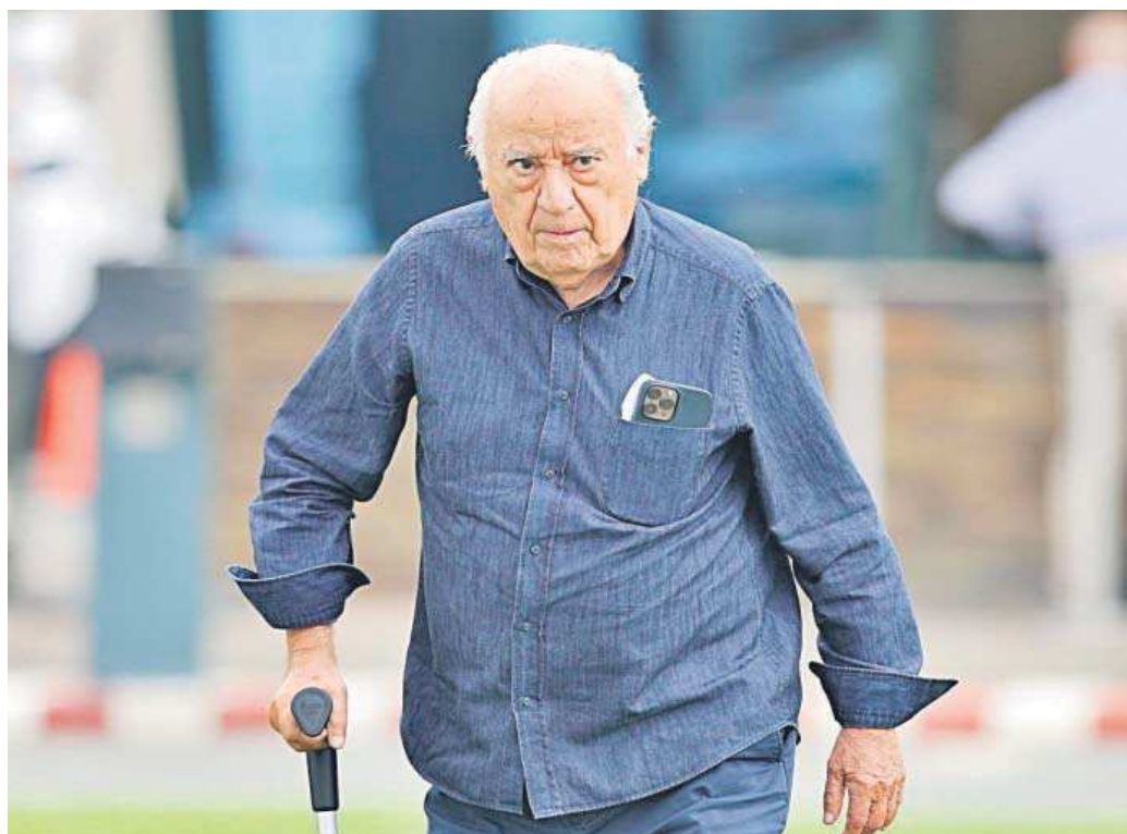
Amancio Ortega, presidente de Inditex, en una imagen reciente.

La fortuna de Amancio Ortega, que lidera la lista desde 2014, es más del doble que la suma del resto de fortunas que componen el top 10; su hija Sandra, única mujer entre los cinco primeros,