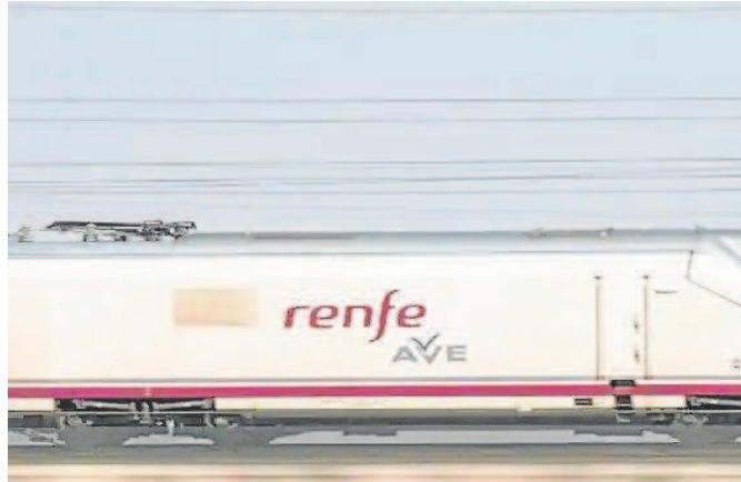
Eco Rail ya intentó entrar en la alta velocidad en 2019