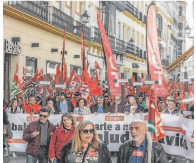
Protesta sindical contra la siniestralidad en Sevilla

La Consejería de Empleo, por su parte, ha convocado el 13 de noviembre a los sindicatos en el Consejo Andaluz de Prevención de Riesgos Laborales para evaluar las medidas implemen-