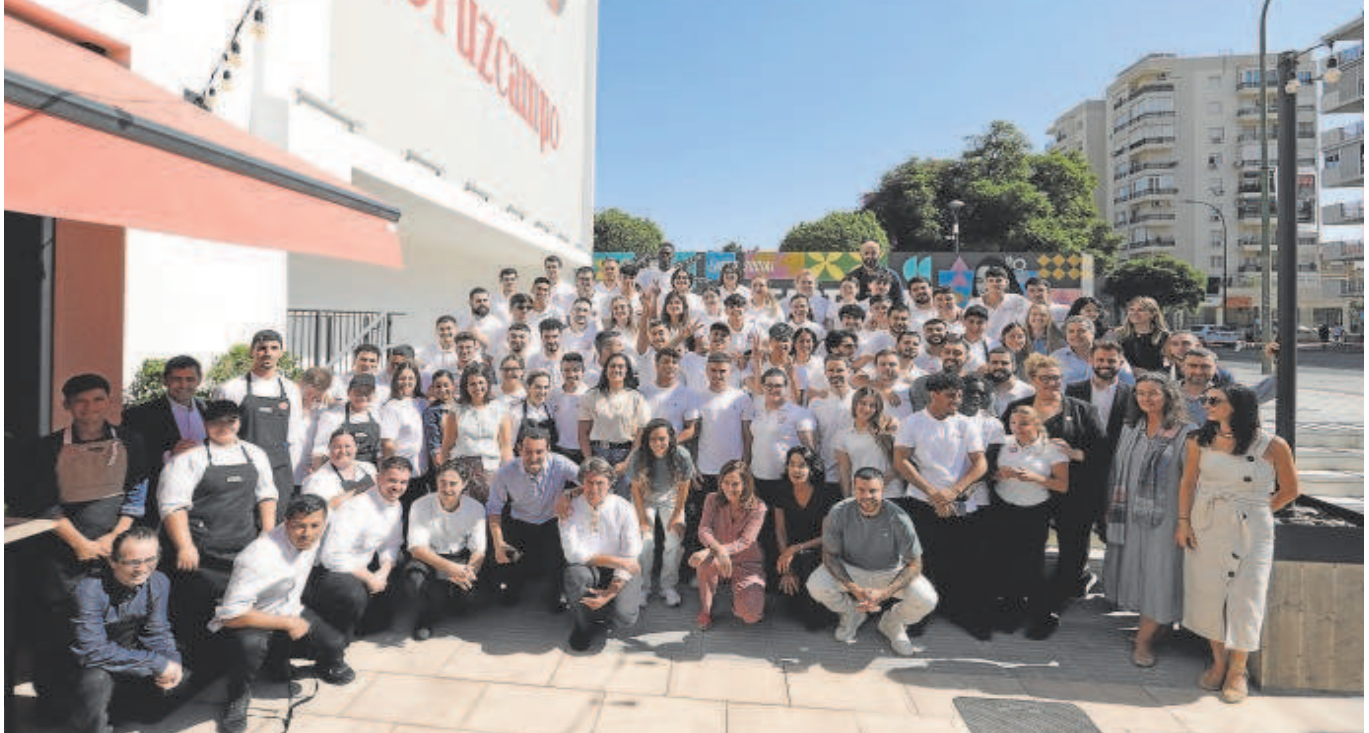
Foto de familia de los protagonistas de la velada