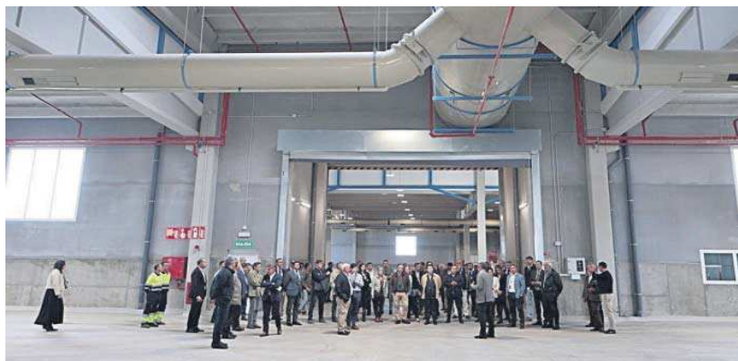
Interior del complejo ambiental Copero, ayer.