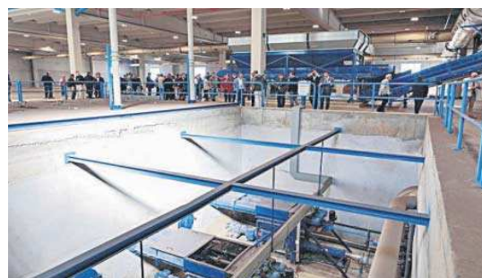
Otra vista del interior del complejo.