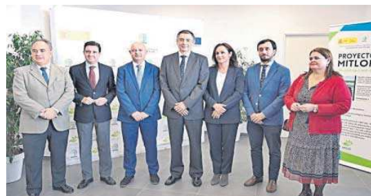
Autoridades de Emasesa, Junta y ayuntamientos en la inauguración.