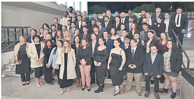
Los alumnos de la tercera promoción del programa Talento de la Fundación Cruzcampo.