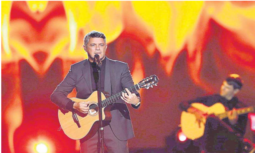
El cantante Alejandro Sanz durante una actuación de los Grammy Latinos en Las Vegas.

—Los intérpretes son libres de buscar las fórmulas que engrandezcan su expresión artística de la mejor manera. Nuestros eventos musicales siempre tratan de preservar su forma más pura. Intentamos evitar el autotune o el autoplay . Por eso hacemos sesiones en las que no hay pirotecnia. Es música. Somos la Academia Latina de Grabación y honramos la música. Esto no significa que saticemos o castigemos el uso de herramientas como el autotune .