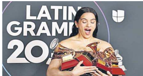
Rosalía durante la última edición de los premios.

“La música es una expresión cultural y artística que no debe ser censurada, porque va con los tiempos”