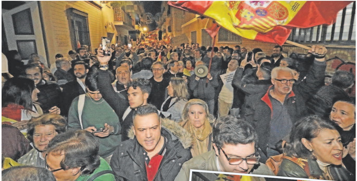
Arriba, los manifestantes en Sevilla ante la sede del PSOE Andalucía y detalle de una pancarta contra Pedro Sánchez

Distribuido para CONFEDERACIÓN DE EMPRESARIOS DE SEVILLA * Este artículo no puede distribuirse sin el consentimiento expreso del dueño de los derechos de autor.