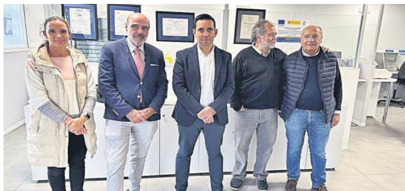
El diputado y su equipo visitan con el responsable de ANCCE el laboratorio de genética molecular de la Asociación.

La ANCCE es la asociación oficialmente reconocida para la gestión del Libro Genealógico del caballo PRE (LG PRE) y para el desarrollo del Programa de Mejora de la raza. Se considera "ejemplar de Pura Raza Española" a todo aquel inscrito en el Libro Genealógico del PRE gestionado por la ANCCE, con el fin de poder participar en el Programa de Mejora.