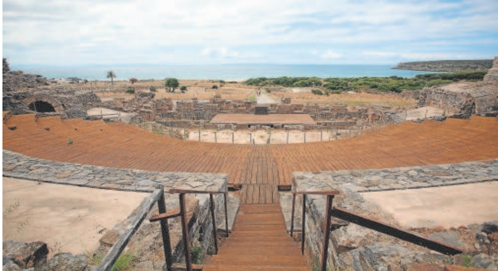
Imagen tomada en el yacimiento romano de Baelo Claudia // SERGIO RODRÍGUEZ