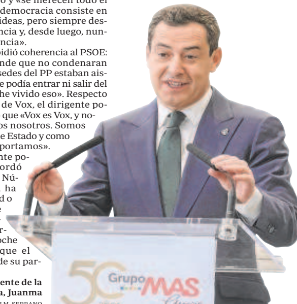
El presidente de la Junta, Juanma Moreno