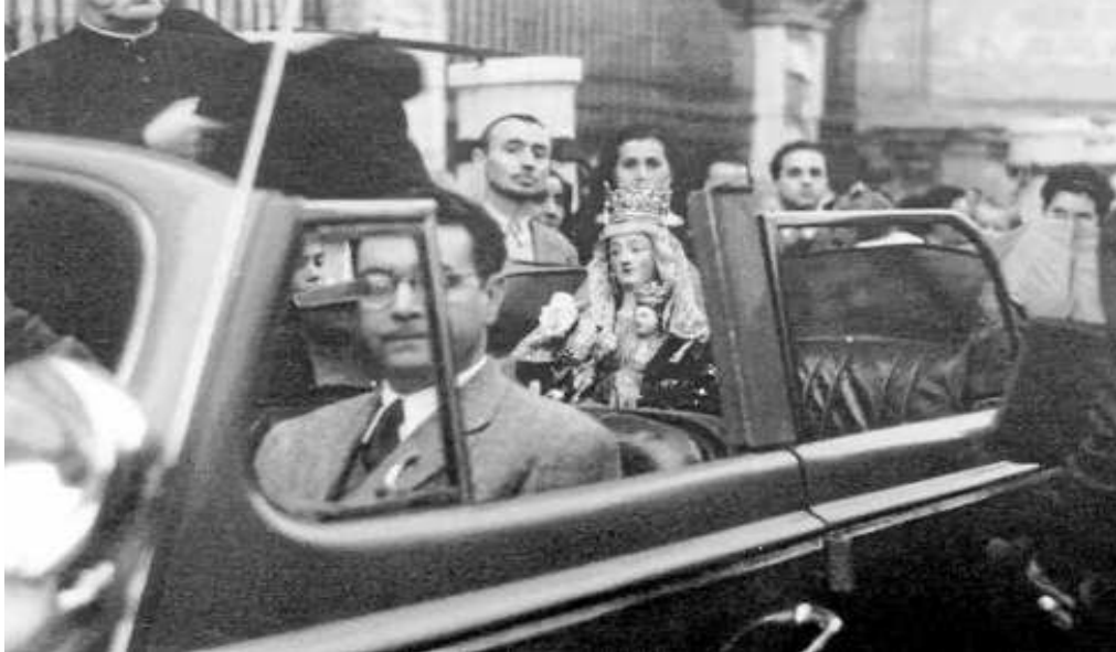
La Virgen de Valme en el coche que la trajo en 1948 para celebrar los 700 años de la Reconquista de Sevilla