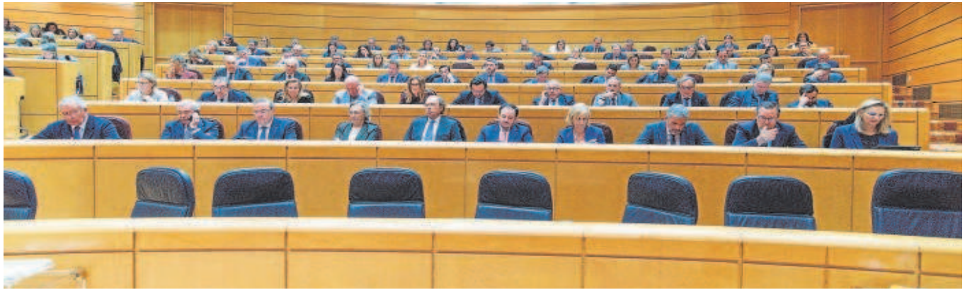
La bancada del PP en el Senado, durante el pleno de ayer, en el que se debatió la toma en consideración de la reforma del Reglamento