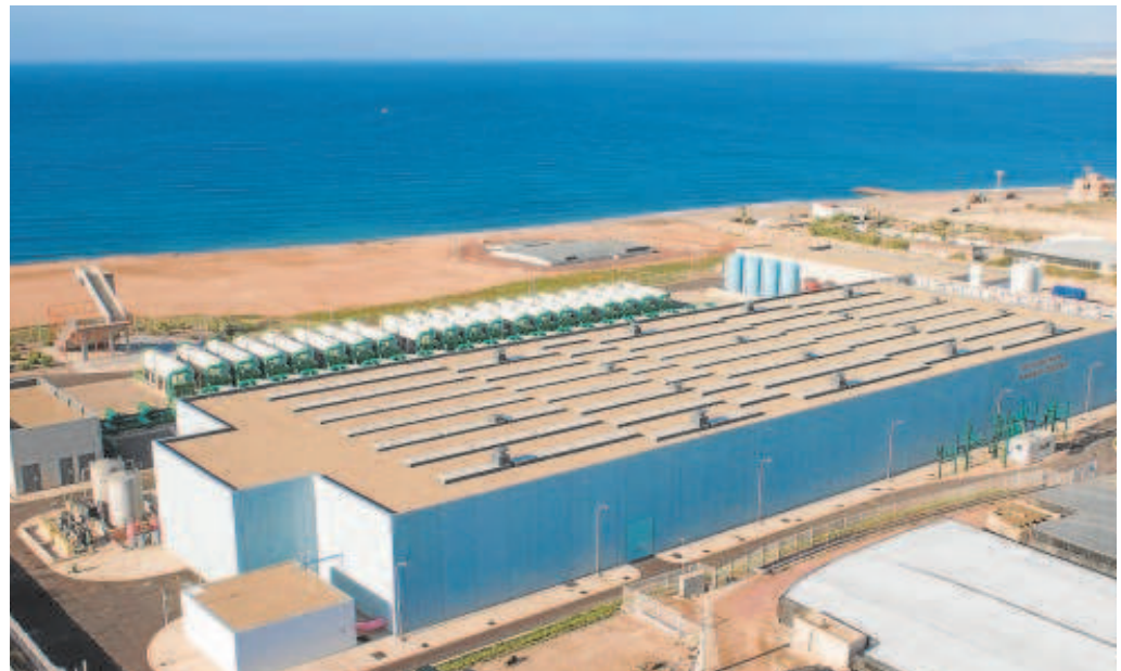
Planta desaladora en El Ejido, Almería

Asimismo, los grupos debatirán hoy sobre la aplicación del canon del agua, una figura suprimida de forma provisional por el Gobierno andaluz y que se recupera en 2024 y que generará unos ingresos de 140 millones de euros anuales que se destinarán a inversiones en infraestructuras hidráulicas. Esta recuperación no estaba prevista en el informe inicial y sí figura en los documentos incorporados por el Grupo Socialista. Al debate suma además el PSOE como propuestas la puesta en marcha de un Observatorio Andaluz del Agua; un plan de clausura de pozos y extracciones, una estrategia de homogeneización e los costes del agua poniendo fin a los desequilibrios o crear una facturación del agua para uso agrícola por consumo en lugar de por superficie.