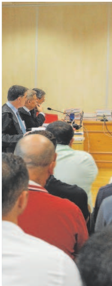
// R. DOBLADO