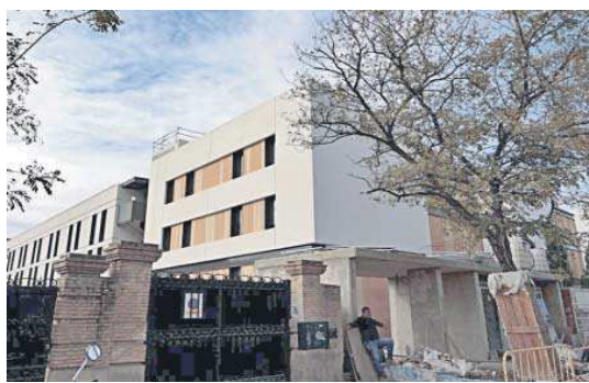
La residencia de estudiantes de Palmera 38.

La finca a segregarse es un solar "de forma sensiblemente trapezoidal sito en la Avenida Cardenal Bueno Monreal 54, con una superficie de 553 metros cuadrados. Linda al norte con la actual finca número 4 sita en Avenida de la Palmera; al sur, con la citada Ave-