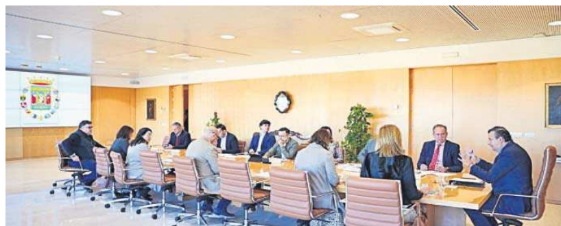
Sesión de la Junta de Gobierno celebrada este martes en la Diputación de Sevilla.

“Este impulso a la transformación digital que pretendemos para nuestros pueblos y ELAs, lo estamos apoyando con una inversión de 2,5 millones. Una colaboración