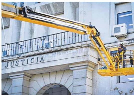
Sobre la palabra “Justicia” se ve lo que se desprendió de la base del balcón.

La inspección es tan minuciosa que las placas que revisten la fachada se examinan una a una. “La mayoría están fijadas con tirafondos”, señala el analista. Es decir, tornillos que refuerzan la