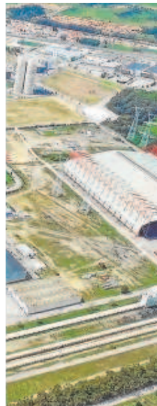
Arriba, parcela del Puerto de Sevilla donde Alener Solar instalará una planta de hidrógeno, en la que invertirá 26,4 millones de euros, de los que 9,5 estarán subvencionados por la UE, según la última resolución del Ministerio de Transición Ecológica. A la izquierda, Energía de Portugal (EDP) construirá una planta de hidrógeno en la antigua térmica de Viesgo (filial del grupo) en Los Barrios, en la provincia de Cádiz