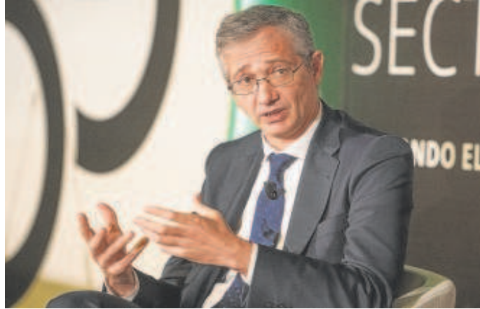
Pablo Hernández de Cos, gobernador del Banco de España

Pablo Hernández de Cos Gobernador del Banco de España