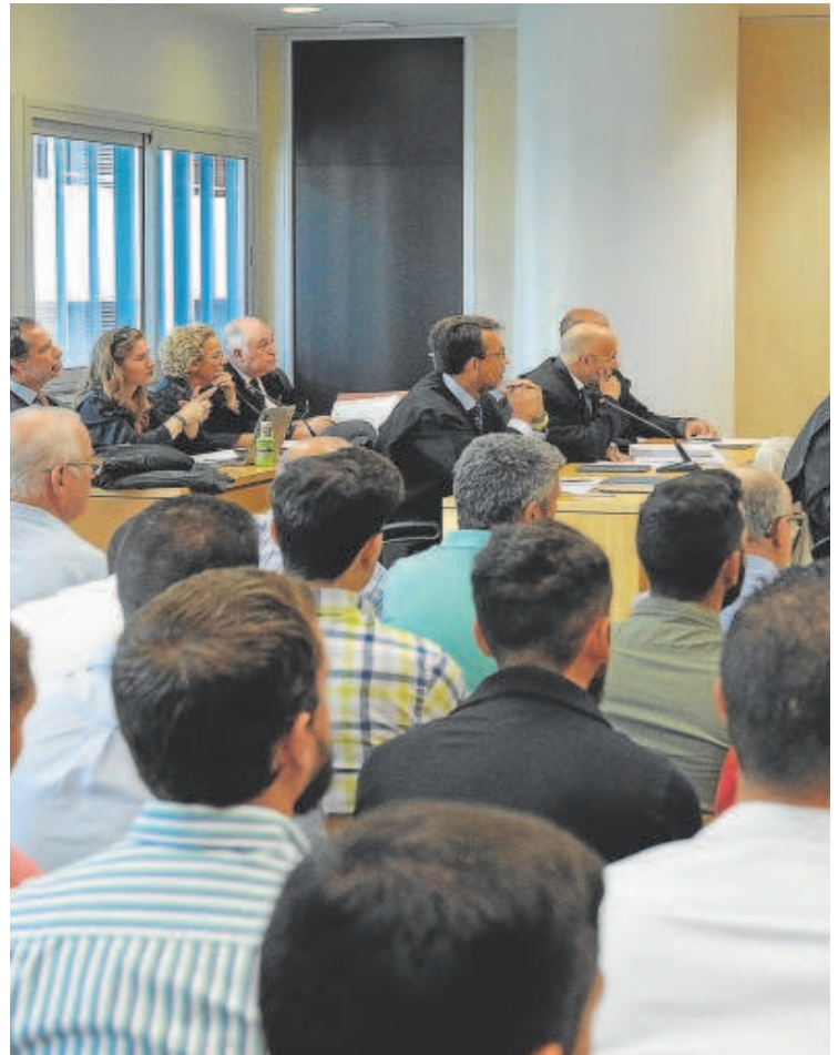
Juicio penal contra los agentes beneficiados por el amaño en el que salieron absueltos

Según las fuentes del caso, la decisión del TSJA sobre la ejecución de la sentencia podría llegar en primavera, como muy pronto