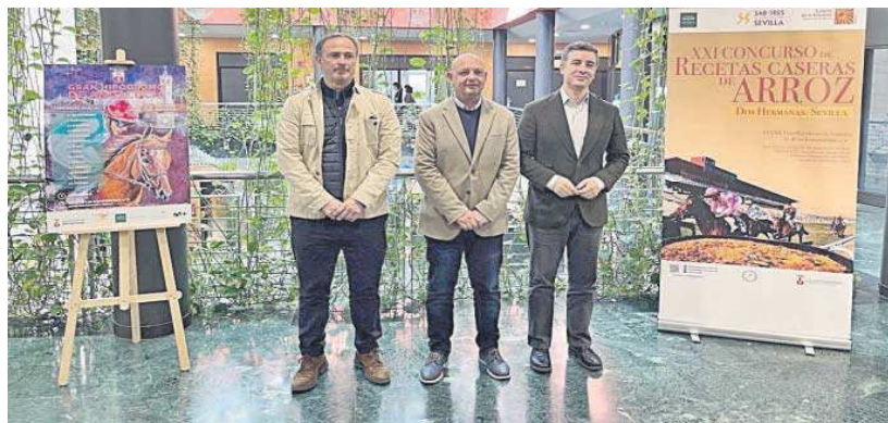
El vicepresidente de Prodetur junto al alcalde de Dos Hermanas y el consejero delegado de AMA, en la presentación.