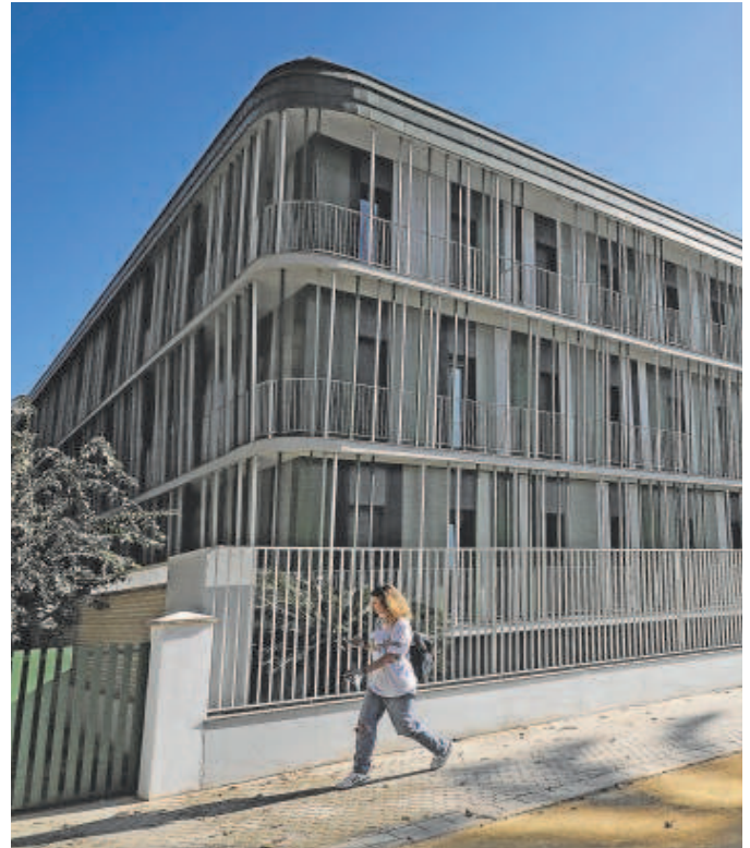
Uno de los nuevos edificios de la avenida de la Palmera

La entidad patrimonial enumeró las irregularidades que se están produciendo en diversas parcelas