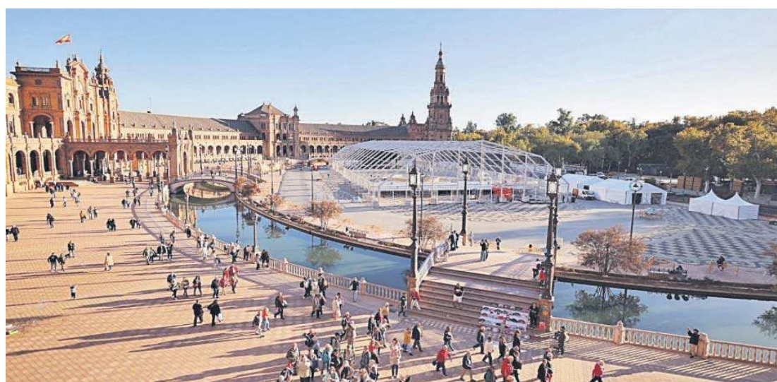
La carpa que ocupa el espacio central de la Plaza de España.

El alcalde, eso sí, dejó claro que tanto desde la Gerencia de Urbanismo y Medio Ambiente como desde la Delegación de Cultura se han dado “todas las instrucciones oportunas” para que no se produzca ningún deterioro patrimonial en la Plaza de España, uno de los lugares más visitados de la ciudad.