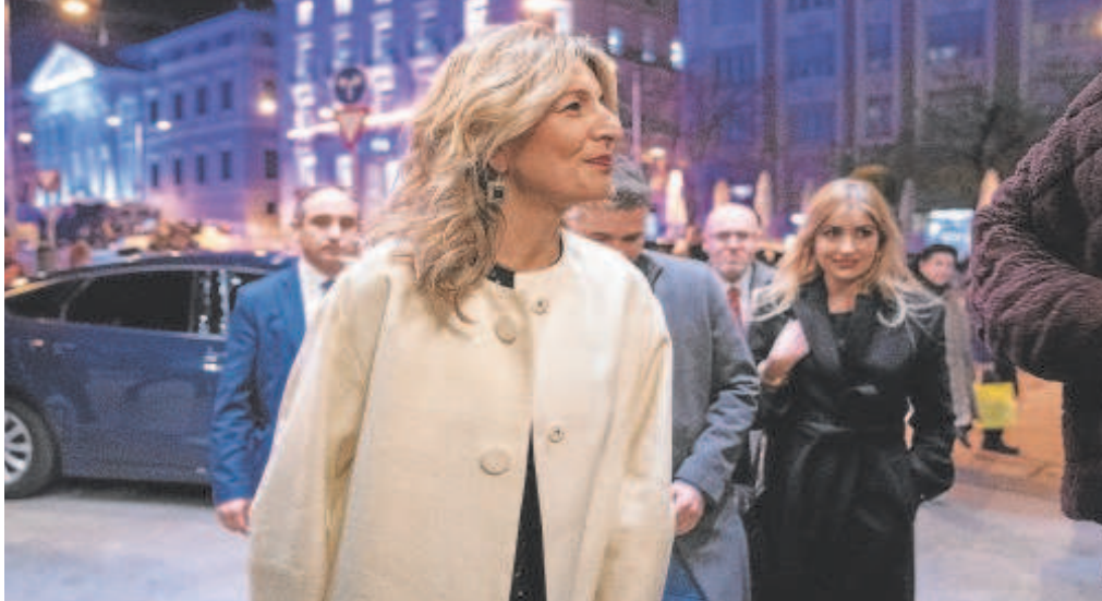
La vicepresidenta del Gobierno y ministra de Trabajo y Economía Social, Yolanda Díaz