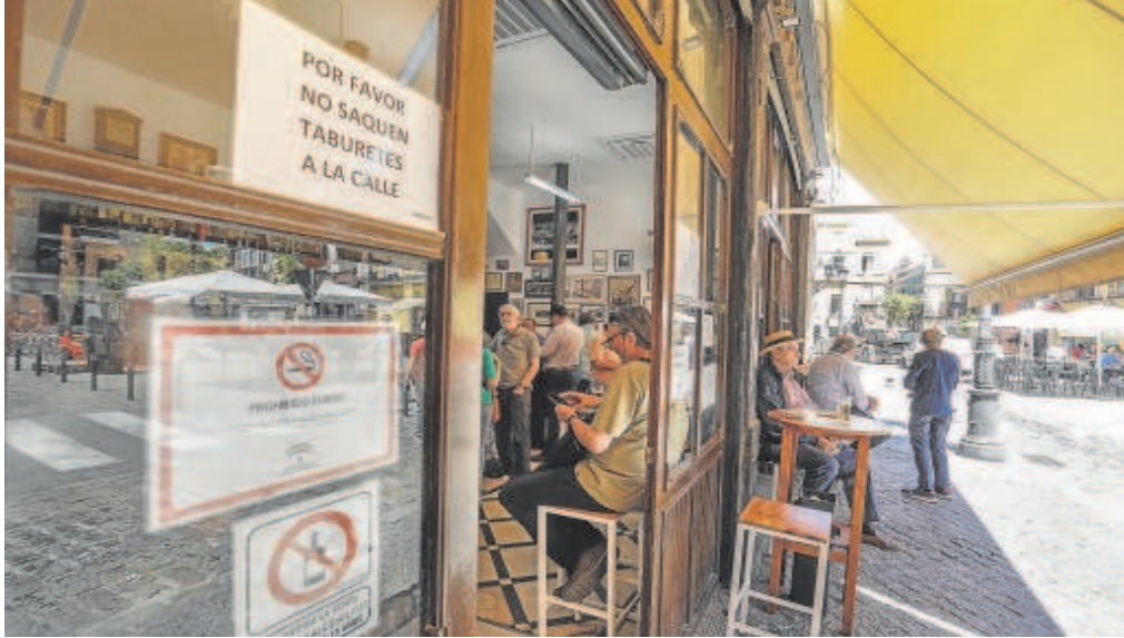
El Vizcaíno de la calle Feria, uno de los bares emblemáticos que sacan 'los tanques a la calle'