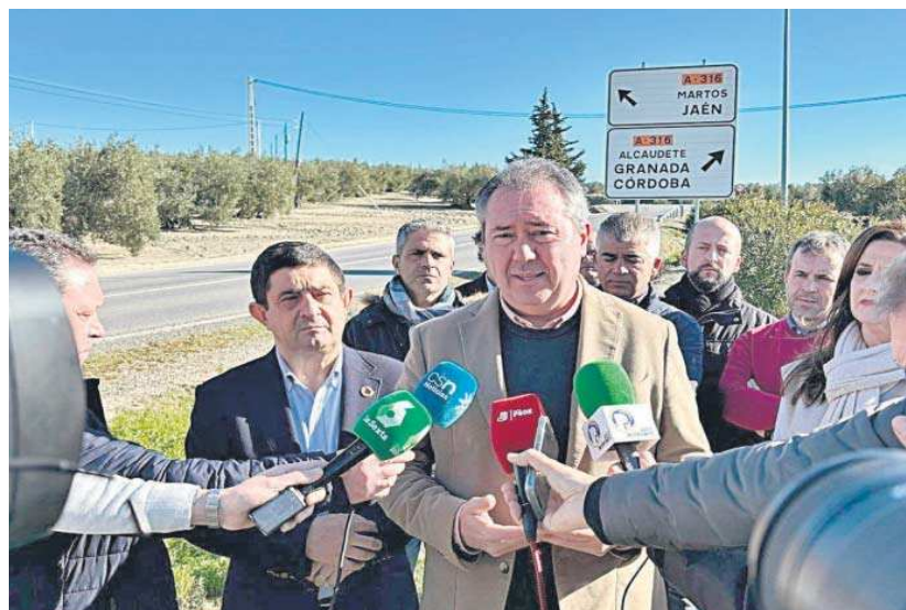
Juan Espadas, en su visita ayer a la provincia de Jaén.