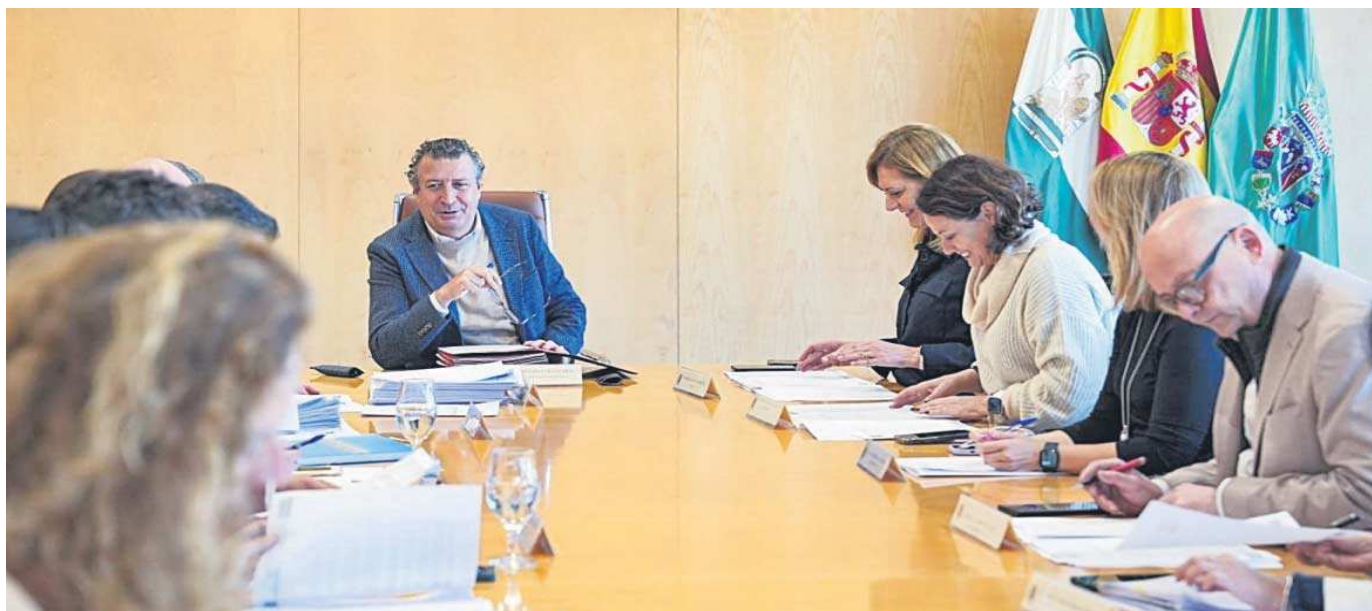
El presidente de la Diputación en la última sesión de la Junta de Gobierno de la Institución Provincial.