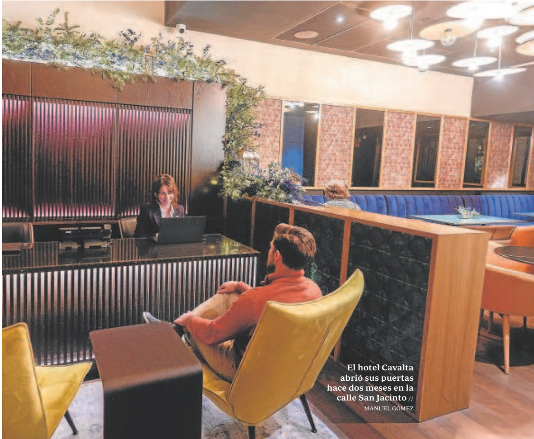
El hotel Cavalta abrió sus puertas hace dos meses en la calle San Jacinto

Urbanismo ha dado recientemente licencia para construir un nuevo hotel en el parque tecnológico. Será el cuarto y tendrá la categoría de cuatro estrellas. Dispondrá de 85 habitaciones con capacidad para 201 camas.