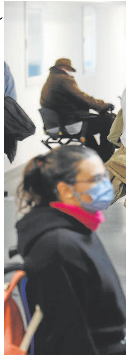
Imagen de pacientes en cola en un centro de