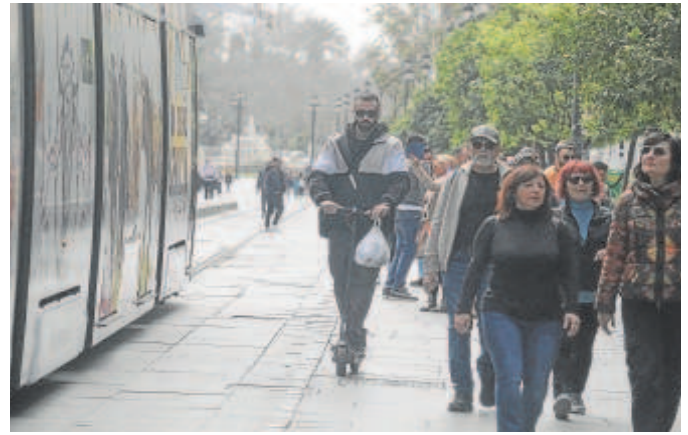
Un patinete circula por el entorno de la estación de Puerta Jerez

Fomento se ampara en dos informes que avalan esta medida, elaborados por el Departamento de Autoprotección y Seguridad de Metro de Sevilla y por la Escuela Técnica de Superior de Ingeniería de la Universidad de Sevilla. En este último se concluye que la «seguridad de las personas debe prevalecer ante cualquier consideración», por lo que se recomienda mantener la prohibición «hasta que los riesgos tiendan a desaparecer». En el último año y medio se ha presentado «un número no despreciable de casos reportados de