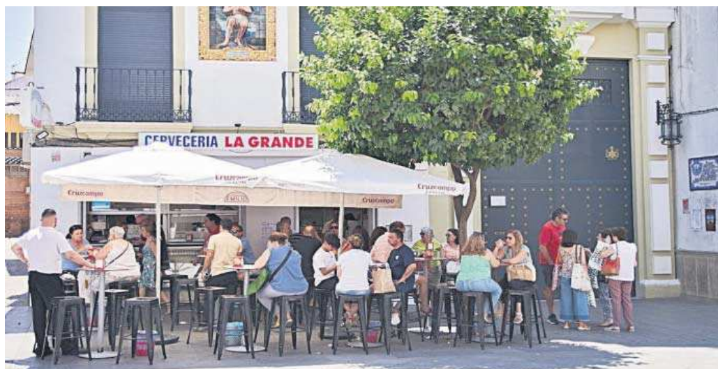
Una terraza de veladores repleta de clientes junto a la capilla de La Estrella.

En la pasada Comisión de Control y Fiscalización al Gobierno