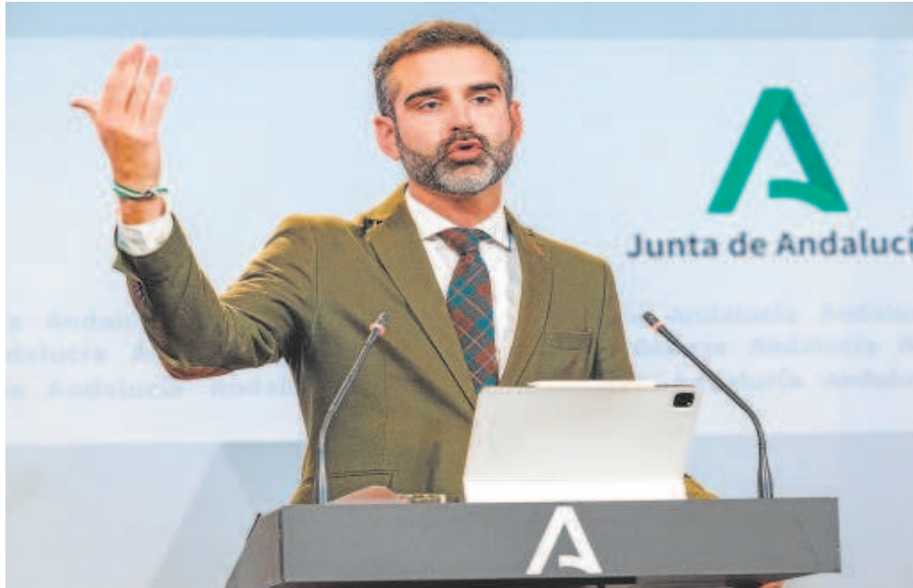
El portavoz del Gobierno, el consejero Ramón Fernández-Pacheco, durante la rueda de prensa de ayer