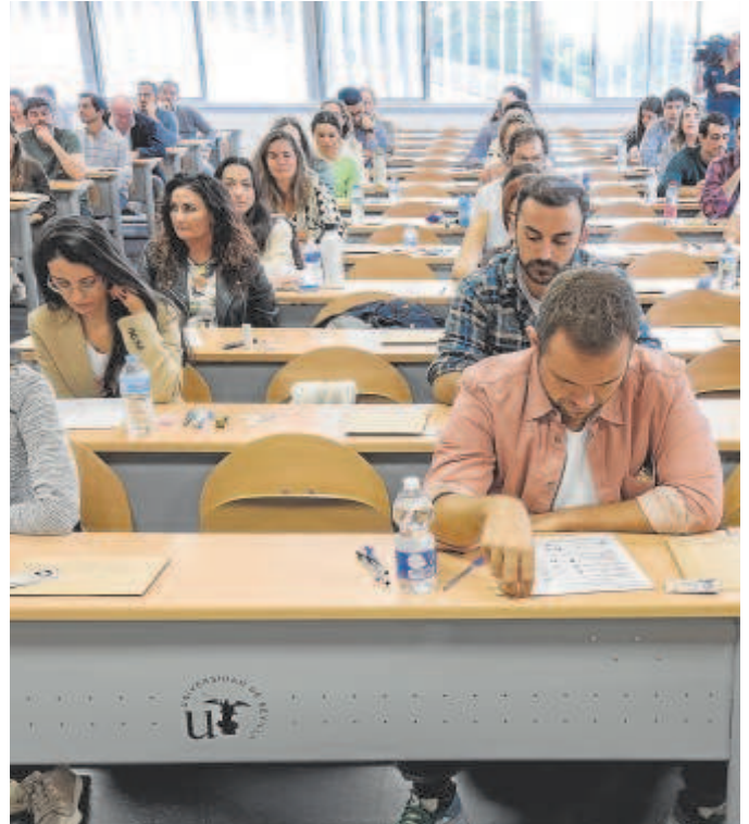
Imagen de opositores durante unas recientes pruebas

Pero en el último Consejo de Gobierno del año se trataron otros asuntos de interés, como a subida de un 10% la ayuda extraordinaria para pensiones no contributivas y asistenciales. Beneficiará a más de 94.800 personas y según se destaca desde la Junta, es la más alta aprobada por un gobierno desde el inicio del complemento y muy superior al IPC correspondiente al mes de octubre de 2023, cuyo porcentaje definitivo