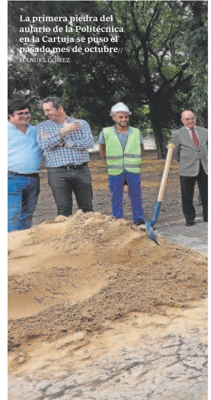
La primera piedra del aula de la Politécnica en la Cartuja se puso el pasado mes de octubre