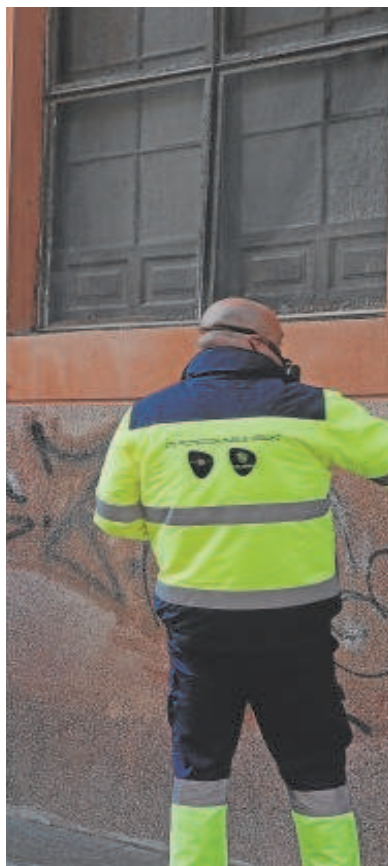
calle Becas