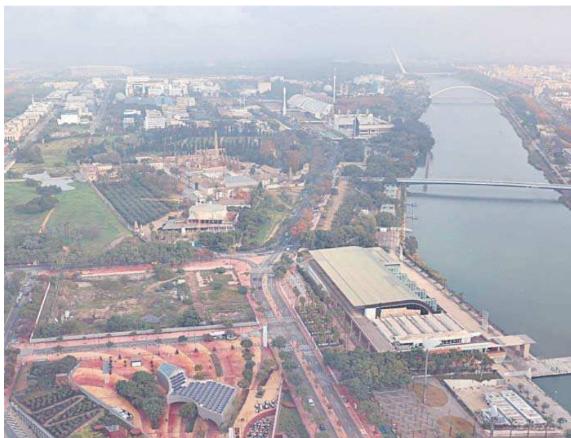
Imagen aérea de la Isla de la Cartuja.

El sistema de alumbrado público inteligente para el PCT Cartuja contempla una inversión de 1,5 millones de euros. Se trata de dotar el alumbrado público del recinto (cuya renovación está siendo objeto de licitación por parte del Ayuntamiento de Sevilla) con iluminación