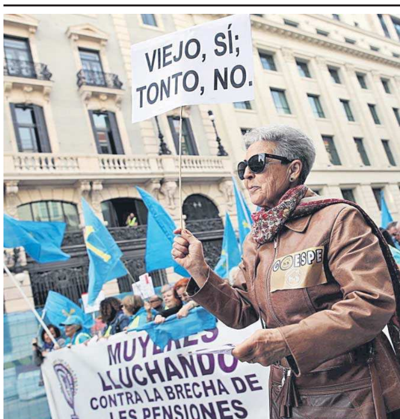
Manifestación en defensa de las pensiones públicas en Madrid en 2019.

Aunque se trata de una potestad del Gobierno, previa con-