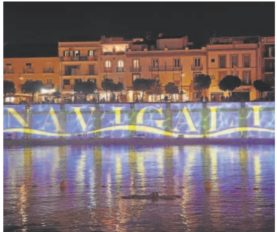
El espectáculo 'Navigalia' es la novedad de la programación navideña

Por otro lado, y en cuanto a las aglomeraciones que se han venido produ-