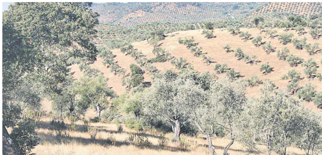
Olivar de sierra en Córdoba.