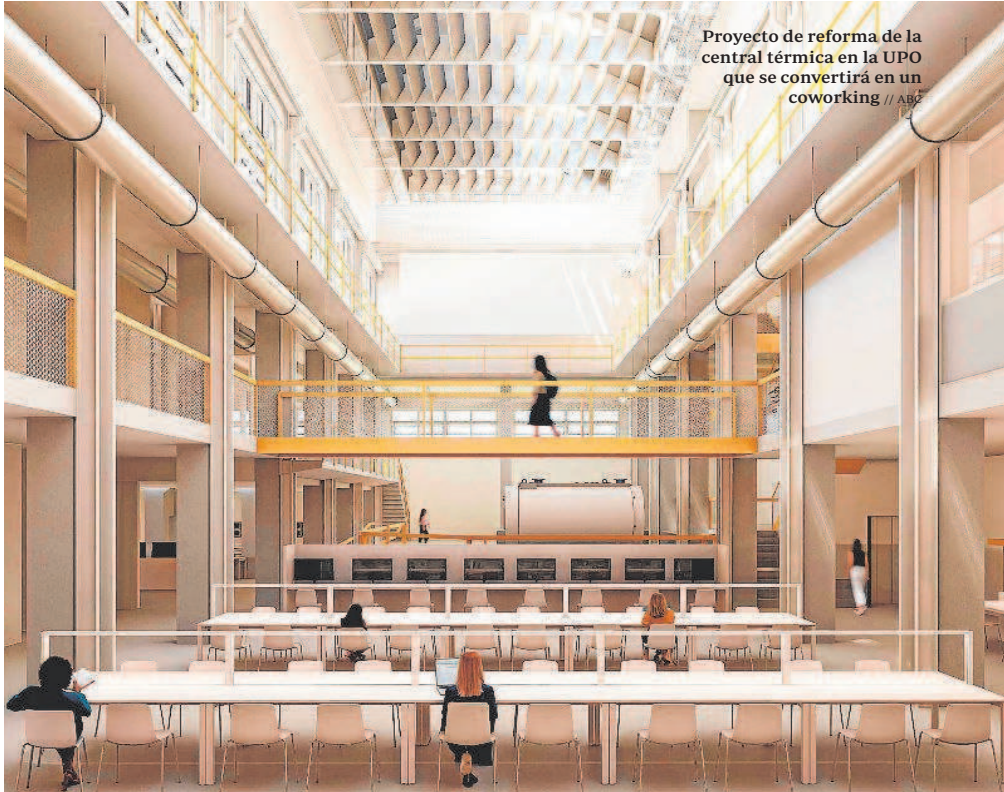
Proyecto de reforma de la central térmica en la UPO que se convertirá en un coworking