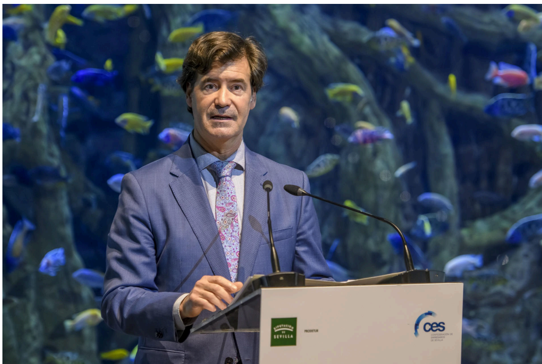
SEVILLA, 30/11/2023.- El presidente de la Confederación de Empresarios de Sevilla, CES, Miguel Rus, preside el acto de entrega de los XI Premios de Responsabilidad Social Empresarial RSE este jueves, en el Acuario de Sevilla.