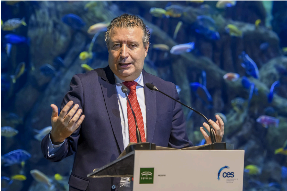
SEVILLA, 30/11/2023.- El presidente de la Diputación de Sevilla, Javier Fernández de los Ríos, preside el acto de entrega de los XI Premios de Responsabilidad Social Empresarial RSE este jueves, en el Acuario de Sevilla.