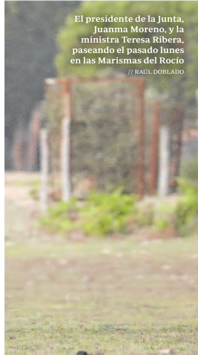
El presidente de la Junta, Juanma Moreno, y la ministra Teresa Ribera, paseando el pasado lunes en las Marismas del Rocio

ladorle su postura en esta cuestión. Desde la Junta de Andalucía, sin embargo, insistieron ayer en que se alcanzó un acuerdo «interno» para acortar dicho periodo a un lustro y que tal compromiso se verá plasmado en las normas reguladoras de las ayudas que elaborará la Administración autonómica.