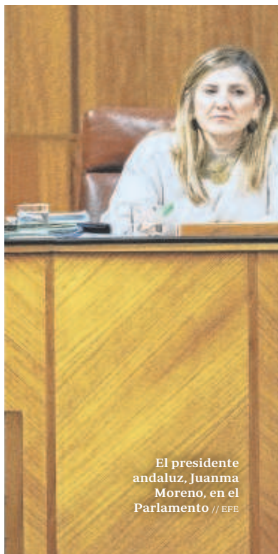
El presidente andaluz, Juanma Moreno, en el Parlamento