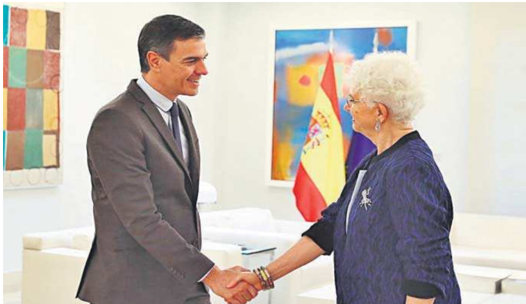
El presidente del Gobierno, Pedro Sánchez, y la embajadora de Israel en España, Rodica Radian-Gordon.