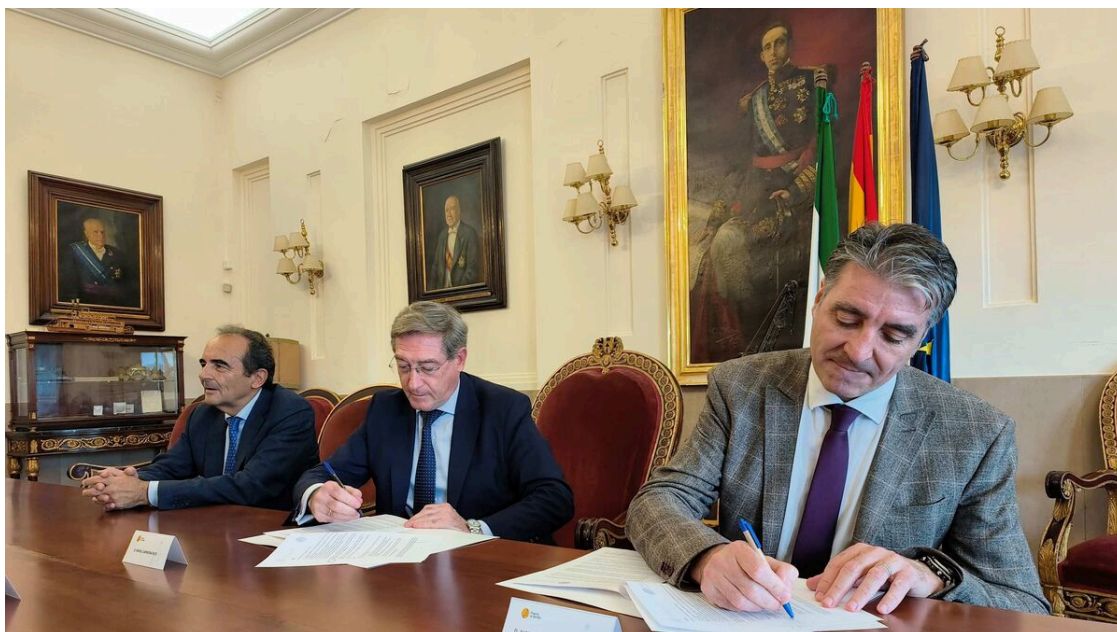
Firma del Convenio entre el Puerto de Sevilla y el Colegio Ingenieros de Caminos de Andalucía.

El Colegio tiene firmados convenios de visados con Puertos del Estado y Adif a nivel nacional; y a nivel regional este es el cuarto convenio con un puerto estatal , tras los suscritos con Málaga, Huelva y Algeciras. En la actualidad está muy avanzado el convenio con la Autoridad Portuaria de Ceuta, y se tiene la firme intención de suscribir en los próximos meses con el resto de Puertos del Estado en nuestra Demarcación.