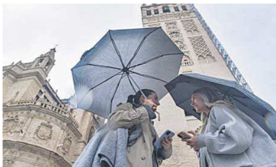
Unas turistas se protegen de la lluvia a los pies de la Giralda.

Por ello, entre el miércoles y el domingo las reservas ya alcanzan el 75% de media. La primera jornada festiva se eleva al 79%. Los días más importantes en lo que a ocupación se refiere