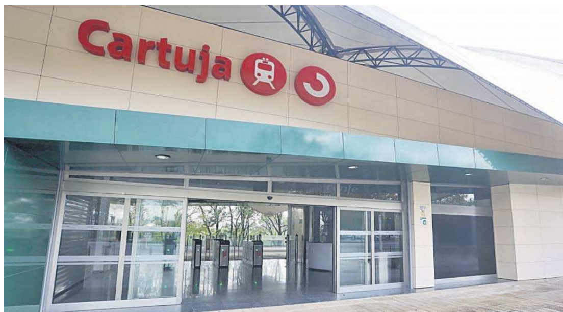
El apeadero de Cercanías de la Cartuja, construido para la Expo92.

Los datos son demoledores: 245 viajeros al día pese a que la demanda potencial es de 30.000 personas al día, ya que a la Cartu-