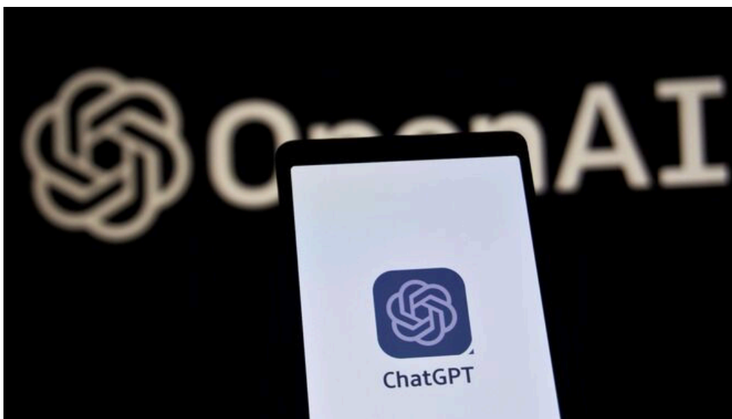
ChatGPT, el chatbot de inteligencia artificial de OpenAI.

La llegada de ChatGPT al público general cumple un año, tiempo en el que se ha normalizado conversar con un robot y se ha hecho famosa su creadora, la empresa OpenAI , cuyo liderazgo en la carrera por la inteligencia artificial (IA) atravesó una sorprendente crisis este mismo mes.