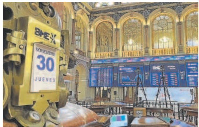
Edificio de la Bolsa de Madrid

Con estos datos sobre la mesa, y teniendo en cuenta que a nivel europeo una de cada cuatro quiebras se debe a retrasos en el pago de facturas y que una de las principales causas de la morosidad son las asimetrías en el poder de negociación entre un cliente grande o más poderoso (deudor) y un proveedor más pequeño (acreedor), hace que a menudo los proveedores tengan que aceptar condiciones de pago abusivas, motivo por el que desde las au-