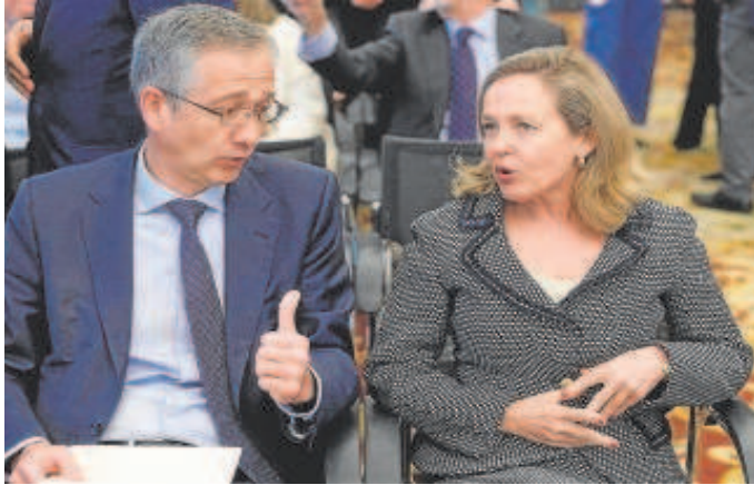
El gobernador Pablo Hernández de Cos, junto a Nadia Calviño