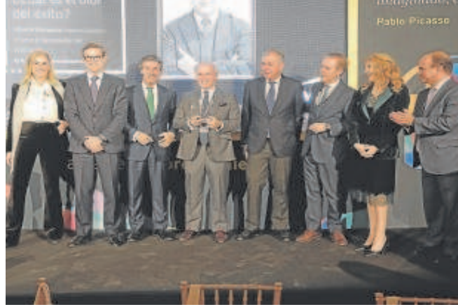
Instituto Español gana el Premio Emprendedor del Año 2023 de EY // V. RODRÍGUEZ