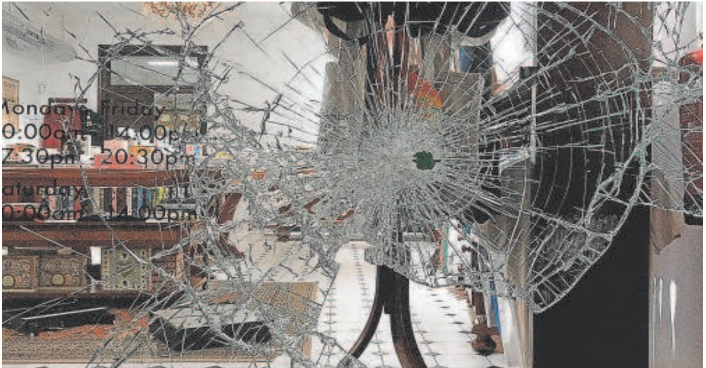
Un cristal roto de un comercio del Centro de Sevilla durante un robo el pasado verano