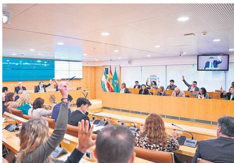
Votación en el Pleno de la Diputación de Sevilla.

De este mismo modo salió adelante la moción de Con Andalucía, aunque con una enmienda del PP,