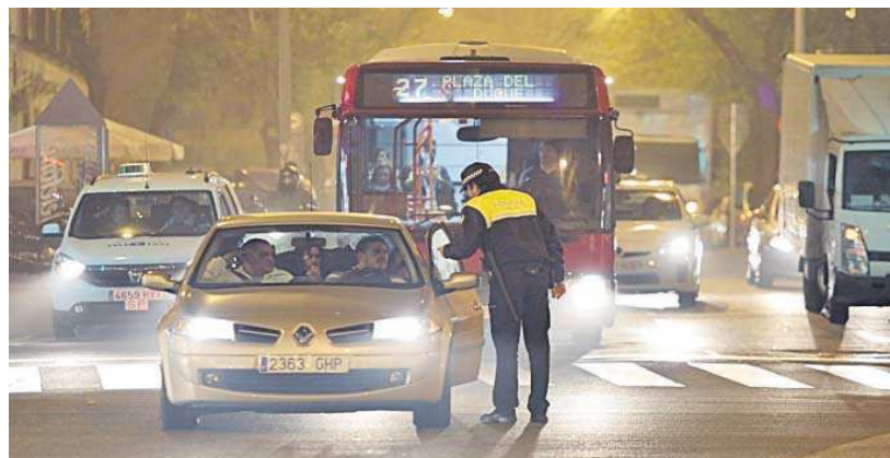
Un policía local, en una foto de una edición anterior del plan de Navidad.

Así, la puesta en marcha de este plan pretende garantizar la fluidez del tráfico y la prioridad al