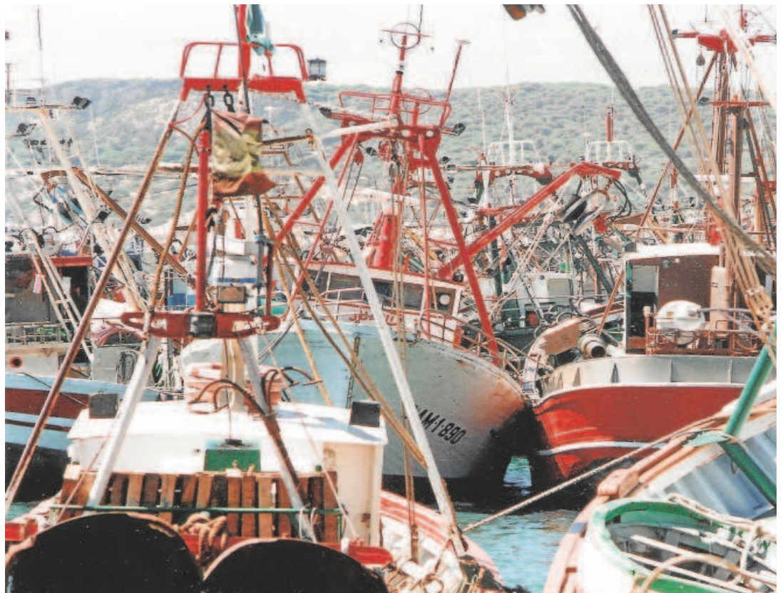
El sector pesquero andaluz ha criticado la reducción de días de pesca y capturas en el Mediterráneo

El acuerdo beneficia a la flota del Cantábrico porque aumenta un 9,7% las capturas de merluza para España en 11.000 toneladas