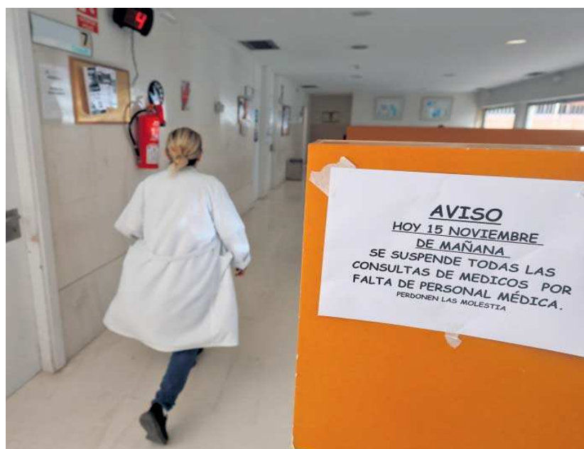
Aviso de falta de facultativos en un centro de salud de Málaga.

Además, añaden que “deben ser eliminados los recortes de la actividad asistencial y quirúrgica estacionales”, es decir, los que se aplican en verano, navidades y úl-