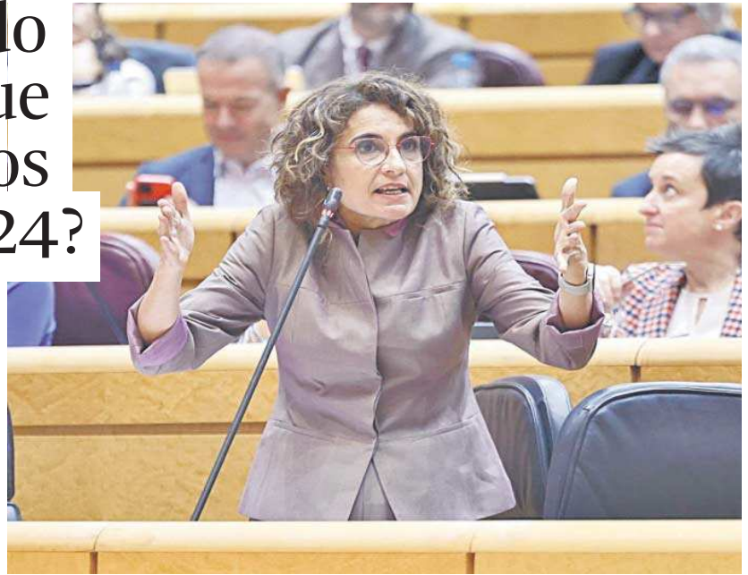
La ministra de Hacienda, María Jesús Montero, en la sesión de control de ayer en el Senado.

Pero en octubre pasado, Hacienda envió otro plan a Bruselas, el llamado Plan Presupuestario. A diferencia del de abril (Plan de Estabilidad), el presupuestario permitía un déficit del 0,1% para las comunidades, del 0% para los