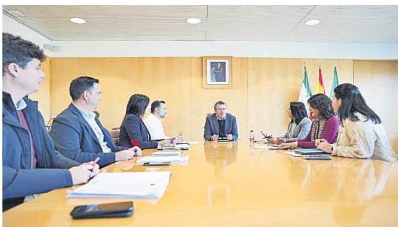
Javier Fernández durante la reunión con su Equipo de Gobierno en la reunión de trabajo mantenida el lunes.

Como recordó Javier Fernández, “toca ahora comenzar a plasmar en el territorio los retos que nos hemos marcado para este Mandato en el Plan Sevilla, con la excelencia social y la promoción de la marca Sevilla empresarial e industrial como pilares básicos, y atender con dedicación especial asuntos perentorios, como es la difícil coyuntura de sequía en la que se encuentra la provincia, que ha marcado una dotación presupuestaria de 26,32 millones de euros como bloque específico de financiación de políticas de agua: gestión del recurso hídrico, abastecimiento, digitalización de redes de agua potable, acciones específicas contra la sequía, mejora de canalizaciones, obras de alcantarillado y agua en baja y en alta, fusión de los sistemas de Sierra