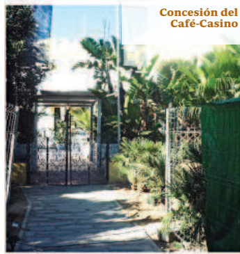
Concesión del Café-Casino

Mientras, la radiografía actual del espacio es desoladora: coches mal estacionados, gorrillas que extorsionan a los conductores, basura sin recoger en sus calles, arbolado y zonas verdes sin un plan de mantenimiento y botellonas que se celebran cada fin de semana. A ello se suma también el cierre preventivo del Teatro Lope de Vega, que no acogerá eventos a corto plazo hasta que se complete la rehabilitación interior del edificio. La idea primitiva era acabar con todos estos problemas a través de la eliminación de la circulación de vehículos privados y de las edificaciones sin valor –entre ellas las caracolas–, la definición de un cerramiento común y la creación de plazas y espacios culturales para actividades al aire libre. Lo que queda de esa idea está ahora en manos del nuevo gobierno de la ciudad.