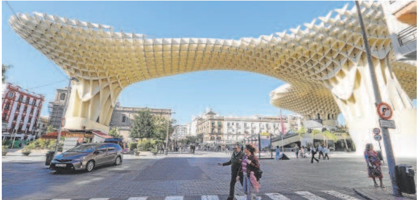
Las Setas de Sevilla, vistas desde la calle Imagen y con el fondo de Laraña y la Anunciación