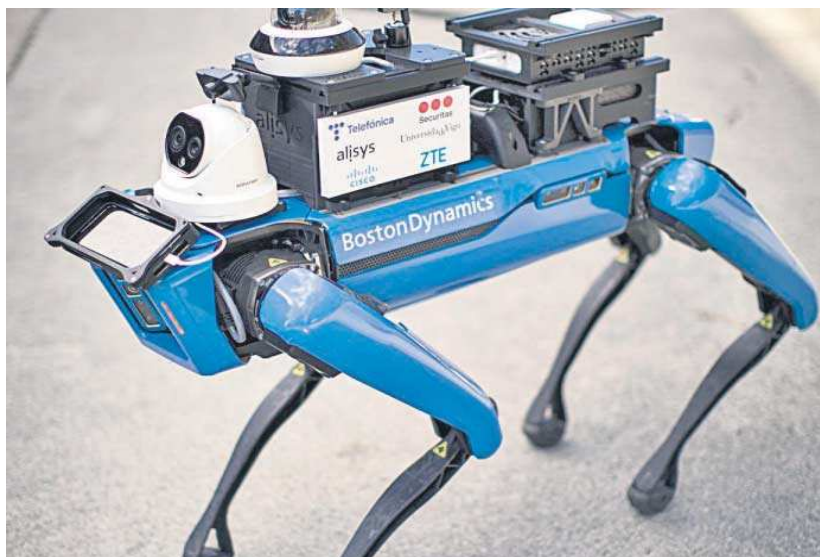
Spot, el perro robot, estará hasta el viernes en la exposición InnovaTe 2023 en Sevilla.

Asimismo, en InnovaTe Sevilla estará Spot, un robot con forma de perro que está equipado con tecnología 5G y cámaras de vi-