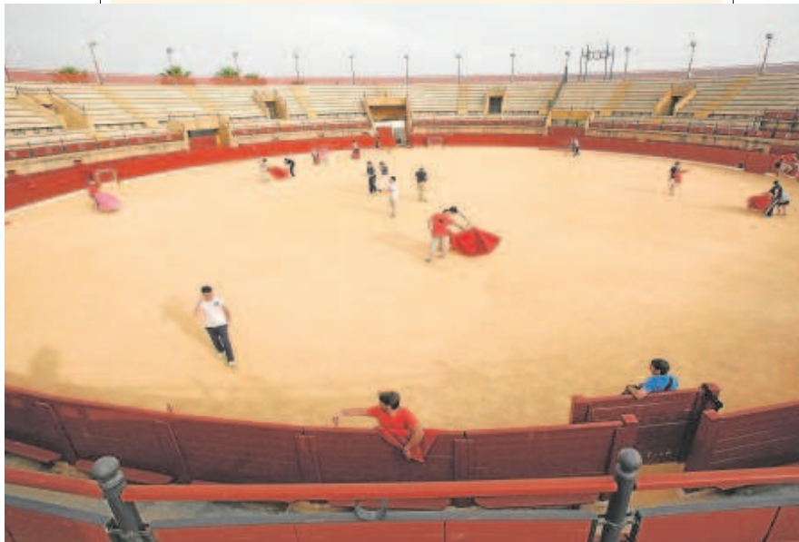
La plaza de toros de Espartinas se edificó en 2005 como la más moderna y funcional de la provincia de Sevilla

el pasado mes de marzo este programa para la promoción de la tauromaquia «con la finalidad de divulgar su conocimiento, mejorar su valoración social y fomentar la programación de festejos taurinos, con especial énfasis en el acercamiento a la juventud». Además del evidente rechazo a la fiesta de los toros, aquí entra el color político, tras ser el Gobierno autonómico del PP quien fundase REMTA, que motiva aún más la negativa del equipo de gobierno de Espartinas, pese a que haya varios ayuntamientos socialistas adheridos