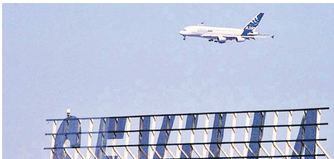
Un avión sobrevuela el aeropuerto de Sevilla.