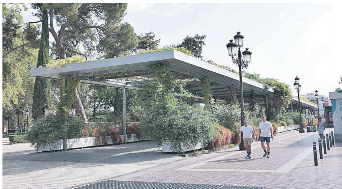
Varias personas en el Paseo de Cristina, que se encuentra junto a la emblemática Puerta de Jerez.