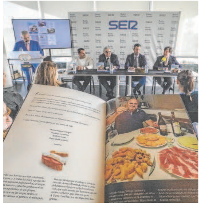
Imagen de la presentación de la guía con una imagen del autor

Entre los familiares y muchos amigos, el director de contenidos de la Cadena Ser en Andalucía y hermano del