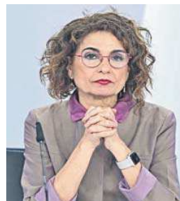
María Jesús Montero.

fiscales europeas. “Este Gobierno se guiará, como el anterior, por el rigor en las cuentas públicas y la prudencia a la hora de presupuestar por el compromiso con la consolidación fiscal”, ha asegurado la vicepresidenta cuarta y ministra de Hacienda y Función Pública, María Jesús Montero, en la rueda de prensa posterior al Consejo de Minis-