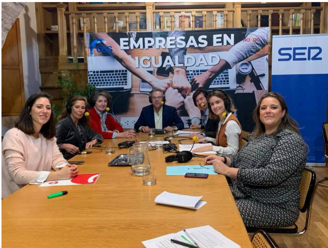
Hoy por Hoy desde la sede de la CES: 'Empresas en igualdad'