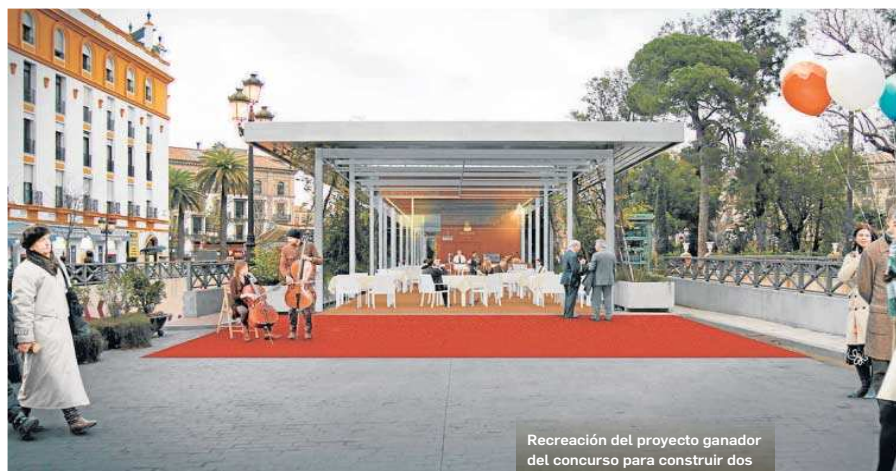
Recreación del proyecto ganador del concurso para construir dos quioscos en el Paseo de Cristina.

De esta manera, resaltaron que “instalar quioscos en esas pérgolas no es coherente ni beneficioso para la ciudad, es un proyecto que elimina sombra, además de espacio para el peatón”; e indicaron que “así gestionaba el urbanismo de nuestra ciudad el ex alcalde y delegado de Ur-