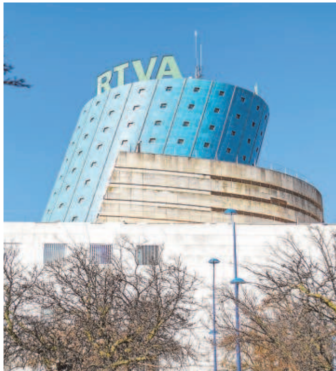
Sede de la RTVA, en la isla de la Cartuja de Sevilla

Desde la Consejería de Presidencia, Interior, Diálogo Social y Simplificación Administrativa, subrayan que la operación no supone un nuevo desembolso sino que se trata de flexibilizar las condiciones para facilitar la mejora de la tesorería y mejorar los pagos