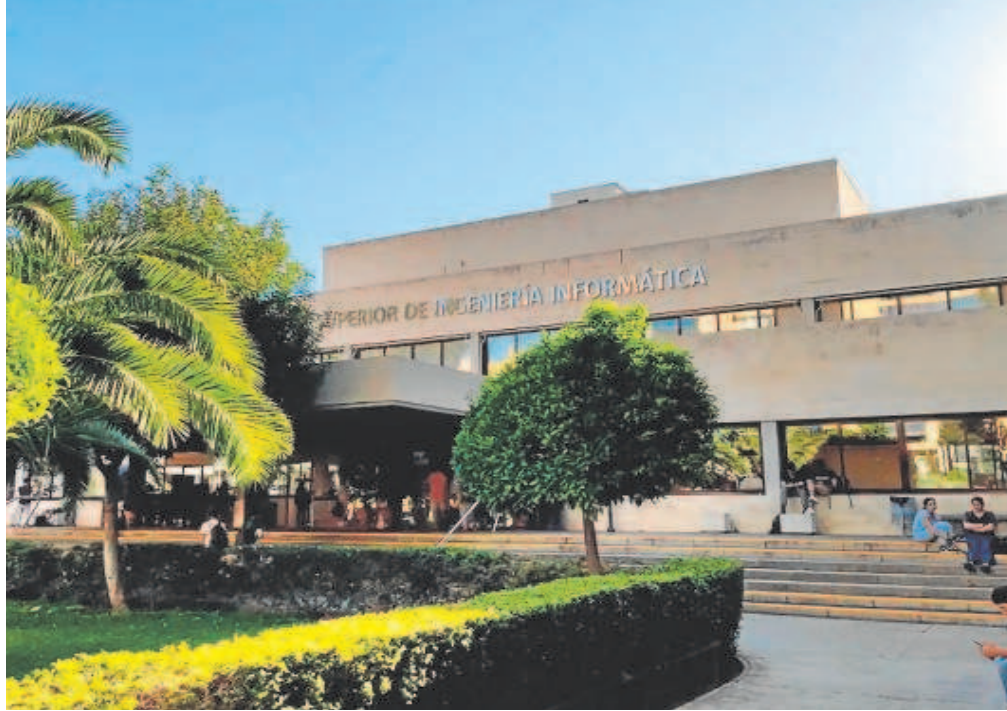
Fachada de la Facultad de Ingeniería Informática situada en Reina Mercedes // UNIVERSIDAD DE SEVILLA