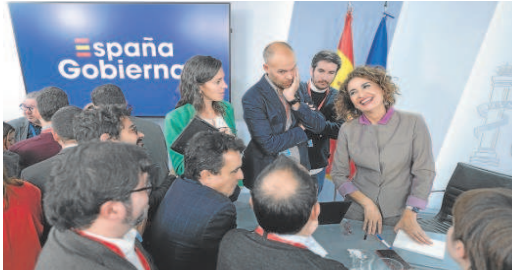
A la derecha, la vicepresidenta y ministra de Hacienda, María Jesús Montero, tras el Consejo de Ministros // EP

res desembolsos son los relativos a complementos de prestaciones contributivas sujetos a límite de ingresos, que precisan de un aporte de 3.761 millones. Siguen los 3.117 millones en prestaciones por nacimiento y cuidado de menor, los 2.203 millones para cubrir el coste de la pensión anticipada involuntaria en edades inferiores a la edad ordinaria de jubilación, los 1.812 millones para financiar reducciones en la cotización a la Seguridad Social y 1.162 millones para subvenciones implícitas al régimen especial del mar, el sistema especial agrario y los contratos de formación, a los que se suman costes de menor cuantía y el apéndice de «otros conceptos» para lo que se destina la mayor cuantía, 5.559 millones de euros.