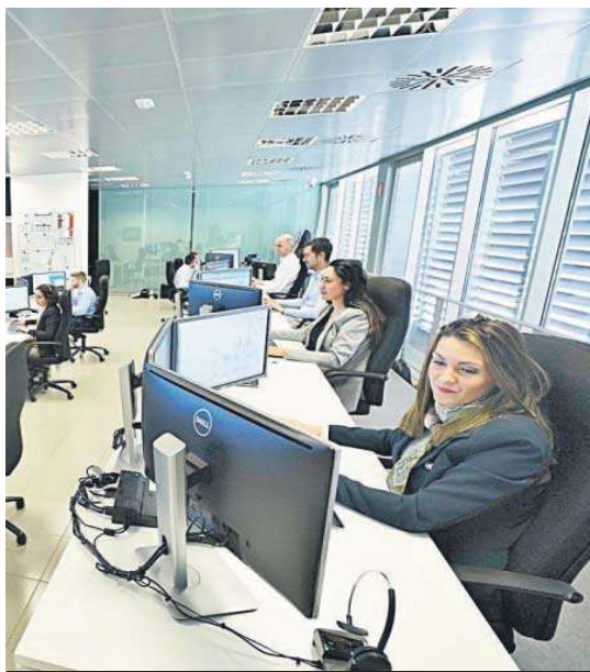
Centro de Procesos de Datos (CPD) de la compañía en Valencia.

Mercadona IT no solo tiene instalaciones en Valencia, sino que ha abierto también nodos en Sevilla (donde hoy trabajan diez personas), Vigo (con un equipo de ocho informáticos), Santander (con doce) y la reciente apertura de un nuevo equipo con sede en Oporto. Sus planes pasan por seguir incorporando talento en tales oficinas, poniendo el fo-