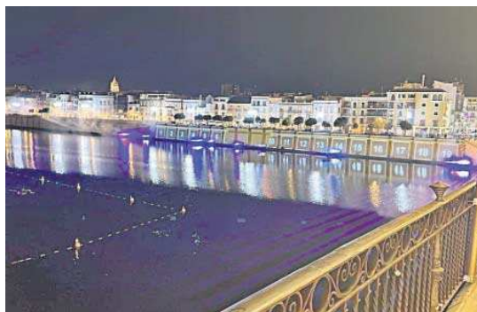
Una de las pruebas realizadas en la zapata.

el espectáculo, similar al recordado del lago de la Expo 92, pueden sacar su entrada gratuita. El Ayuntamiento para una mejor organización del evento ha decidido que se haga de esta manera para evitar aglomeraciones en el entorno del muelle de la Sal, epicentro de la proyección. En la jornada de ayer ya se agotaron las principales localidades para muchos de los pases.