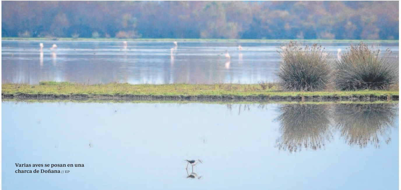
Varias aves se posan en una charca de Doñana