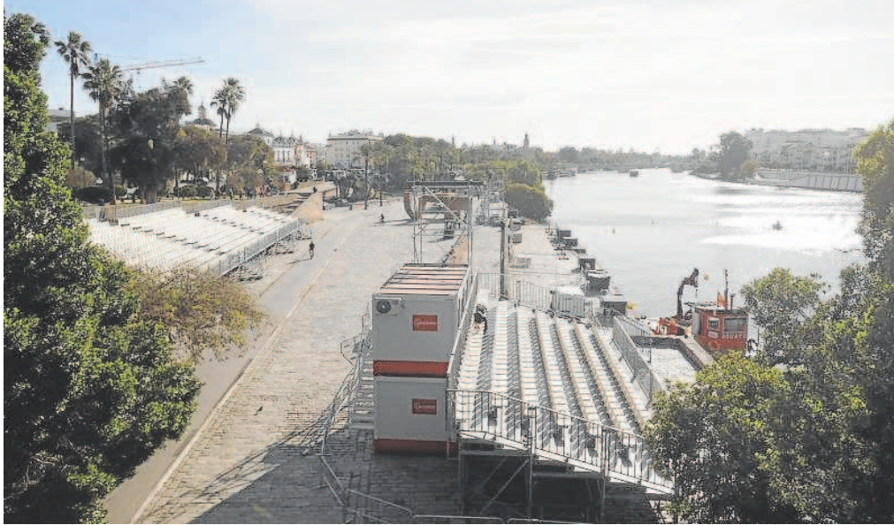
Vistas de las gradas en el Muelle de la Sal para el espectáculo 'Navigalia' en el río Guadalquivir