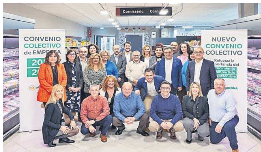
Fotografía de familia de los firmantes del nuevo convenio colectivo de Mercadona.

● El nuevo convenio eleva el salario con el IPC hasta el 2,5%; si éste es mayor, se cubre hasta el 6% si se cumplen los objetivos de la firma