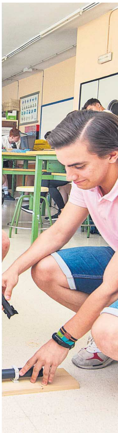
Los jóvenes se enfrentan a los nuevos retos que proponen las nuevas tecnologías.

cial Europea (ESA, en inglés), enfrentarse a retos y problemas reales mediante una metodología de trabajo cooperativo y/o colaborativo, donde tienen que poner a prueba las habilidades y competencias básicas adquiridas en el desarrollo del currículo, en el contexto aeroespacial, y les permite poner en práctica su competencia digital a través de la implementación de kits y recursos educativos digitales en el aula así como en la participación en concursos aeroespaciales que también están relacionados con la robótica y la programación.