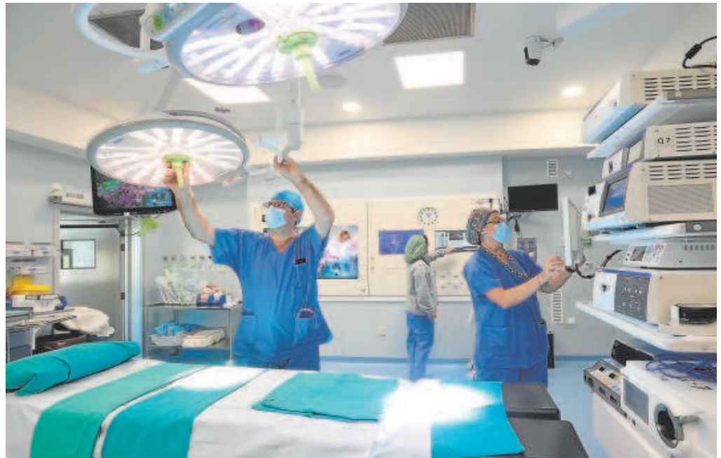
Profesionales sanitarios en un quirófano del hospital Reina Sofía de Córdoba

La reunión de la comisión técnica de Recursos Humanos celebrada ayer fue el primer encuentro en relación con la situación sanitaria entre Gobierno y autonomías desde la designación de Mónica García como ministra de Sanidad. Durante la reunión se realizó un seguimiento de las medidas puestas en marcha durante los últimos años en plan de acción de atención primaria. Estos encuentros se producen después de que la publicación de las listas de espera reflejase un grave problema todas las comunidades autónomas, aunque con especial gravedad en algunas como Andalucía.