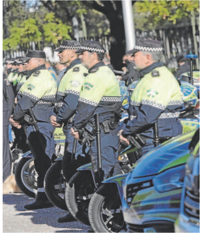
Imagen de archivo de la Policía Local // JUAN FLORES

Pero este perfil de agentes es minoritario dentro de las ofertas de empleo que reserva el grueso de plaza para los