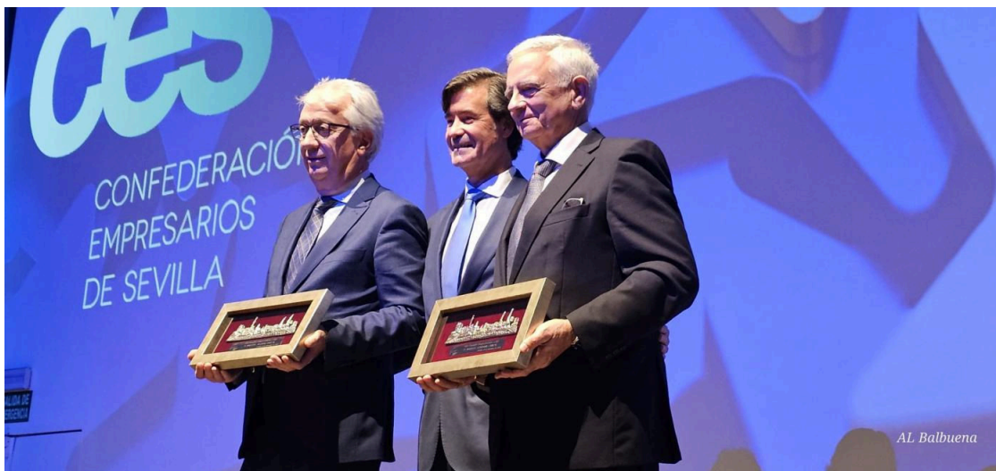
La entrega de los premios. - CES

Distribuido para CONFEDERACION DE EMPRESARIOS DE SEVILLA * Este artículo no puede distribuirse sin el consentimiento expreso del dueño de los derechos de autor.