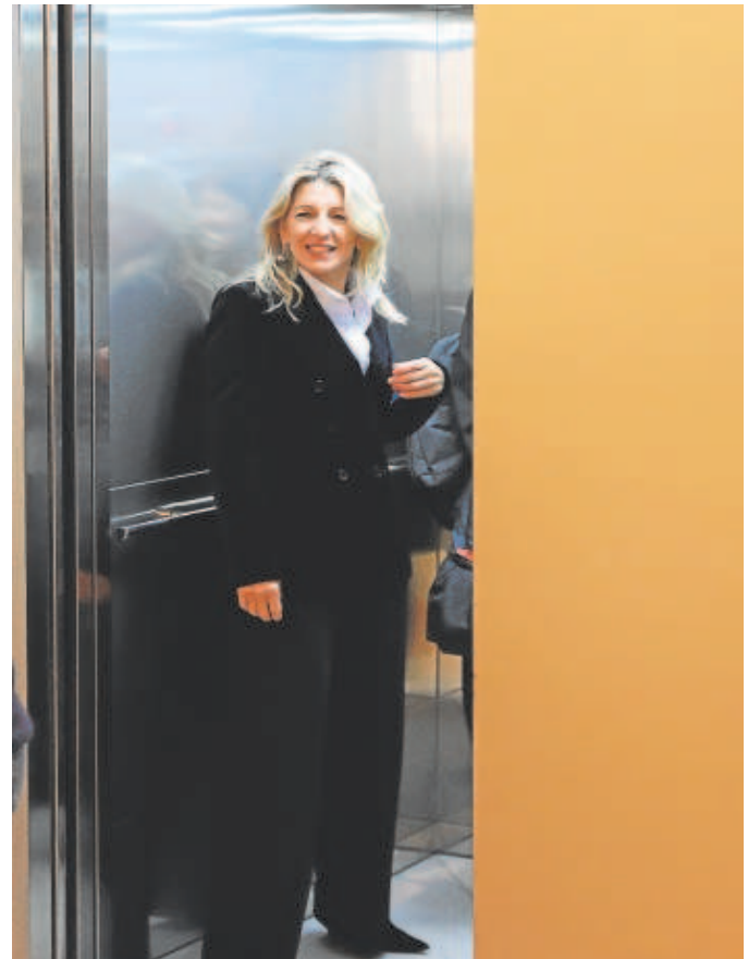
La vicepresidenta segunda y ministra de Trabajo, Yolanda Díaz

«En efecto, en el despacho llevamos observando desde el mes de octubre, si bien se ha intensificado recientemente, un aumento significativo de consultas y opiniones legales relacionadas con la puesta en marcha de medidas de reordenación y reestructuración laboral o, en el mejor de los casos, de contención de costes a través de los mecanismos de flexibilidad interna», confirma en esta línea el abogado laboralista y socio de Labormat-