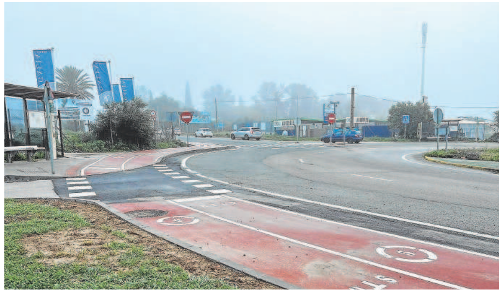
El carril bici que conecta con Gines desde la urbanización Alquería de Almanzor // J. M. R.

Una vez se ponga en marcha este enlace, cuyas obras están adjudicadas por el Ministerio de Transportes por 2,6 millones, el tráfico se hará mucho más fluido. La luz se ve ya al final del túnel.