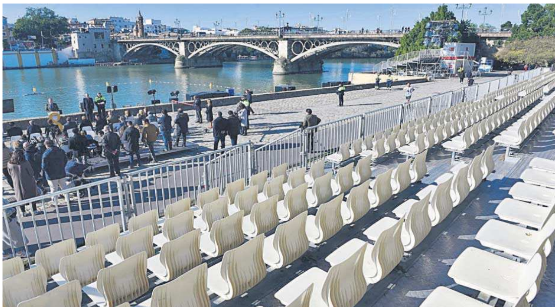
El graderío instalado en el Paseo de Colón desde el que se podrá seguir el espectáculo.