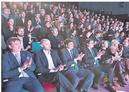
Una parte de los asistentes al acto.

graron 31 patentes. El 68% de estos proyectos (514 en total) se han desarrollado en colaboración con otras entidades. La Cartuja cuenta con 193 grupos de investigación.