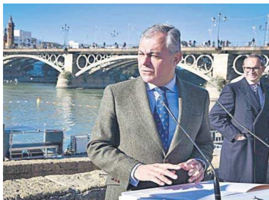
El alcalde durante la presentación de 'Navigalia'.

A través de la web lamagiaestaenelrio.com las personas que quieran presenciar en directo