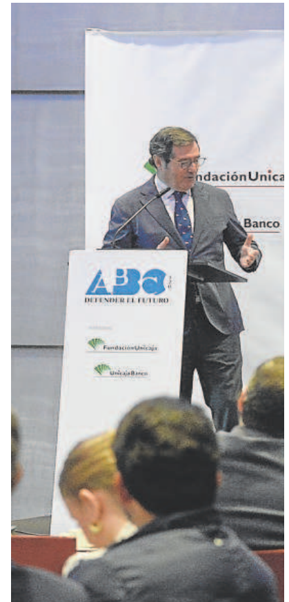
Antonio Garamendi, presidente de la CEOE, en

Al mismo tiempo destacó la importancia del diálogo y los pactos con los sindicatos en el desarrollo socioeconómico, resaltando que se han logrado 17 acuerdos que han sido fundamentales para el progreso del país en los últimos años. Sin embargo, expresó con tono crítico su preocupación