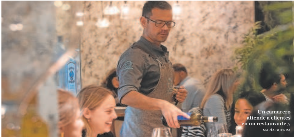
Un camarero atiende a clientes en un restaurante // MARÍA GUERRA