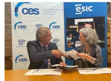
La CES se une a EIG y a ESIC apoyando el programa Generación Digital Pymes