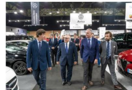
El presidente de la CES en la inauguración del Salón del Motor de Sevilla