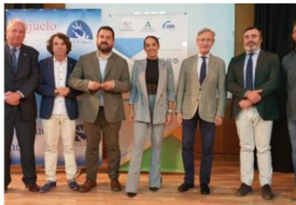
Emprendimiento en el instituto El Majuelo de Gines