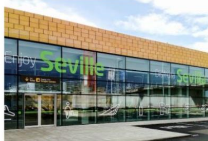
Los empresarios de Sevilla creen que eliminar las rutas aéreas hace un grave daño a la competitividad de la provincia