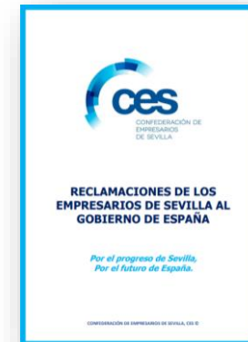
Documento "Reclamaciones de los Empresarios de Sevilla al Gobierno de España" para las Elecciones Generales del 23 de julio de 2023.

El año 2023 ha sido, además, un año de mucha incertidumbre, al concentrar dos procesos electorales: elecciones locales y nacionales. En este sentido, desde la CES hemos preparado documentos con propuestas empresariales, los cuales hemos enviado directamente y debatido con los representantes políticos de los diferentes partidos. Siempre pidiendo alturas de miras y consenso para llegar a acuerdos que nos hagan avanzar desde el punto de vista social, económico y empresarial.