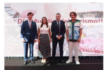
El presidente de la CES asiste a la presentación de la campaña de promoción «Sevilla también»