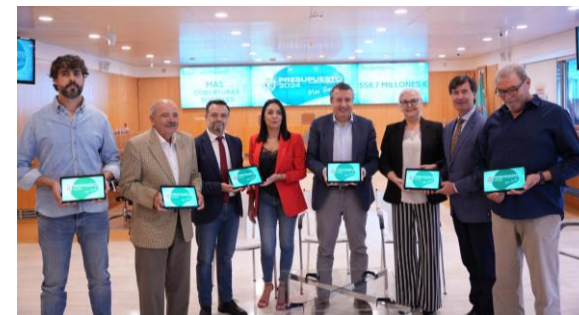
Presentación presupuestos 2024 de Diputación a los firmantes del acuerdo de concertación