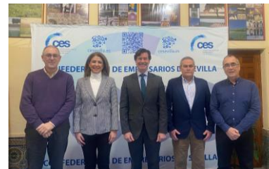
Jornada sobre el “Nuevo sistema de cotización para el Autónomo”