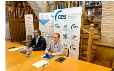
Webinar sobre “Cómo mejorar la cuenta de resultados y la productividad desde la gestión la gestión del absentismo”.