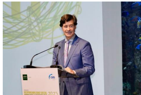
Foto de familia con los galardonados en los Premios de Responsabilidad Social Empresarial y Sostenibilidad celebrados en el Acuario de Sevilla con los galardonados. (Abajo) El presidente de la CES, durante su discurso donde puso en valor el ejemplo de las empresas comprometidas con la RSE.