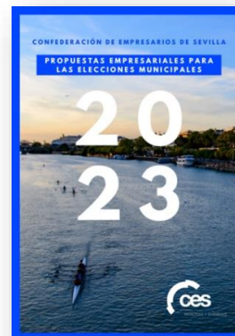
Documento "Propuestas Empresariales para las Elecciones Municipales" del 28 de mayo de 2023.

Además, constantemente se ha instado a las diferentes Administraciones a implementar medidas que fomenten un clima favorable para la actividad empresarial y afrontar los retos económicos y sociales cruciales para el futuro de Sevilla y su tejido empresarial. Esto incluye la reivindicación de infraestructuras olvidadas, la adecuación de la formación a la realidad empresarial, la defensa del diálogo social, el fomento de la Responsabilidad Social Empresarial, la potenciación del turismo, la industria y la agricultura, así como enfrentar la significativa amenaza económica que representa la sequía.