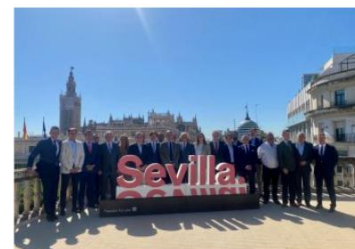
Los empresarios del sector turístico de Sevilla firman con el alcalde un "Pacto por el Turismo"