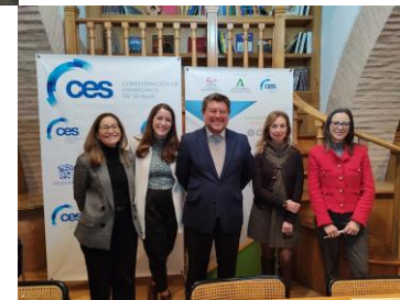
Jornada sobre “Innovación Social para el Empleo”