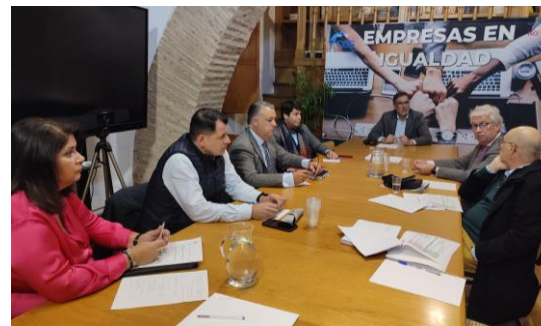
Dentro de este departamento están la Comisión Régimen Interno y la Comisión de Relaciones Laborales (reunida en la imagen).