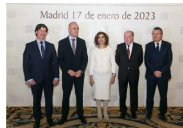
Sevilla desembarca en Fitur como un lugar único para vivir, trabajar e invertir

Hay que desarrollar políticas públicas, en cooperación y corresponsabilidad con el sector, que permitan al turismo superar las dificultades motivadas por su propia transversalidad y llevar con acciones que le permitan ganar en competitividad como: mejorar la experiencia turística; apostar por un turismo de mayor calidad; aumentar el número de pernoctaciones; ampliar, cuidar e innovar en los espacios y productos turísticos; construir, de una vez, las infraestructuras estratégicas para su desarrollo (Ej.: conexión Santa Justa - Aeropuerto de Sevilla, SE-40, Red Completa de Metro.); diversificar de mercados; y promover medidas de apoyo para la digitalización, sostenibilidad e impulso del I+D+i en el sector