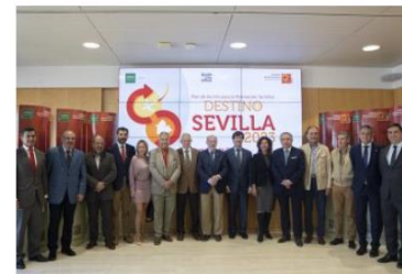
La Diputación y el tejido empresarial turístico de la provincia acuerdan la promoción del 'Destino Sevilla' en 24 ciudades del mercado nacional e internacional