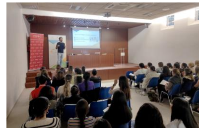
Charla sobre el mundo empresarial en el Centro Educativo Albaydar