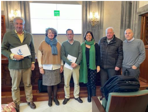
Representación de la CES en el Consejo Económico y Social de la Provincia.

La CES participa en órganos destacados de participación institucional de las diferentes Administraciones donde se defienden los intereses de las empresas sevillanas.