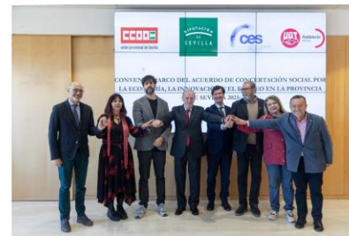
Renovación del acuerdo de concertación entre Diputación y los agentes económicos y sociales

De igual forma se han mantenido diversas reuniones de la Comisión de seguimiento del Acuerdo de Concertación firmado entre Diputación y los Agentes Económicos y Sociales.