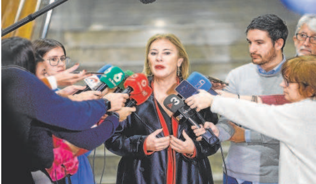
La consejera de Economía, Hacienda y Fondos Europeos, Carolina España