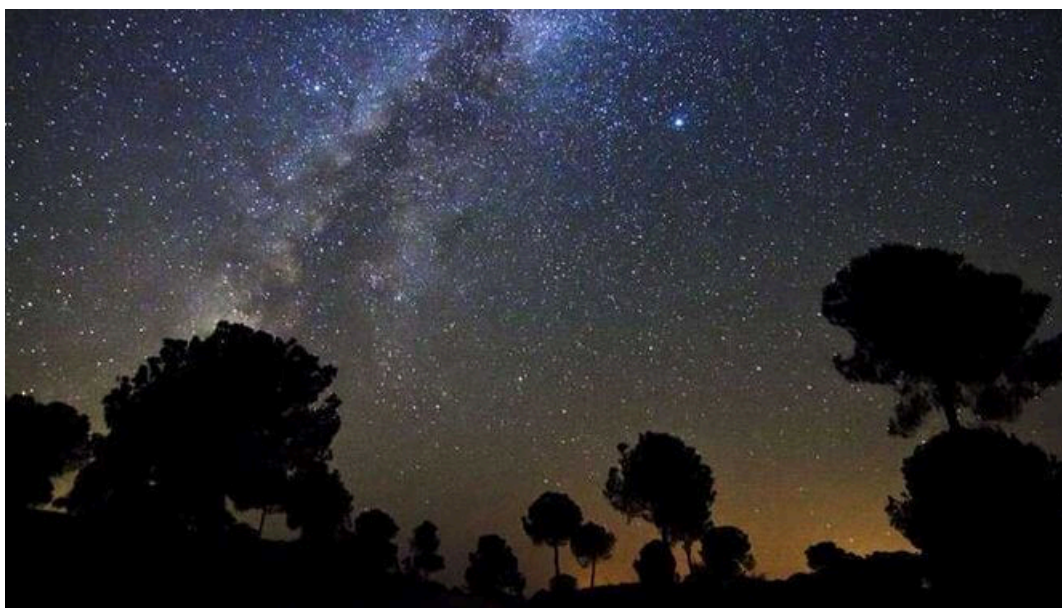
Las Perseidas en el cielo de Sevilla

El astroturismo es un tipo de turismo centrado en la observación de los cuerpos celestes en el cielo nocturno . Esta subclase del turismo tradicional nace en torno al año 2003, cuando la UNESCO pone en marcha su proyecto de patrimonio astronómico mundial , lo que da pie a que naciera este tipo de turismo astronómico para la recreación y la divulgación científica .