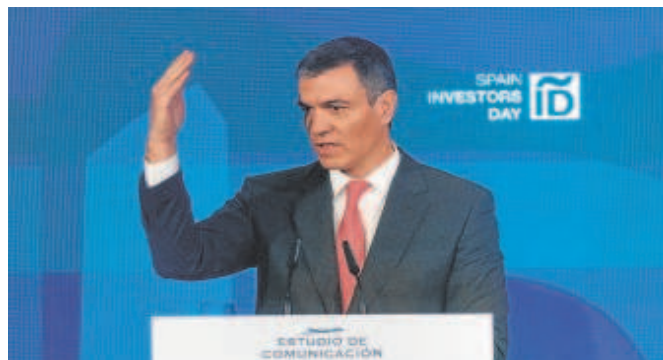
El presidente del Gobierno, en el Spain Investors Day