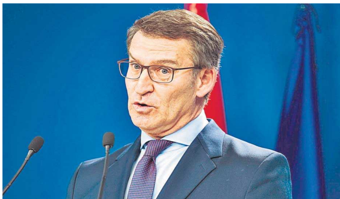
El presidente del PP, Alberto Núñez Feijóo, atiende a los medios de comunicación en Génova.

El jefe de la oposición dice que “no hay ni un ápice de grandeza” en lo que hace el Ejecutivo