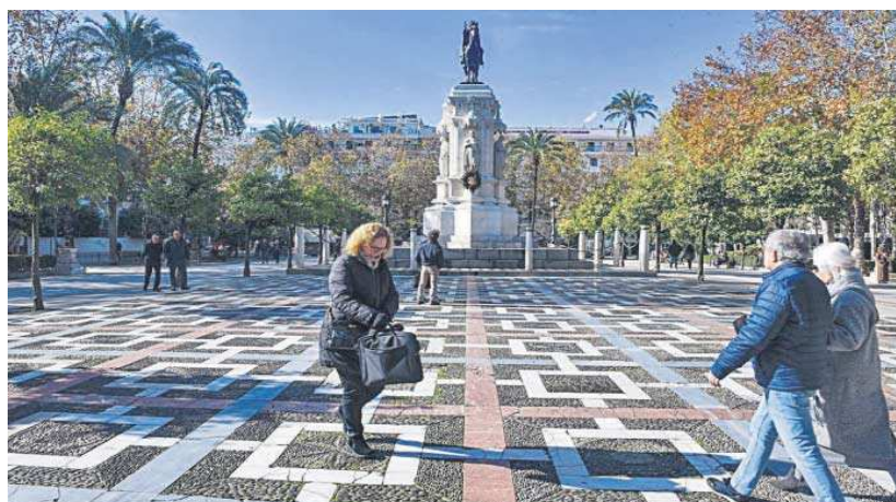
Varias personas cruzan la céntrica plaza, que tiene un característico mármol de color gris, blanco y rojo.

La Gerencia de Urbanismo ha acatado la resolución judicial desfavorable a los intereses municipales dictada por el Juzgado de lo Contencioso-Administrativo número 7, que estima íntegramente la indemnización reclamada. Según relató su familia,