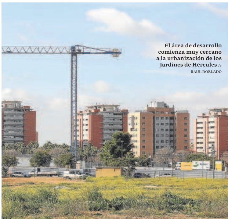
El área de desarrollo comienza muy cercano a la urbanización de los Jardines de Hércules //

El tren iría en superficie en esta parte. Al menos así está dibujado en el plan parcial y en las infografías que se han mostrado del proyecto. Para sortear este obstáculo se han previsto pasarelas y pasos subterráneos que conecten la urbanización.