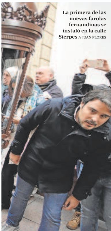
La primera de las nuevas farolas fernandinas se instaló en la calle Sierpes

Molina, Estrella, Joaquín Romero Murube, Plaza de la Alianza, Rodrigo Caro, Plaza de Doña Elvira, Pasaje Vila y Pasaje Andreu. Con un importe de más de 300.000 euros, se instalarán también en las calles Consuelo, Callejón del Agua, Vida, Pimienta, Justino de Neve, Susona, Antonio El Bailarín, Mezquita, Antonio Nicolás, Cano y Cueto, Ximénez de Enciso, Jamerdana, Mesón del Moro, Santa Teresa, López de Rueda, Reinoso, Carlos Alonso, Cruces, Doncellas, Mariscal y Santa María la Blanca, además de en las plazas Alfaro, Santa Cruz, Refinadores, Los Venerables, Escuela de Cristo y los Jardines de Murillo.