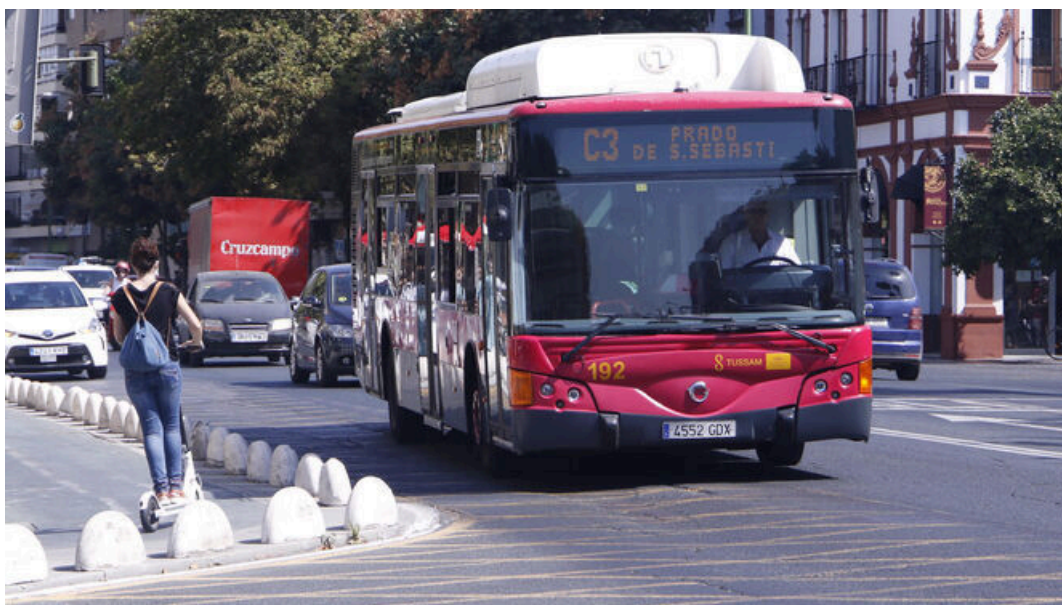
Estos son los descuentos de hasta el 50% que mantiene Tussam en 2024

En Sevilla, el año 2024 comienza con una excelente noticia para todos los que cojan el transporte público: la empresa municipal de transportes, Tussam , ha decidido mantener los descuentos del 50% en la mayoría de sus tarifas. Esta medida, se ha convertido en un alivio económico para muchos ciudadanos, y forma parte de un esfuerzo del Ayuntamiento de Sevilla y el Ministerio de Transportes, Movilidad y Agenda Urbana (MITMA) para fomentar el uso del transporte público y aliviar la carga económica de las familias sevillanas en el contexto de inflación actual.