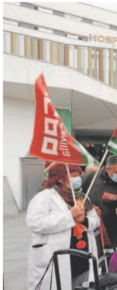
Protesta de los sindicatos por la situación de la sanidad ayer en el Virgen Macarena de Sevilla

El Gobierno andaluz mantiene un crítico discurso con esta falta de financiación que, no obstante es más elevada para la comunidad autónoma andaluza que para otros territorios españoles como el propio País Vasco: «En este esfuerzo sin precedentes para mejorar la dependencia en Andalucía no estamos contando con la ayuda del Gobierno de España que somete a la comunidad a una infrafinanciación», apuntan