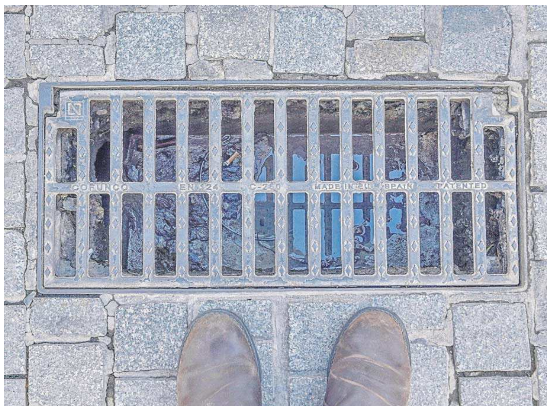
Imagen cenital de una alcantarilla en el viario público.