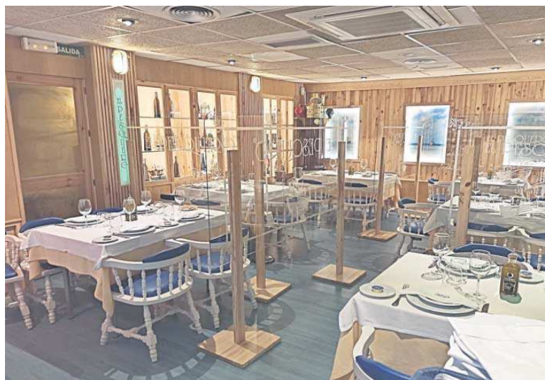
Interior de la taberna.

Pero si atrayente es la parte marisquera del establecimiento, no se queda atrás en lo del pescado. Aquí los que son de mar pueden encontrar tesoros fritos como unos lomititos delgados de rodaballo rebozados en tempura. De la