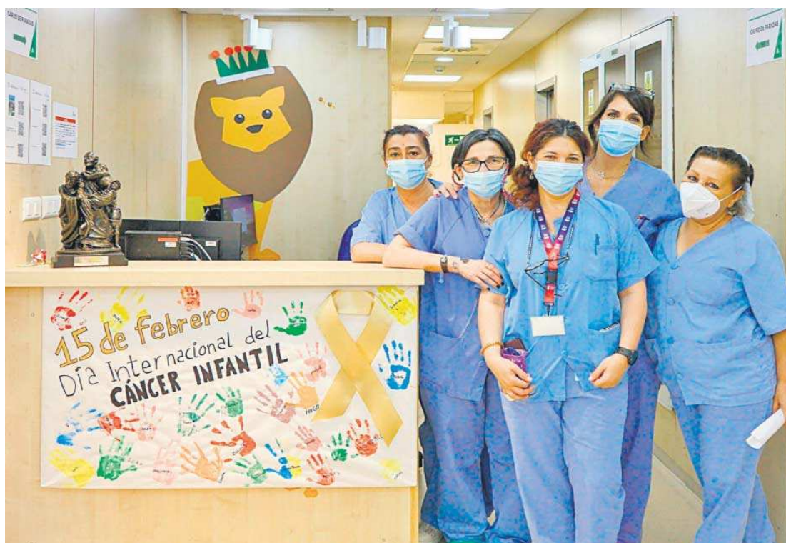
Personal de la planta de Oncohematología pediátrica del Hospital Infantil.

● La unidad de Oncohematología Pediátrica trabaja centrada en la cura y para minimizar secuelas