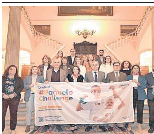
La corporación municipal en el Ayuntamiento junto a la Fundación Aladina.

R. S. Cada año se diagnostican unos 80 nuevos casos de cáncer infantil en el Hospital Infantil del Virgen del Rocío. La buena noticia es que cada vez el diagnóstico es más precoz, los tratamientos son más personalizados y eficaces y la tasa de curación también se incrementa progresivamente hasta alcanzar ya el 82%. En el Día Internacional del Cáncer Infantil, celebrado cada 15 de febrero y que se dedica a los largos supervivientes de esta enfermedad, el centro sevillano puso en valor la labor de los profesionales de la unidad de Oncohematología Pediátrica, no sólo centrada en la cura de la enfermedad, sino también en aumentar la calidad de vida del paciente minimizando sus secuelas.