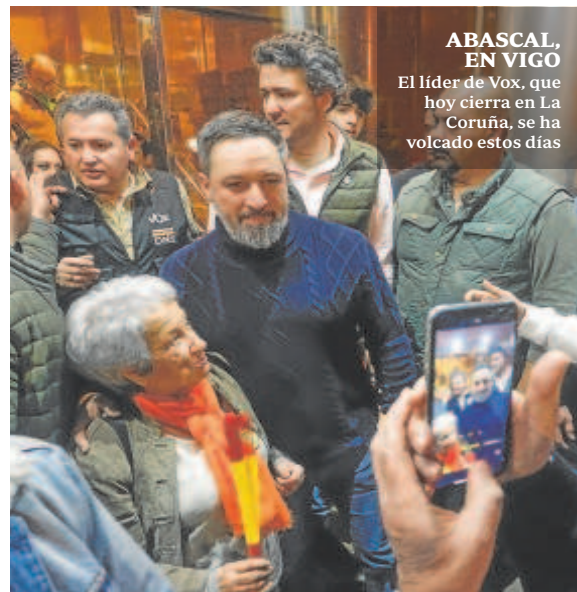
ABASCAL, EN VIGO El líder de Vox, que hoy cierra en La Coruña, se ha volcado estos días

Ayer, desde Vigo, la presidenta madrileña, Isabel Díaz Ayuso, una figura en el PP capaz de tener predicamento en el electorado fronterizo con Vox, apuntaló este discurso. «Toda papeleta que no vaya al PP irá para el BNG», proclamó: «Ojo al nacionalismo, que allí donde se instala no sale y España no aguanta ya más nacionalismos».