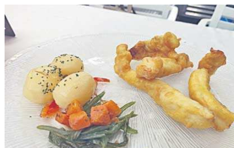
Rodaballo rebozado de El Pesquero.

misma forma se sirven las "románitas", troncos de cigalas hechos de la misma forma al estilo del famoso restaurante Antonio de Zahara de los Atunes.