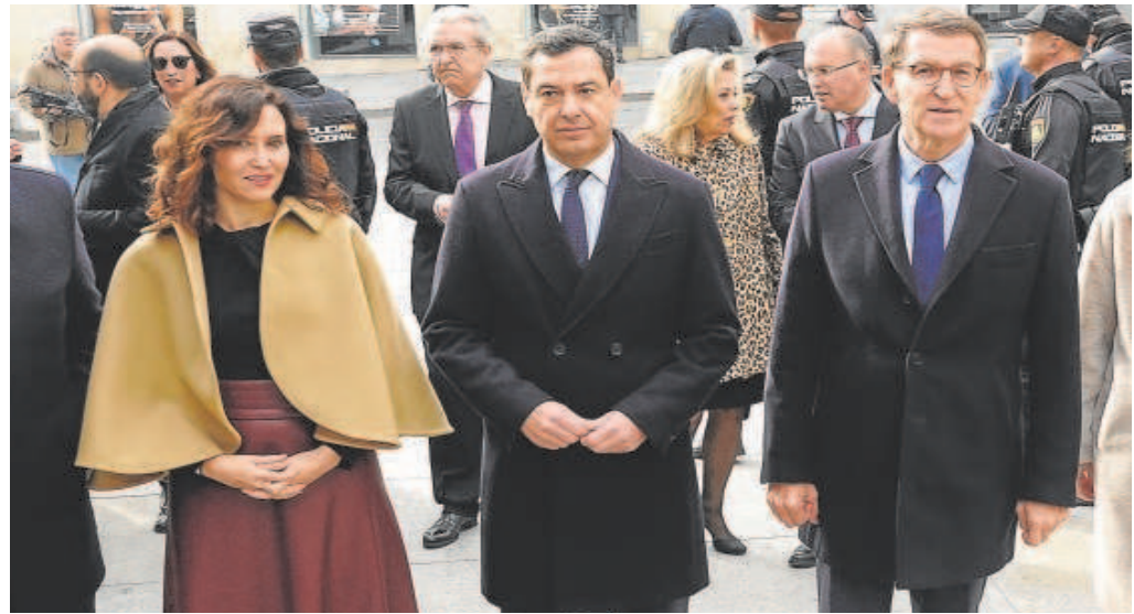
Isabel Ayuso, Juanma Moreno y Alberto Núñez Feijóo, el pasado 6 de diciembre a su llegada al Congreso de los Diputados para celebrar el 45 aniversario de la Constitución

Como ocurrió en la campaña de las elecciones generales de julio, ningún 'barón' popular se va a desmarcar en el cierre de filas con Feijóo ni va a mostrar ambiciones. Pero nadie duda de que si el PP pierde la mayoría absoluta en Galicia, el actual presidente quedará debilitado frente a un Pedro Sánchez que volvería a imponer una mayoría de izquierda y extrema izquierda, liderada en este caso por el BNG. En este sentido, la gran mayoría de las encuestas apuntan a una nueva mayoría absoluta del PP -cifrada en 38 diputados-, menos la del Centro de Investigaciones Sociológicas (CIS), según la cual los populares se entre los 34 y los 38 diputados. Este sondeo otorgaba al BNG una gran subida en intención de voto que lo situaría en el 33,4% y una horquilla de entre 24 y 31 escaños. La situación recuerda inevitablemente a la de las generales de julio, cuando la mayoría de las encuestas concedían la mayoría absoluta a Feijóo y el CIS apostó por una mayoría de izquierdas e independentistas que finalmente se dio. No es el único dato que provoca el 'deja viu', ya que la última semana de campaña del PP está siendo poco afortunada, con el comentario 'off the record' de Feijóo sobre la amnistía. La ausencia de Alfonso Rueda