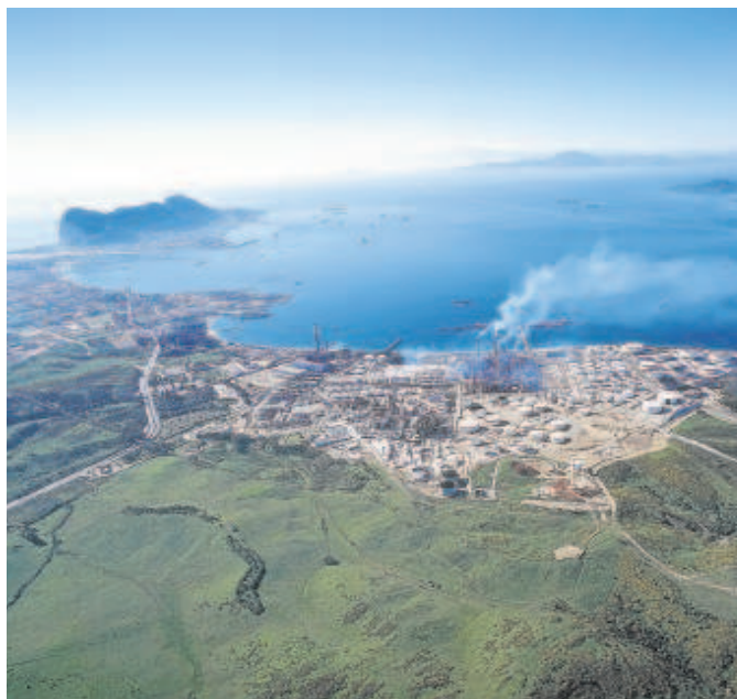
Vista aérea de la Bahía de Algeciras con el Peñón al fondo