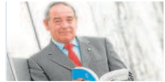
Manuel Titos Mérito Medioambiental