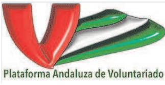
Plat. And. de Voluntariado Solidaridad y Concordia