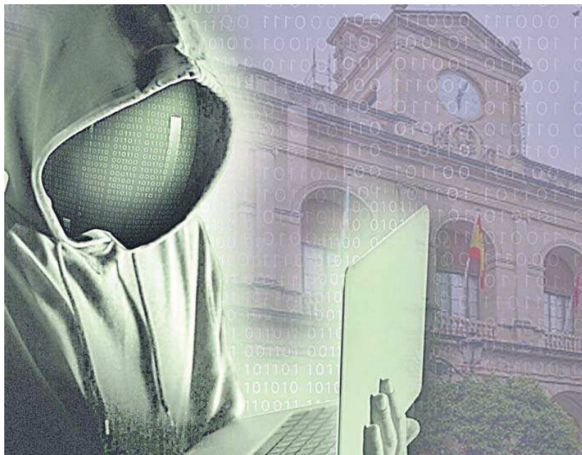
El ciberataque se produjo el 5 de septiembre y se asoció a un grupo conocido como LockBit.

La Agencia británica contra el Crimen, de este modo, asegura que ha "tomado el control del entorno de administración primaria de LockBit", que permitía a los miembros del grupo armar y lanzar los ataques informáticos; controlando además el sitio de la organización en la dark web o internet oscura, donde los miembros de la misma alojaban los datos robados en sus acciones con la "amenaza" de su publicación. Los agentes, además, han conseguido el código de la plataforma inicial de LockBit y una gran cantidad de información de sus sistemas sobre las actividades del grupo criminal y sobre quienes han trabajado con el mismo y usado sus ser-