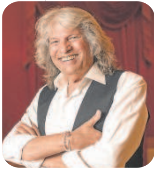
José Mercé Cantaor