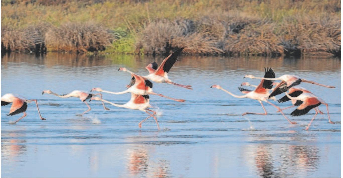
Varios flamencos en una laguna del Parque Nacional de Doñana