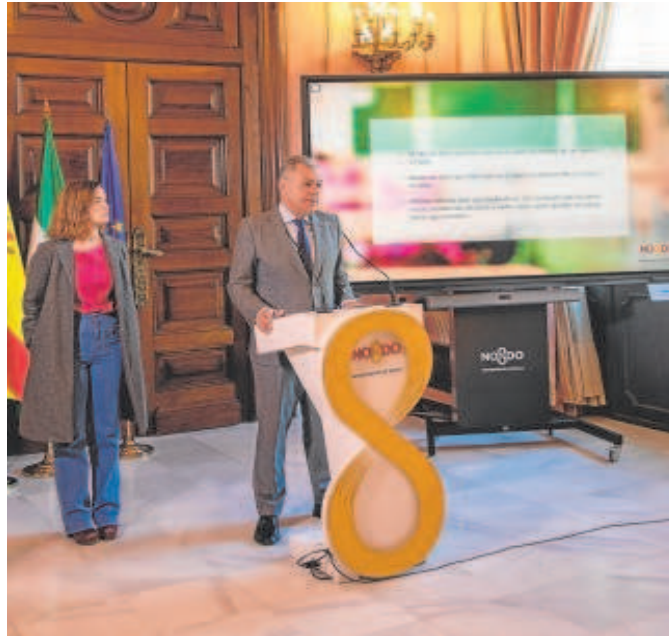
El alcalde de Sevilla, José Luis Sanz, durante su comparecencia

En el plan del Consistorio se espera que «dentro de tres años y medio, los 109 colegios públicos de Sevilla estén en perfecto estado», según apuntó el alcalde. Otra de las medidas que se llevarán a cabo es que los colegios pasarán a formar parte del área de educación y dejarán de pertenecer al