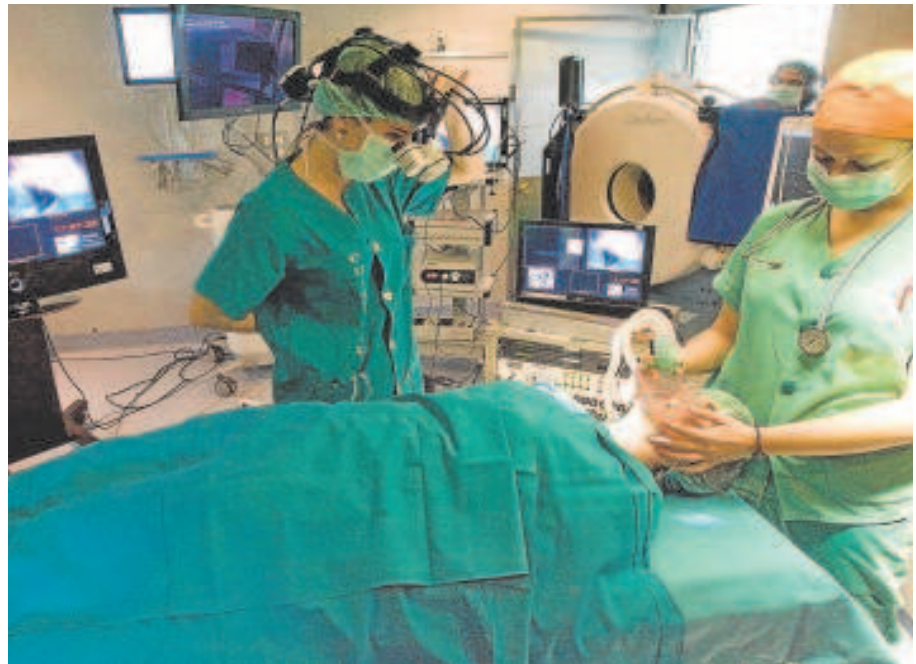
Sanitarios en un quirófano en una imagen de archivo

El último contrato que firmó la Junta de Andalucía en manos del PSOE con la empresa José Manuel Pascual Pascual S.A. estuvo en vigor entre los años 2011 y 2014. De dicho contrato se firmaron sendas prórrogas, una el 31 de enero de 2014 y otra el 31 de octubre de 2015, que fueron posteriormente anuladas por los tribunales generando nuevas deudas entre la empresa privada y el SAS. Tras una larga negociación, a finales de 2022, el Ser-