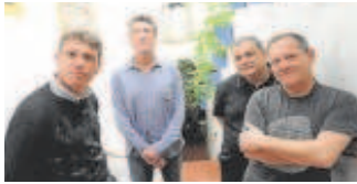
Danza Invisible Artes