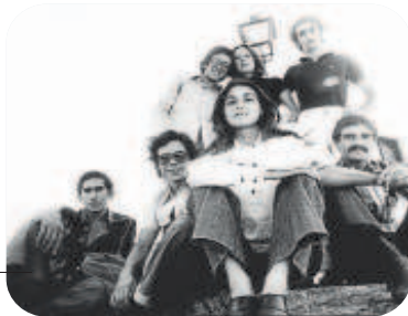
Jarcha Grupo musical