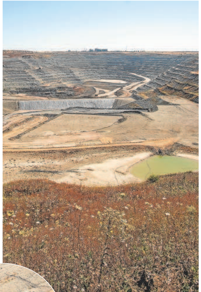
La mina de Cobre Las Cruces y varios vehículos en sus inmediaciones

Las perspectivas de venta en Cobre Las Cruces son buenas después de que hayan sido varias las compañías interesadas en conocer este proyecto de First Quantum que cuenta con el respaldo de las administraciones