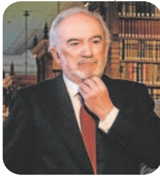
Santiago Muñoz Machado Jurista y Dtor. RAE