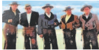
Los Romeros de la Puebla Artes