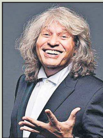
José Mercé Cantaor

Academias de la Lengua Española, vicepresidente de la Fundación pro Real Academia Española y consejero nato de Estado. En 2019 fue presidente del Instituto de España.