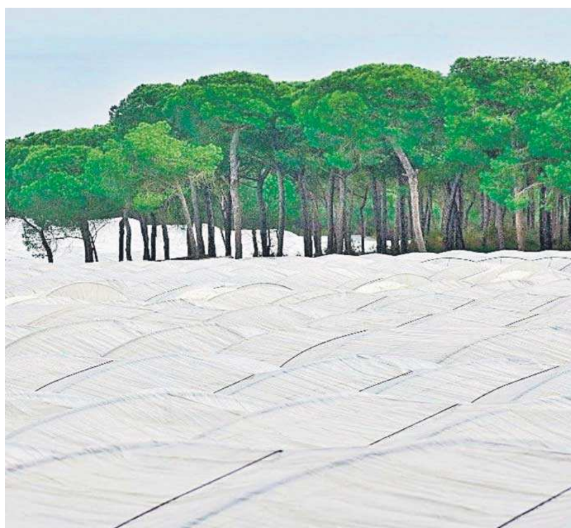
Cultivos en plena masa forestal en el entorno del Parque Nacional de Doñana.

A pesar de que no se han conocido detalles sobre el encuentro de la tarde de ayer, poco más tarde