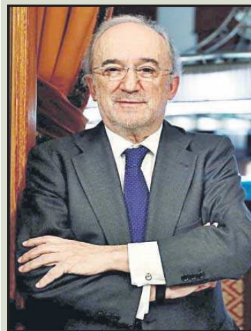
Santiago Muñoz Machado Jurista y académico

da vocación humanística y profundo espíritu innovador, fue elegido en diciembre de 2018 trigésimo primer director de la Real Academia Española y reelegido en diciembre de 2022. Como director de la RAE es también presidente de la Asociación de