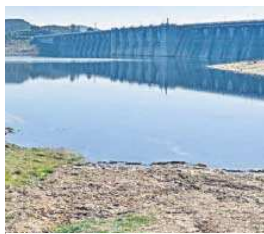
El pantano de Aracena. JUAN CARLOS VÁZQUEZ