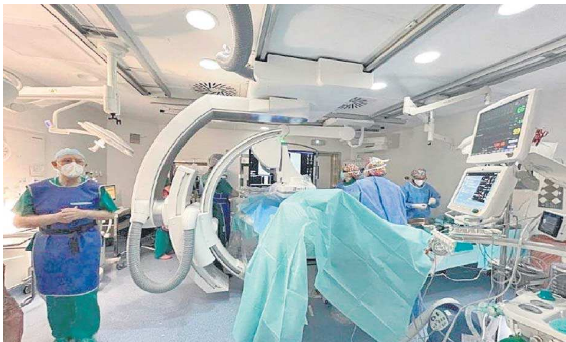
Un quirófano del hospital clínico de Málaga.