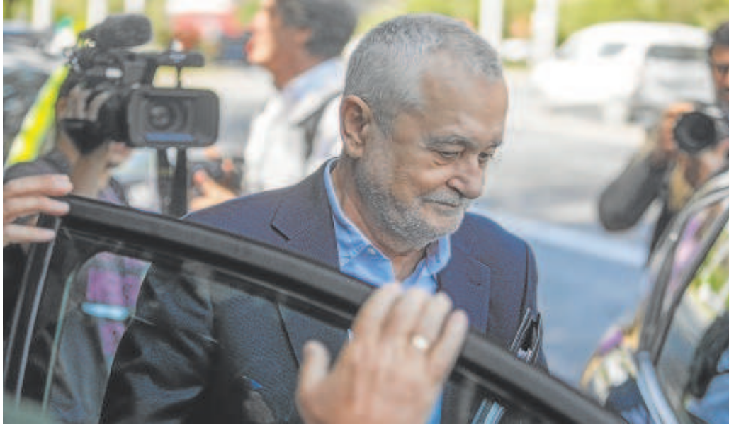
El expresidente de la Junta de Andalucía José Antonio Griñán, a su salida de los juzgados de Sevilla