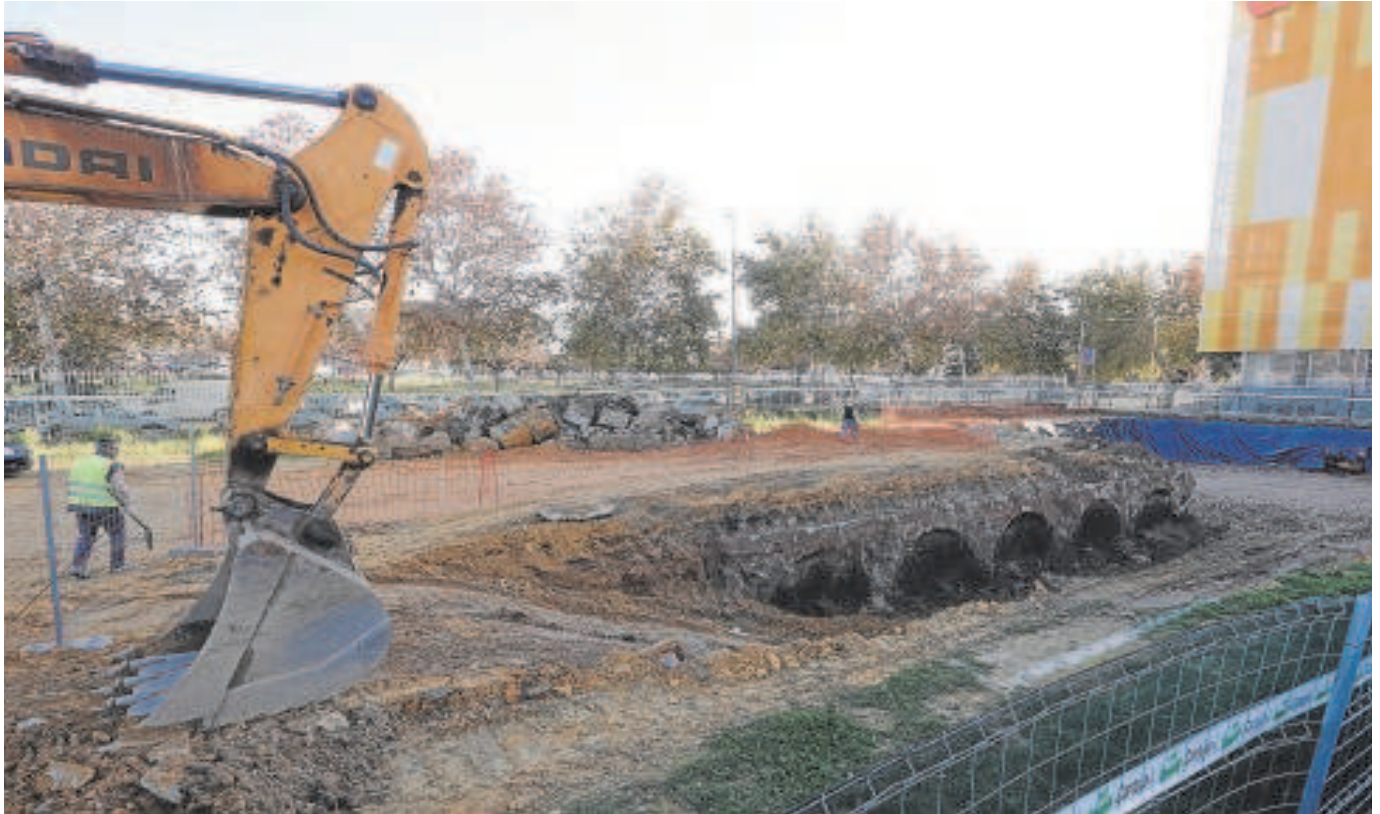
La estructura ferroviaria que apareció el mes pasado en Santa Justa