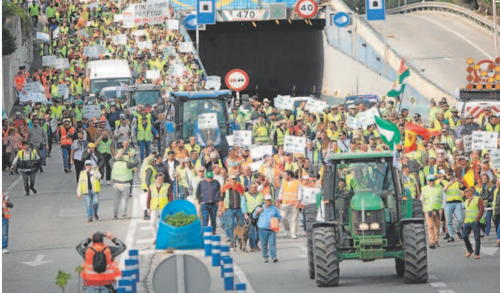
Agricultores de toda Andalucía acudieron ayer a la manifestación convocada en Algeciras