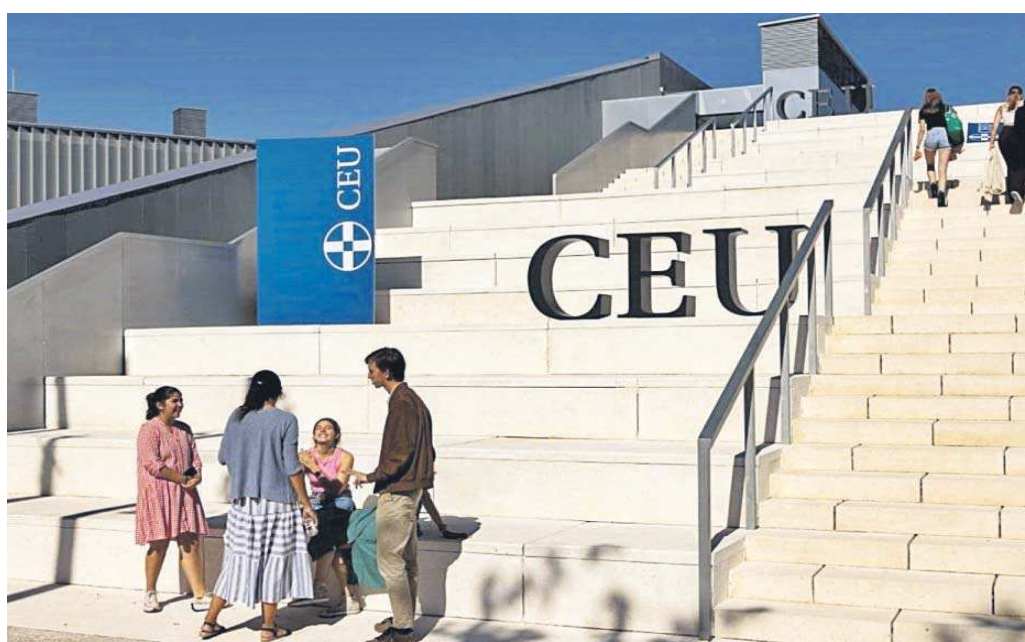
Estudiantes en una de las universidades del CEU en España.

La relación se completa con los seis dobles grados en Derecho más ADE; Marketing y Gestión Comercial más ADE; Relaciones Internacionales (RRII) más Derecho; ADE más RRII; ADE más Inteligencia de Negocios; y Educación Infantil más Educación Primaria. El precio de estas carreras oscila entre los 7.351 euros del primer curso en Derecho o en Educación Infantil a los 9.211 euros que cuesta el de Ingeniería Informática. En los dobles grados la tarifa alcanza los 10.111 euros en titulaciones como Derecho más ADE. Tales cantidades (que incluyen la matrícula) se pueden fraccionar en 12 mensualidades.