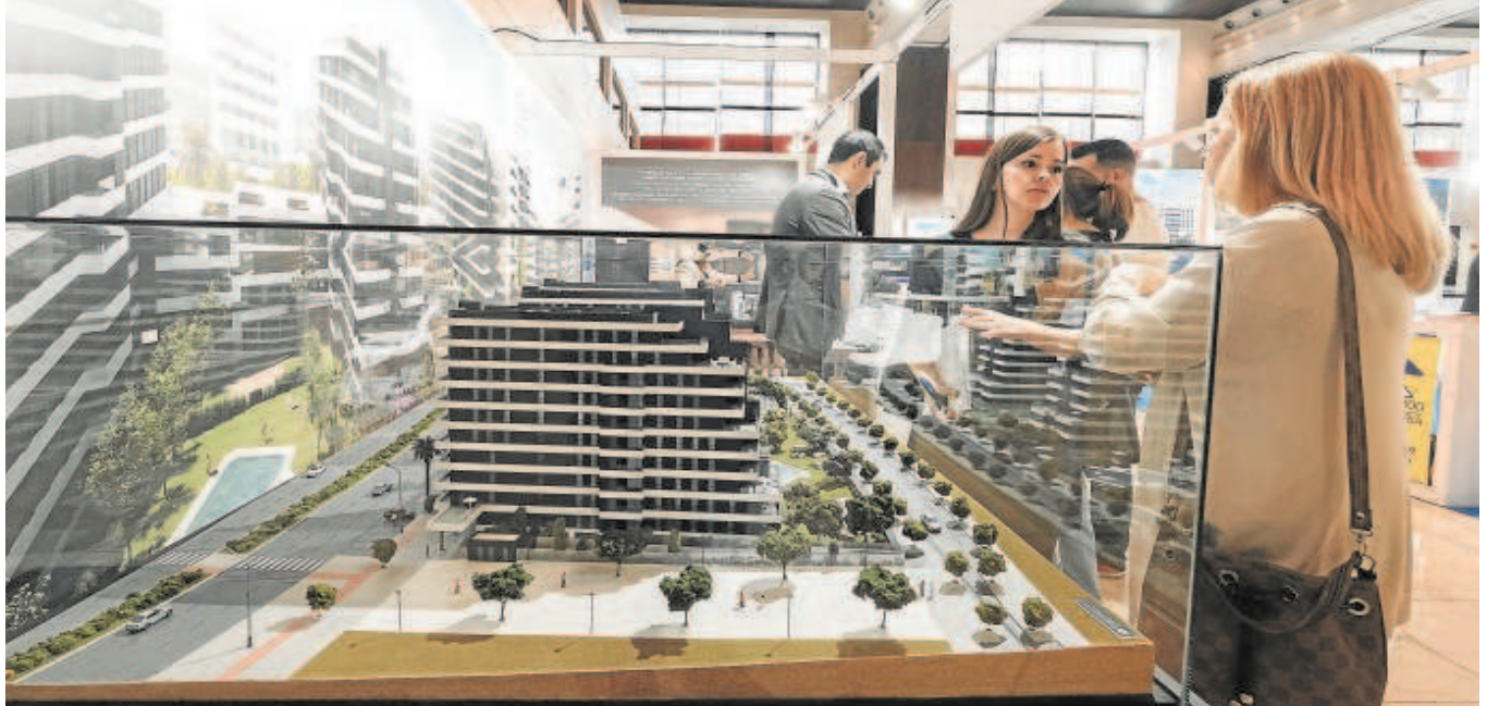
Visitantes durante la última edición de Welcome Home Sevilla