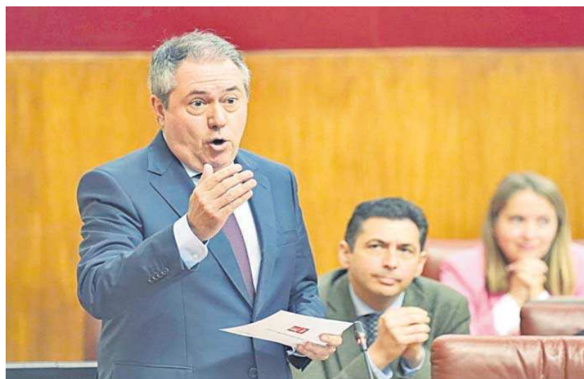
Juan Espadas se dirige a Juanma Moreno, ayer en la sesión de control en el Parlamento.