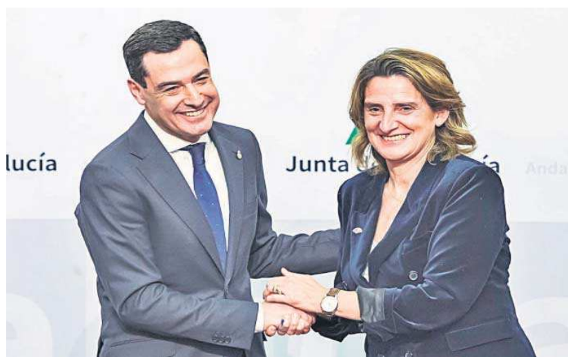
Juanma Moreno y Teresa Ribera, ayer en el Palacio de San Telmo.

La vicepresidenta aseguró que el Gobierno central tiene localiza-