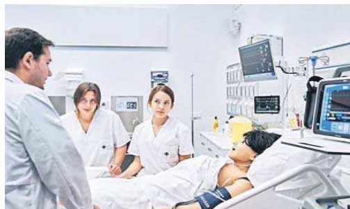
Aula de simulación sanitaria de la que dispondrá la Fernando III.

Especial relevancia cobra en el alumnado el sistema de becas del CEU. De los 43.000 alumnos que tiene en todo su sistema de enseñanza español, casi 6.000 reciben ayudas económicas para facilitar la permanencia educativa, compatibles con las que otorgan las administraciones públicas. Esta labor supuso un desembolso el pasado curso de 17 millones de