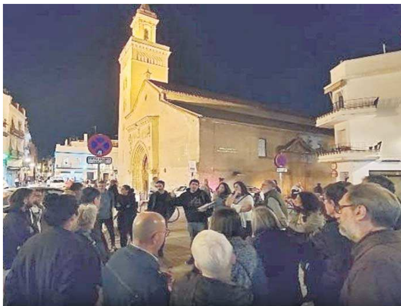
El punto de encuentro de los vecinos fue la plaza de San Marcos.

Como conclusiones de la asamblea, los asistentes decidieron promover una plataforma con diferentes agentes asociativos del barrio para luchar contra la proliferación de los apartamentos turísticos en el casco antiguo. También se planteó la necesidad de crear una oficina de asesoramiento al vecindario para brindar apoyo e información sobre sus derechos, tanto a aquellas personas que tienen en riesgo su contrato de alquiler debido a la presión de los pisos turísticos como a las comunidades de vecinos