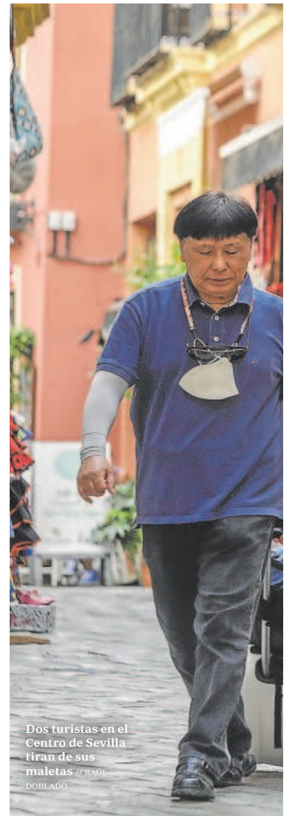
Dos turistas en el Centro de Sevilla tiran de sus maletas

Estos núcleos saturados son principalmente Santa Cruz, el Arenal, la Alfalfa, San Bartolomé, Feria, Encarnación, Santa Catalina y la zona histórica de Triana. Sólo se libran el Museo y San Julián, donde no habrá restricciones. La intención a futuro no es sólo dificultar la apertura de nuevas licencias en estos barrios, sino reducir el número de las que ya están en vigor, pues tras un exhaustivo estudio, los servicios municipales han concluido que sobran 2.750 viviendas turísticas por ejercer una fuerte presión sobre los residentes y los negocios tradicio-