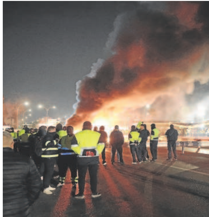
Barricadas en el inicio de la huelga indefinida en Acerinox

Por su parte, la compañía no considera rotas las negociaciones, ya que el próximo jueves está convocada una reunión preceptiva en el Sercla. El 31 de enero envió a la plantilla un comunica-