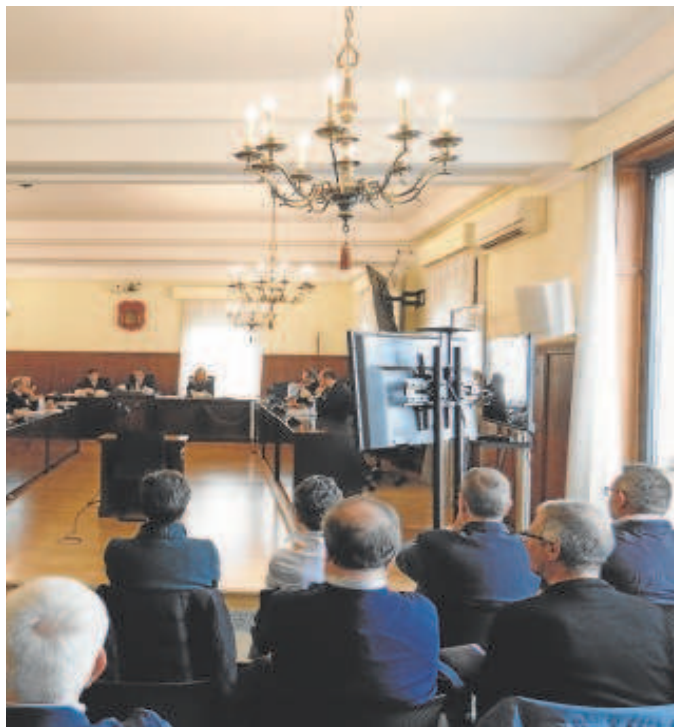
Acusados, de espaldas en el juicio contra la antigua cúpula de UGT-A

Durante el interrogatorio, el fiscal Anticorrupción le indicó al testigo que había «una diferencia entre lo facturado [por Sorralpe a la UGT-A] y lo no facturado de 1,6 millones de euros», según