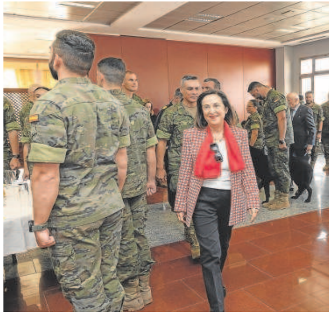
Margarita Robles, ministra de Defensa, ayer en Las Palmas con militares

Asfaspro, AUME, ATME, UMT y Aprofas denuncian «el desprecio y la falta de respeto» del ministerio hacia sus profesionales desde hace más de cuatro años en materia retributiva y exigen una solución que se plasme ya en el proyecto de presupuestos para 2024 que el Gobierno presente ante el Congreso de los Diputados. El de los sueldos en las