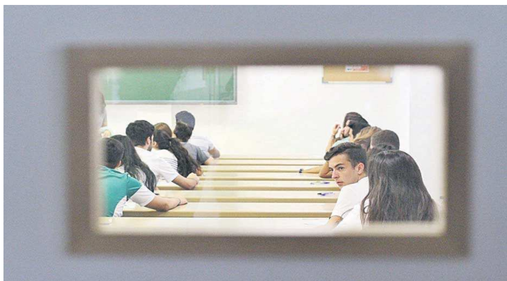
Estudiantes de la Universidad de Sevilla durante la celebración de un examen.

Las titulaciones incorporadas ofrecen especialización en diversas áreas de conocimiento: la información y comunicación (TIC), ciencias y sistemas aeroespaciales, así como las ciencias de la salud, la economía y la empresa. En el ámbito de las TIC, los estudios que han contado con el visto bueno autonómico ofrecen formación en seguridad informática, inteligencia artificial, big data o robotización. La consejería organizará los próximos días una reunión específica de coordinación con las instituciones académicas interesadas en impartirlas para optimizar sus planteamientos y organización, así como para estudiar la posibilidad de ofrecer una oferta conjunta que implique a varios campus con una visión más regional.