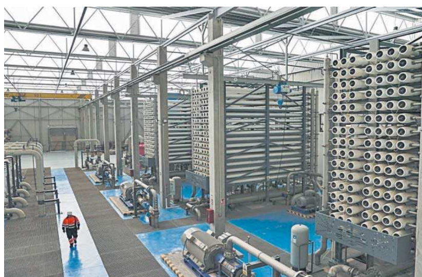
Instalaciones de la desaladora de Sagunto que abastecerá de agua a Barcelona.

Al ser preguntado por si se plantea pedir traslado de agua como el de la planta de Sagunto a Cataluña, Moreno señaló que su Gobierno tiene “abiertas ahora mismo todas las posibilidades”, algo que se estudiará conjuntamente con el Gobierno central. “Los andaluces, igual que una parte de los españoles, tienen un problema y cuando tienen un problema lo que tenemos es trabajar juntos y cooperar. Eso es lo que quiero. Y lo que sí veo es que un país es un país cuando hay un principio de solidaridad interterritorial. Si no, ya no es un país, será otra cosa”, sostuvo.