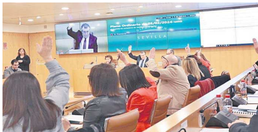
El Pleno de la Diputación celebrado ayer.

En virtud de este acuerdo se pretende establecer el régimen de colaboración para la construcción, financiación y puesta en funcionamiento de unas infraestructuras hidráulicas de abastecimiento para las poblaciones de la Sierra Sur de Sevilla, declaradas de interés de la Comunidad Autónoma en 2020