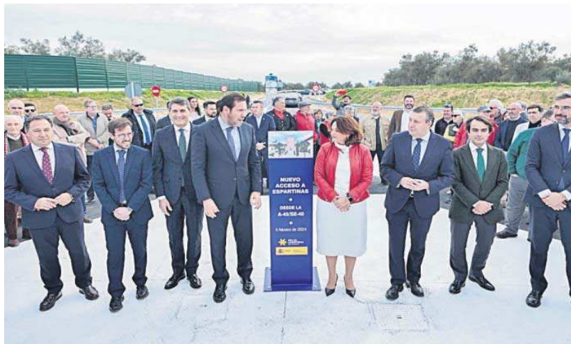
El ministro Óscar Puente y la alcaldesa Cristina Los Arcos flanqueados por algunas de las autoridades asistentes.

El ahorro de tiempo en los desplazamientos y el fin de los atascos que venían soportando es lo