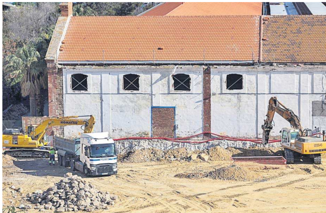
Obras para la Torre Abu, en terrenos de los Depósitos de Tabaco.