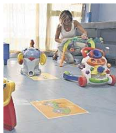
La empleada de una guardería.

En dicho documento, consultado por Diario de Sevilla , se especifica que para el próximo curso se incluirán en este tipo de convenio cinco centros de la provincia sevillana. Tres de ellos se en-