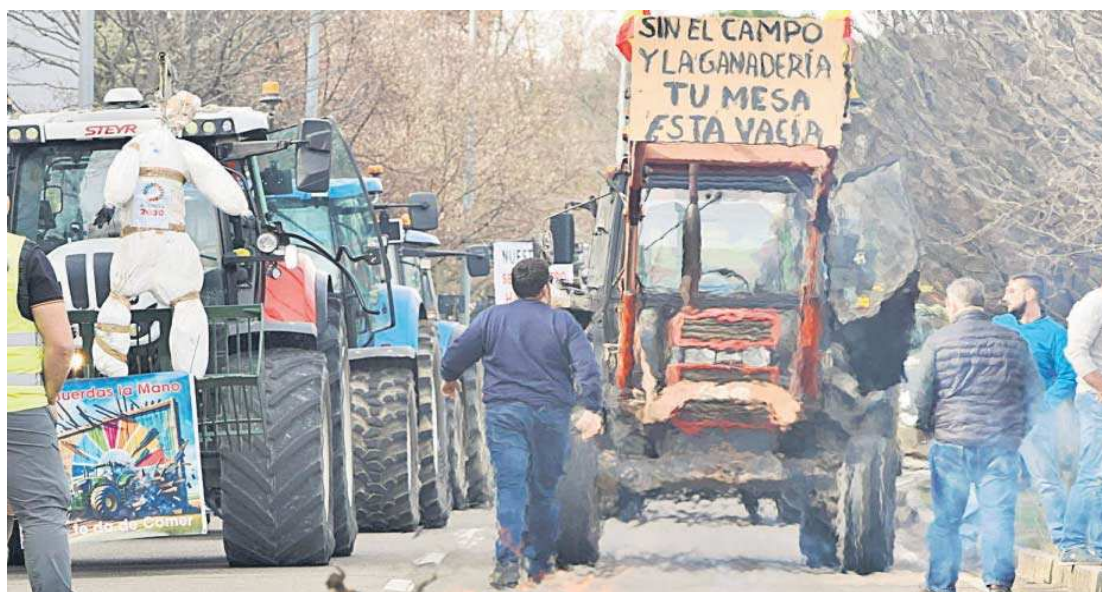
Tractorada frente a la Consejería de Agricultura de Castilla y León en Valladolid.

● Asaja, COAG, UPA y Cooperativas se manifestarán en Sevilla y Jaén el 14, en Jerez el 22 y en el Puerto de Algeciras el 21 de marzo