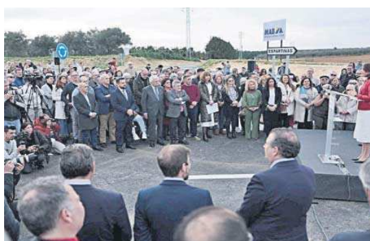
Decenas de vecinos acompañaron a la alcaldesa y le dedicaron “vivas”.

que más valoran también los vecinos, ya que en hora punta tardaban más de 20 minutos en alcanzar la A-49 por la rotonda de Gines y ahora con esta conexión directa se plantan en la autopista en muy pocos minutos.