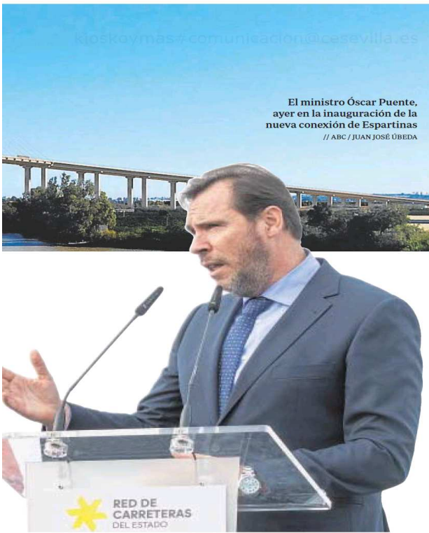
El ministro Óscar Puente, ayer en la inauguración de la nueva conexión de Espartinas

El Gobierno adjudicó hace ahora un año la redacción del estudio del mencionado enlace, que tiene un plazo de ejecución de dos años y será un ramal del Cercanías desde Santa Justa.