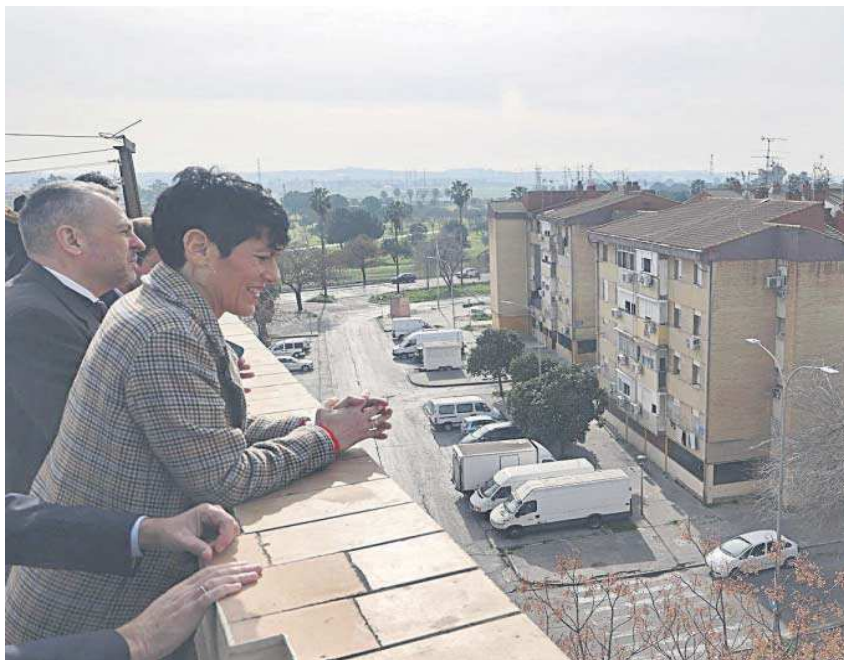
La ministra de Inclusión, Seguridad Social y Migraciones, Elma Saiz, visita la residencia universitaria Flora Tristán.