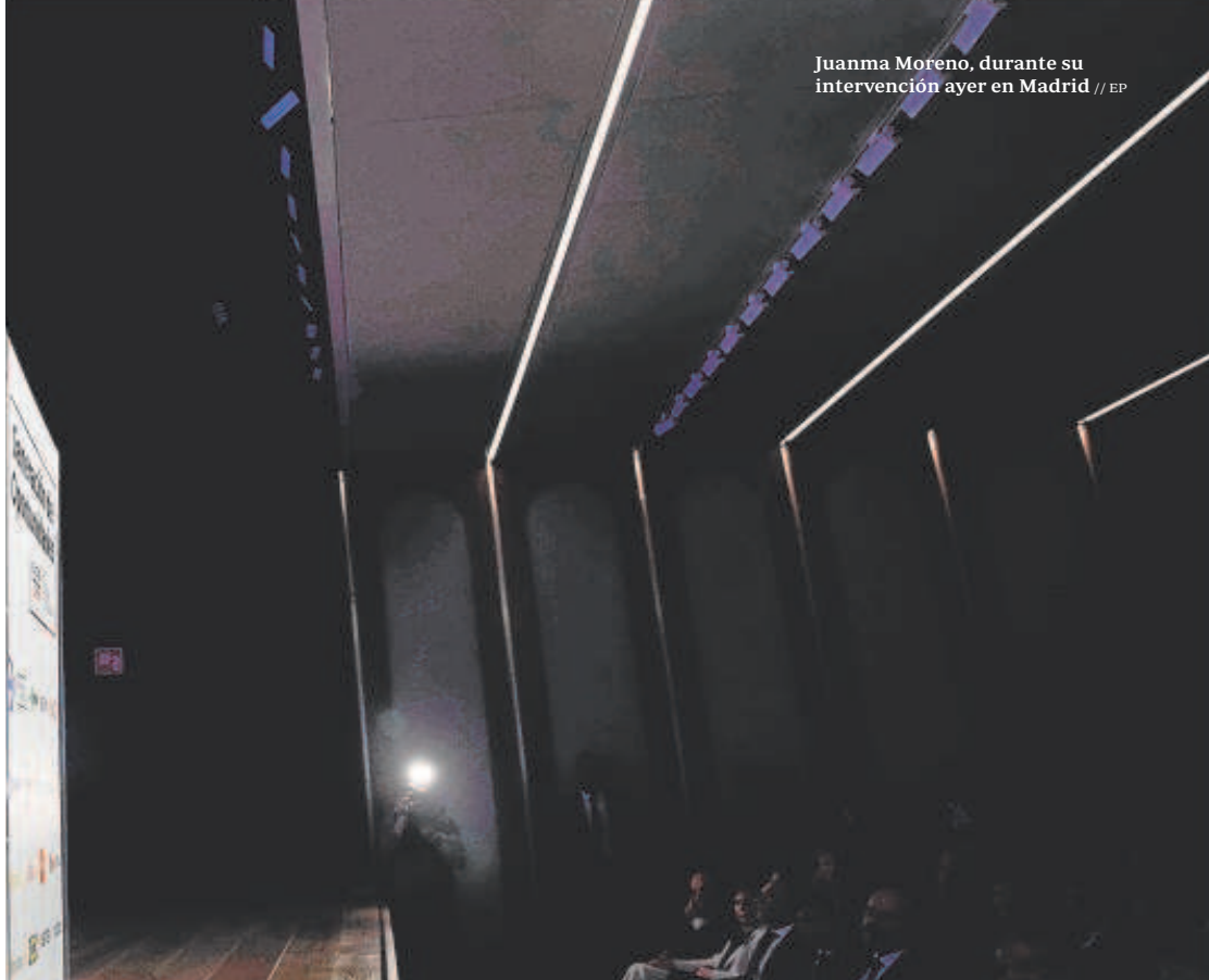
Juanma Moreno, durante su intervención ayer en Madrid

han sido «un éxito» con la tramitación «en tiempo récord» de las ayudas a más de 30.000 pymes y autónomos para compensar el sobrecoste energético.