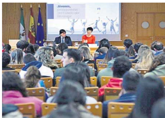
La ministra durante un encuentro con estudiantes de la Olavide. M. G.

En declaraciones a este periódico, fuentes directas del departamento de Saiz indica-