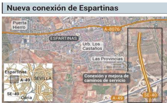
GRÁFICO: Dpto. Infografía.