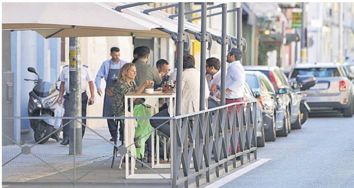
Una terraza de veladores montada sobre unas plazas de aparcamiento.