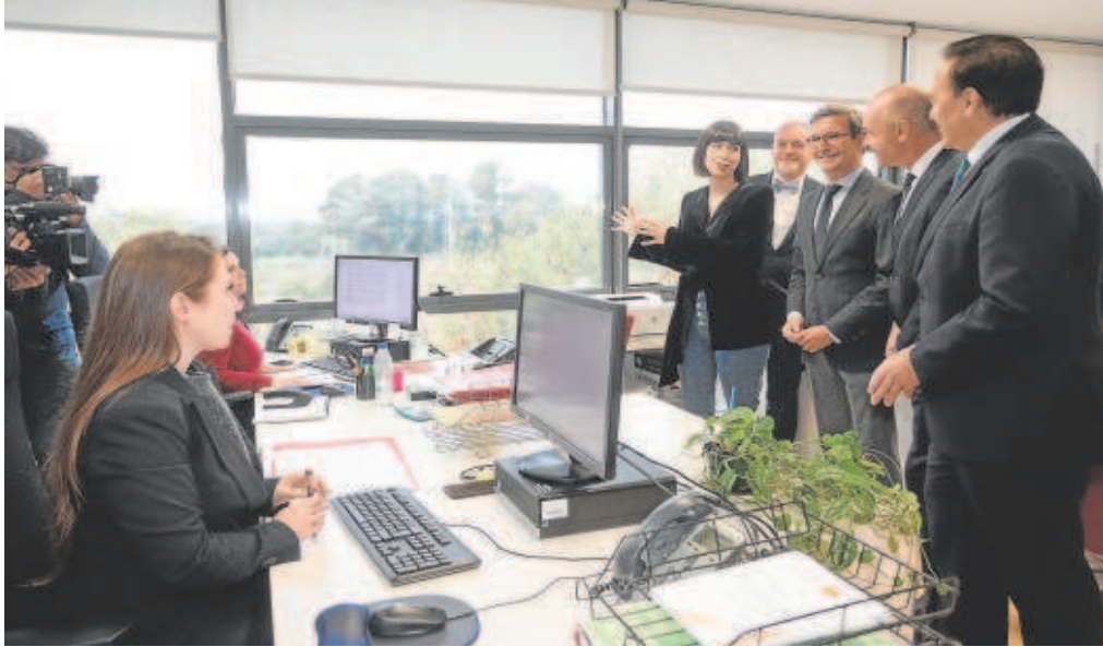
Presentación de la sede de la nueva Agencia Espacial Española en el edificio CREA de San Jerónimo