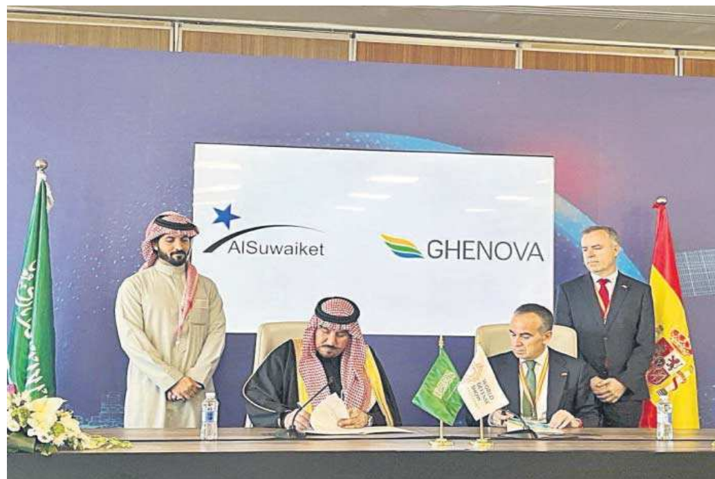
Imagen de la firma de la alianza entre Ghenova y AlSuwaiket para establecerse en el mercado de Arabia Saudí.