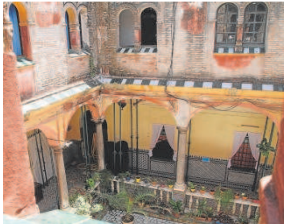
El Pumarejo se frenó por la instalación de un ascensor

Otro de víctima del colapso de Patrimonio fue sido el entorno del Casino de la Exposición y del Lope de Vega. El Ayuntamiento tuvo que contratar a una empresa para pulir las objeciones de Cultura a una obra con cuatro años de retraso, lo que obligó a elevar el presupuesto a los seis millones. Pasaron dos años hasta que llegó el reformado a la Comisión, donde estuvo frenado otros dos años. Se aprobó con condiciones en agosto de 2022. No se aceleró la licitación y, en mayo de 2023