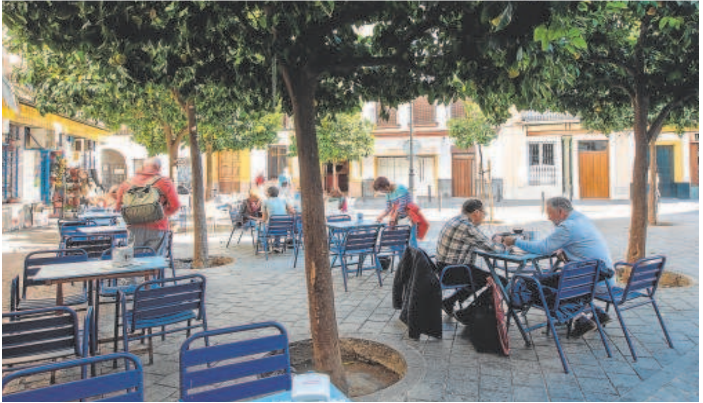
Imagen de archivo de una terraza de veladores en el Centro de Sevilla