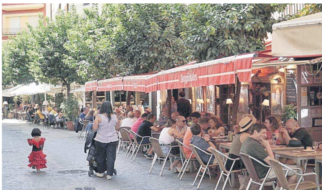
Una de las aceras de la calle Argote de Molina completamente llena de veladores.

El CESS alerta de que el exceso de uniformidad asemeja el centro a un “parque de atracciones”