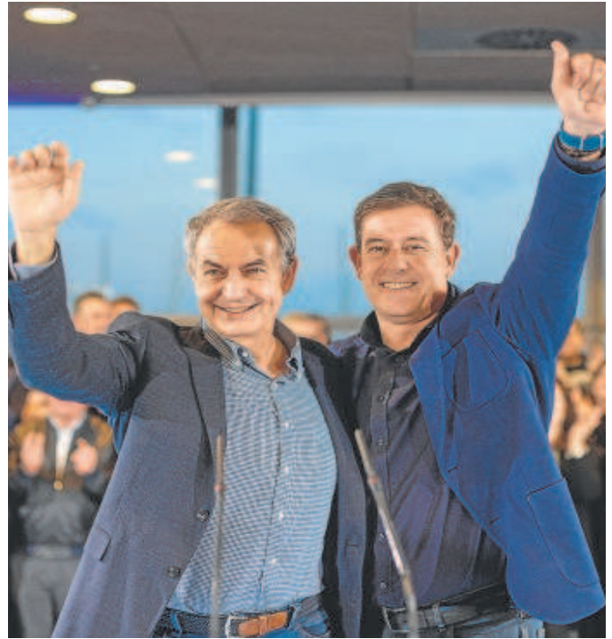
Zapatero y el candidato del PSOE gallego, ayer en el mitin de La Coruña

Un partido que necesita una gran remontada, según las encuestas, si quiere sacar al PP de la Xunta. «Hay que conjurarse para la remontada y la sorpresa política. Y esto es algo que solo lo puede hacer el PSOE y lo va a hacer el PSOE de la mano de Besteiro», apuntó Zapatero antes de resaltar la figura del candidato, actor secundario en un mitin protagonizado por el telonero. Es el factor Zapatero, que ha tocado tierra en Galicia y sobre el que los socialistas quieren impulsar su recuperación.