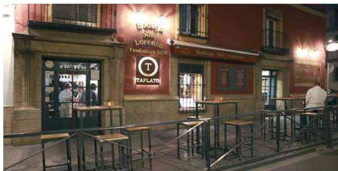
Una de las terrazas en aparcamiento que se quieren regular.

Lo cierto es que el dictamen del CESS ha salido con 20 votos a favor y 12 en contra, que corresponden a los empresarios, mientras que el voto particular de la Confederación de Empresarios de Sevilla (CES) ha obtenido sólo el apoyo empresarial, además de 17 votos en contra y 3 abstenciones. Pero el voto particular de los empresarios coincide básicamente en todas las críticas que realiza el dictamen final: falta de concreción, discrecionalidad, inseguridad jurídica y ausencia de una verdadera