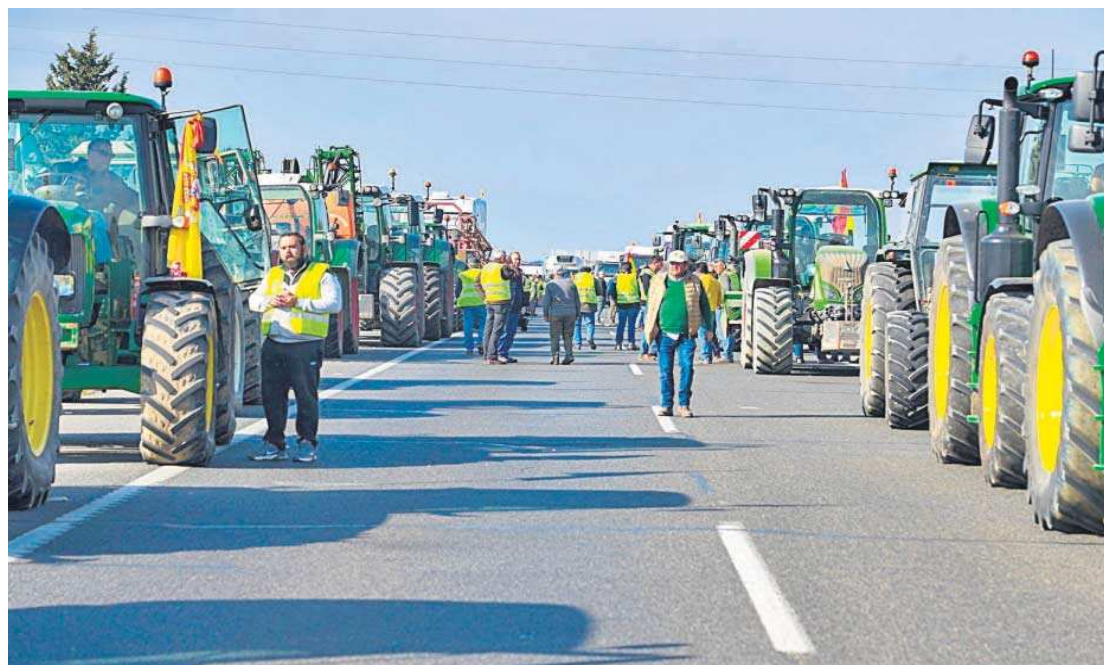
Decenas de tractores en la autovía a Madrid A-4, donde efectuaron un corte a la altura de Écija y Carmona.

El tráfico rodado se desvió hacia la Isla de la Cartuja. El transporte público sí circuló con normalidad por el puente, aunque igualmente sufrió las retenciones