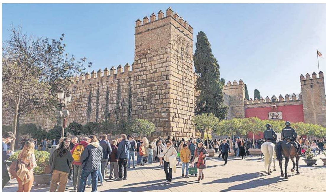
JULIO MUÑOZ / EFE