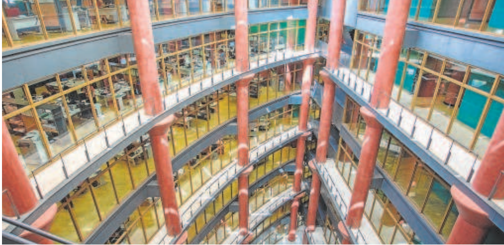
Oficinas del edificio administrativo de Torretriana, en Sevilla