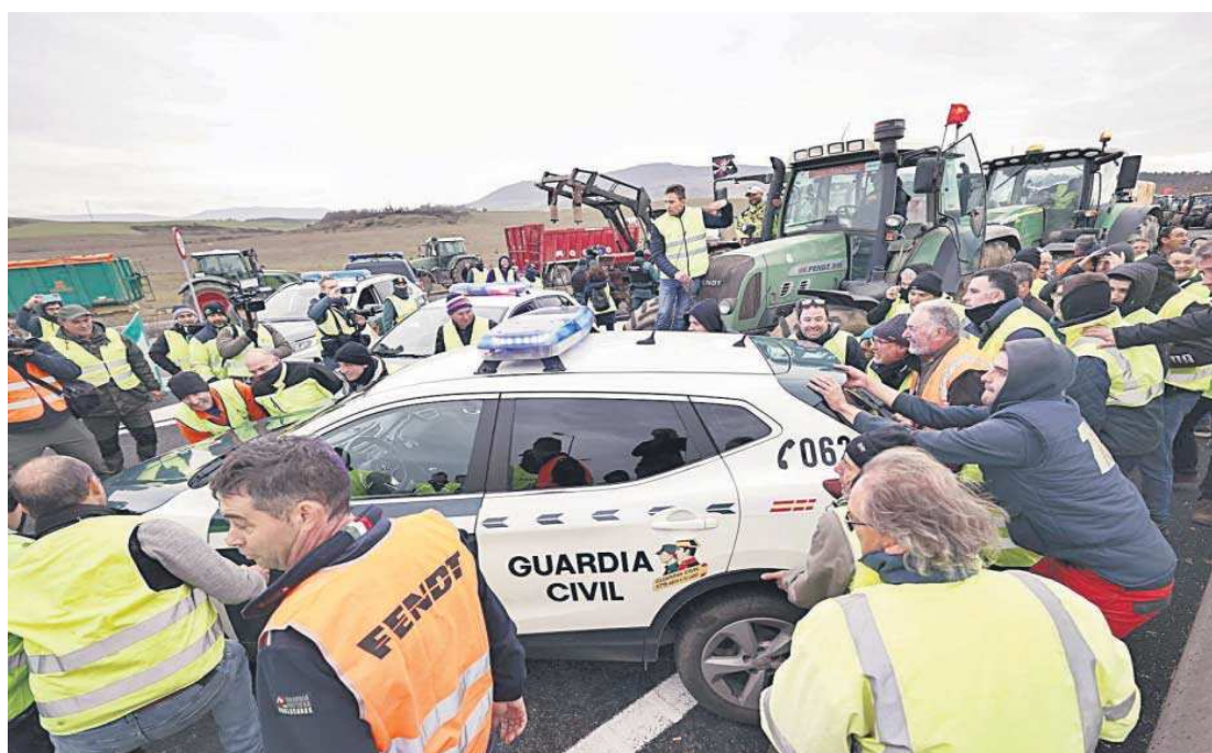
Algunos agricultores mueven un coche de la Guardia Civil que impedía el paso de los manifestantes hacia Pamplona.

Las tractoradas llegaron también a Salamanca, Logroño o Pamplona. En este último caso, los agricultores llegaron a desplazar dos vehículos de la Guardia Civil que impedían su paso hacia la capital navarra. Algunos tractores también protestaron en las inmediaciones