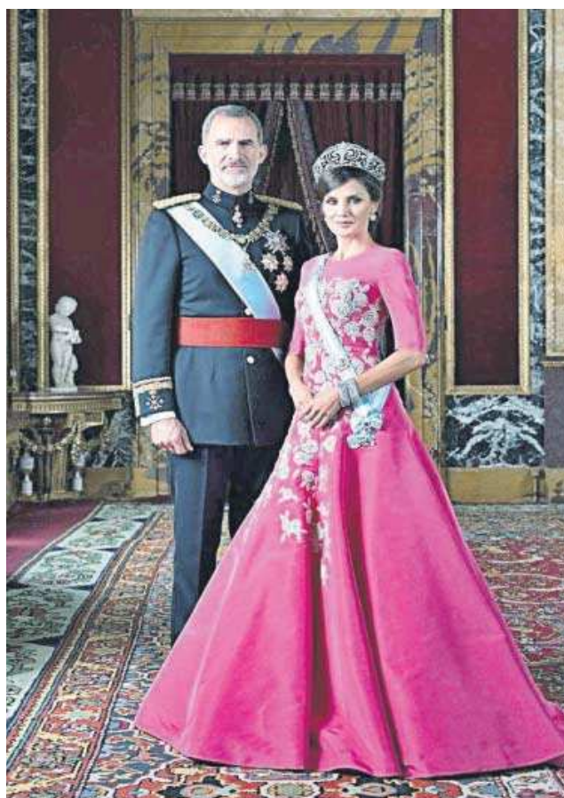
Los Reyes en su actual retrato oficial.

Se estima que la fotógrafa va a cobrar 166.000 euros por el trabajo, un ca-