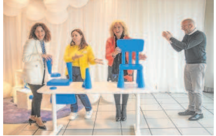
Montaje de una mesa Mammut durante la celebración

Alberto Fossati, responsable de área de mercado de Ikea, destacó que, desde sus inicios, han apostado por un ambicioso plan de expansión en Andalucía. «Es una región prioritaria y por ello hemos destinado a la región una inversión de 113 millones de euros para 2023 y 2024 y, a día de hoy, son casi 2.000 personas las que trabajan en los 13 puntos de encuentro con