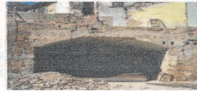
El mapa histórico de las murallas de Sevilla en el entorno monumental

Algunos autores sitúan aquí el emplazamiento de unas atarazanas almohades. Eso explicaría el gran vano existente en aquella muralla.