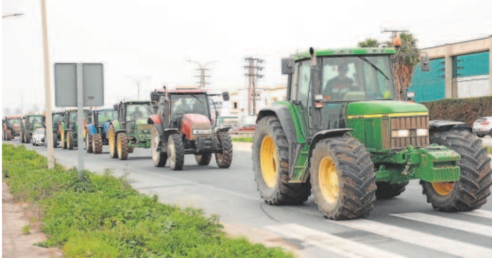
Una fila de tractores corta la carretera SE-3205 de acceso al polígono La Isla de Dos Hermanas // EP