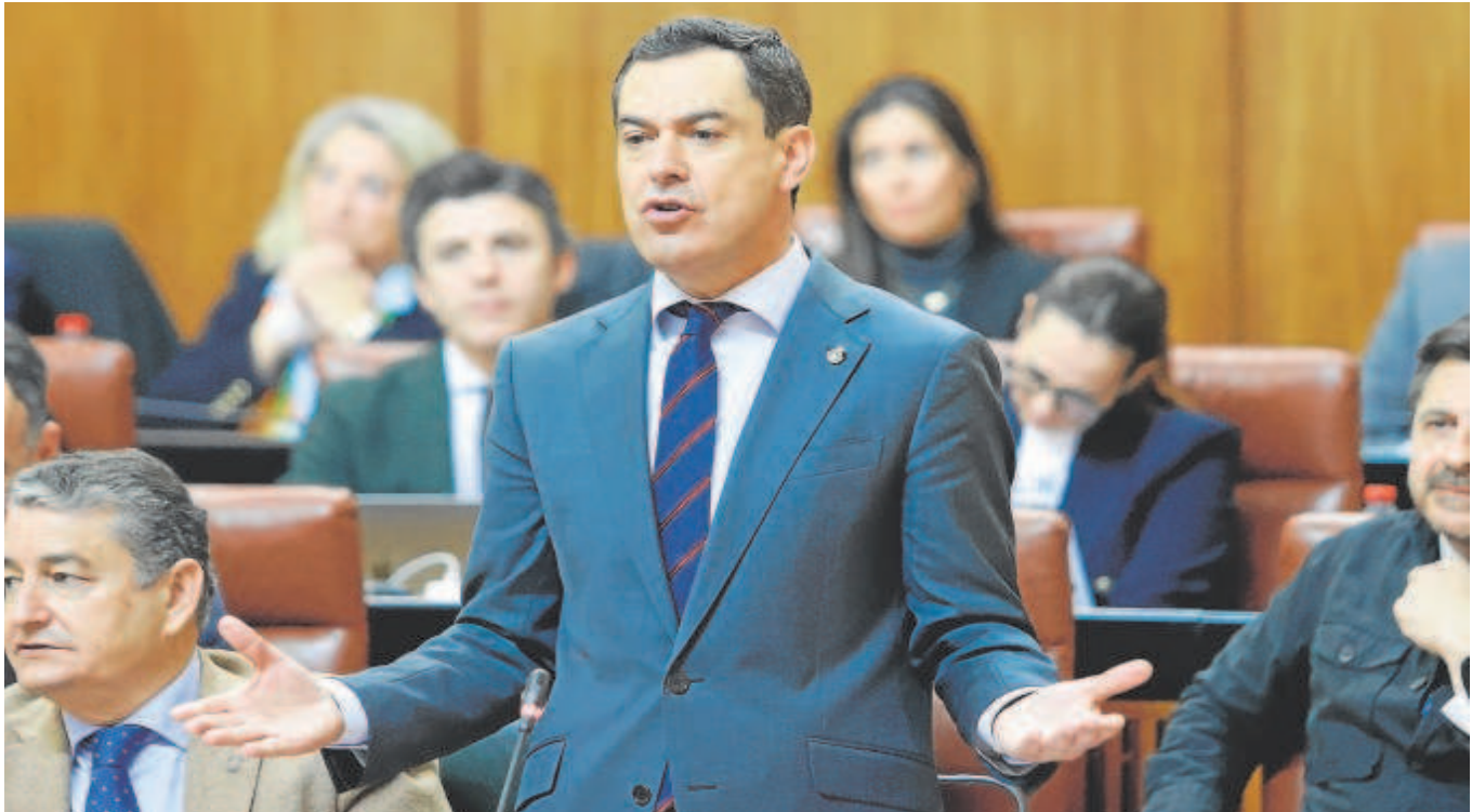
El presidente andaluz, Juanma Moreno, ayer en el Parlamento andaluz

Distribuido para CONFEDERACIÓN N DE EMPRESARIOS DE SEVILLA * Este artículo no puede distribuirse sin el consentimiento expreso del dueño de los derechos de autor.