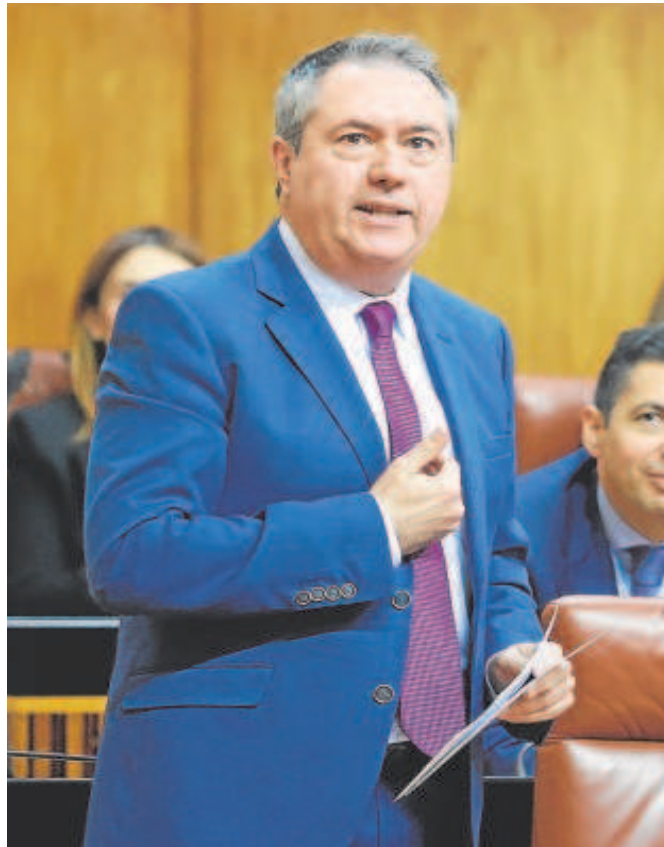
El secretario general del PSOE-A, Juan Espadas

El secretario general del PSOE-A, Juan Espadas, mantiene una estrategia distinta. En primer lugar, porque el Ministerio de Hacienda no es partidario de asumir la responsabilidad de asignar un gasto extraordinario de más de 3.000 millones de euros sólo para cuatro comunidades autónomas, dado el malestar que puede provocar en otros territorios. En segundo lugar, porque su propuesta, que viene reforzada por su papel como portavoz en el Senado, es que se abor-