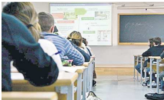
Aula de la Universidad de Sevilla.

miento, el alumnado que concluye estudios de Ingeniería y Arquitectura y Ciencias de la Salud registran los más altos porcentajes de inserción laboral, por encima del 80% (83% y 81% respectivamente). Después se sitúa la rama de Ciencias, con un 70% de empleabilidad; Ciencias Sociales y Jurídicas, con un 66%; y Artes y Humanidades, con un 55%.