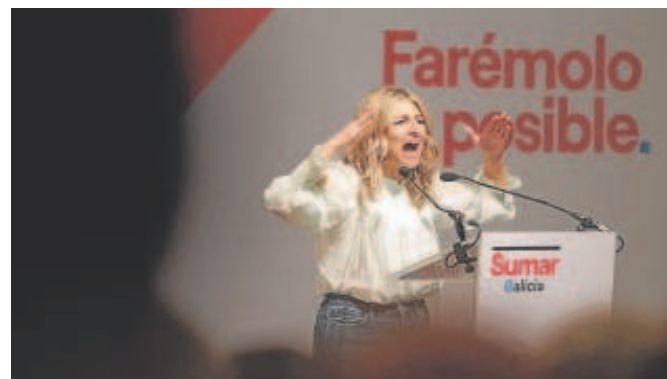
Yolanda Díaz, en el Palacio de la Ópera de La Coruña

Lois aprovechó el acto para hacer algunos anuncios electorales que serán realidad si Sumar forma parte del próximo gobierno gallego. Entre ellos, la implantación de un sistema de metro ligero para el área metropolitana de Vigo y La Coruña, la creación de un sistema de cuidados público o el tope de los precios del alquiler. «Medidas valientes que solo Sumar es capaz de llevar a cabo», señaló.