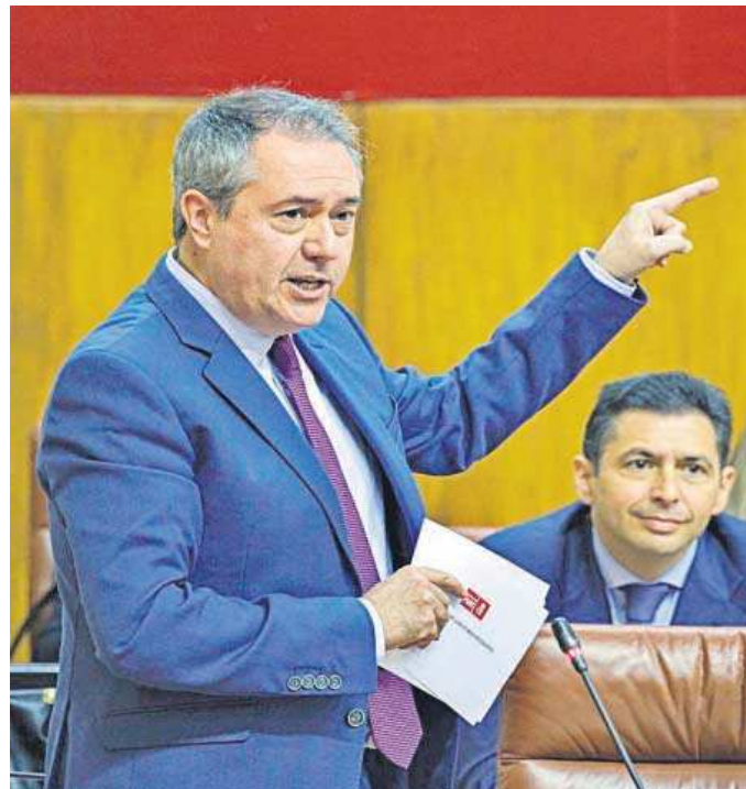
Juan Espadas durante su pregunta a Juanma Moreno en el pleno de ayer.

sible. Manuel Gavira hace de la Agenda 2030, el Pacto Verde europeo y de las tractoradas, una nueva prueba para acusar a Juanma Moreno de connivencia con el socialismo. Ayer llegó incluso a romper el papel de la declaración institucional que el PP