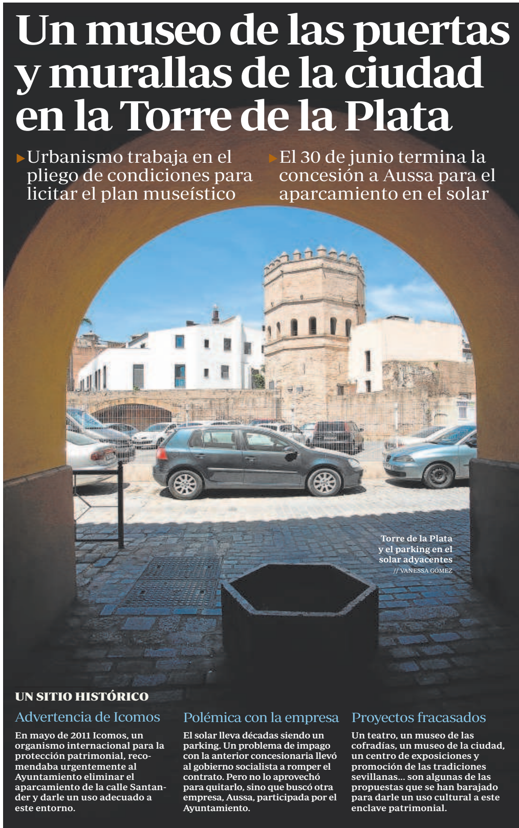
Torre de la Plata y el parking en el solar adyacentes

► El 30 de junio termina la concesión a Aussa para el aparcamiento en el solar