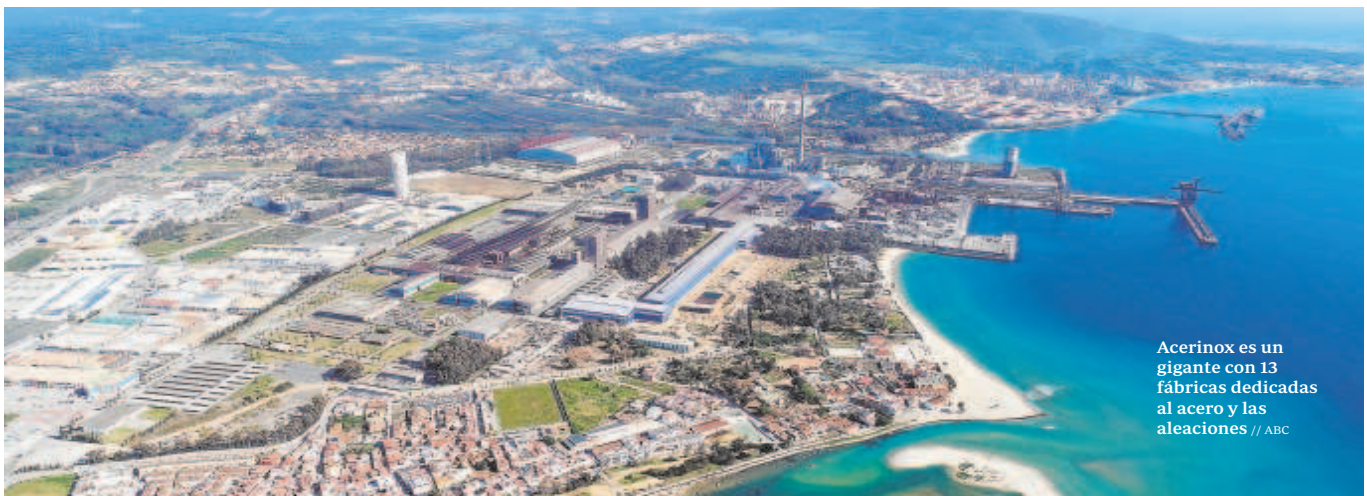
Acerinox es un gigante con 13 fábricas dedicadas al acero y las aleaciones // ABC

La planta de Los Barrios cuenta con unos 1.800 trabajadores que están en huelga desde el pasado lunes. La empresa quiere introducir mayor flexibilidad en el convenio y los sindicatos reclaman subidas salariales y mayores primas.