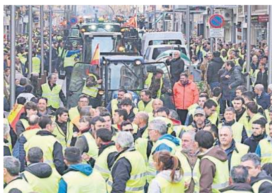
Manifestación de agricultores en Logroño.

de la vivienda de la presidenta navarra, María Chivite. En Logroño, donde la mayoría de los agricultores se manifestaron a pie con chalecos reflectantes amarillos, hubo momentos de tensión con las policías nacional y local.