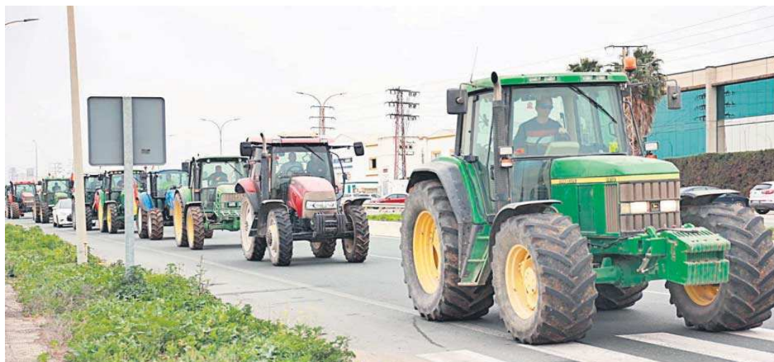
Agricultores en con sus tractores en el Polígono Industrial La Isla.