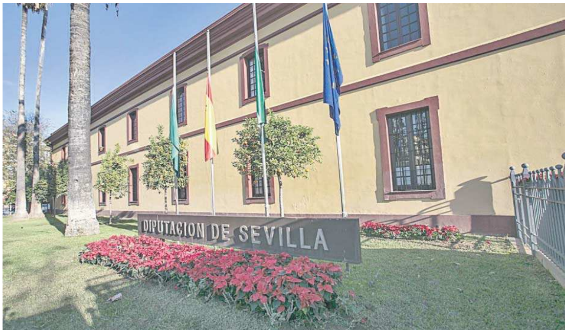
Fachada principal de la Diputación de Sevilla.