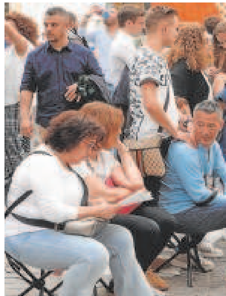
Sillitas de Semana Santa

Se prohibirán los obstáculos en la calle en las zonas más críticas, como las sillitas y las personas en el suelo, que dificulten e impidan la movilidad. Estas zonas serán Laraña-Orfila, José Gestoso-Lasso de la Vega, Plaza del Duque, Cuna-Acetes-Rivero, Villegas, Sagasta, Córdoba, Francos, Chapineros, Alemanes, Argote de Molina, Arfe, Altozano, San Jacinto, Girona, Jerónimo Hernández, Alcázares, Baños, Plaza de la Gavidia, Rio-