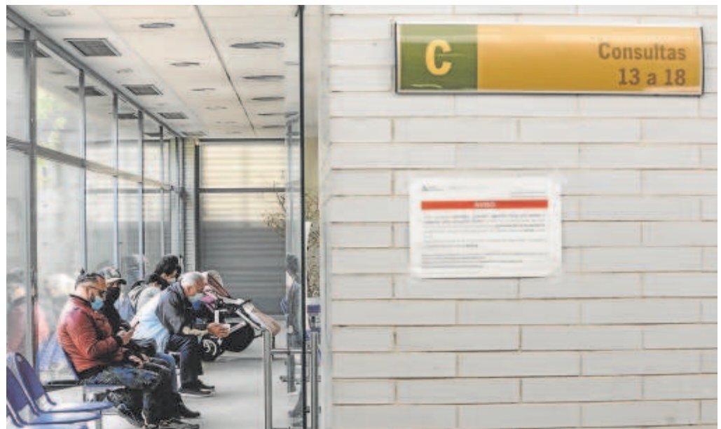
Sala de espera de un centro sanitario andaluz

Sin embargo, una media de dos tercios de los andaluces se seguiría inclinando por acudir a un centro sanitario de titularidad pública para cita con médicos de cabecera, pediatras, especialistas o urgencias. Aún en el hipotético caso de poder ser atendidos en la privada.