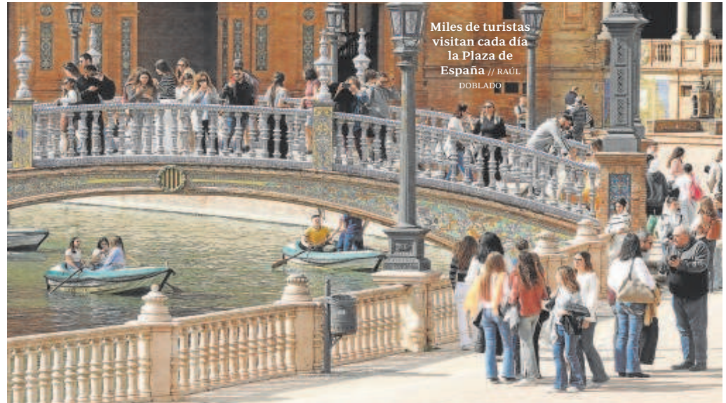
Miles de turistas visitan cada día la Plaza de España

De hecho, en el contrato de mantenimiento que impulsó el PSOE en el segundo mandato de Espadas, de apenas 150.000 euros anuales, Este servicio tendrá un coste para las arcas municipales de 150.000 euros se reconocía que dada «su condición de recinto abierto al aire libre, la proliferación de elementos artísticos que reúne, junto con las numerosas visitas que recibe y su uso público masivo, lo convierte en un recinto especialmente vulnerable, que demanda una continua supervisión además de actuaciones de conservación preventivas y de carácter periódico».