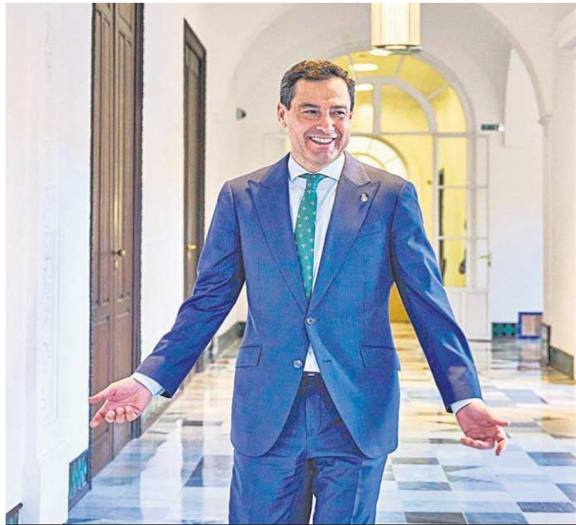
El presidente de la Junta de Andalucía en los pasillos del Palacio de San Telmo.