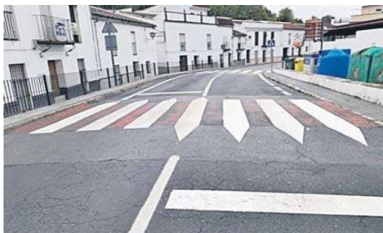
La travesía de Constantina.