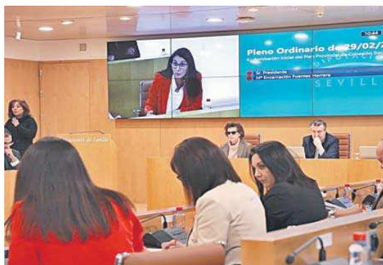
El Pleno de la Diputación aprobó ayer el ambicioso plan social.

Una de las novedades del nuevo Plan es que se modifica su estructura poniendo en valor las Líneas Estratégicas del Área, sus objetivos y acciones con el objetivo de ofrecer una mayor visibilidad a los pilares sobre los que se apoyan las actuaciones. Las Líneas Estratégicas de actuación se basan en la consolidación de los equipos de los Servicios Sociales Comunitarios, la prevención de la exclusión y atención a las emergencias socia-