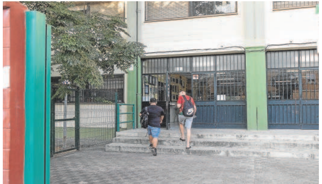
Un instituto en Sevilla // VÍCTOR RODRÍGUEZ

El inicio del proceso de escolarización viene marcado también por la reivindicación por parte de distintos colectivos y de la oposición de la ejecución del compromiso de implantar la gratuidad en la educación de 0 a 3 años. La Asociación de Centros Autónomos de Enseñanza, Escuelas Infantiles Unidas, la Asociación de Centros Educativos de Economía Social, la Federación de Centros Educativos, la Coordinadora de Escuelas Infantiles y Escuelas Católicas andaluzas se unieron ayer para exigir una Mesa Sectorial antes del 8 de marzo para abordar la gratuidad en la primera etapa de infantil. Una reclamación que también expresó el PSOE que pidió una modificación del decreto que regula esta etapa educativa. La Junta de Andalucía, por su parte, reclama al Estado recursos económicos de fondos europeos para afrontar la gratuidad.