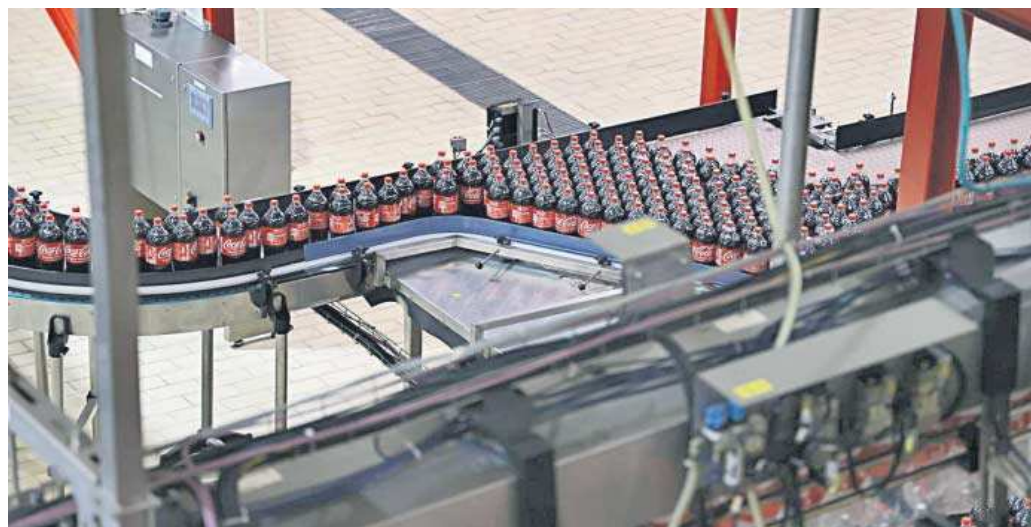
Línea de embotellado de Coca-Cola en la fábrica de La Rinconada, en Sevilla.

Coca-Cola vendió en Andalucía más de 581 millones de litros de sus bebidas en el ejercicio de 2022, lo que la empresa de bebidas interpreta como un dato de que “los andaluces continúan eligiendo” los productos “de Coca-Cola como al-