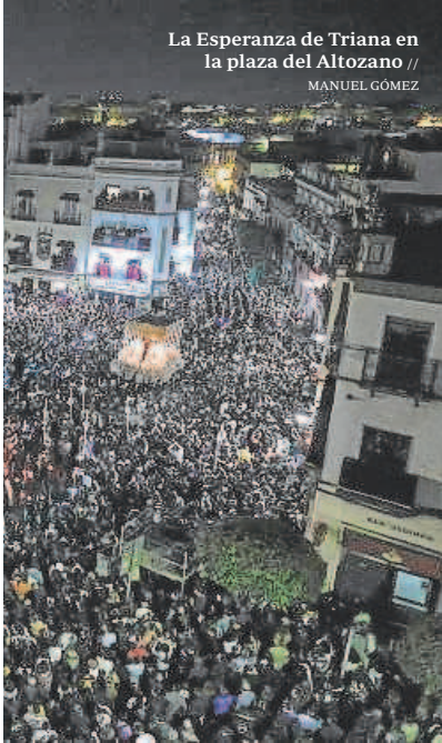
La Esperanza de Triana en la plaza del Altozano