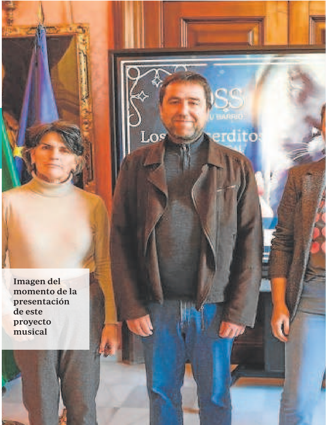
Imagen del momento de la presentación de este proyecto musical