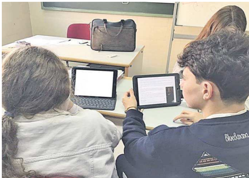
Estudiantes de Bachillerato en EESS María Auxiliadora de Nervión.

Las principales beneficiadas por este nuevo concierto serán las familias del colegio religioso, muchas de las cuales se veían obligadas a sacar a sus hijos del centro si querían estudiar el Bachillerato, pues no podían asumir el coste de la plaza. Así, también, se garantiza el derecho a la libre elección de los padres.