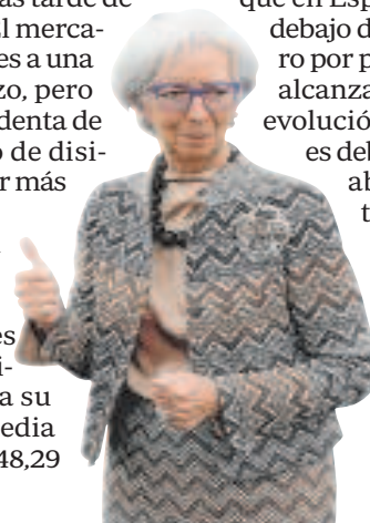
Christine Lagarde, presidenta del BCE

Tal como ha cerrado el índice al que se referencian la mayoría de las hipotecas, los consumidores con revisión anual verán ligeramente incrementada su cuota; en una hipoteca media la cuota quedaría en los 848,29