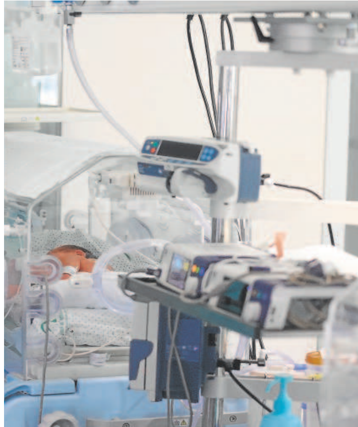
Una profesional sanitaria se hace cargo de un bebé en la unidad de Neonatos de un hospital público