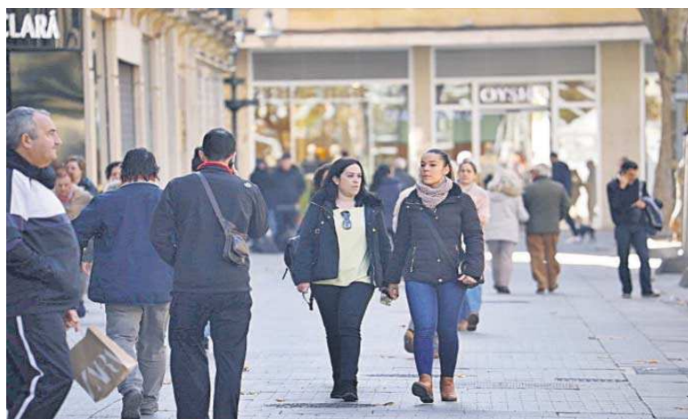
Gente paseando en una calle de Granada.

El crecimiento previsto para 2024 supondría una moderación de más de medio punto respecto al 2,5% registrado en 2023, una ralentización que se habría iniciado ya en este primer trimestre, con un