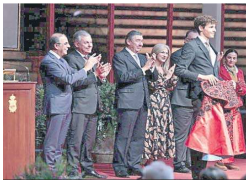
Las autoridades aplauden a uno de los galardonados por la Real Maestranza.