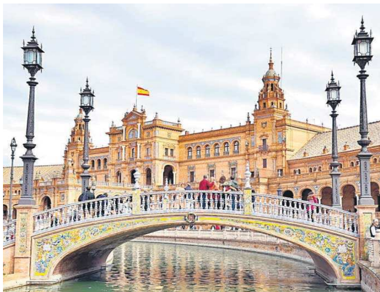
La Plaza de España, en una imagen reciente.

alcalde que el Gobierno no es partidario del cierre de la plaza, por lo que el regidor espera que el Ejecutivo central “ponga otras fórmulas alternativas sobre la mesa”. “El Ayuntamiento tiene claro que esta plaza tiene que ser