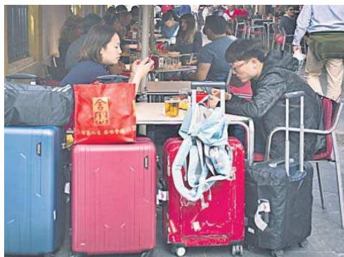
Turistas asiáticos en Sevilla.

La creación de este nuevo impuesto supondría, a juicio de los empresarios andaluces, "generar una competencia fiscal entre territorios", puesto que su implantación "es una decisión de cada comunidad autónoma, con casos como el de la Comunidad Valenciana, que recientemente lo ha suprimido". "Igualmente, es evidente