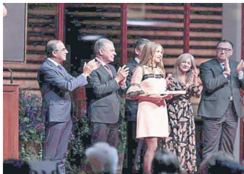
Una de las estudiantes de la Hispalense premiada por su expediente académico.

démica como motor de la Universidad haciendo eco, una vez más, de la trascendencia de la faena del diestro de La Puebla.