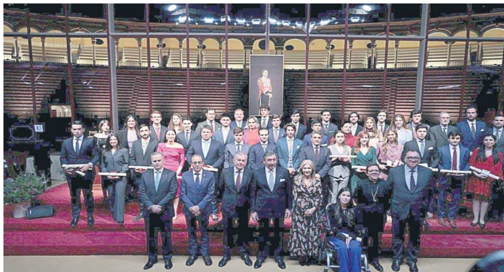
Los galardonados con los Premios Universitarios, ayer en la Maestranza junto a las autoridades.