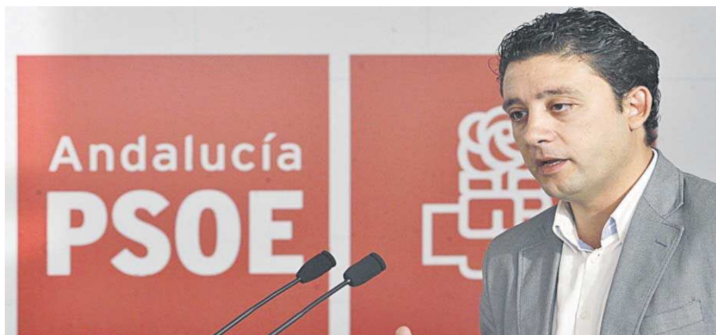
El ex vicesecretario general del PSOE de Andalucía Rafael Velasco durante una comparecencia pública en una imagen de archivo.

Teniendo en cuenta que en los cuatro expedientes se omite por Aulacen Cinco, "en contravención directa de la disciplina aplicable, la aportación de presupuesto o estimación del coste de la actividad formativa presentado", concluye que "los criterios de valoración seguidos por la Dirección General de Formación para el Empleo para otorgar una subvención por aquellos importes resultan indefinidos e inmotivados".