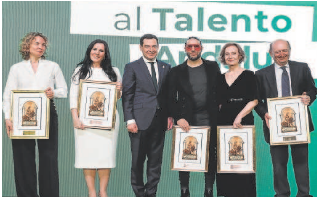
El presidente de la Junta, Juanma Moreno, anoche con los cinco premiados