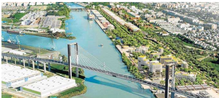
Recreación aérea del nuevo barrio portuario en el Muelle de Tablada.

Entre las alegaciones rechazadas, destaca la formulada por la asociación Palmera Agenda 2029. Los técnicos no han estimado su petición para alejar las nuevas viviendas que se levanten de las ya existentes. Respecto a que el documento definitivo no analiza la incidencia del proyecto sobre la mo-