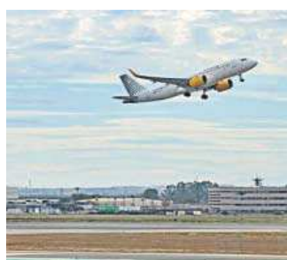
Aeropuerto de Sevilla.

El aeropuerto de Sevilla cerró el mes pasado el mejor febrero de su historia, al alcanzar los 656.192 pasajeros y crecer un 20,8% respecto a la misma fecha de 2023. Este balance, que arroja una media diaria de 22.627 viajeros, obedeció al fuerte repunte marcado por el tráfico foráneo y por el destacado dinamismo que mantuvo el nacional.