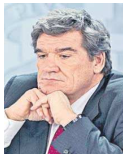
José Luis Escrivá.

sellado entre Gobierno y sindicatos establecía una subida fija del 2% para 2024, a la que podría sumarse un 0,5% adicional en función de la evolución de la inflación