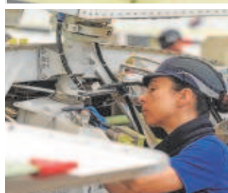
Varios operarios trabajando en la línea de ensamblaje final del C295 y, abajo, un avión de la Fuerza Aérea de Angola

y desde hace poco cuentan con 'Amanda', una asistente de voz que guía a los empleados en el proceso. En concreto, Airbus emplea a casi 4.000 personas de forma directa en la región, de las que unas mil están vinculadas al programa del C295.