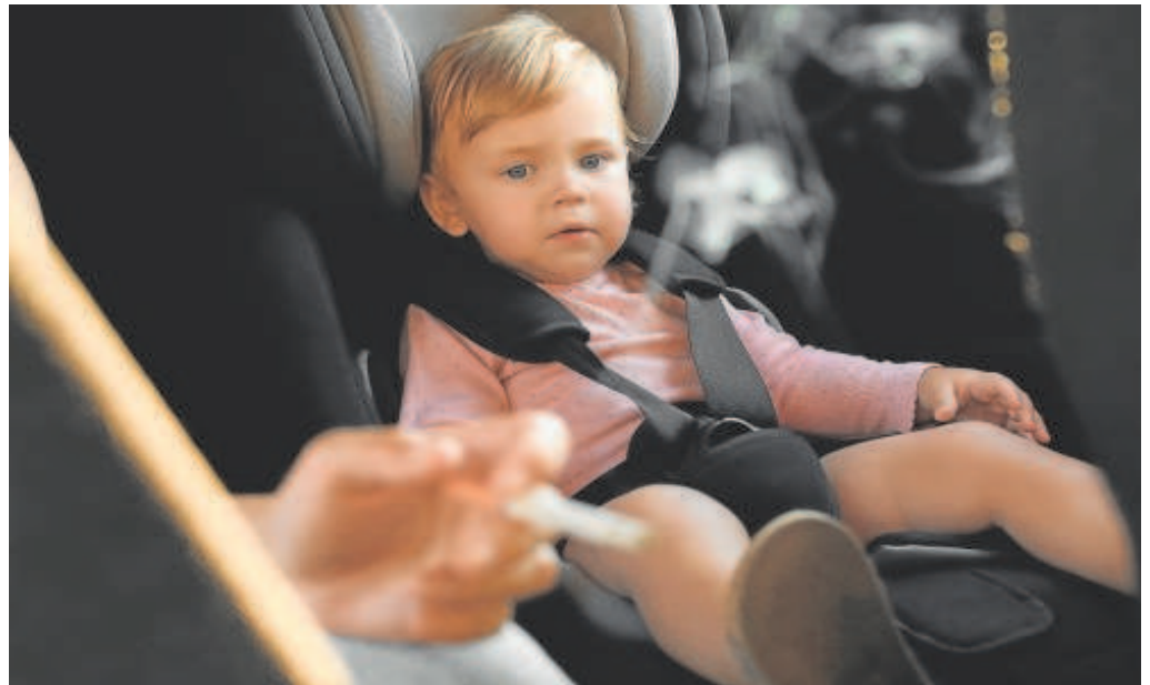
Un niño en el interior de un vehículo privado

Según el borrador del Plan Integral de Prevención y control del Tabaquismo (PIT) 2024-2027, avanzado por ABC, «España volverá a ser pionera, como ya lo fue gracias a la modificación de 2010, ofreciendo un reconocimiento especial de protección en espacios sensibles» como son las zonas de juego infantil y su entorno, y el establecimiento de espacios al aire libre de protección reforzada; asimismo, pretende mayor protección con la adopción de nuevas medidas frente a los dispositivos susceptibles de liberación de nicotina.