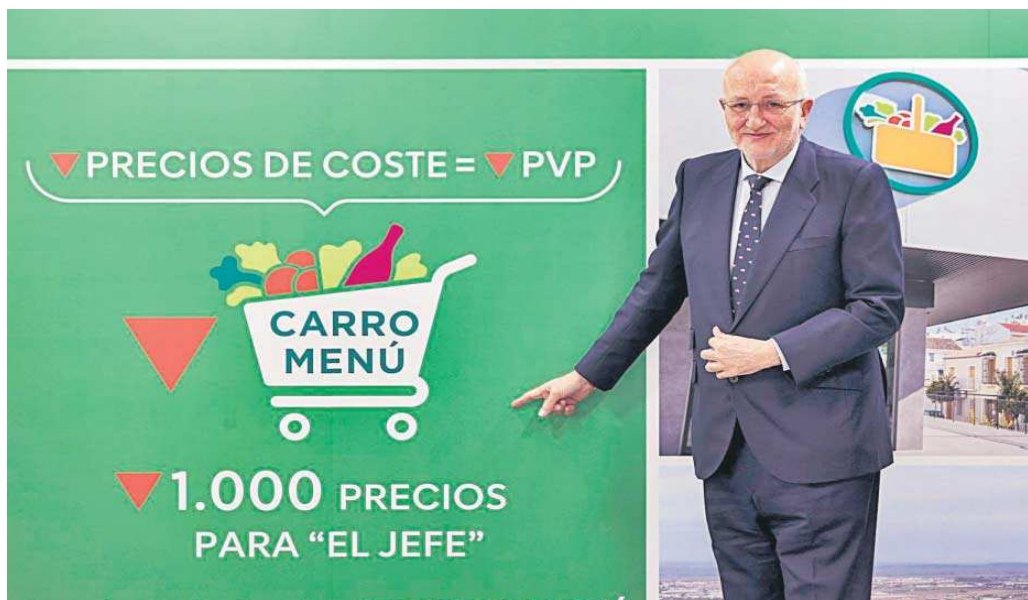
Juan Roig, en la presentación de los resultados de 2023 de Mercadona.