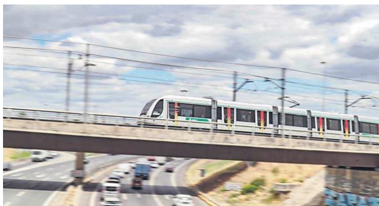
Un vehículo del Metro de Sevilla en movimiento.

Hoy intervendrán en la primera jornada del Congreso Globalvía, la empresa con mayor participación en la concesionaria del Metro de Sevilla; la sociedad Metro de Sevilla, el fabricante de trenes CAF y las tecnológicas SSG Insight, GMV y Kruch Railway Innovations. Por la tarde será el turno para Tranvías de Zaragoza y las empresas Siemens, Pandrol SRS,