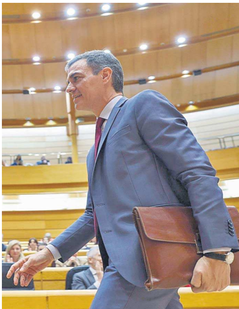
Pedro Sánchez, a su llegada ayer al Pleno del Senado.

El portavoz del PSOE, Juan Espadas, confirmó el apoyo de su grupo parlamentario a esta iniciativa de investigación, aunque insistió en su petición de ampliar el objeto de la comisión. Y es que, según recordó, el PSOE ha propuesto que la comisión de investigación no se circunscriba sólo al caso Koldo, sino que quería que se examinaran todos los contratos de la pandemia por parte de todos las administraciones. Espadas explicó que la Mesa del Senado deestimó esta solicitud de ampliación del objeto de la investigación.