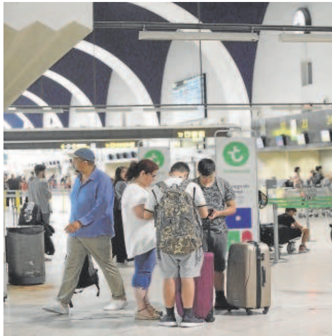
Pasajeros ante los mostradores de facturación de maletas

El grueso de los usuarios contabilizados el pasado mes de febrero se movió en vuelos comerciales (excluye aviación general y ejecutiva), ya que sumaron 653.846. De ellos, 306.310 viajaron desde o hacia alguna ciudad española (un 11,4% más que un año