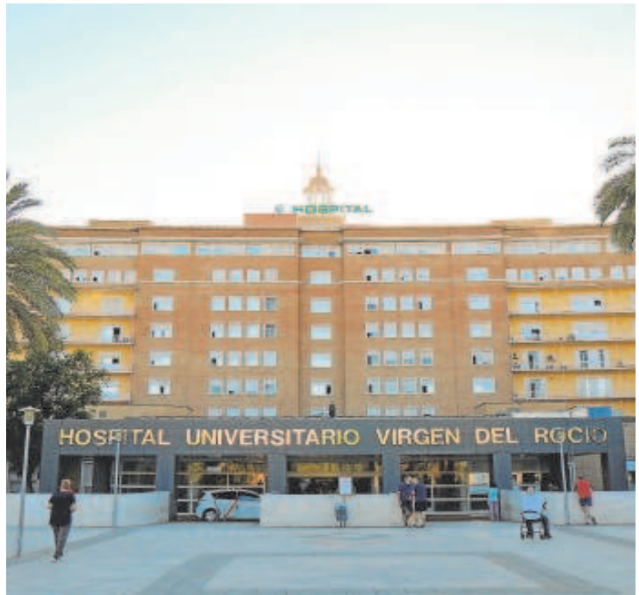
Entrada principal del Hospital Virgen del Rocío de Sevilla

señalado que «se está trabajando para minimizar la demora» y se han priorizado las citas de pacientes con enfermedad activa puntualmente «ante una situación de necesidad».