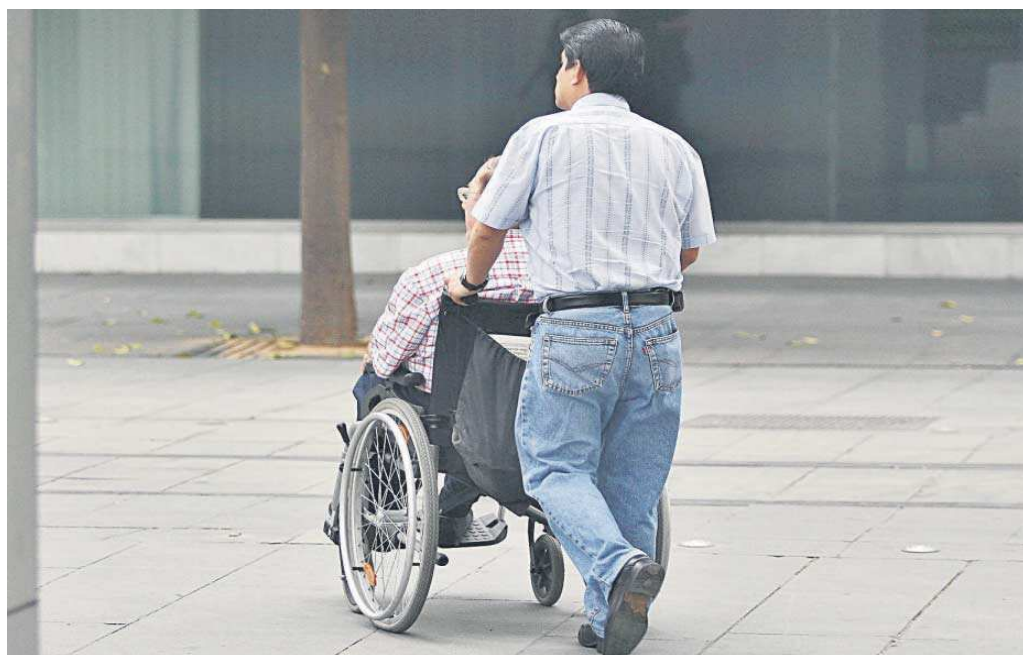
Un hombre conduce a otro hombre en silla de ruedas en una calle de Sevilla.

● Andalucía reduce en 2,7% el atasco en las valoraciones, un dato inferior al del promedio de España, del 10,5% ● La Junta pide una financiación que contemple el alza del gasto social