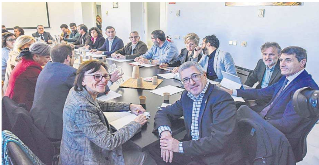
El secretario de Estado de Medio Ambiente, Hugo Morán, presidió la reunión con los representantes de los 14 municipios del entorno de Doñana ayer en Sevilla.