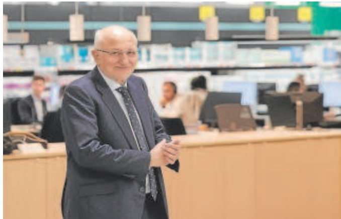
Juan Roig, presidente de Mercadona

Juan Roig defendió la pertinencia de tomar «decisiones impopulares pero