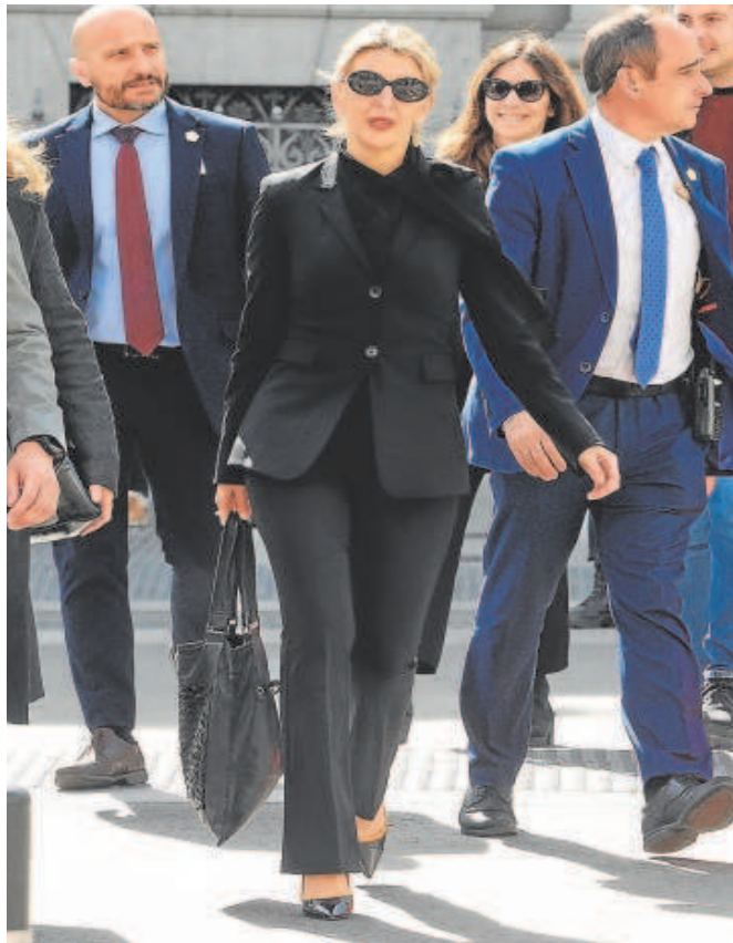
La vicepresidenta segunda, Yolanda Díaz

Según figura en las modificaciones remitidas por Trabajo al diálogo social, a las que ha tenido acceso ABC, con la nueva ley los empresarios deberán trazar «objetivos específicos dirigidos a promover la igualdad en todas las actuaciones, a todos los ni-