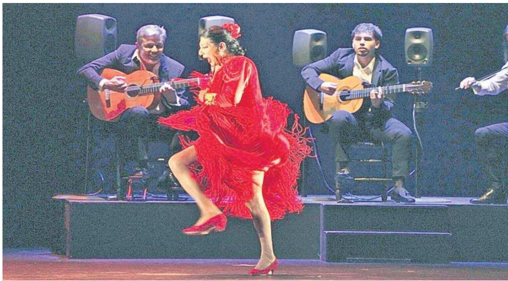
Manuela Carrasco se despide de los escenarios con un espectáculo lleno de emoción que ya pasó por el Festival de Jerez.