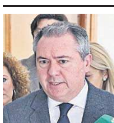
El líder del PSOE-A, Juan Espadas.

Así lo asumen la Junta y el PP-A. El consejero de Turismo, Cultura y Deporte, Arturo Bernal, se mostró ayer dispuesto a abordar la tasa con los municipios pero siguió supeditando el debate al consenso del sector. "Somos conscientes y sensibles", dijo Bernal, con las necesidades de las ciudades turísticas, que "tienen que cubrir los servicios públicos", pero se basó en la negativa "clara y contundente" de la Confederación de Empresarios de Andalucía. A juicio de los empresarios, este nuevo tipo impositivo afectaría "negativamente a la competitividad del sector y al conjunto de la economía re-