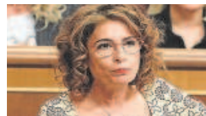
María Jesús Montero Vicepresidenta del Gobierno

«No es de extrañar este nuevo dislate del regidor de Sevilla»