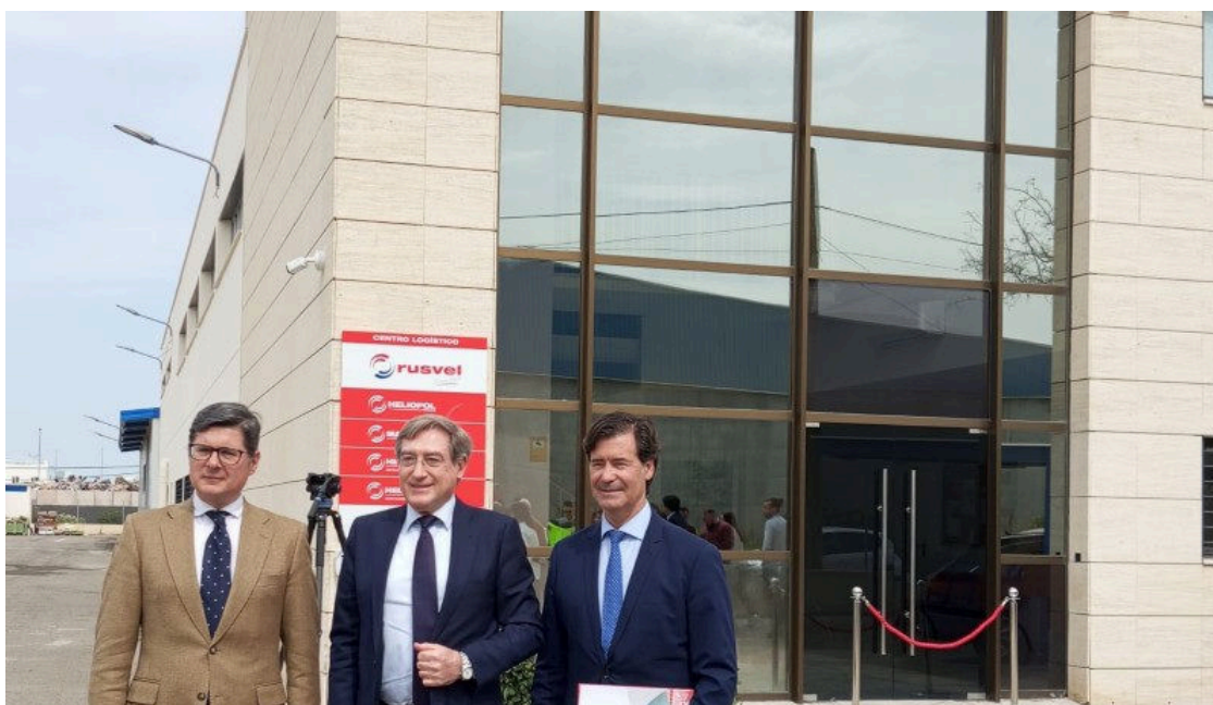
Inauguración del nuevo centro logístico de Rusvel en el Puerto de Sevilla

Rusvel ha inaugurado en el Puerto de Sevilla un nuevo centro logístico, que será estratégico para el desarrollo de las nuevas líneas de negocio del grupo constructor, entre las que destacan el mantenimiento fluvial y las obras hidráulicas, las construcciones efímeras y los servicios de mantenimiento. Las instalaciones consisten en una nave de 3.000 metros cuadrados en la que, además de los diferentes espacios administrativos, se encuentra una gran zona dedicada a almacén, taller, mantenimiento y reparaciones . La parcela en la que se ubica la nave tiene una extensión de 6.000 metros cuadrados, que se destinarán a zona de aparcamiento y circulación para el acopio de productos y maquinaria de gran volumen.