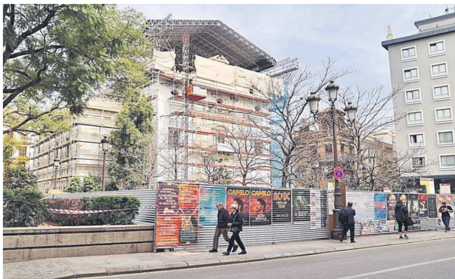
El gran andamio de la Plaza de la Concordia que se retranqueará en los próximos días.

● El Ayuntamiento eliminará la cera de las calles más problemáticas tras cada jornada ● El andamio de la Concordia se retranqueará en los próximos días