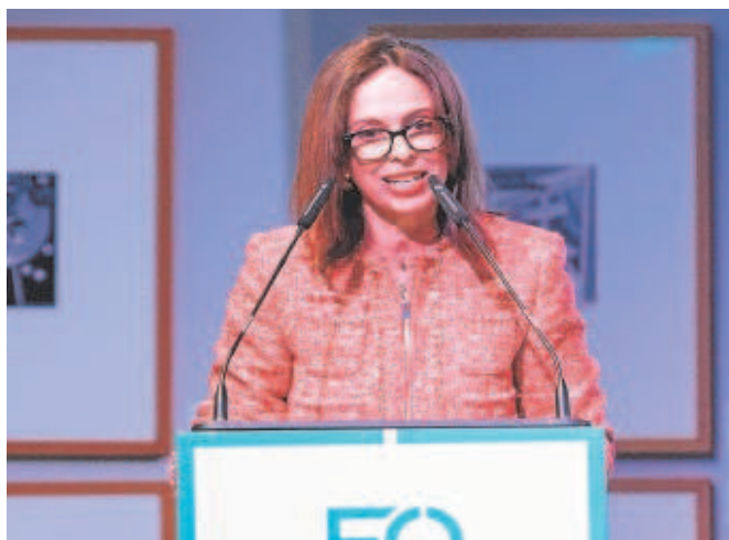
La consejera de Fomento, Rocío Díaz