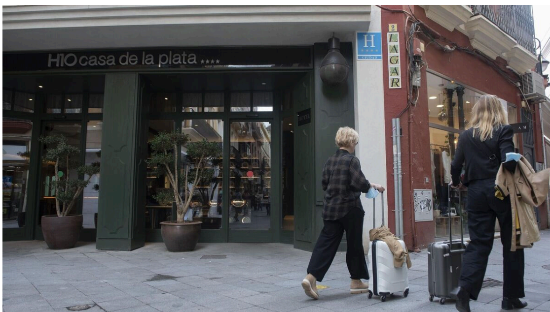
Turistas con maletas en la céntrica calle Lagar. / Juan Carlos Vázquez

A estas viviendas de uso turístico no se les exigirá calificación ambiental . Lo dispuesto en este informe se aplica a las solicitudes de cambio de uso que se hayan solicitado en el registro desde el pasado 23 de febrero.