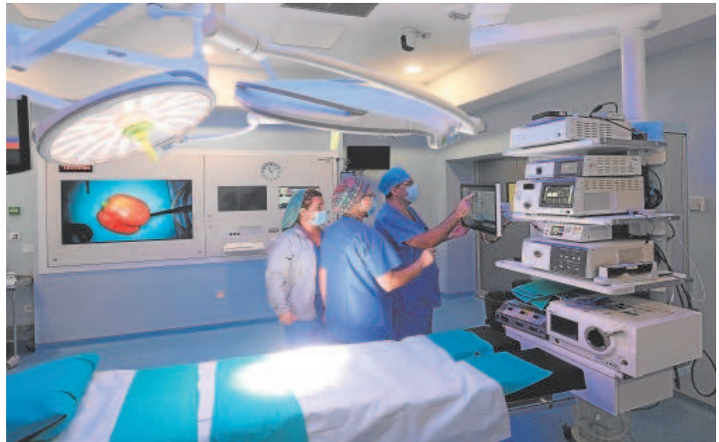
Un quirófano de un centro hospitalario andaluz