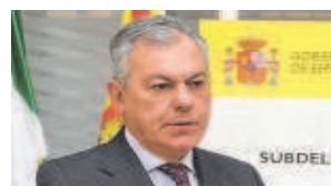
José Luis Sanz Alcalde de Sevilla

«El Gobierno de España no va a permitir ninguna privatización»