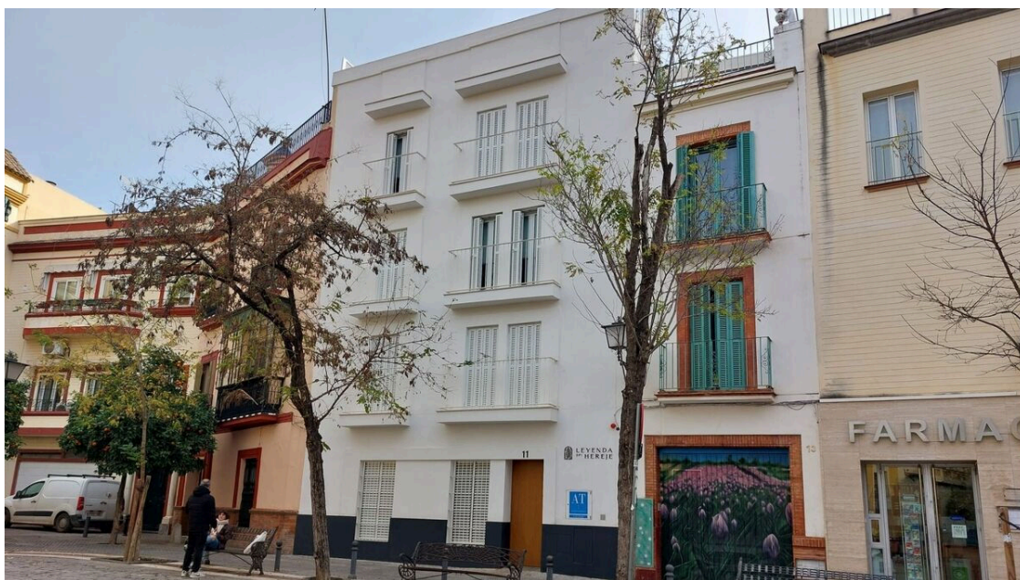
Edificio de apartamentos turísticos en San Juan de la Palma.

Hasta la primera planta y con ascensor. Estos son algunos de los requisitos que aparecen en el informe realizado por el Servicio de Licencias e Inspección Urbanísticas a los efectos de instrucción y que ya aplican los técnicos de la Gerencia de Urbanismo tras la aprobación y publicación del esperado decreto de la Junta de Andalucía el pasado 29 de enero para regular los apartamentos con fines turísticos y da potestad a los ayuntamientos para su control y limitación.