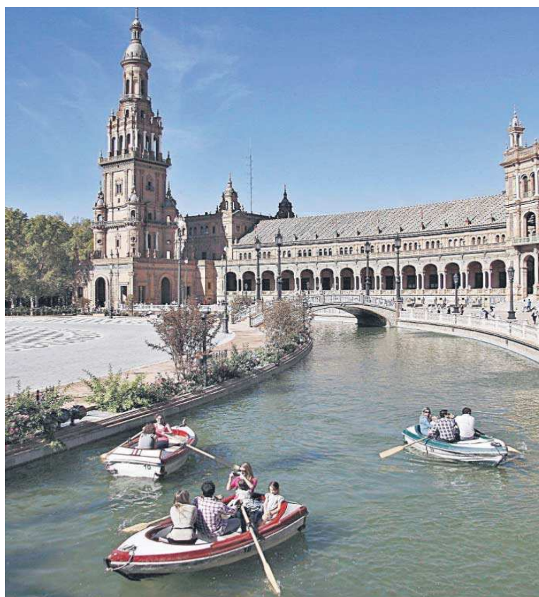
Los visitantes de la Plaza de España hacen uso de su famosa ría.