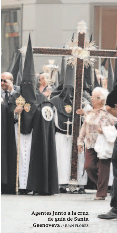
Agentes junto a la cruz de guía de Santa Geenoveva

los hechos. El edil mostraba su «absoluta confianza» en que la negociación se materializaría en un acuerdo. «Confiamos en la Policía Local, que siempre presta un servicio impecable».