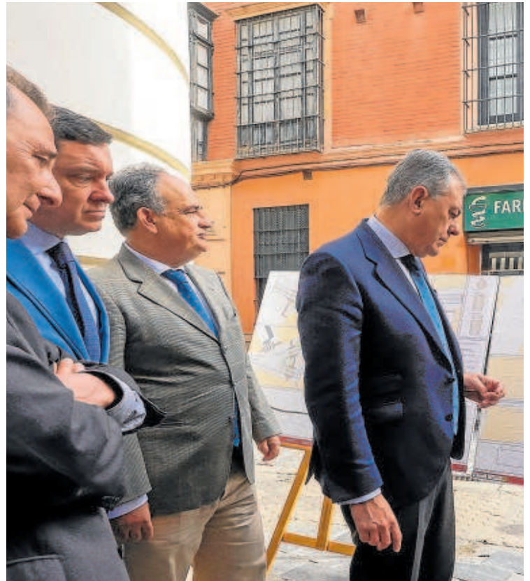
El alcalde de Sevilla, José Luis Sanz, en la presentación de las obras de reurbanización de

La obra de la calle Zaragoza coincidirá con la reurbanización de la calle Regina, una intervención que el gobierno municipal anunció para inicios de este año y que se ha atrasado por la imposibilidad de cumplir los plazos anunciados. En un principio, el alcalde con-