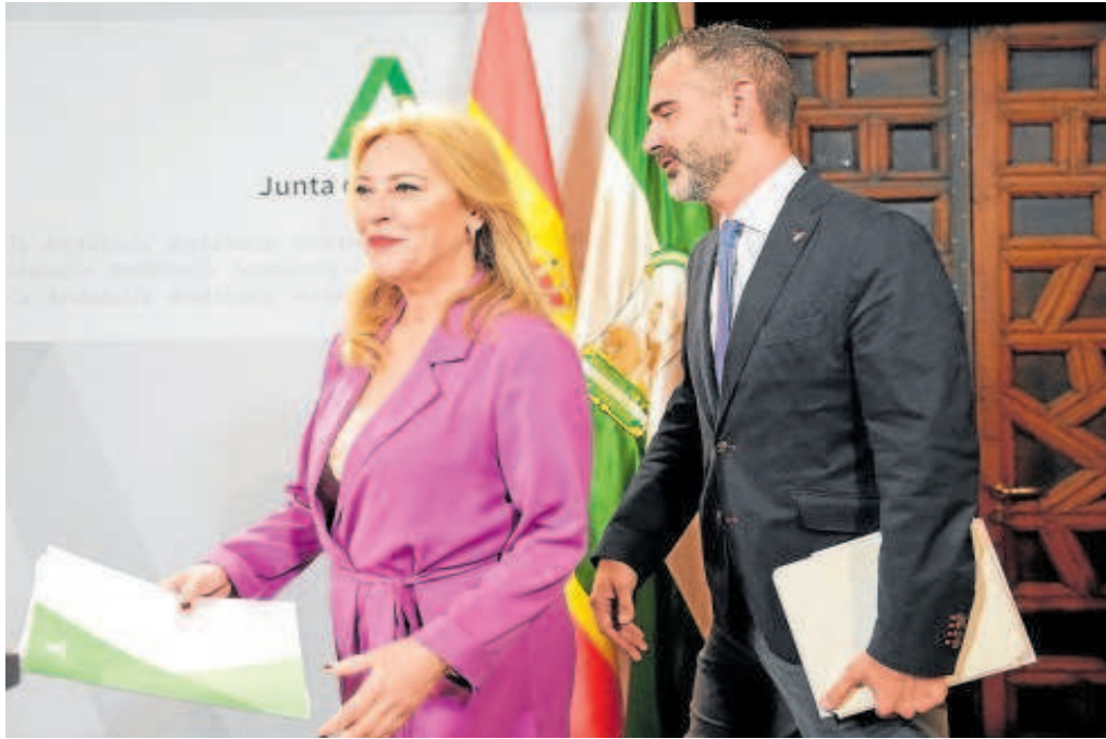
La consejera Carolina España y el portavoz del Gobierno andaluz, Ramón Fernández-Pacheco