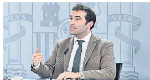
Carlos Cuerpo, en la rueda de prensa posterior al Consejo de Ministros.

servicios de reclamaciones de los tres organismos supervisores existentes, el Banco de España, la Comisión Nacional del Mercado de Valores y la Dirección General de Seguros y Fondos de Pensiones, y permitirá a los clientes elevar sus quejas de forma gratuita y obtener una respuesta en un plazo máximo de 90 días.