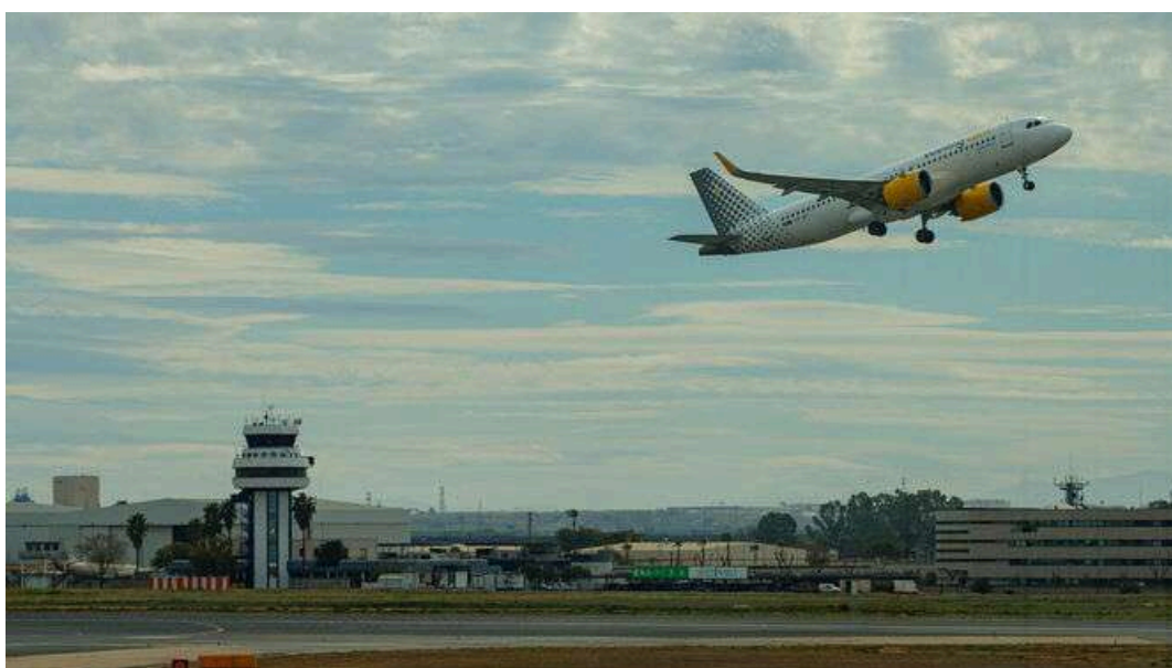
Un avión tras despegar junto a la torre de control del aeropuerto de Sevilla.

El aeropuerto de Sevilla estrenará el 31 de marzo la temporada de verano con una programación que se mantendrá vigente hasta el último fin de semana de octubre y que presenta unas cifras históricas. Con el objeto de cubrir la demanda que se calcula para estos meses, las compañías aéreas han programado 6,4 millones de asientos y 35.800 operaciones (incluidas salidas y llegadas), lo que supone un crecimiento del 11,8% y el 11,5% respecto a la temporada estival de 2023, cuando también se batieron todos los récords. La programación de las aerolíneas para este verano refleja su apuesta por el mercado internacional , ya que este absorberá el 50,6% del total de las plazas ofertadas y repunta casi un 17% en comparación con el mismo periodo del año pasado.