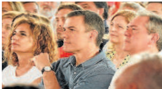
Montero, Sánchez y Espadas en un mitin

Pueden dirigir sus cartas a ABC de Sevilla al correo electrónico cartas.sevilla@abc.es . Su extensión no debe exceder los 900 caracteres, con espacios. ABC se reserva el derecho de extractar o reducir los textos cuyas dimensiones sobrepasen el espacio destinado a ellas.