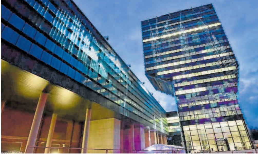
Sede del IMEC en Lovaina // ABC