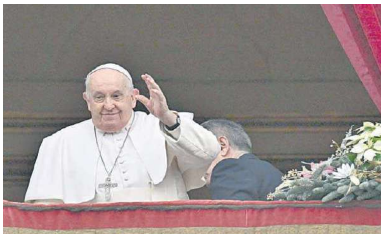
Bendición del papa Francisco.

● El presidente de la Junta, acompañado por su esposa, regalará a Francisco un cáliz, una escultura, incienso y una rama de olivo