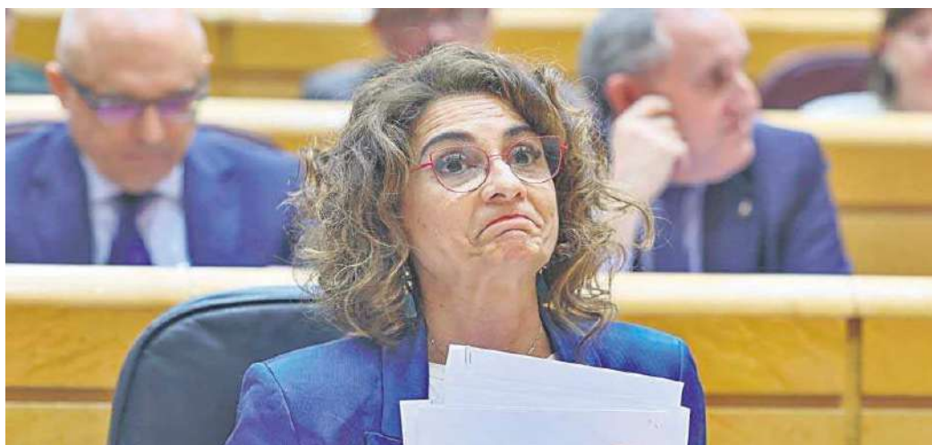
María Jesús Montero, vicepresidenta y ministra de Hacienda, en la sesión de control del Senado.