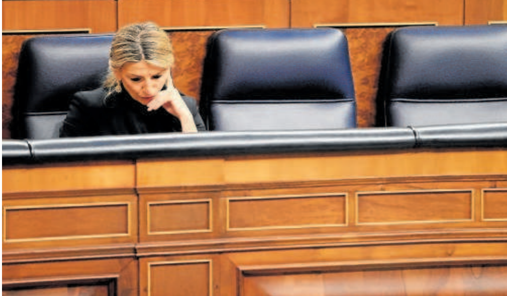
Yolanda Díaz, vicepresidenta segunda y líder de Sumar, la semana pasada en el Congreso