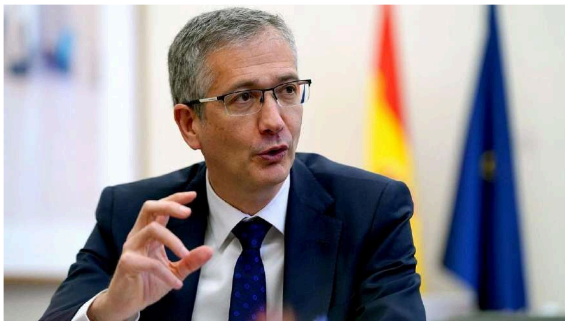
El gobernador del Banco de España, Pablo Hernández de Cos.

Toque de atención al Gobierno sobre las cuentas públicas. El vicepresidente del Banco Central Europeo (BCE) , Luis de Guindos , y el gobernador del Banco de España , Pablo Hernández de Cos , han instado este martes al Ejecutivo a comenzar cuanto antes a preparar el ajuste fiscal que en los próximos años será obligatorio por las nuevas reglas fiscales europeas . "Es muy importante que las autoridades se tomen muy en serio , y ahora ya de acuerdo con el nuevo pacto de estabilidad y crecimiento que así lo va a exigir, el proceso de consolidación fiscal", ha acertado a resumir el máximo responsable del supervisor español.