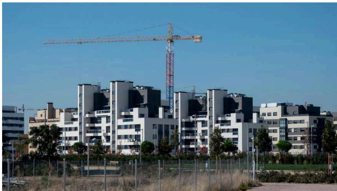
Una grúa en una zona de construcción de edificios.