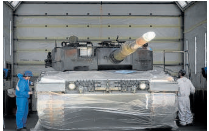
Leopard 2A4 en la fábrica sevillana de Santa Bárbara Sistemas

Entre el material que el Ministerio de Defensa canalizará a Ucrania durante los próximos meses se encuentran nuevos carros de combate Leopard 2A4. España ya hizo un primer envío de diez unidades el año pasado y la previsión actual es poder trasladar al Ejército ucraniano hasta una veintena de nuevos vehículos. Igual que los primeros, los Leopard que se enviarán forman parte de un lote que llevaba más de una década almacenado en una nave industrial de Casetas, en Zaragoza, y que tendrán que someterse a una intensa puesta a punto en la fábrica de Santa Bárbara Sistemas