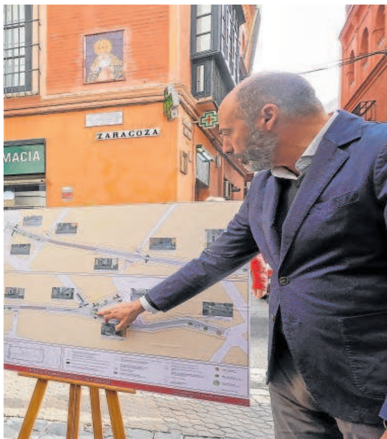
la calle Zaragoza que empezarán tras la Semana Santa // MANUEL GÓMEZ

que fuera más acorde con su ubicación y, sobre todo, que solucionara el fiasco del abujardado que el gobierno del PSOE había aplicado sobre el mármol del pavimento. El alcalde se puso como meta la Semana Santa de 2024 para empezar la remodelación, ya que los condicionantes del lugar hacen que se cuente con el tiempo justo para realizar estos trabajos sin que afecte al calendario ordinario de la ciudad.