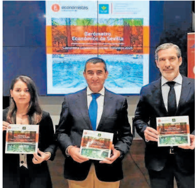
Presentación del XX Barómetro Económico

Desde diciembre de 2022, la inflación ha mostrado una tendencia de-