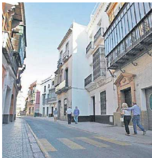
Varias personas caminan por la calle Zaragoza.