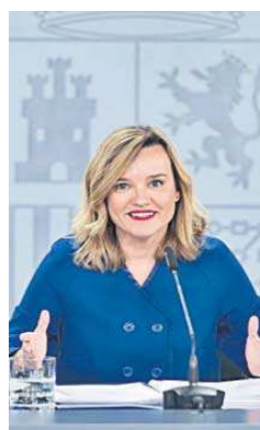
Pilar Alegría.

En este contexto, cabe recordar que la decisión del Gobierno