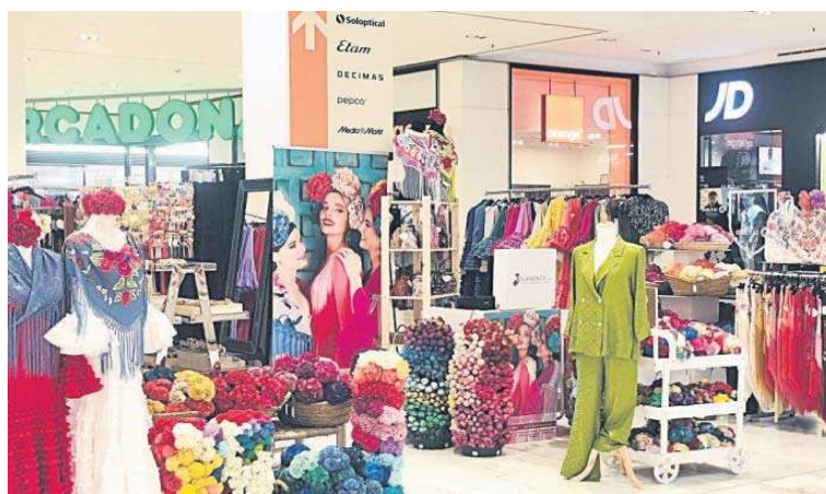
El 'pop-up' que Flamenca.com ha organizado en Los Arcos estará abierto hasta el 20 de abril.

● El centro comercial contará con un 'pop-up' organizado por la firma Flamenca.com con una amplia colección de trajes hasta el 20 de abril