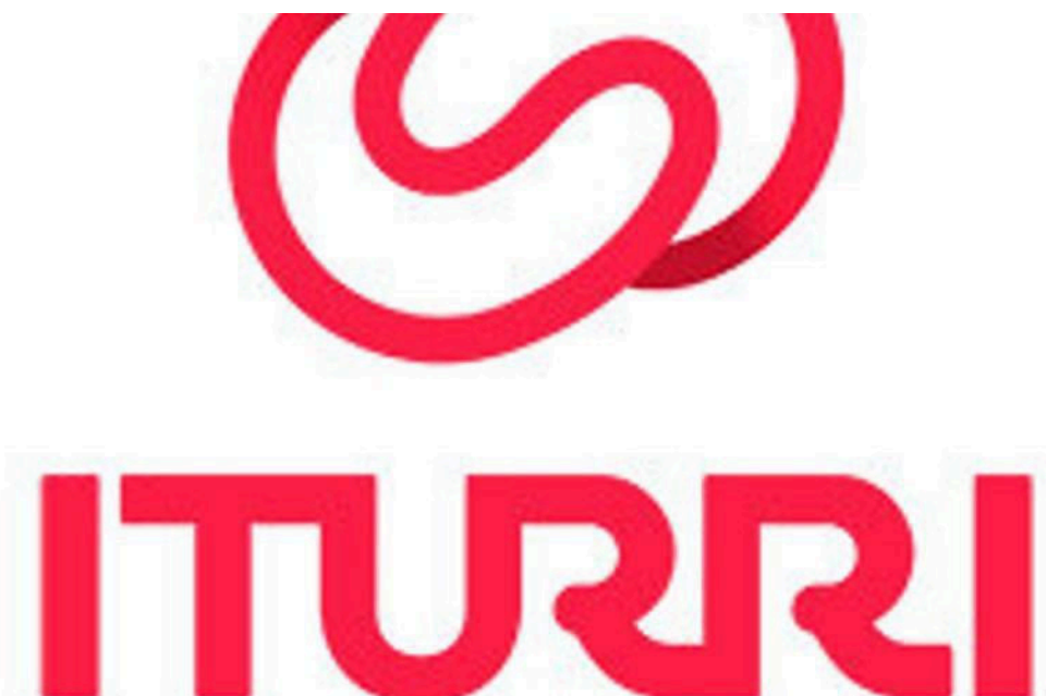
Logo de Iturri / ITURRI

El Ministerio de Defensa , a través de la Jefatura de Asuntos Económicos del Mando de Apoyo Logístico del Ejército de Tierra, ha adjudicado al grupo familiar sevillano Iturri un acuerdo marco para la adquisición de 4.500 vehículos militares todoterreno tácticos por un importe de 217,66 millones de euros (impuestos incluidos), según figura en el portal del contratación del Estado.