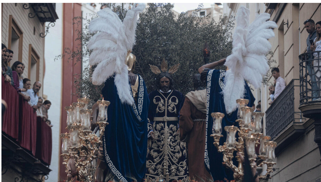
Una imagen de la Hermandad de los Panaderos en la Semana Santa de Sevilla 2023.

Nuestro Padre Jesús del Soberano Poder en su Prendimiento, María Santísima de Regla y San Andrés Apóstol.