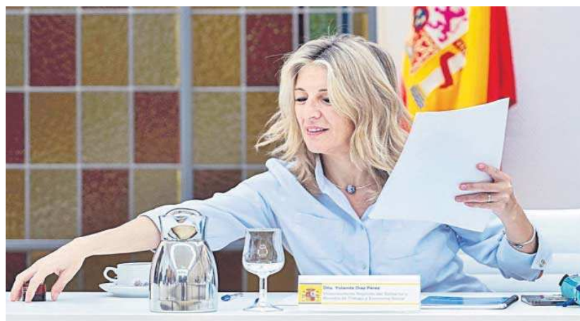
La vicepresidenta segunda y ministra de Trabajo, Yolanda Díaz.

Los sondeos coinciden en que las dos candidaturas por separado podrían perder la mitad de sus seis representantes y constatan que existe un "alto grado de confusión de marcas" entre el electorado de este espacio político, lo que explica el "baile" de escaños.