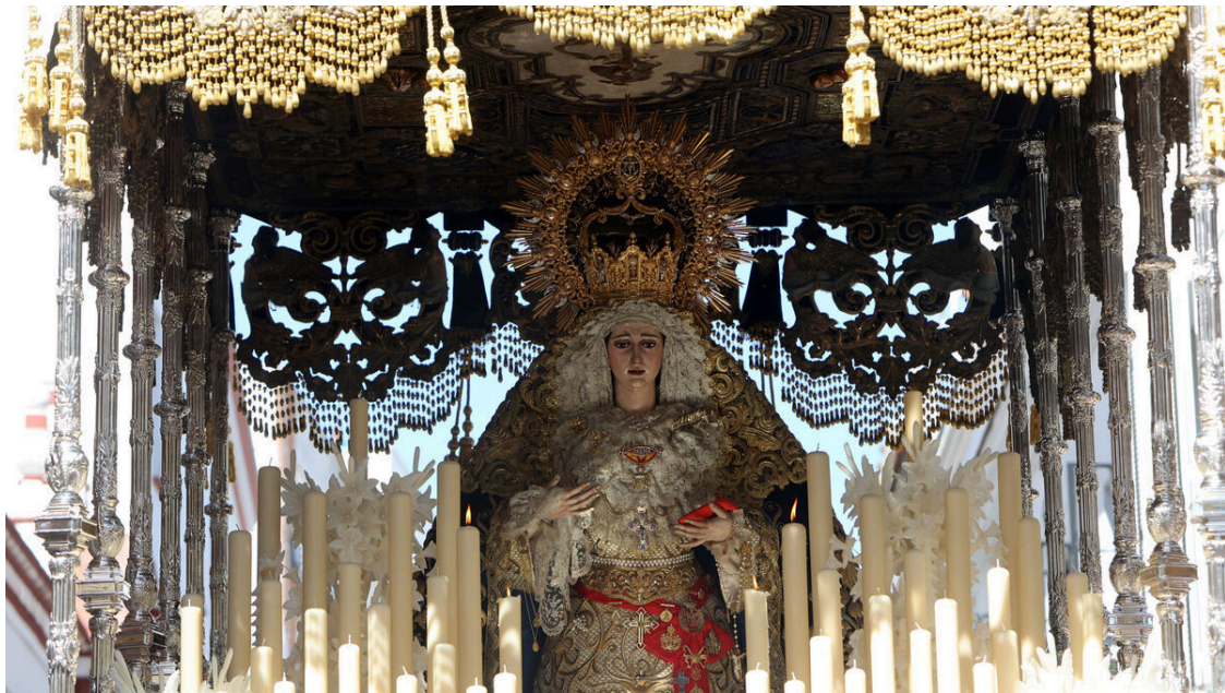
Una imagen de la Hermandad del Buen Fin en la Semana Santa de Sevilla de 2023.

Santísimo Cristo del Buen Fin y Nuestra Señora de la Palma.