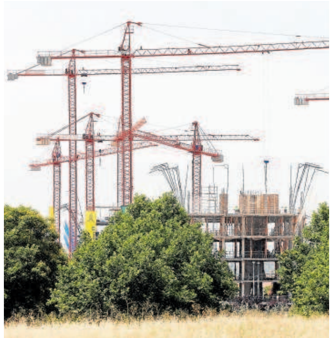
La construcción calcula una necesidad de 150.000 viviendas anuales

La reforma de la ley de suelo es esperada desde hace años por el sector inmobiliario, tras varias legislaturas en la que la norma no ha conseguido salir adelante tanto con el PSOE como con el PP a los mandos del Ejecutivo. A favor de la propuesta de modificación de la actual regulación están los promotores. «Si queremos hacer frente a la falta de oferta de vivienda de nuestro país y las dificultades de accesibilidad necesitamos desarrollar y gestionar suelo de manera más eficaz y con mayor seguridad jurídica consideramos que la reforma de la