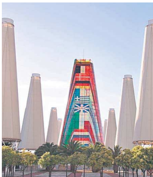
El CPD de la Junta se ubicará en el Parque Tecnológico de La Cartuja.