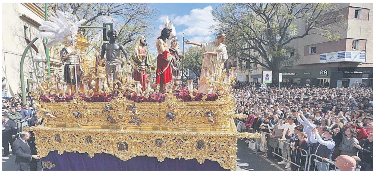
El misterio de la Presentación al Pueblo da su primera revirá tras salir de San Benito.

● Las tres hermandades de negro decidieron no salir por el riesgo de lluvia en una jornada marcada por el frío y el viento ● El nuevo orden del día no arregla ni el retraso ni las bullas