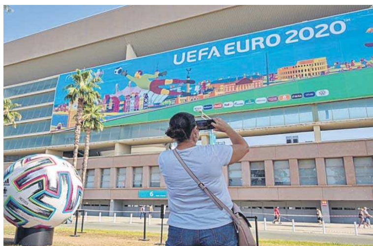
Una aficionada hace una foto con su móvil del Estadio de la Cartuja de Sevilla.

Las relaciones entre el Gobierno andaluz y la RFEF comienzan a partir del mandato de Javier