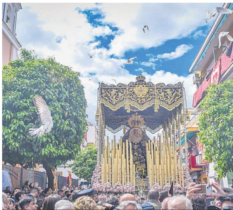
Suelta de palomas en la salida de la Virgen de los Dolores, en el Cerro del Águila.