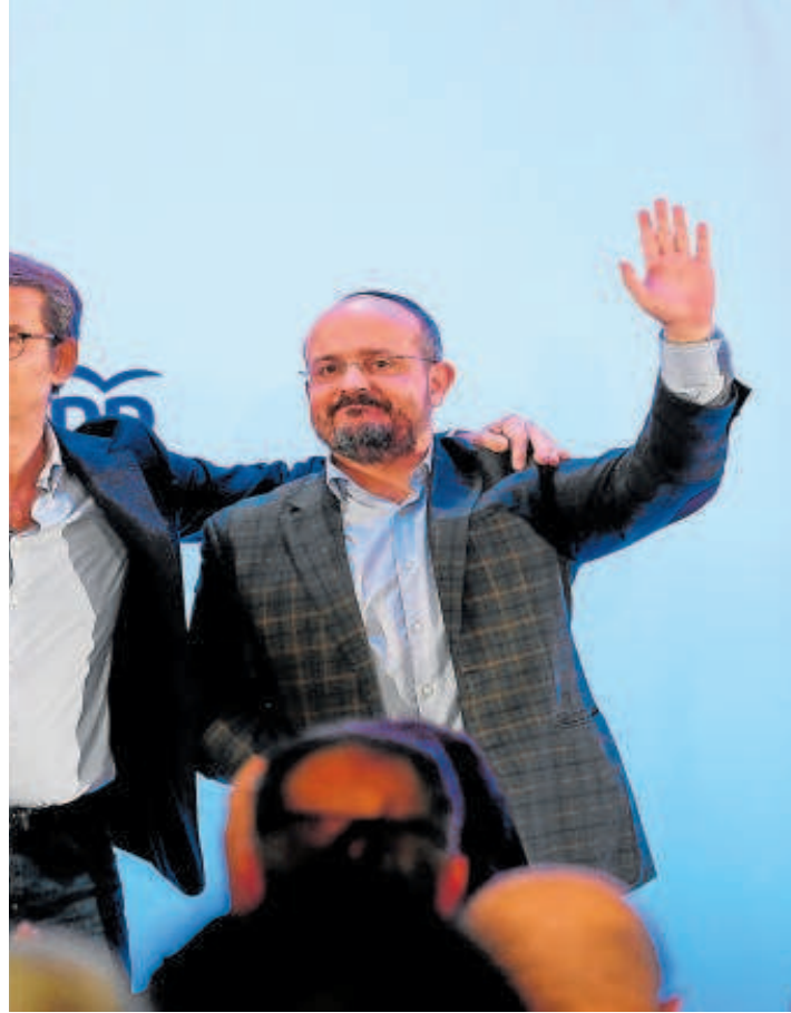
Feijóo y Alejandro Fernández, en un acto del PP catalán