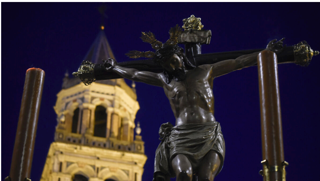
Una imagen de la Hermandad de Cristo de Burgos.

Santísimo Cristo de Burgos, Negaciones y Lágrimas de San Pedro y Madre de Dios de la Palma.