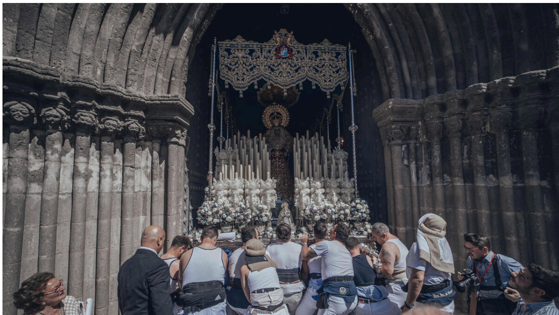
Una imagen de la Hermandad del Carmen Doloroso en la Semana Santa de Sevilla 2023

Nuestro Padre Jesús de la Paz y Nuestra Señora del Carmen en sus Misterios Dolorosos.