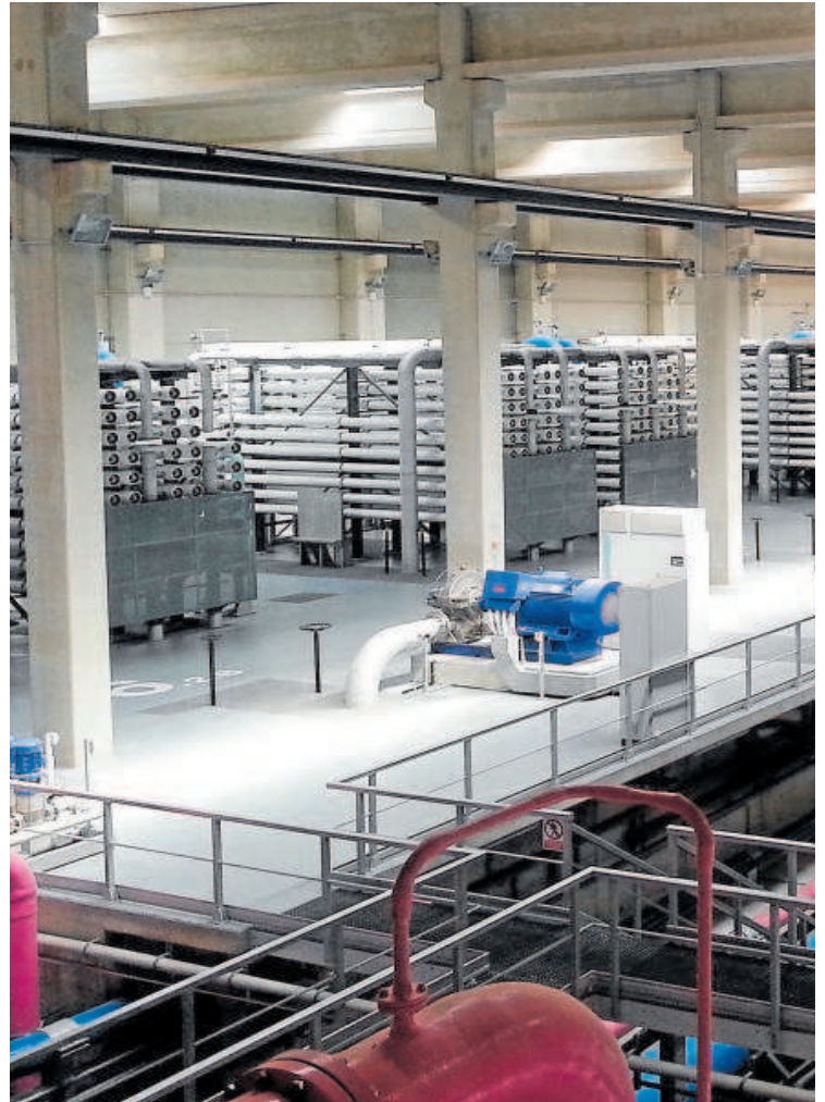
Desaladora de Águilas, en Murcia

Por este motivo, las dos administraciones mantienen el reparto de papeles que acordaron en la reunión entre la vicepresidenta del Gobierno, Teresa Ribera, y el presidente andaluz, Juanma Moreno. El Ministerio asume el coste de la desalación y de llevar el agua desde la planta desaladora hasta el barco que lo pueda transportar, mientras que a la Junta de Andalucía le corresponde la identificación de los barcos y su descarga para la integración en los