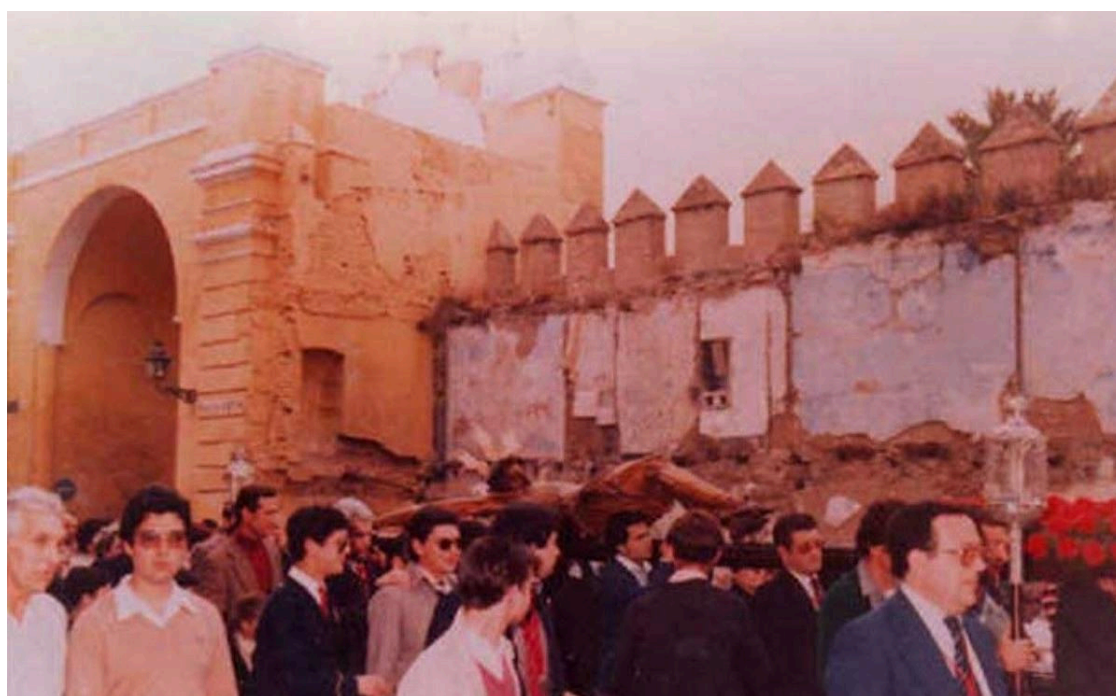
Traslado Desamparo y Abandono 1980 / Hermandad