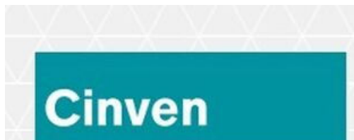
Imagen corporativa de Cinven.