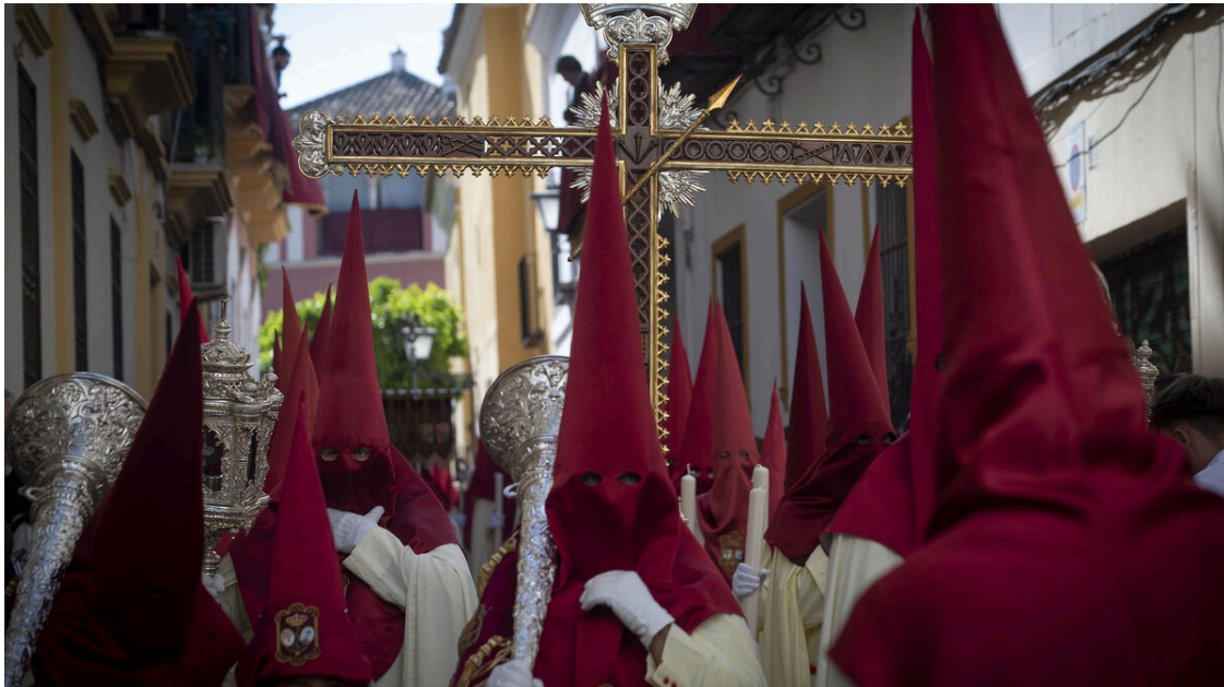
Una imagen de la Hermandad de La Lanzada en la Semana Santa de Sevilla de 2023.

Cofradía de Nazarenos de la Sagrada Lanzada, Nuestro Señor Jesucristo, Nuestra Señora de Guía, San Juan Evangelista y María Santísima del Buen Fin.