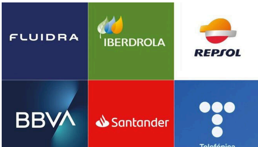
Logos de grandes empresas.

El Venture Capital cobra fuerza entre las grandes empresas de España, una vez que nuestro país se había quedado atrás en esta modalidad financiera.