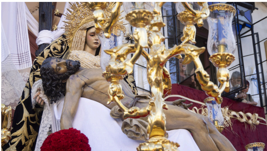
Una imagen de la Hermandad del Baratillo en la Semana Santa de Sevilla 2023.

Santísimo Cristo de la Misericordia y Nuestra Señora de la Piedad, Patriarca Bendito Señor San José y María Santísima de la Caridad en su Soledad.