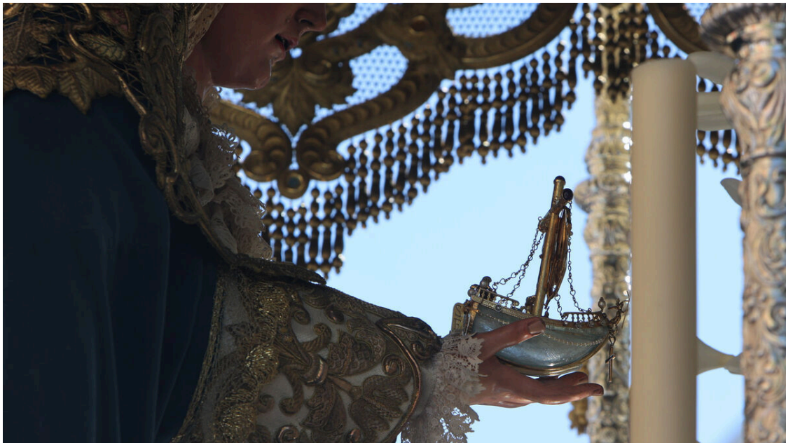
Una imagen de la Hermandad de la Sed en la Semana Santa de Sevilla de 2023.

Santísimo Cristo de la Sed y Santa María de Consolación.