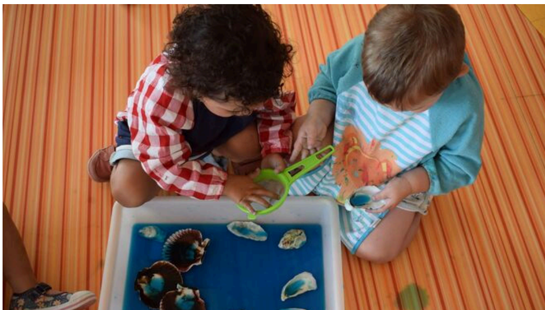
Dos niños en una guardería.

El Gobierno andaluz ha señalado este lunes que su propósito es avanzar de forma paulatina en el curso 2025-26 hacia la gratuidad del primer ciclo de Educación Infantil , el comprendido en la etapa de cero a tres años, aspiración que ha defendido como un compromiso alcanzado por el propio presidente de la Junta de Andalucía, Juanma Moreno.