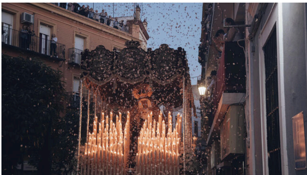
Una imagen de la Hermandad de los Panaderos en la Semana Santa de Sevilla 2023.

En esta jornada de la Semana Santa sevillana, nueve cofradías procesionan desde sus templos hasta la catedral. Para comenzar esta jornada, la mejor opción y también la más emotiva es desplazarse hasta el barrio de Nervión para ver a la hermandad de la Sed a su paso por el Hospital San Juan de Dios.