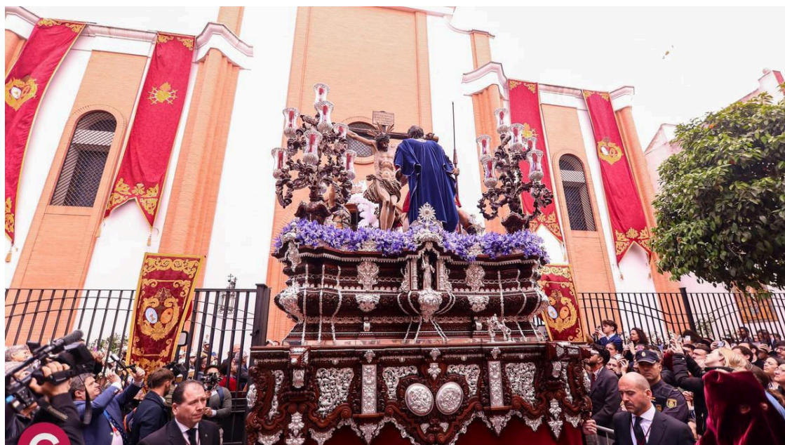
Santísimo Cristo del Desamparo y Abandono - El Cerro