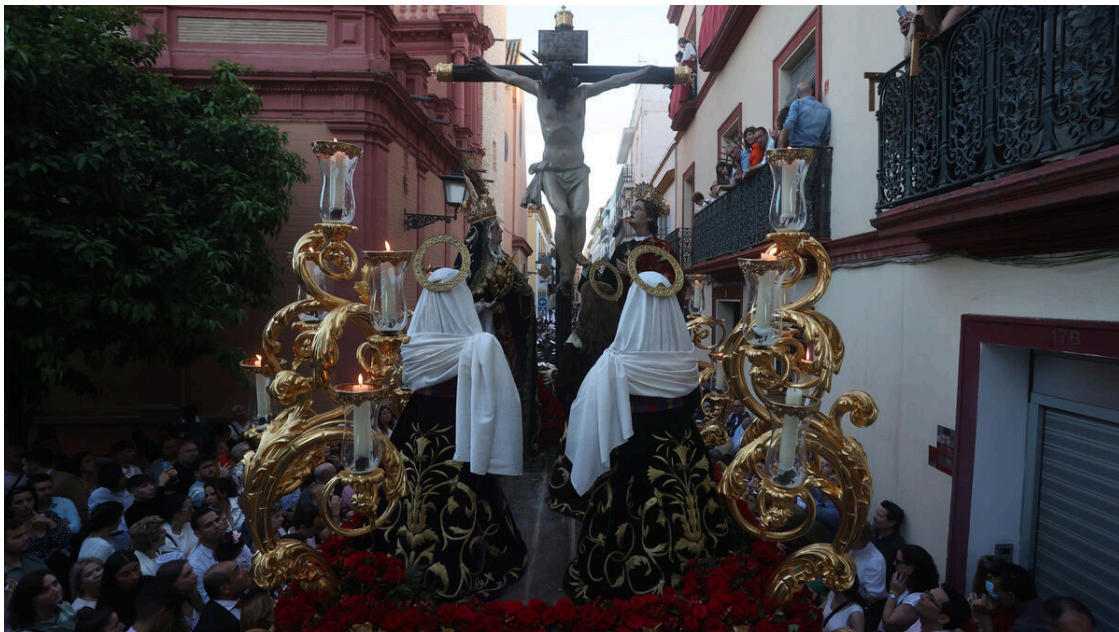
Una imagen de la hermandad de las Siete Palabras en la Semana Santa de Sevilla 2023.

Nuestro Padre Jesús de la Divina Misericordia, Santísimo Cristo de las Siete Palabras, María Santísima de los Remedios, Nuestra Señora de la Cabeza y San Juan Evangelista.