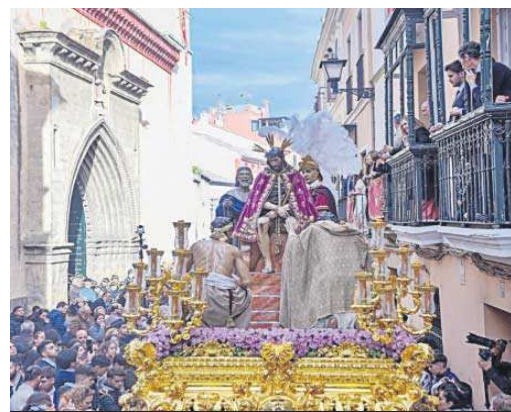
El capataz del Cristo de la Candelaria se dirige a sus hombres.