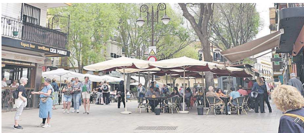
Una vista de la plaza de la Alfalfa en los días de cuaresma previos a la Semana Santa.