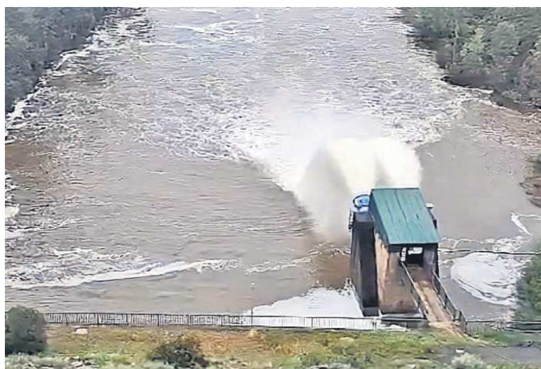
El embalse del Agrio suelta agua este lunes.

Aunque la del Agrio presenta la mejora más significativa, los embalses sevillanos vienen notando las últimas precipitaciones de marzo. Así, el Gergal, se encuentra al 76,8% de capacidad. También es un pantano pequeño, de 26,9 hectómetros cúbicos de vaso, que se sitúa en las