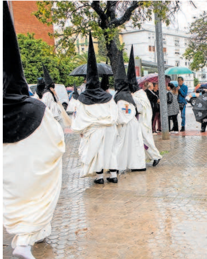
La lluvia impidió a la hermandad del Polígono de San Pablo realizar su estación de penitencia

Lo más probable es que esa cifra se incremente en los próximos días con el pronóstico de sucesión de frentes borascosos que irán entrando por el su-