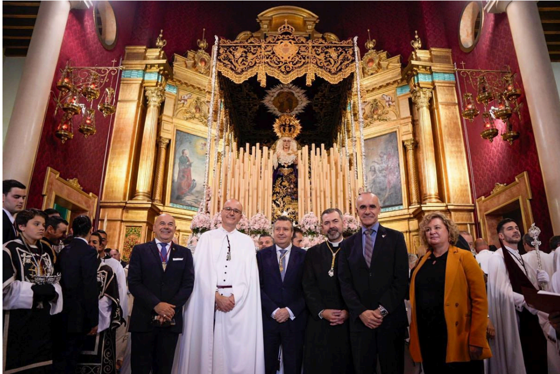
La Diputación en la ofrenda floral al Cerro del Águila

La ofrenda floral a la Hermandad del Cerro es un acto de profunda tradición que se celebra cada Martes Santo . En este emotivo encuentro, la Diputación de Sevilla renueva su compromiso con la cofradía y con el barrio del Cerro del Águila.