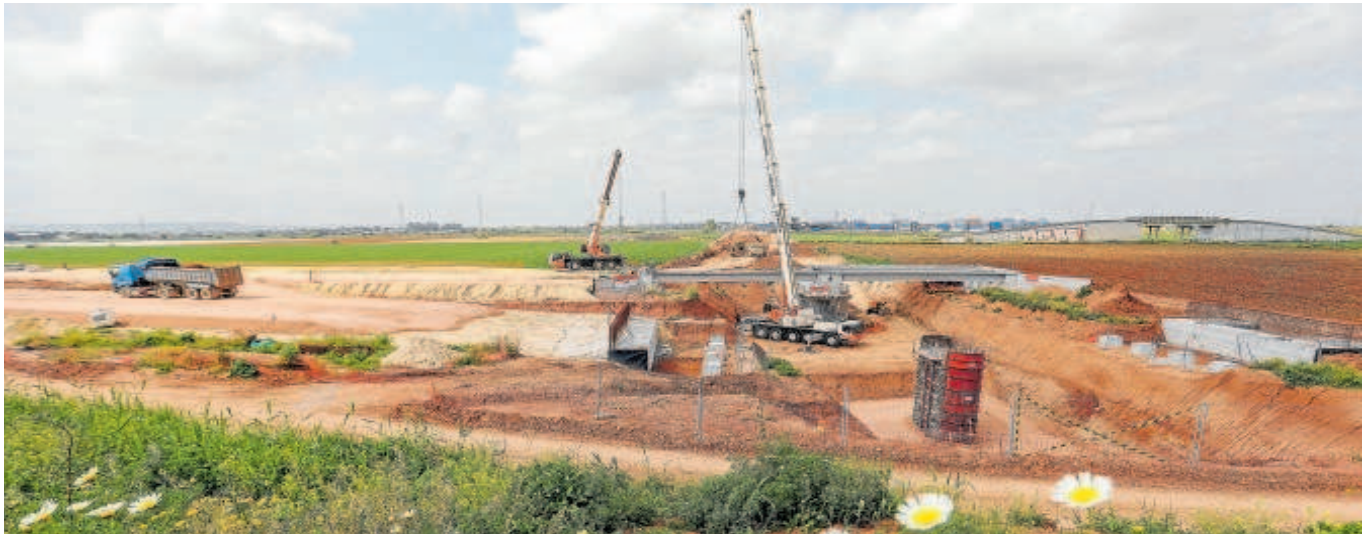
Obras del ramal técnico del Tramo Norte de la Línea 3 del Metro de Sevilla