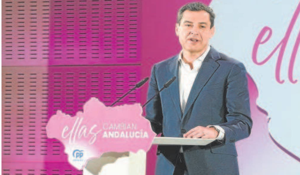
El presidente de la Junta de Andalucía, Juanma Moreno