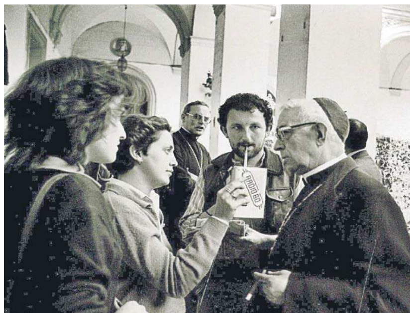
El autor de la crónica, con otras dos compañeras, entrevistando a Tarancón en 1983. Detrás, Carlos Amigo Vallejo.

Cuando se crea la Conferencia Episcopal, mediados de los sesenta, todavía vive Franco, pero la relación del Régimen con la Iglesia ha cambiado. En