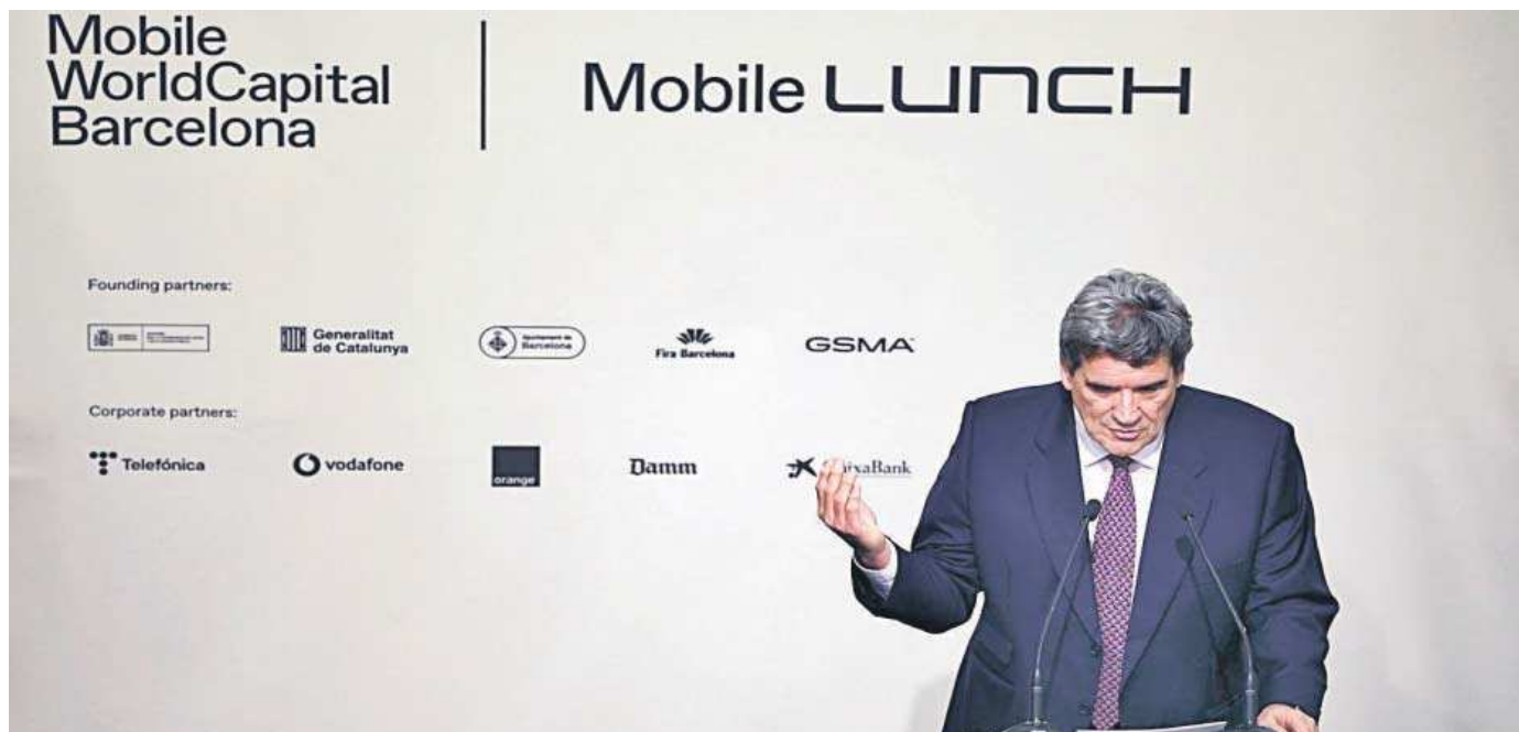
El ministro de Transformación Digital, José Luis Escrivá, hace unos días en el Mobile World Congress.

Distribuido para CONFEDERACIÓN DE EMPRESARIOS DE SEVILLA * Este artículo no puede distribuirse sin el consentimiento expreso del dueño de los derechos de autor.