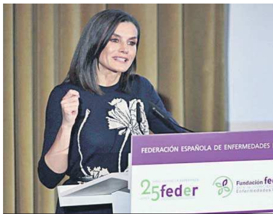
La Reina, en el atril, durante su intervención.

La Reina tuvo palabras para las familias. “Nos hemos reunido hoy aquí para reconocer a todas las personas que convivís con una enfermedad minoritaria y a las familias que compartís ese camino”, dijo. Y, sobre todo, alabó la “labor incansable” de Feder. “Remando con todas las asociaciones en una misma dirección para conseguir el máximo apoyo posible”, remarcó