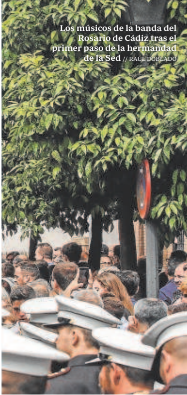
Los músicos de la banda del Rosario de Cádiz tras el primer paso de la hermandad de la Sed

nada, firman contratos muy similares a los de las bandas de Sevilla», confiesa. El presidente hace autocrítica pero recuerda que «esas mismas cofradías que buscan fuera las bandas son las que llaman a las de Sevilla para certámenes gratuitos, operaciones carretillas o para un concierto». Frente a ello, «no nos queda más que seguir trabajando para recuperar la confianza».