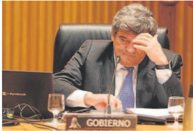
El ministro de Transformación Digital, José Luis Escrivá

En un escueto comunicado, el ministerio que dirige Escrivá explicó que, con este primer paso, la nueva entidad podrá estar operativa a partir del mes de mayo. Su creación, anunció el ministro, es «un paso más en el ambicioso proceso de transformación tecnológica que está protagonizando España, que permitirá crear sinergias entre las distintas iniciativas en los ámbi-