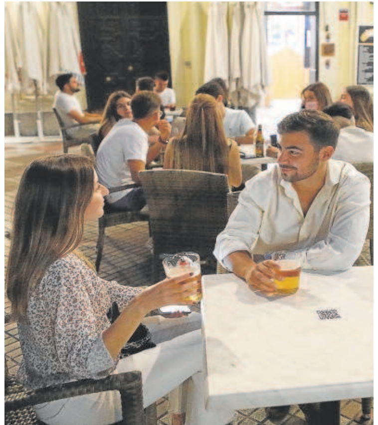
Cientes en la terraza de un bar de la capital cordobesa

«En Sevilla, durante varios meses al año, los clientes no salen a la calle antes de las nueve de la noche por el calor»