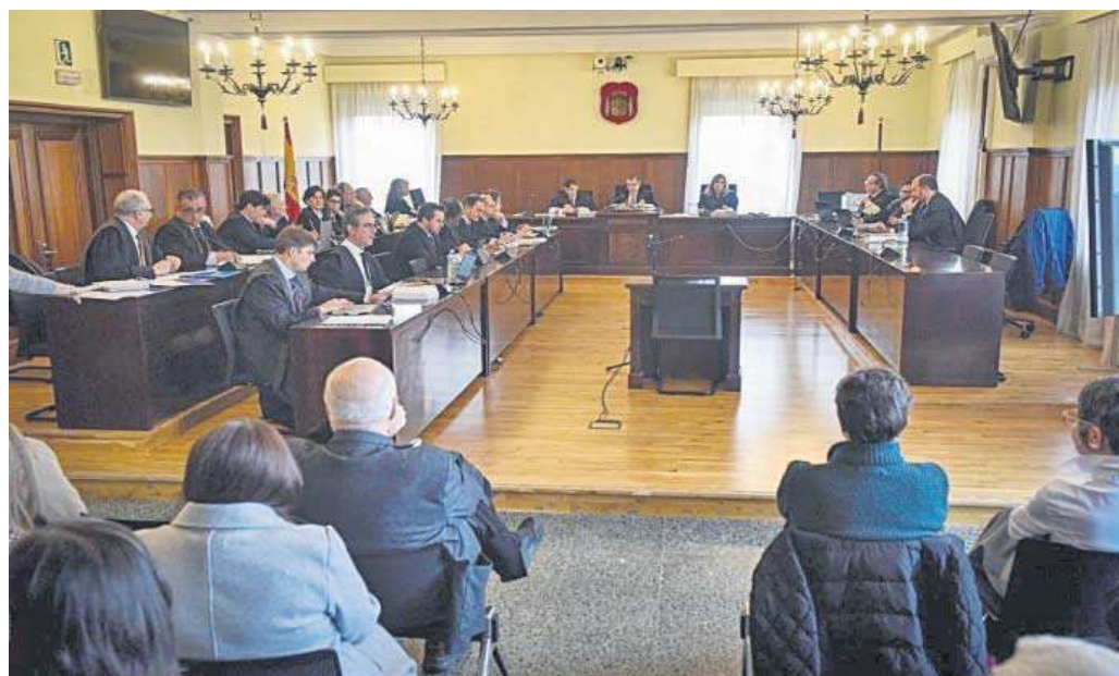
El juicio por las ayudas a UGT-A se reanudó ayer en la Audiencia de Sevilla.

“Mi sueldo seguro que estaba imputado a las subvenciones”, aseguró a preguntas del fiscal de Anticorrupción. Más tarde lo consideró justificado por las tareas que desarrollaba: “Es un gasto totalmente legible porque me dedicaba a justificar subvenciones. Nunca le pusieron objeción ni la auditora ni la Junta”, destacó el empleado, que estaba