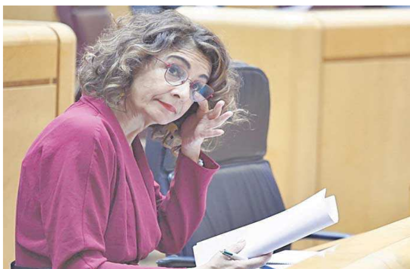
María Jesús Montero, vicepresidenta primera del Gobierno, ayer en el Pleno del Senado.

El pasado 7 de febrero, el PP ya hizo valer su mayoría absoluta en el Senado y tumbó los objetivos, de manera que forzó al Gobierno, tal y como establece la Ley de Estabilidad Presupuestaria, a volver a la casilla de inicio del trámite parlamentario y aprobar de nuevo