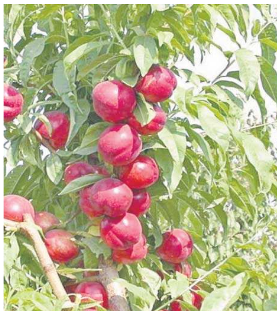
Árbol con nectarinas.