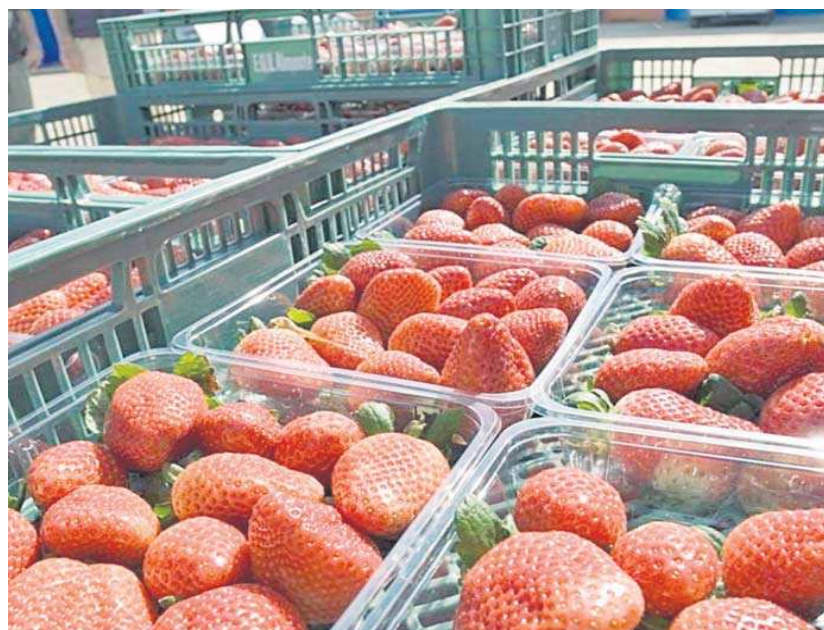
Unas cajas de fresas.

● El presidente de la Junta atribuye a Sanidad Exterior una falta de control de la partida de 1.500 kilos, que “no ha sido comercializada”