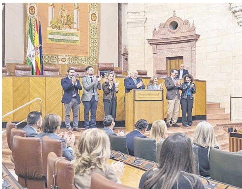
Lectura del manifiesto en el Día internacional de la Mujer del año pasado en el Parlamento de Andalucía.

La portavoz del PSOE, fue la más dura al señalar que esa actitud respondía a un deseo de “hacerse los ofendidos” cuando “está claro que tenemos razones más que sobradas para no creer nada de lo que el Gobierno de Moreno Bonilla nos dice”. Ferriz intentó desligar el lema de la campaña de los eslóganes coreados con motivo del caso de la Manada y aclaró que esa campaña de descreimiento iba “desde la sanidad que riega con millones a