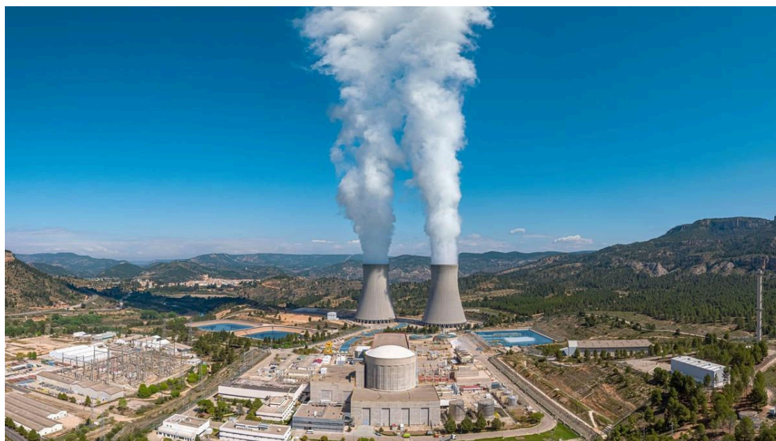
Vista panorámica de la Central Nuclear de Cofrentes / CENTRAL NUCLEAR DE COFRENTES

El Gobierno da marcha atrás y frena el proceso legal que había lanzado para aplicar una fortísima subida de casi el 40% de la tasa que pagan las centrales nucleares para financiar los costes millonarios de desmantelar todos los reactores, construir siete cementerios nucleares y gestionar durante décadas todos los residuos radiactivos.