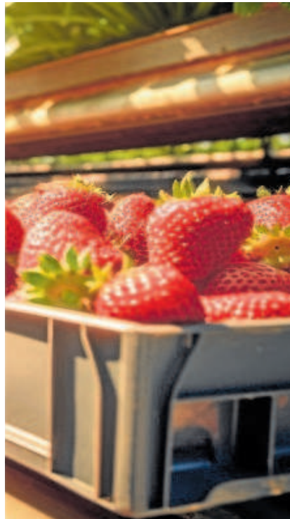
Cargamento de fresas

El pasado septiembre, fue la aceituna, que sí llegó a distribuirse por España y que el sistema europeo calificó como «alerta grave»: tenía una alta cantidad del pesticida clorpirifos, una sustancia prohibida en la UE desde 2020 por sus posibles efectos nocivos para la salud.