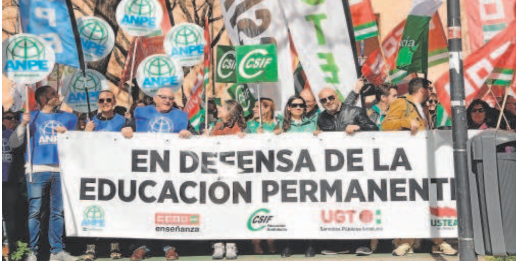
Imagen de la concentración de ayer ante la delegación territorial de Sevilla

Sindicatos, maestros y alumnos inician movilizaciones contra el proceso emprendido por la Consejería de Educación de la Junta para incorporar a profesores de Secundaria