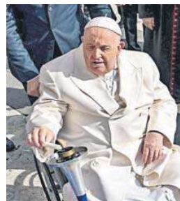
El papa Francisco.

tual Papa recibe en audiencia a un representante político español. Tampoco ha sido un acontecimiento lejano. El pasado 2 de febrero, la vicepresidenta segunda y ministra de Trabajo y Economía Social, Yolanda Díaz, mantuvo una audiencia privada con el Santo Pontífice en la Biblioteca Privada del Palacio Apostólico del Vaticano, donde manifestaron su preocupación por los estragos que están causando las guerras en Ucrania y la Franja Gaza. Díaz también fue recibida en audiencia por Francisco en diciembre de 2021.