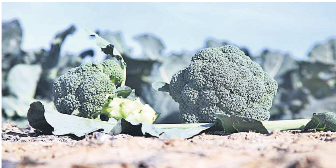
Brócolis en un campo de cultivo.