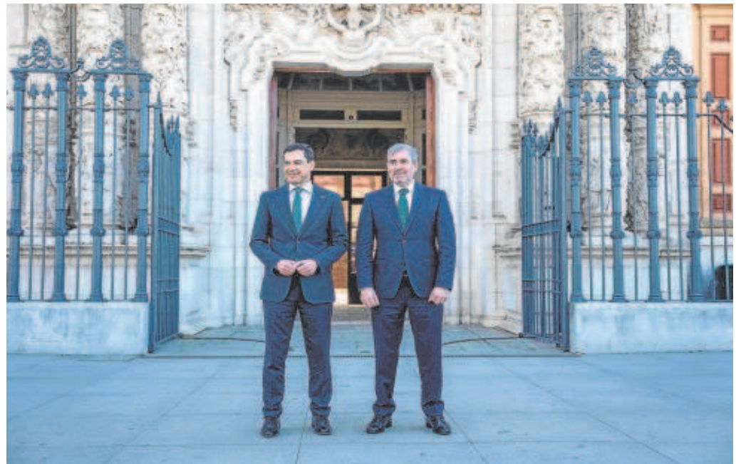
El presidente de la Junta, Juanma Moreno, en un encuentro ayer con su homólogo canario, Fernando Clavijo

En esta línea Clavijo reivindicó una «vía del diálogo y entendimiento» permanente entre administraciones frente a un marco de confrontación y destacó la estrategia que se ha seguido desde Andalucía con el Gobierno de España con pactos como el firmado con el Ministerio para Doñana.