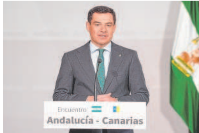
El presidente andaluz, Juanma Moreno