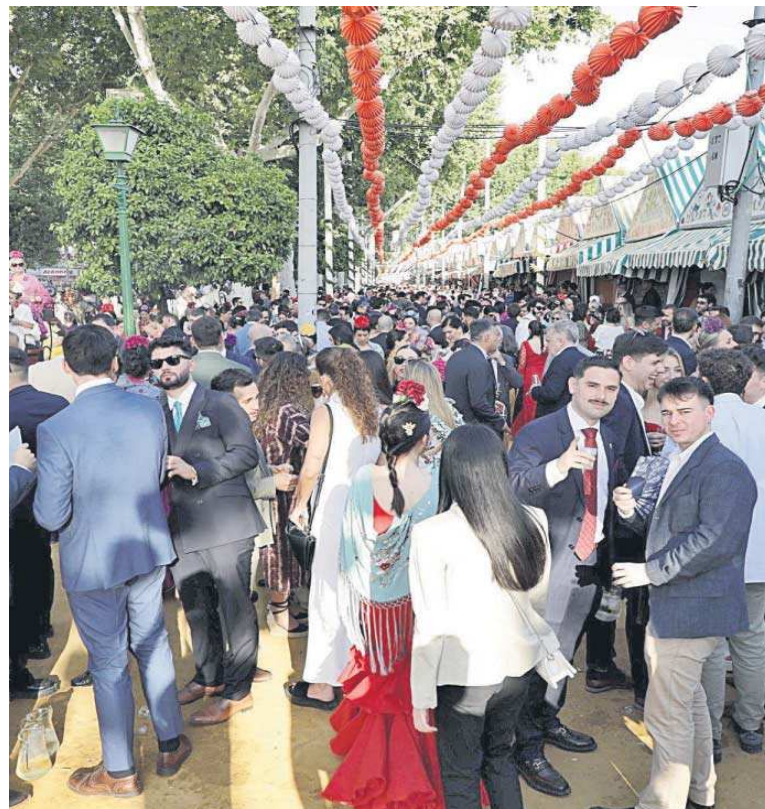
Lleno absoluto en las calles del real el pasado martes de Feria.

Desde el pasado 9 de abril se han descargado más de 58.000 códigos para la votación electrónica. Esta cifra supone más del 10% del censo de la consulta, un