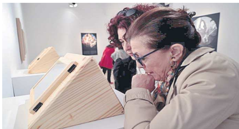
Dos visitantes contemplan una de las obras de la exposición.

Sevilla, a principios del siglo XX, era destino para artistas, creadores, pintores. Aquí estuvo Picabia en 1902, Matisse en 1910, Sorolla en 1914. Y en aquel año de la Gran Guerra, como decíamos, Auguste Léon. El fotógrafo trabajó con una técnica in-