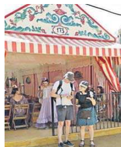
Dos turistas en la Feria.

Según Cornax, ha sido una gran Feria al no tener incidentes. “Hemos demostrado en numerosas ocasiones y una vez más en una