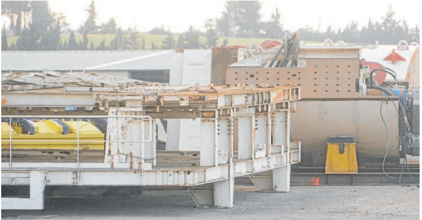
La tuneladora de la SE-40, ayer, tras ser trasladada durante la Feria a las instalaciones de Migasa, la empresa que la adquirió para ahora venderla