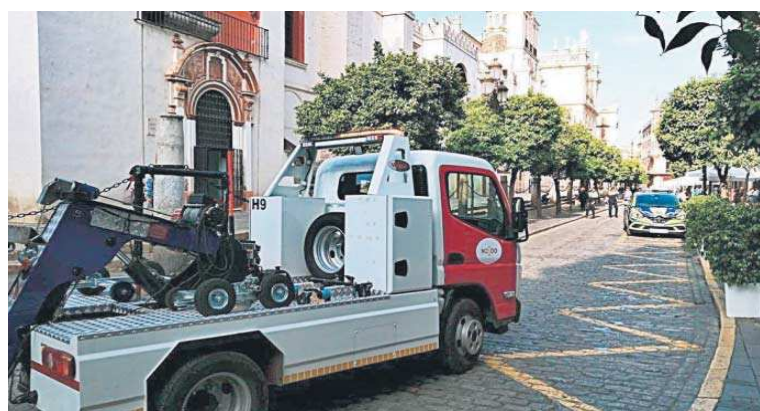
Un vehículo de la grúa municipal por la calle Alemanes.

Esta anuncio se produce en un contexto en el que la plantilla ha protagonizado una convocatoria de paros parciales durante la Feria de Abril, tras haber renunciado a la misma medida en Semana San-