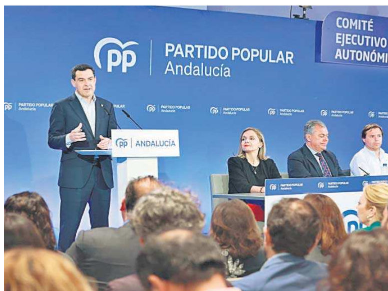
Juanma Moreno interviene en el comité ejecutivo del PP andaluz.

La confrontación mutua entre el Gobierno central y el de la Junta, que es un clásico de la política andaluza, ha adquirido una mayor crudeza escénica con