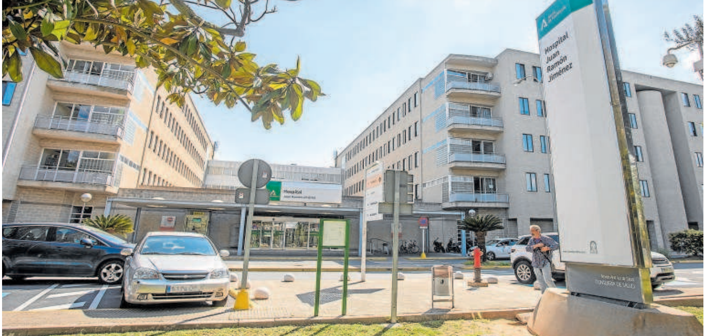
Exterior del hospital Juan Ramón Jiménez de Huelva