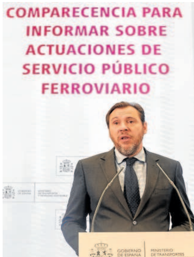
El ministro de Transportes, Óscar Puente, el pasado viernes en Madrid