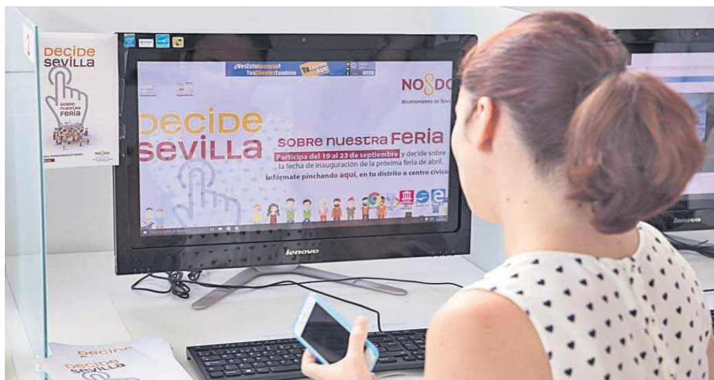
El apartado para la consulta de la Feria habilitado en 2016 en la plataforma DecideSevilla.