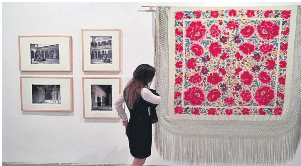
Una visitante recorre la muestra 'Tras la senda de los Lumière. Sevilla en color (1914-1929)' en La Casa de la Provincia.