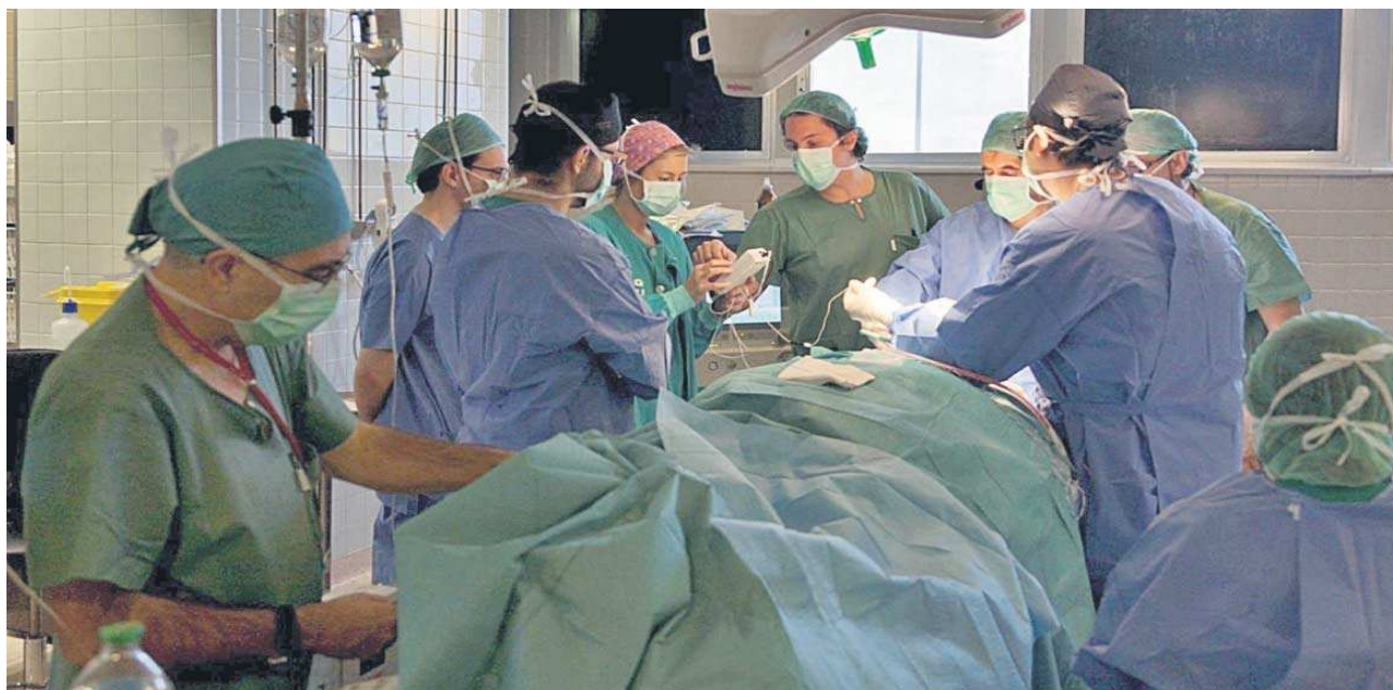
Personal sanitario en el interior de un quirófano durante una intervención quirúrgica en un hospital del Servicio Andaluz de Salud (SAS) en Sevilla.