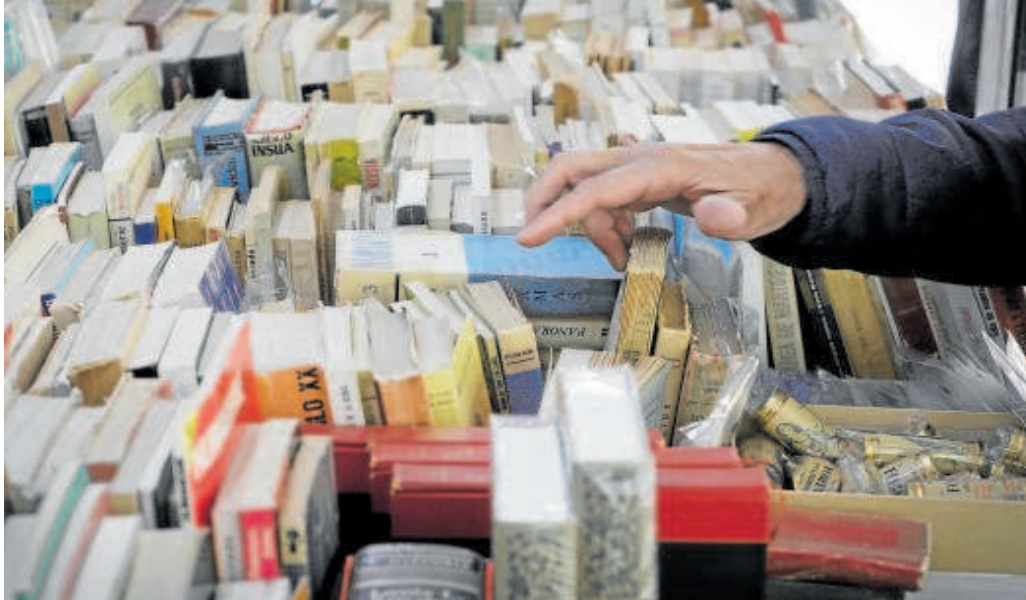
Varios libros en uno de los expositores de la Feria del Libro de Sevilla