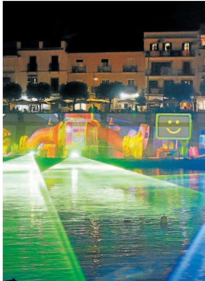
Espectáculo audiovisual proyectado el año pasado en el río

Además, se levantarán tres figuras volumétricas luminosas de gran tamaño en la explanada delantera del pala-