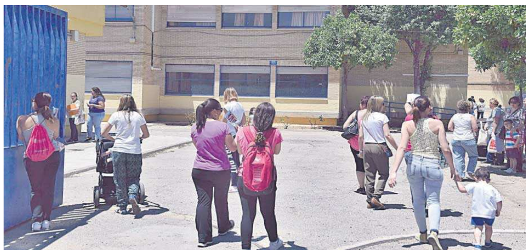
El CEIP Teodosio, en Pino Montano, reclama el aula que ha perdido para el próximo curso.