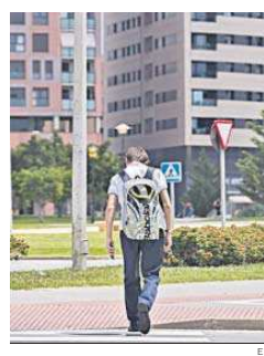
Un joven, frente a un bloque de pisos.

La Secretaría General de Vivienda explica que después de "descontar las solicitudes dupli-