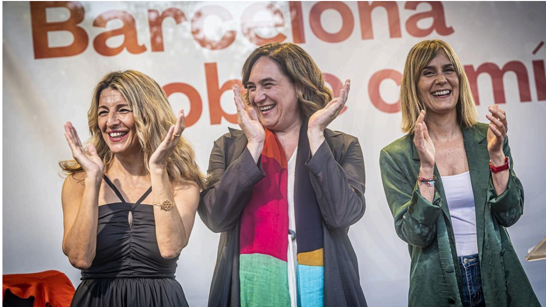
La candidata de los Comuns, Jéssica Albiach (a la derecha), con Ada Colau y Yolanda Díaz en un acto electoral .

La vicepresidenta segunda y ministra de Trabajo, Yolanda Díaz , se volcará en la campaña para las elecciones al Parlament del próximo 12 de mayo, con el objetivo de mejorar resultados y compensar en Catalunya los malos resultados de Sumar en los comicios gallegos y los discretos de este pasado domingo en Euskadi . La líder de Sumar participará en tres actos durante la campaña electoral y uno antes, aprovechando la festividad de Sant Jordi . Díaz tendrá un peso protagónico en el 'tourmalet' que han preparado los Comuns durante las próximas semanas, mientras que la presencia de la ex alcaldesa de Barcelona, Ada Colau , es una incógnita.