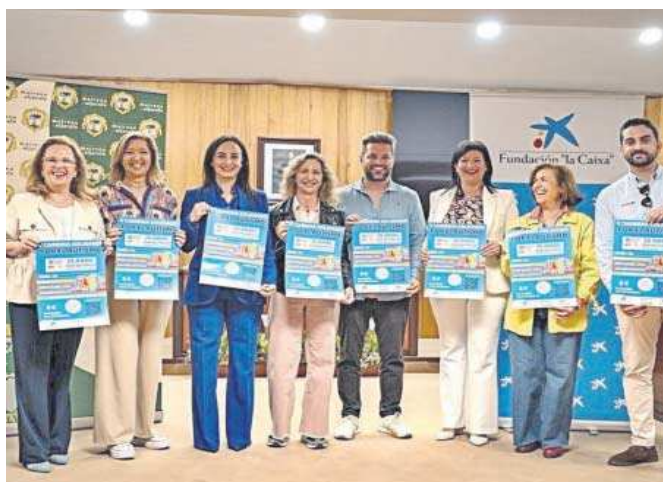
Presentación del cartel en el Ayuntamiento de Mairena del Aljarafe