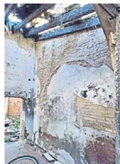
Interior afectado por el fuego.

El Cortijo de San Ildefonso se encuentra enclavado en el Parque del Tamarguillo, en las proximidades de la Avenida Séneca, en la barriada de Parque Alcosa, del Distrito Este-Alcosa-Torreblanca. El 23 de marzo de 2006, la junta de gobierno local acepta que los terrenos ocupados por esta construcción pasen a disposición municipal, adscribiéndose el cortijo a la Delegación de Empleo. Se encuentra sin uso específico desde el 7 de diciembre de 2012, cuando el gobierno municipal acuerda desalojar a la Aso-