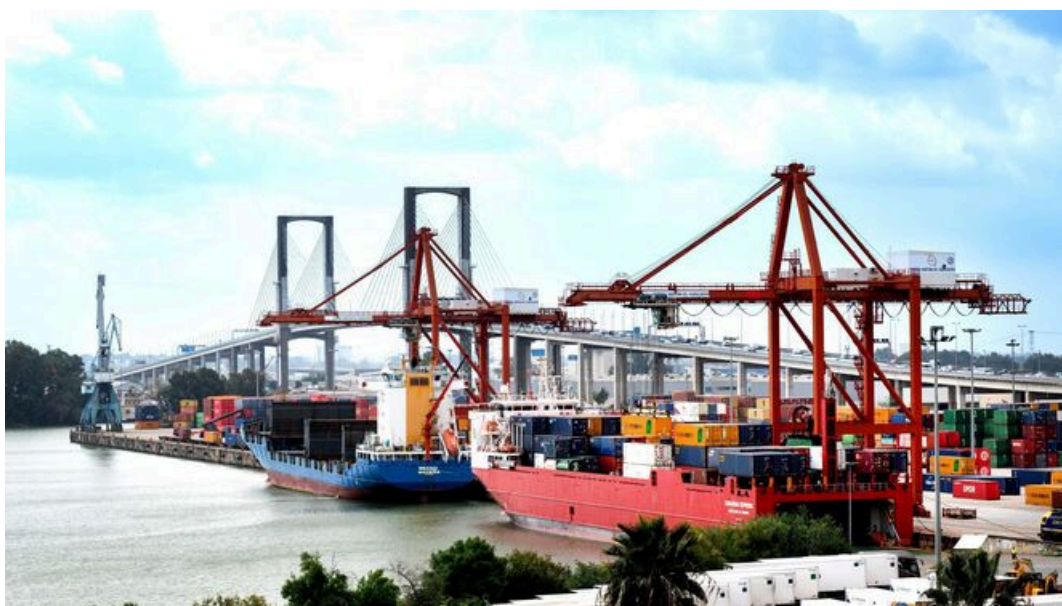
El Puerto de Sevilla promociona su potencial logístico en el Salón Internacional de la Agricultura en Marruecos (SIAM)

Una delegación de la Autoridad Portuaria de Sevilla (APS) participa estos días en el Salón Internacional de la Agricultura en Marruecos (SIAM) para impulsar las relaciones comerciales del puerto sevillano con los puertos africanos y presentar su capacidad logística y sincromodal para el transporte de mercancía contenerizada y rodada . Este Salón, que acoge a más de un millón de visitantes, se celebra en la ciudad de Menkes hasta el 28 de abril bajo el lema Clima y agricultura: por unos sistemas de producción sostenibles y resilientes .