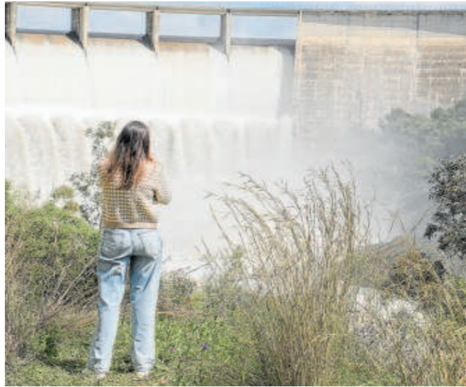
Pantano de El Gergal desembalsando agua

Hay que destacar que el año 2024 ha supuesto un cambio en el comportamiento de las precipitaciones recibidas en nuestra zona. Desde enero se han recibido más de 250 hectómetros cúbicos, de los cuales 130 han sido gracias a las lluvias recibidas durante la última semana del mes de marzo, en Semana Santa.