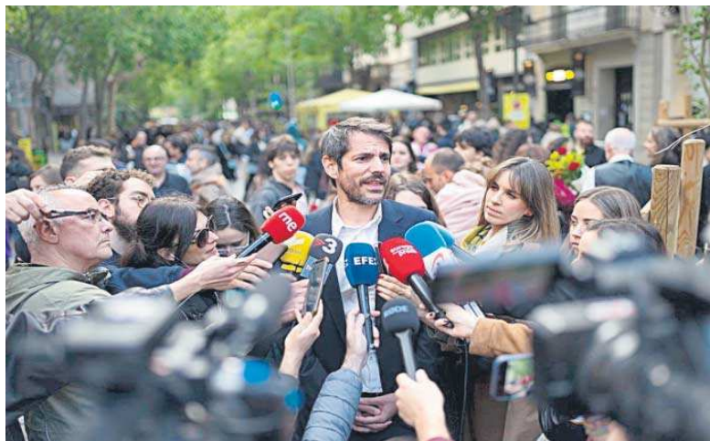
El ministro de Cultura, Ernest Urtasun, atiende ayer a los medios en la Rambla de Barcelona.