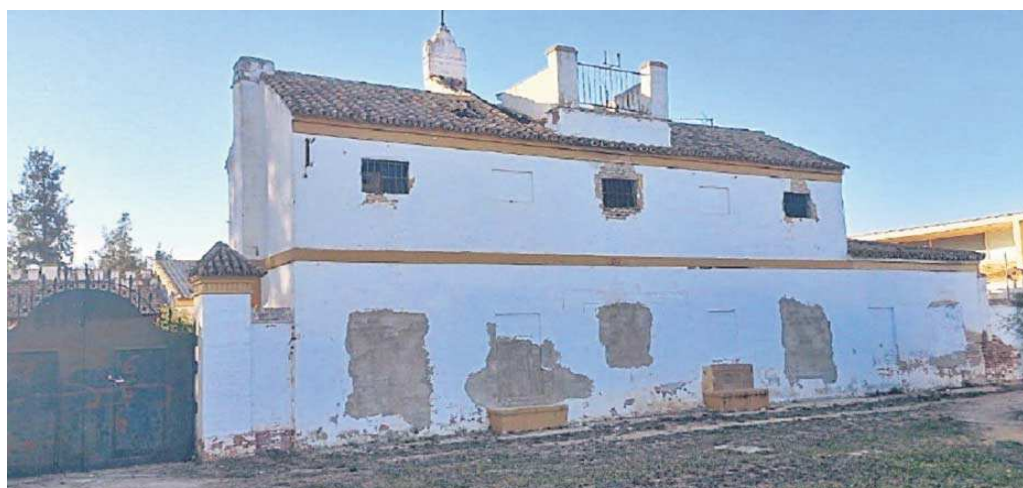
La fachada principal del señorío del Cortijo de San Ildefonso.

● Esta construcción, uno de los pocos ejemplos de patrimonio agrícola, se encuentra en un estado de muy delicado