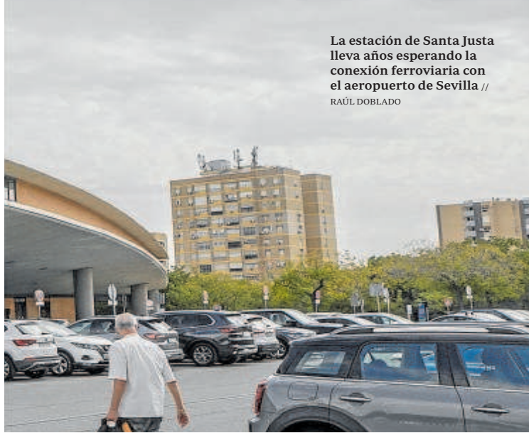
La estación de Santa Justa lleva años esperando la conexión ferroviaria con el aeropuerto de Sevilla //