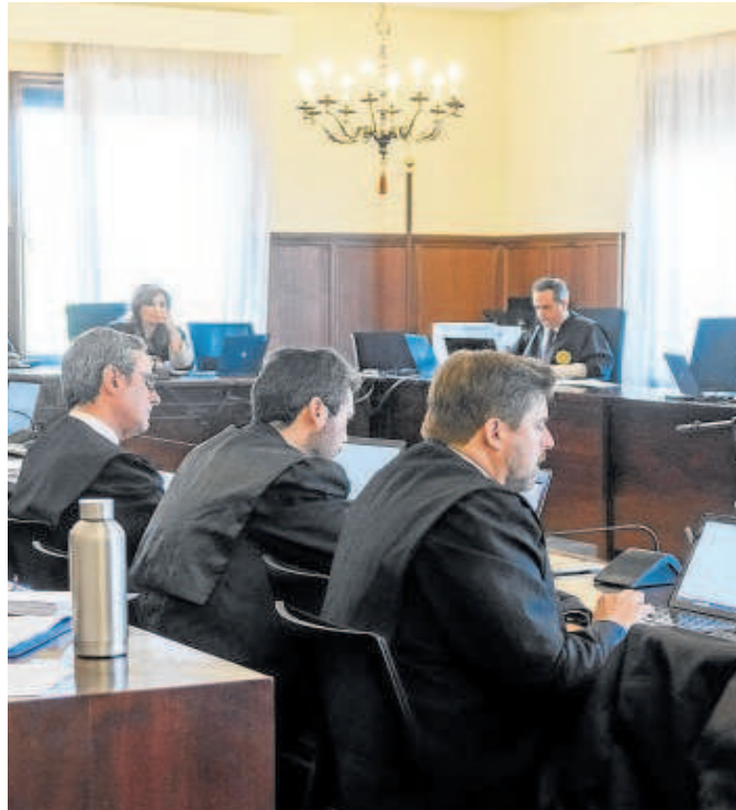
Imagen de las defensas y al fondo, el fiscal, durante el juicio