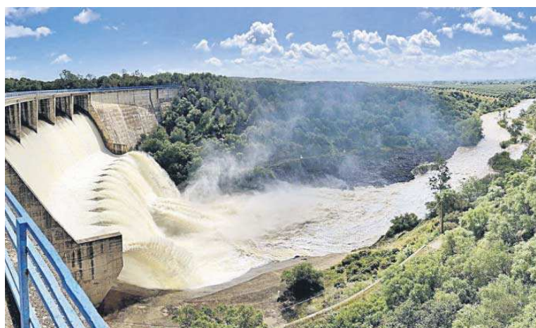
El embalse del Gergal desembalsando agua tras las lluvias de Semana Santa.

Actualmente, los embalses que abastecen el sistema de Emasesa almacenan 434 hm 3 , por lo que el sistema está al 67,6% de su capacidad total, lo que supone que el volumen disponible se sitúa por encima del umbral de prealerta, establecido en 324 hm 3 , y es suficiente para mantenernos en situación de normalidad durante los próximos meses, al menos hasta final de año. Serán las lluvias de lo que resta de primavera y del próximo otoño las que determinen cuánto tiempo más continuará la normalidad.