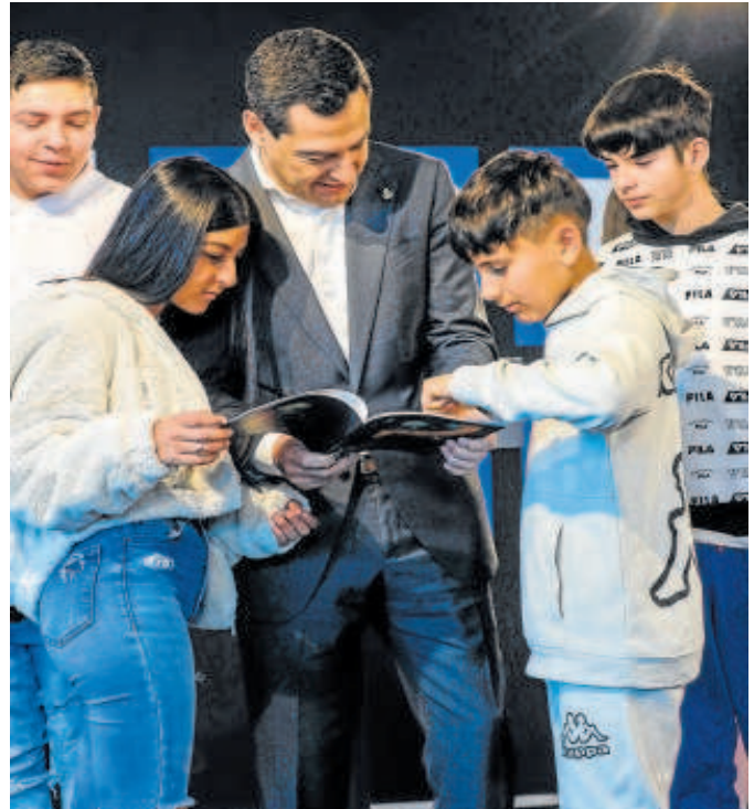
Juanma Moreno con algunos de los niños que han escrito el libro

El presidente de la Junta se refirió a la importancia que tiene el leer para cambiar y mejorar sociedades: «Cuando uno lee, puede soñar. Es importante que los libros se consuman por toda Andalucía. Los libros nos enseñan muchas cosas. Cada vez que se abre un libro en el Polígono Sur, se derrumba un tópico. Nos enseñan a pensar