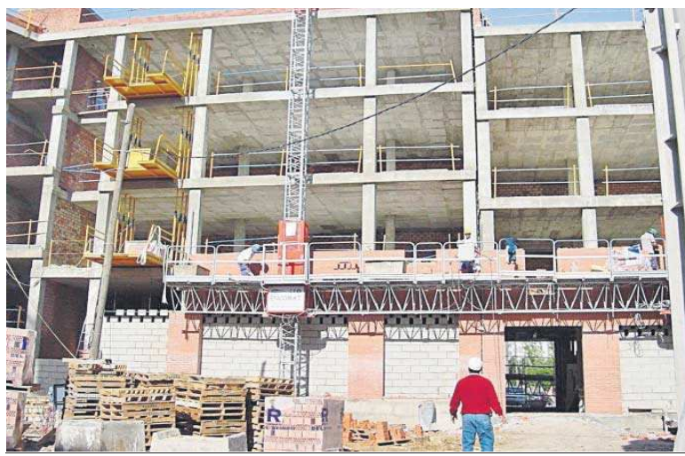
Viviendas en construcción.

Por otro lado, el estudio pone de relieve que casi 4 millones de vi-