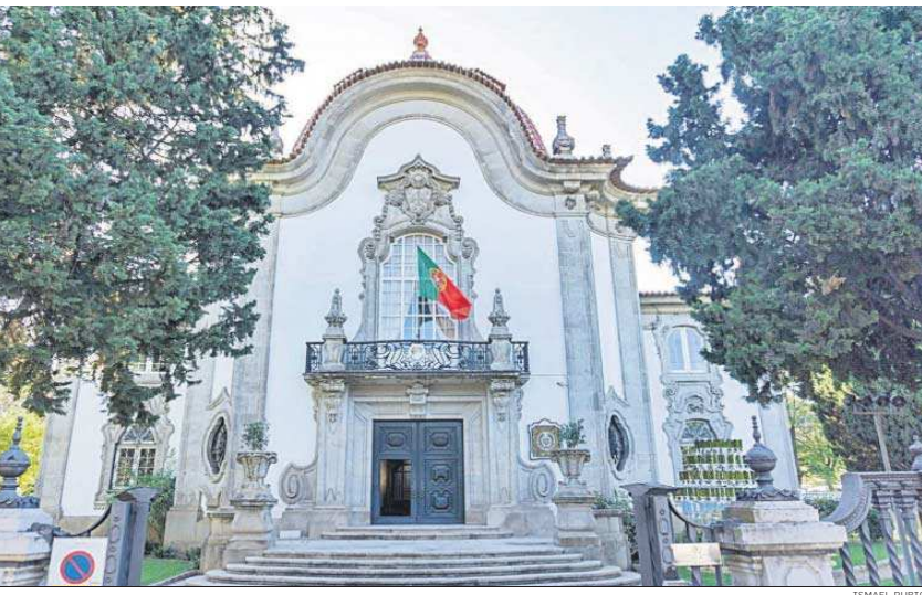
El consulado de Portugal de la Exposición de 1929.