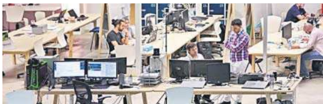
El Cubo es el centro de Andalucía Open Future en Sevilla.

Una vez realizada la primera criba, el equipo de Andalucía Open Future está evaluando el proyecto empresarial de 64 candidaturas. El proceso de selección que se está llevando a cabo en los cuatro hubs de la iniciativa –El Cubo, La Farola, El Cable y El Patio– sigue criterios de innovación, valor de la propuesta, madurez del proyecto, equipo de trabajo, viabilidad del modelo de negocio y mercado po-