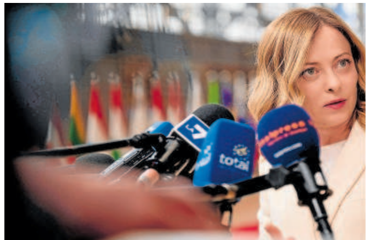
Giorgia Meloni, primera ministra de Italia

En línea con el retoque de los planes, y con la connivencia de Cattaneo, por tanto de Meloni, a finales de febrero de este año, Bogas volvía a anunciar que la compañía estaba «en avanzadas negociaciones» con varios candidatos, entre los que se encuentran fondos de inversión y grupos industriales, para incorporar, «antes de que acabe el primer semestre», un socio financiero al accionariado del negocio de renovables. «Con un apalancamiento de 2,4 veces el ebitda, no seríamos capaces de abordar este plan solos», afirmó Bogas, que añadió que «con el nuevo socio, tendremos el volumen necesario para duplicar nuestras inversiones actuales».