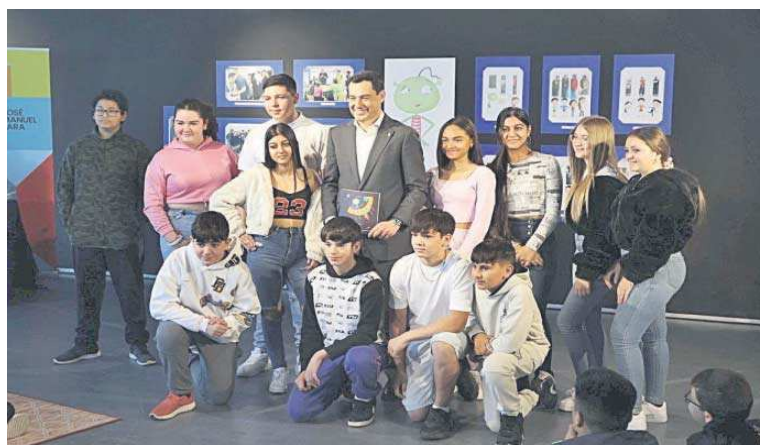
El presidente de la Junta, Juanma Moreno, junto a los autores del cuento 'Doiz viaja a la Tierra'.

mos juzgar a nadie por su apariencia, porque cada uno tiene su forma de ser y de pensar”.