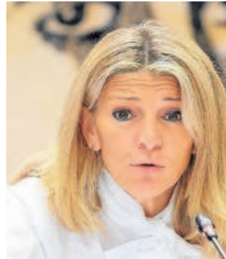
Yolanda Díaz

En su versión oficial, Sumar no admite que retrasen la integración de los partidos por este conflicto. Fuentes de Sumar se han limitado a trasladar el cambio en la organización sin mayor detalle. Y retrasan la entrada de los partidos sin una fecha fija. «El sábado, el Grupo Coordinador elige a la Ejecutiva. Más adelante, los partidos elegirán a quienes quieren que formen parte tanto del Grupo Coordinador como de la Ejecutiva. Ellos incorpora-