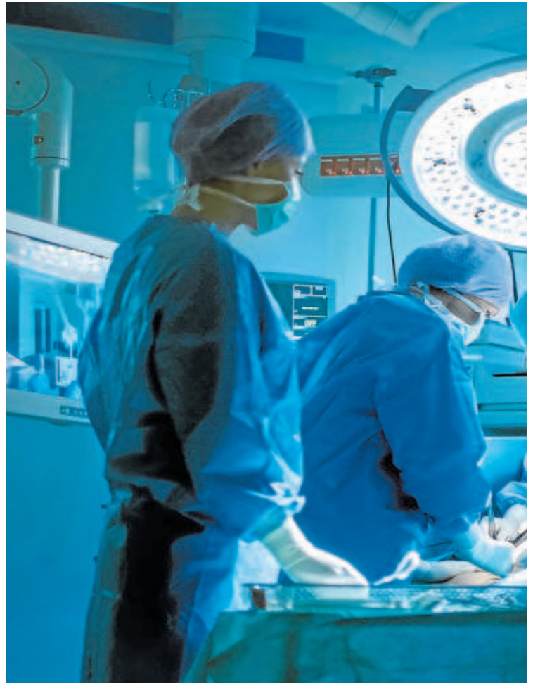
Varios cirujanos en el momento de acometer una operación

Reducir el número de pacientes con más de un año de espera permite también recortar los tiempos medios de demora en Andalucía. Concretamente,