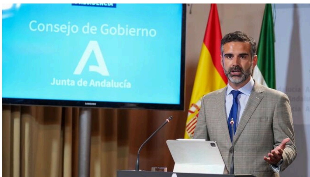
El portavoz del Gobierno andaluz esta mañana en San Telmo.

El Consejo de Gobierno ha aprobado los proyectos de ley por los que se reconocen a la Universidad Alfonso X el Sabio Mare Nostrum y a la Universidad Europea de Andalucía , ambas de naturaleza privada, en el marco del sistema de enseñanza superior de Andalucía. Una vez superado este paso, ambas normativas se remitirán al Parlamento de Andalucía para su debate y aprobación como ley, tal y como establece el marco legislativo vigente, que viene definido por la legislación estatal y por la norma autonómica en la materia, la Ley Andaluza de Universidades (LAU) .