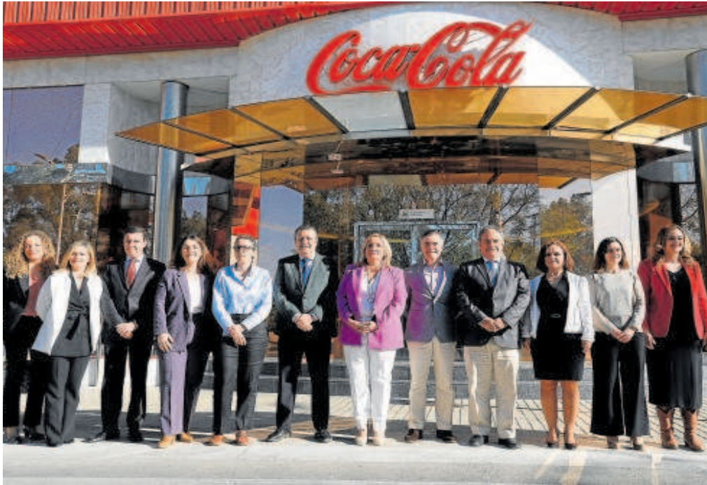
Los participantes en las jornadas, ayer en la planta de Coca Cola en La Rinconada