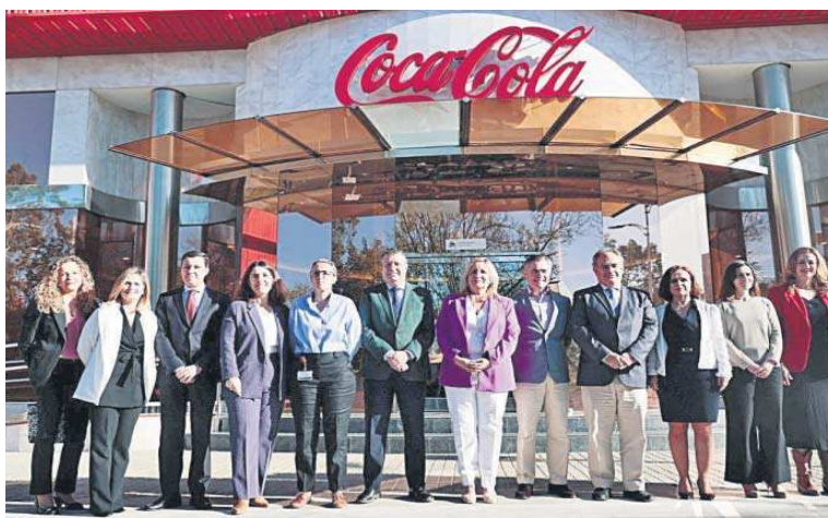
Los participantes en la jornadas sobre la gestión de la sostenibilidad del agua celebrada en Coca-Cola.

Vera dio algunos datos que avalan esta importancia de la gestión hídrica. “La obra pública hídrica ha alcanzado el 42%, generan 22.500 empleos y suponen el 1,5% PIB andaluz. La comunidad autónoma andaluza ha logrado sumar 126