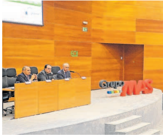
El Grupo MAS presentó ayer su Memoria de Sostenibilidad y entregó su III Premio Iniciativa Sostenible

Martín resaltó cómo la segunda generación ya está tomando las riendas de la compañía. «Tenemos un gran equipo de profesionales, un proceso de sucesión ordenado y, sobre todo, en este 2023 hemos culminado dos proyectos estratégicos que afianzan el compromiso de nuestro grupo con un modelo de negocio sostenible: el Centro Logístico en Guillena y el Centro de Actividades de los Objetivos de Desarrollo Sostenible de Sevilla, único en Andalucía y gestionado por Fundación MAS», argumentó. De su lado, el viceconsejero de Sostenibilidad, Medio Ambiente y Economía Azul, destacó que «el Gru-