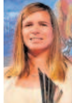
Marina Alabau Campeona olímpica

«Yo no voy a la Feria pero por mis hijos migrados he votado el formato largo»