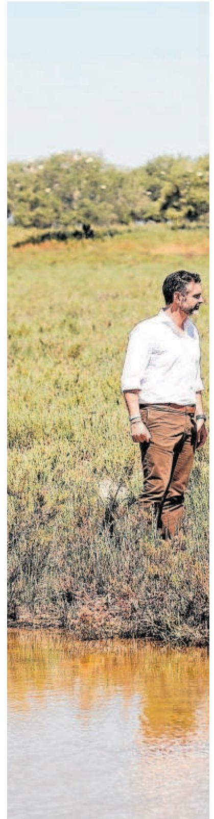
Juanma Moreno, flanqueado por el consejero de

«Que no se olvide que las restricciones alcanzarán hasta el 34% de la dotación en el Sistema de Regulación General, así que de normalidad nada», aseveró el presidente de Feragua, que subrayó además en que este nuevo recorte coge al regadío «muy castigado por la pérdida de producción y rentabilidad de los últimos años». «No es lo mismo una restricción del 36% después de una época buena que una restricción del 36% después de cinco años muy malos».