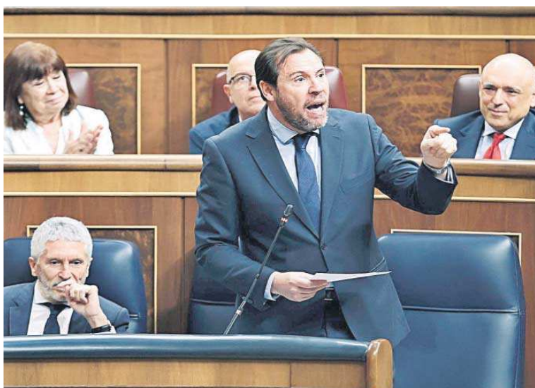
El ministro Óscar Puente, ayer en el Congreso.

Transportes reitera que el estudio de viabilidad que debe estar listo este año es una primera