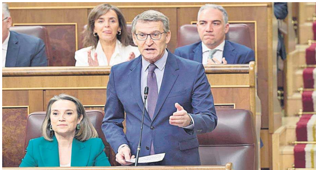
El presidente del Partido Popular, Alberto Núñez Feijóo, junto a Cuca Gamarra, pregunta ayer a Pedro Sánchez en la sesión de control al Gobierno.