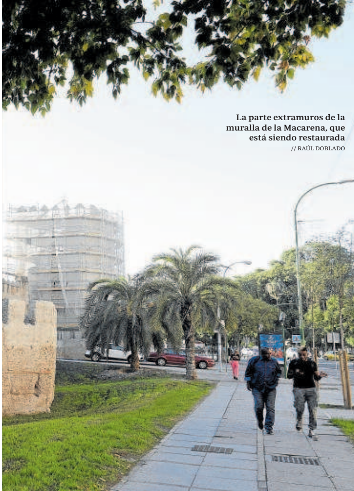
La parte extramuros de la muralla de la Macarena, que está siendo restaurada