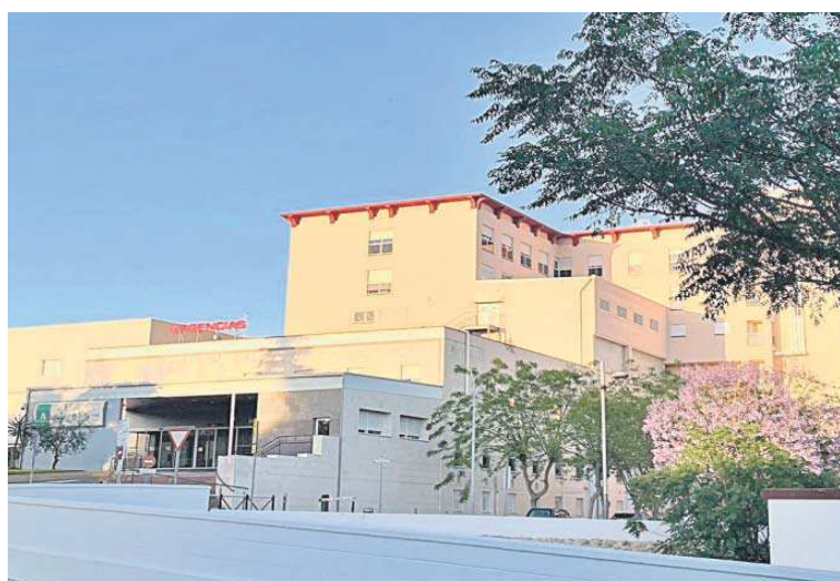
El acceso a las Urgencias del Hospital de La Merced de Osuna.

De esta forma, el Hospital de Osuna se suma a la condición de universitario junto al Hospital Universitario Virgen del Rocío, al Hospital Universitario Virgen Macarena y al Hospital Universitario Virgen de Valme, en la provincia de Sevilla.