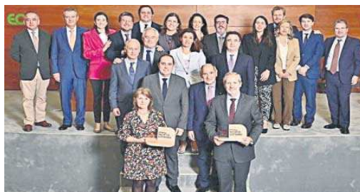
Fotografía de familia de la presentación de la Memoria de Sostenibilidad. M. G.

miso de Grupo MAS con el cumplimiento de los Objetivos para el Desarrollo Sostenible (ODS), supone un resumen de toda la actividad de Grupo MAS a lo largo de toda la cadena de valor en 2023, año en el que la compañía celebró su 50 Aniversario