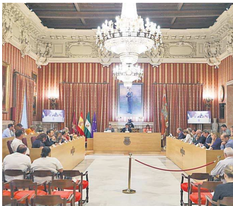
Un Pleno en el Ayuntamiento de Sevilla.

Quien fuera alcalde hasta mayo de 2023 defiende que la Feria de siete días permite “mayor agilidad y planificación en el des-