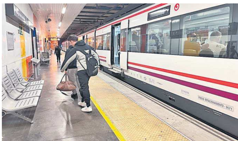
Pasajeros ante un tren de cercanías en la estación María Zambrano de Málaga.