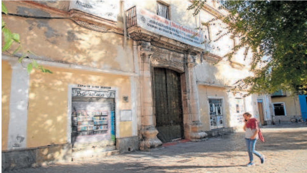
Las obras de remodelación del inmueble tienen un valor cercano a los ocho millones de euros