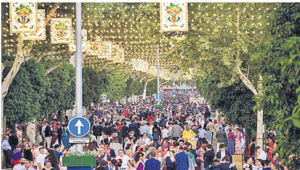
El real durante una noche de la pasada Feria de Abril.