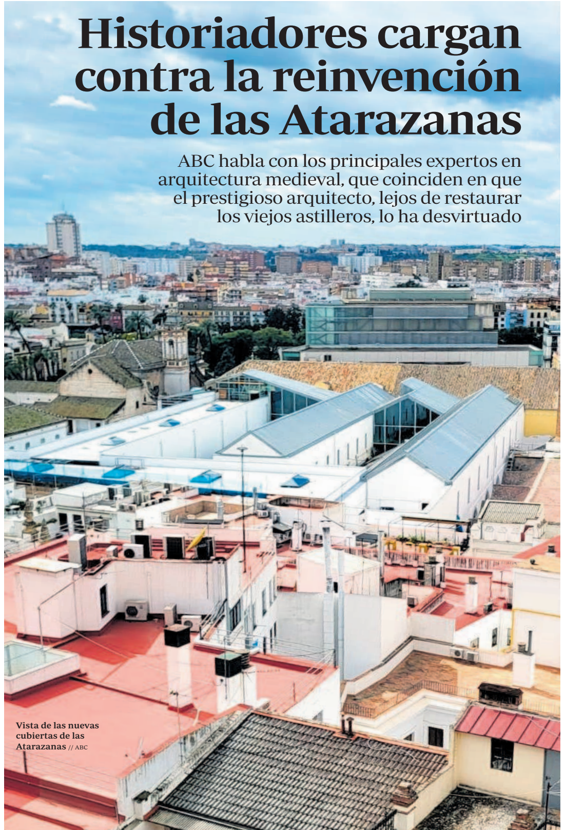
Vista de las nuevas cubiertas de las Atarazanas

ABC habla con los principales expertos en arquitectura medieval, que coinciden en que el prestigioso arquitecto, lejos de restaurar los viejos astilleros, lo ha desvirtuado