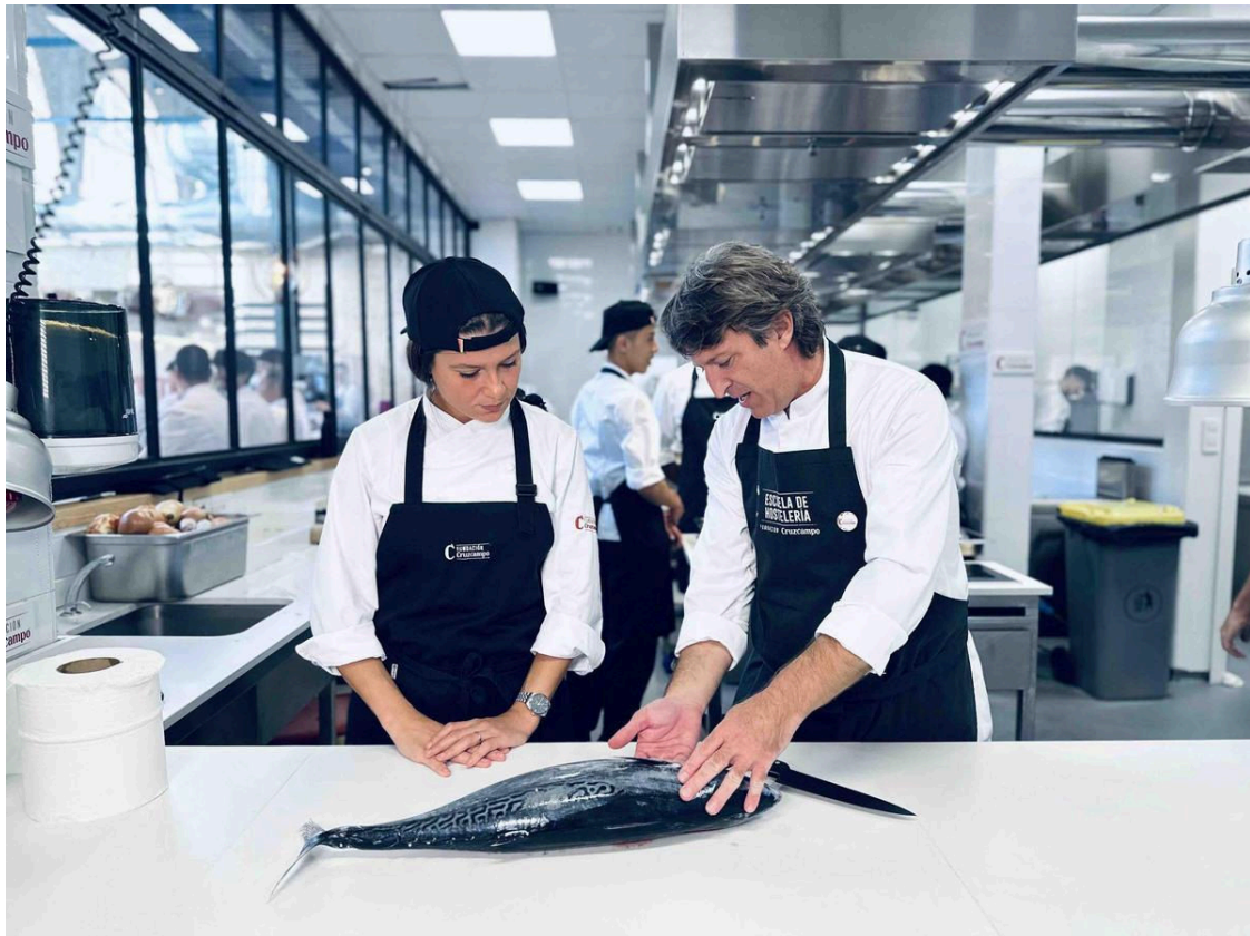
V Edición Talento Cruzcampo / El Correo

Fundación Cruzcampo cubrirá el 90% del coste de participación de cada joven admitido y otorgará ayudas de alojamiento valoradas en 2.500 anuales a aquellos jóvenes cuyas residencias habituales no se encuentren en la provincia de Sevilla, donde tiene lugar la formación. Los requisitos para participar son: ser menor de 30 años , estar desempleado y tener ganas de desarrollar todo el potencial y dar lo mejor de uno mismo . Las inscripciones pueden realizarse ya en la página web .