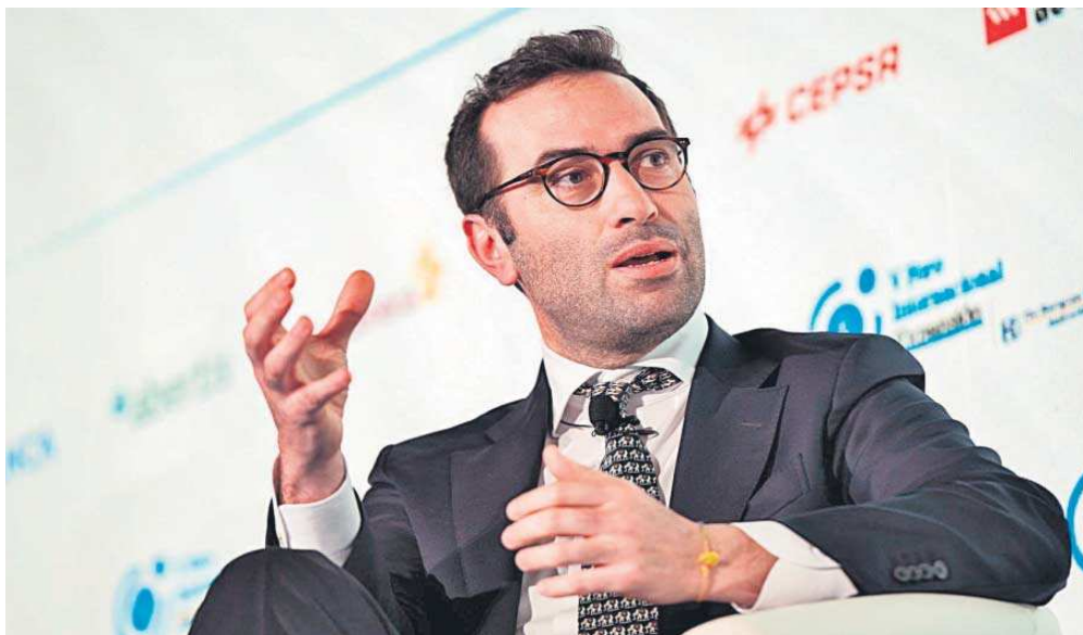
Carlos Cuerpo, ministro de Economía, ayer en un foro.