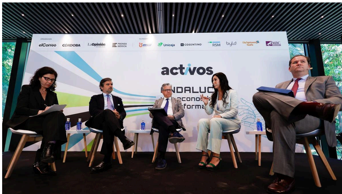
Mesa redonda 'Retos y desafíos de la empresa familiar andaluza'

La empresa familiar ha centrado una la primera de las mesas redondas de la jornada Andalucía, una economía en transformación , que ha organizado Activos , suplemento de economía, empresa e inversión de Prensa Ibérica con información sobre negocios, empresarios, innovación, inversión, formación y entorno laboral, un evento que ha tenido lugar en El 29 Sevilla .