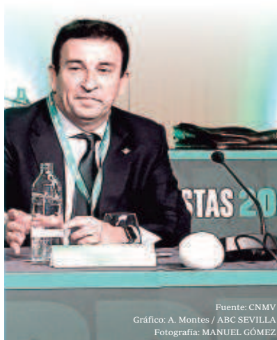
Fuente: CNMV Gráfico: A. Montes / ABC SEVILLA Fotografía: MANUEL GÓMEZ

cación con el consiguiente perjuicio económico para los accionistas e inversores, manteniendo, en todo caso, su derecho a reclamar los importes que les sean debidos».