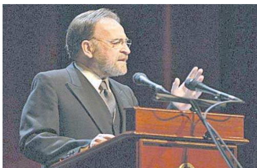
El periodista Antonio Burgos.

● El cantante Manuel Carrasco y el periodista Antonio Burgos, a título póstumo, Hijo Adoptivo y Predilecto de Sevilla, respectivamente