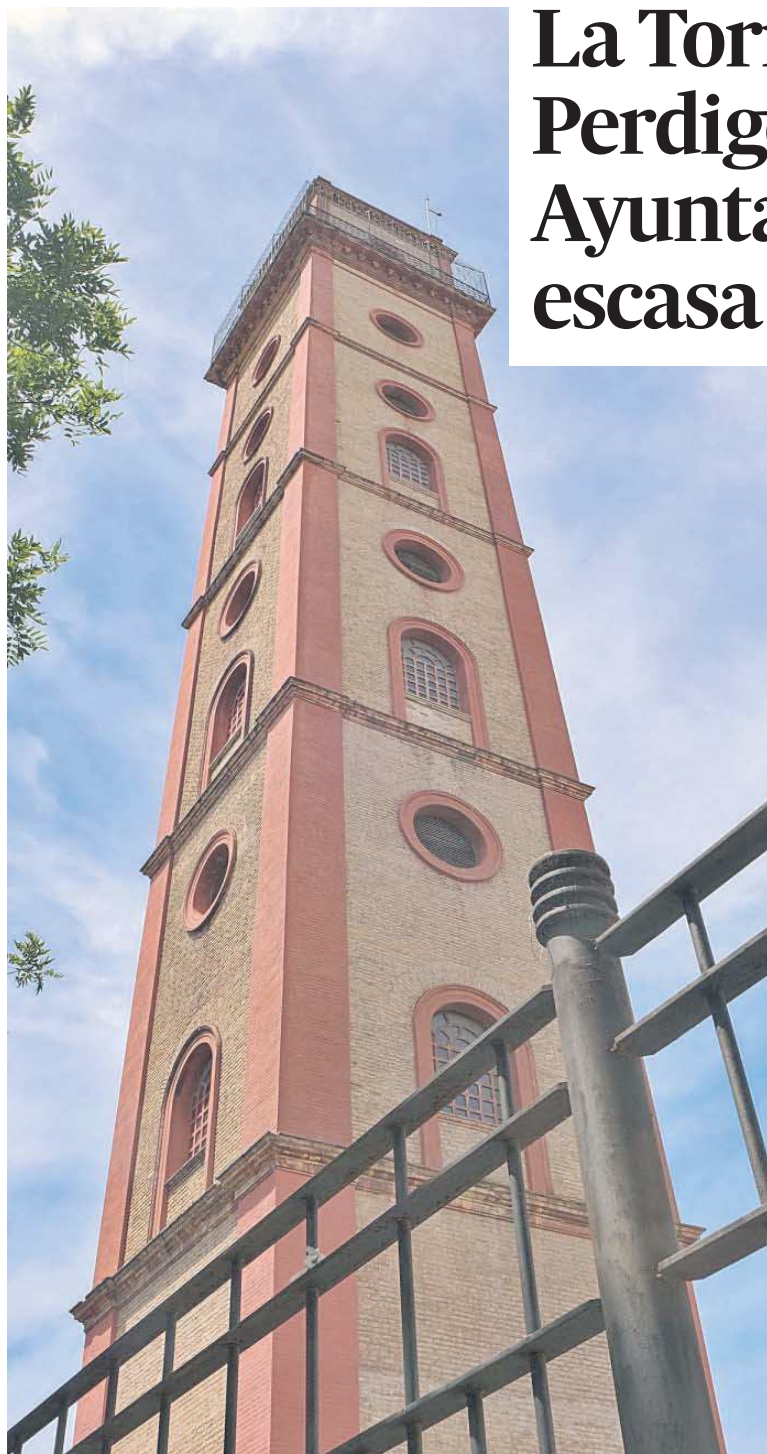
Vista de la Torre de los Perdigones desde la calle Resolana.