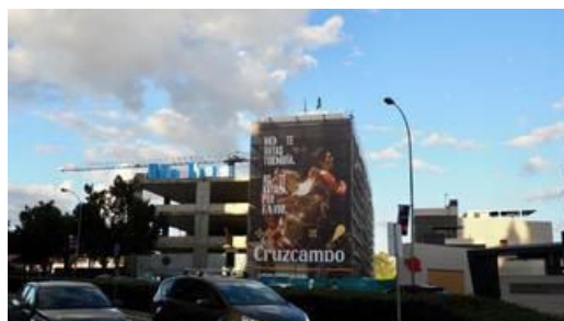
Etnografía de la Cruzcampo

La profesionalización de los jóvenes para facilitar su acceso al mercado laboral es el principal objetivo del programa. Una de sus singularidades es que la formación práctica se lleva a cabo en un entorno profesional con público real , donde los alumnos adquieren experiencia en cocina y servicio mediante la práctica directa. Así, los estudiantes se familiarizan con la operativa real de un establecimiento de hostelería, formándose y trabajando tanto en sala como en cocina, atendiendo a los clientes que acuden a Factoría Cruzcampo , microcervecería con fin social y sede de la Fundación.