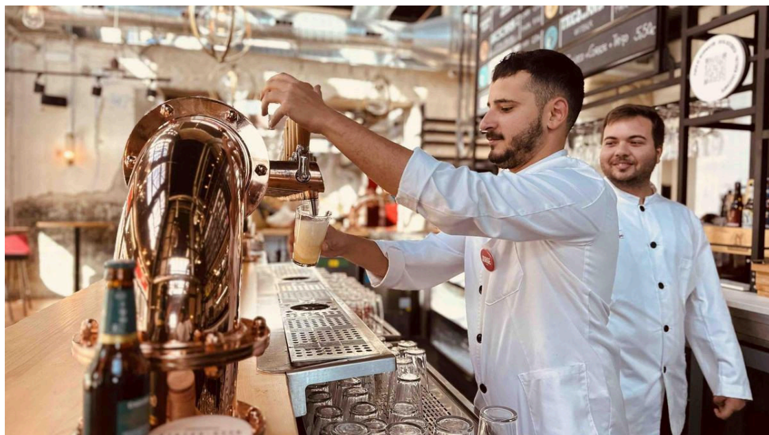
Fundación Cruzcampo lanza una nueva convocatoria de becas de formación en hostelería / El Correo

Fundación Cruzcampo, la fundación cervecera más longeva de España que materializa gran parte de la acción social de HEINEKEN España, lanza una nueva edición de su programa de becas Talento Cruzcampo , dedicado a la formación de jóvenes en hostelería para impulsar su inserción laboral. Tras cuatro generaciones formadas y un 95% de índice de empleabilidad para sus participantes, se abre el plazo de inscripción para la quinta edición .