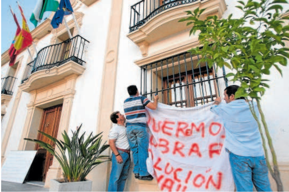
Imagen de archivo de una protesta de los empleados de Burguillos Natural por no cobrar