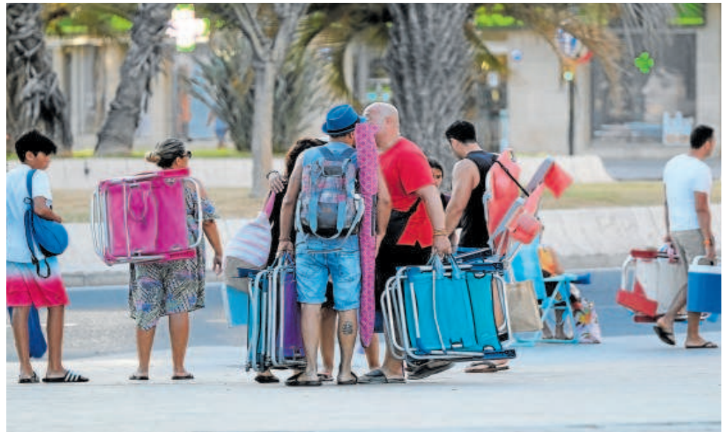
Un grupo de turistas en una playa de Málaga

Bernal, además, apuntó que la nueva Ley del Turismo apostará por modelos sostenibles e incorporará medidas para afrontar la sequía incentivando que los establecimientos adopten medidas que reduzcan el consumo de agua. Como ejemplo señaló priorizar las duchas en hoteles en vez de bañeras.