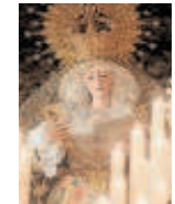
Hermandad de la Estrella