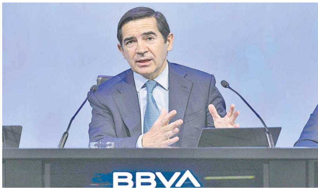
Carlos Torres, presidente de BBVA, ayer en rueda de prensa.

Sin embargo, y según Cuerpo, "la decisión final sobre la fusión de ambas entidades depende del Gobierno", que ha de velar por la estabilidad y competencia del siste-