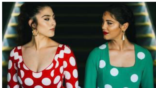
'Lo que nos une, el mismo acento': La nueva campaña de Cruzcampo a pocos días del derbi sevillano

Asimismo, Talento Cruzcampo brinda oportunidades a estos jóvenes conectándoles con la hostelería gracias a planes de mentorización y prácticas , donde reconocidos hosteleros a nivel nacional les abren las puertas de sus negocios para enseñarles a desenvolverse en la operativa real del sector. De este modo, se dan la mano diferentes generaciones de talentos unidos por la hostelería , generando conocimiento y oportunidades laborales. Un punto de encuentro donde el talento ayuda al talento .