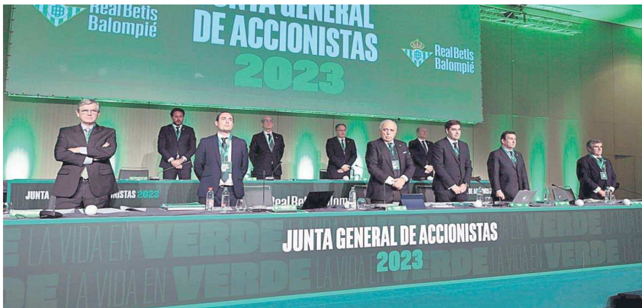
Una imagen de la Junta General Ordinaria de Accionistas del pasado ejercicio 2022-23 en el hotel Renacimiento.

Distribuido para CONFEDERACIÓN DE EMPRESARIOS DE SEVILLA * Este artículo no puede distribuirse sin el consentimiento expreso del dueño de los derechos de autor.