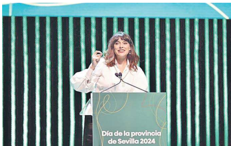
La actriz Belén Cuesta durante el discurso de agradecimiento en nombre de sus compañeros.

Por otro lado, la futbolista y mundialista Irene Guerrero, actual jugadora del Manchester United, que recibió la medalla de