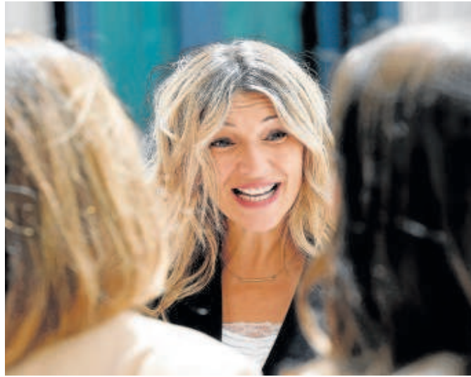
Yolanda Díaz, vicepresidenta segunda

Ahora, el Ejecutivo da tres meses al Pleno del CES, hasta el 22 de agosto, para modificar el reglamento de funcionamiento interno a fin de incluir