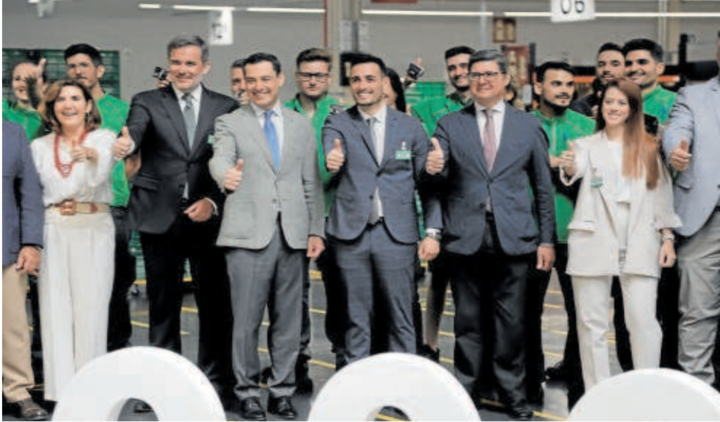
Empleados de Mercadona posan con el presidente y las autoridades en la inauguración de la Colmena