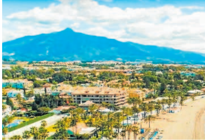
En la Costa del Sol Abu construirá 324 viviendas en siete solares