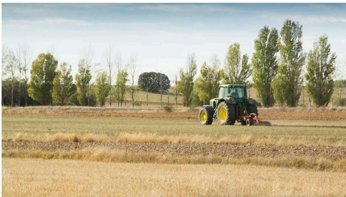
La sequía ha golpeado duramente al campo andaluz en los últimos años

La sequía podría tener un impacto económico de alrededor de 6.000 millones de euros este año , que restaría en cuatro décimas al avance del PIB en Andalucía . Son conclusiones extraídas del informe LEO de la Universidad Loyola y la Confederación de Empresarios de Andalucía, presentado recientemente. El análisis incide en que el impacto económico no se refiere exclusivamente al sector primario, sino a todas las actividades complementarias, que se ven afectadas por "un efecto multiplicador" que afectaría a 75.000 puestos de trabajo en la comunidad autónoma.