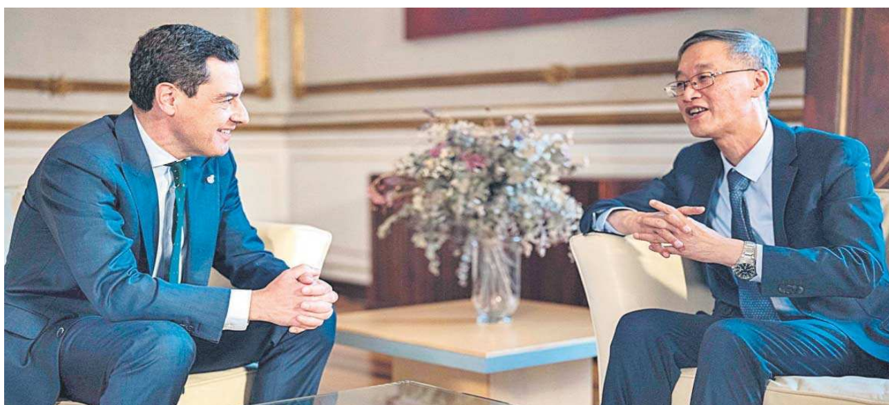
El presidente de la Junta, Juanma Moreno, junto al embajador de China, Yao Jing, el pasado 6 de mayo en un encuentro de preparación de la visita de mañana viernes.

● Yin Li acude mañana con un séquito de treinta personas en un viaje que lleva meses gestándose con total discreción ● El objetivo son las inversiones de empresas chinas en Andalucía