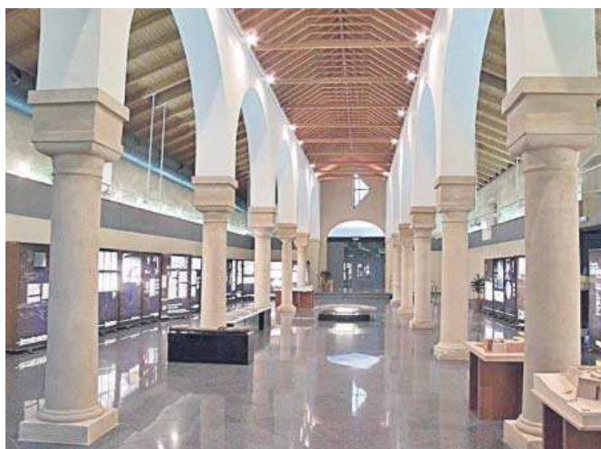
Interior del Centro Cultural la Almona en Dos Hermanas.

Del Vertedero de Encarnación consiguieron sacar, a partir de 2004, a unas 350 personas, de ellas 150 niños, mientras que en Andalucía se puso en marcha, en 2013, el proyecto de Familias Colaboradoras. Hasta el momento, son 175 las familias que le han cambiado la vida a unos 200 niños y niñas de los aproximadamente 2400 que viven en centros de protección de menores tutelados por la Junta de Andalucía y que de esta manera han tenido la ocasión