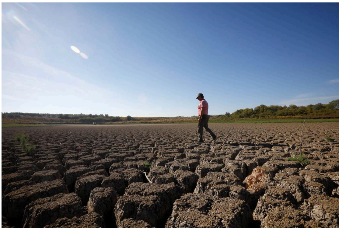
Un hombre camina por el lecho seco de la laguna de Rincón en Córdoba.