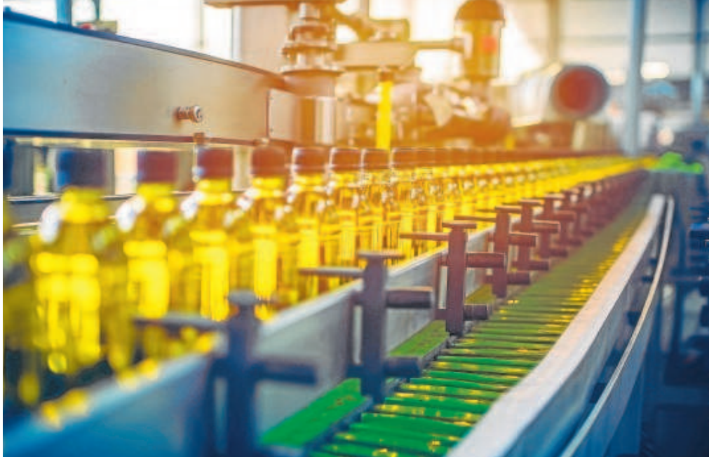
El aceite de oliva ha tenido mucho protagonismo en las exportaciones del primer trimestre de 2024