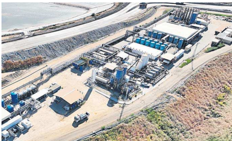
Planta de tratamiento de aguas de Cobre las Cruces.

● Desarrollada por Lantania, eleva más de un 50% la capacidad de depuración y es un paso necesario para la reapertura de la mina