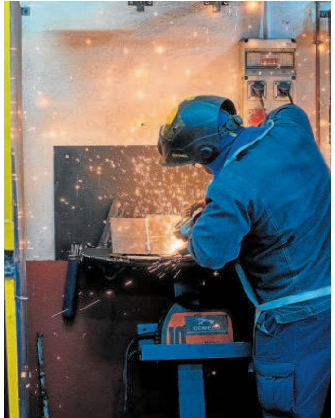
Un soldador en plena acción

El director del Centro de Formación de Soldadura Profesional habló de momentos muy especiales: «El cariño de las familias con nosotros es muy bonito. Hay padres que no sabían qué iba a ser de sus hijos. Pero no le hablo de un joven de 18 años. También de algunos cercanos a los