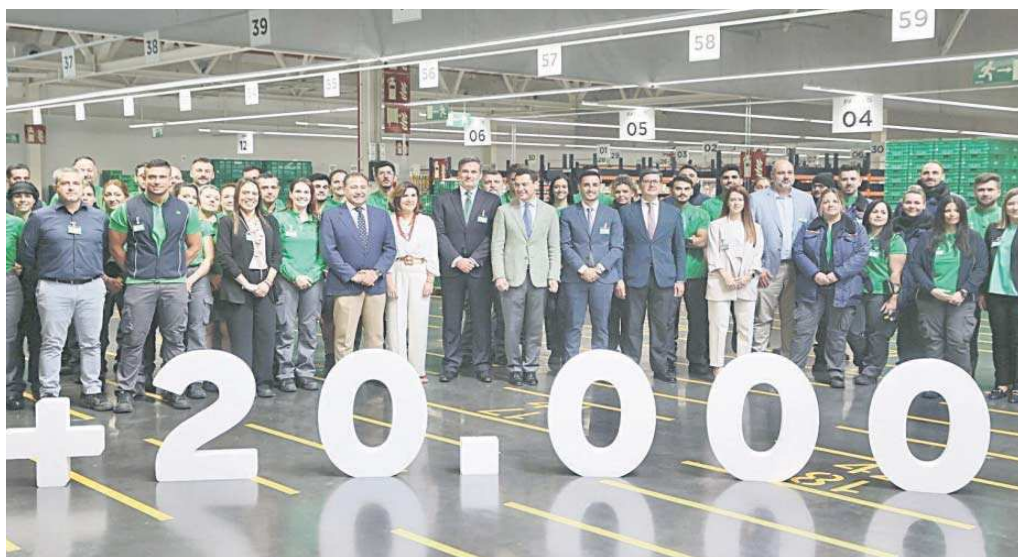
Fotografía de familia de Juanma Moreno con altos cargos andaluces, directivos de Mercadona y trabajadores.