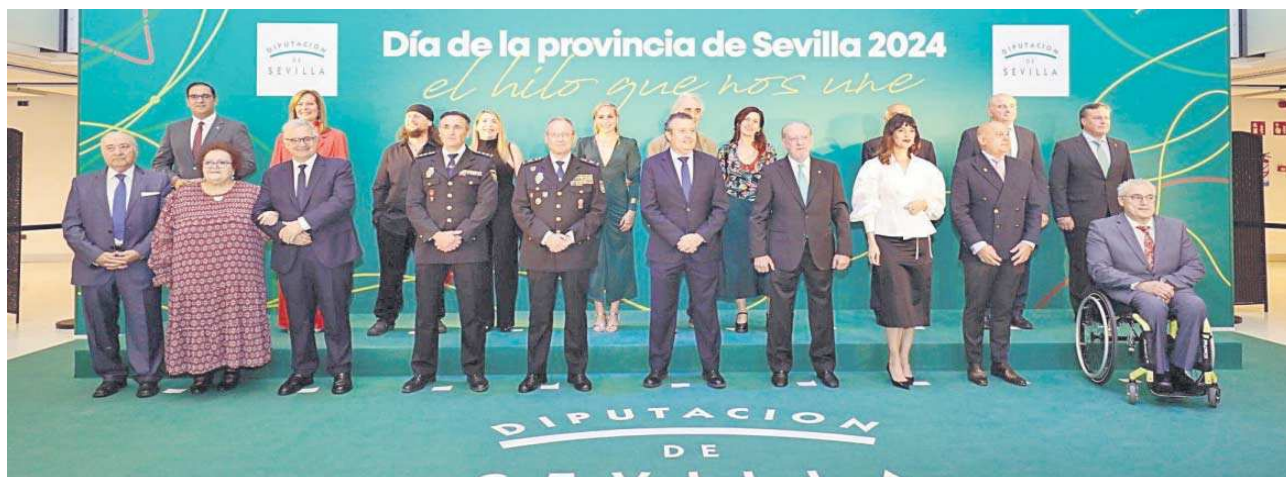
Foto de familia de los galardonados con las medallas de oro de la provincia en el hall del Auditorio Cartuja Center Cite.