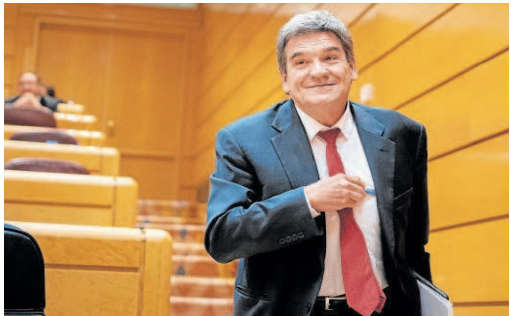
El ministro de Transformación Digital, José Luis Escrivá

Afirma que por este motivo las quince regiones «de todo signo político hemos enviado una carta al Ministerio de Transformación Digital para insistir en que cuenten con las CC.AA. para establecer las condiciones de las subvenciones europeas y que amplíen el plazo máximo para ejecutarlas». Y puntualiza que aunque el ministro Escrivá no acudió a la Conferencia Sectorial de la pasada semana «espero que reflexionen y no acabemos perdiendo estos fondos como todo indica».