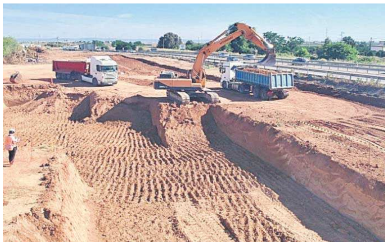
Avance de las obras de la línea 3 del Metro de Sevilla junto a la ronda Supernorte (SE-20).