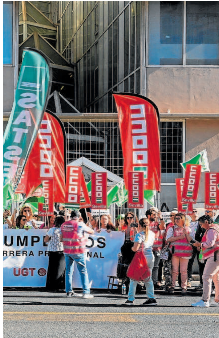
Concentración convocada por los sindicatos CCOO, SATSE, CSIF y UGT ante la Consejería de Salud