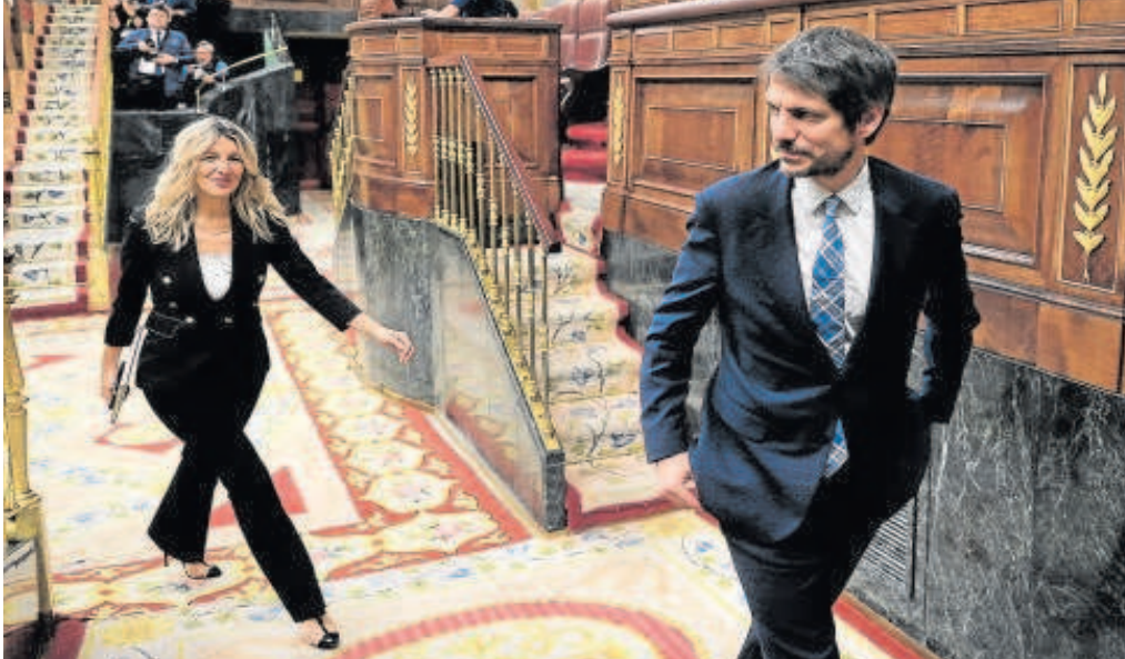
Yolanda Díaz, vicepresidenta segunda, y Ernest Urtasun, ministro de Cultura y portavoz de Sumar

Distribuido para CONFEDERACIÓN N DE EMPRESARIOS DE SEVILLA * Este artículo no puede distribuirse sin el consentimiento expreso del dueño de los derechos de autor.