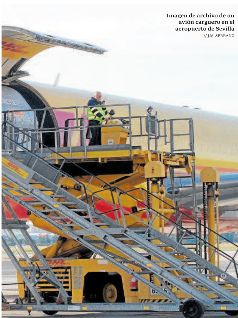
Imagen de archivo de un avión carguero en el aeropuerto de Sevilla