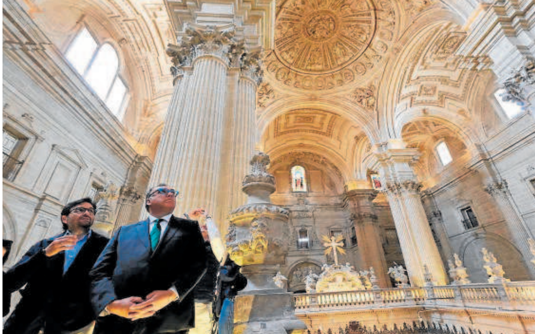
El consejero de Turismo, Cultura y Deporte, Arturo Bernal en su visita a la Catedral de Jaén