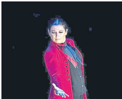
La bailaora Sara Baras.