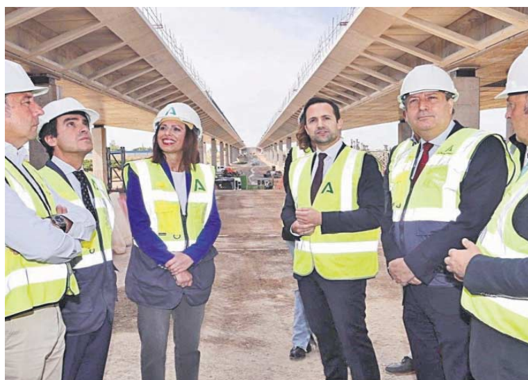
Autoridades bajo el viaducto del Pago de Enmedio que completará la autovía de acceso Norte a Sevilla, ayer.