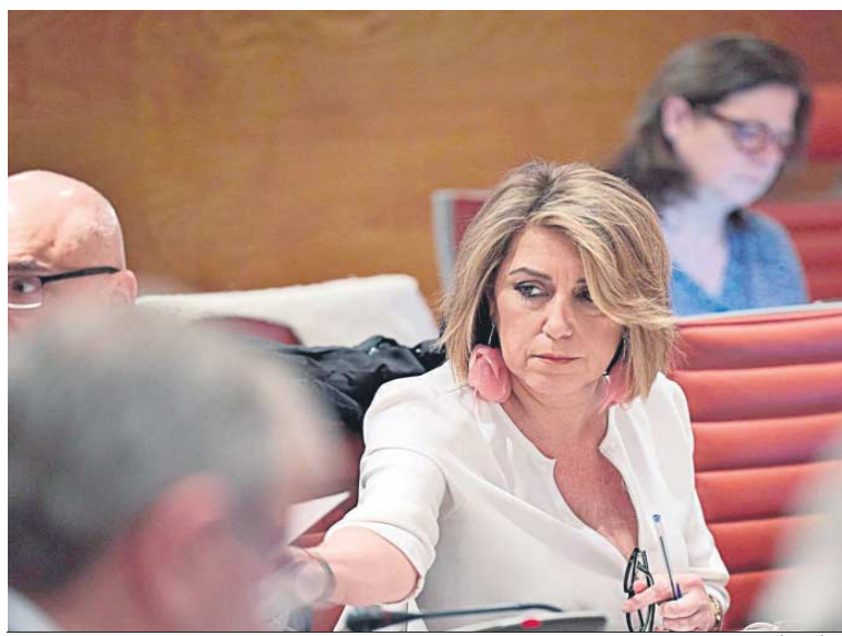
Susana Díaz, durante una sesión en el Senado.

PSOE andaluz. Unos movimientos que no les son ajenos. O eso es lo que parece.