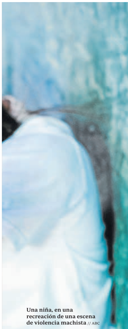
Una niña, en una recreación de una escena de violencia machista

443 en España y 89 en la comunidad andaluza.