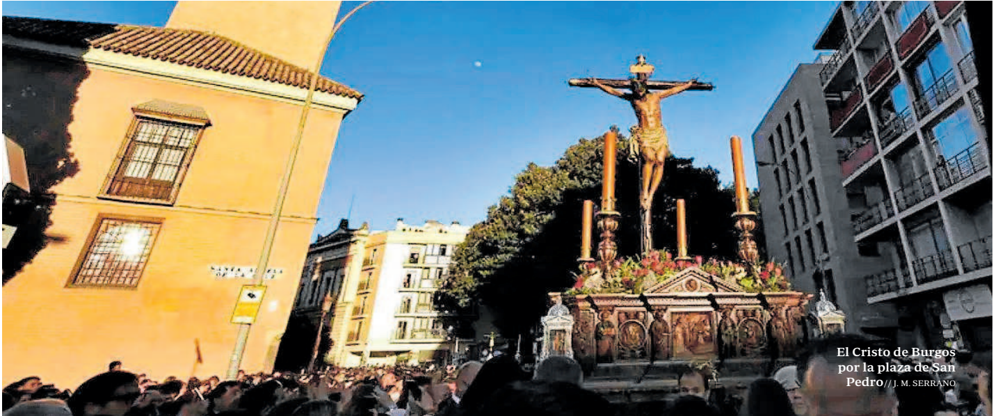
El Cristo de Burgos por la plaza de San Pedro // J. M. SERRANO