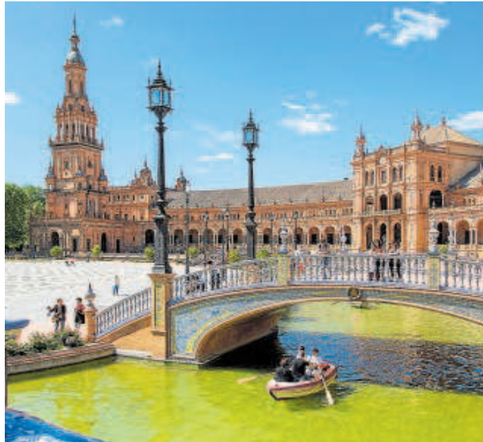
El canal de la Plaza de España, uno de los atractivos de Sevilla

El dato representa un diferencial importante sobre la media del país, donde los viajeros foráneos suman el 65% de las reservas. En Sevilla, por contra, sigue subiendo la presencia de un público internacional que opta por aprovechar el buen clima de primavera para visitar, sobre todo, el Centro. Por orden, la procedencia de los turistas que han reservado hoteles en Sevilla son de Francia, Italia, Reino Unido, Estados Unidos, Alemania, Portugal, Países Bajos, Bélgica, Canadá e Irlanda. Con respecto al con-