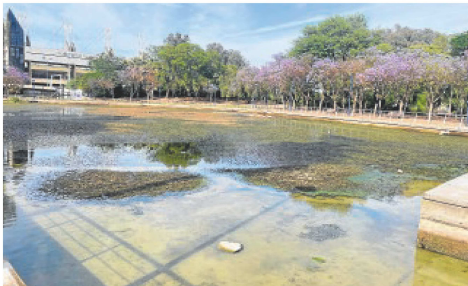
Estado en el que se encontraba ayer el estanque del Jardín Americano

cia que la condición en la que se encuentra, supone un grave peligro para la salud pública, teniendo en cuenta que se reabrió concebido como una zona de descanso y recreo para niños y mayores. Ante estas informaciones, desde el Ayuntamiento de Sevilla se ha procedido a limpiar el estanque de forma urgente y a arreglar el motor, algo que no está aún rematado. Se da la paradoja de que esta fue la primera zona de la ribera del Guadalquivir que se recuperó hace más de treinta años con motivo de la Expo 92.