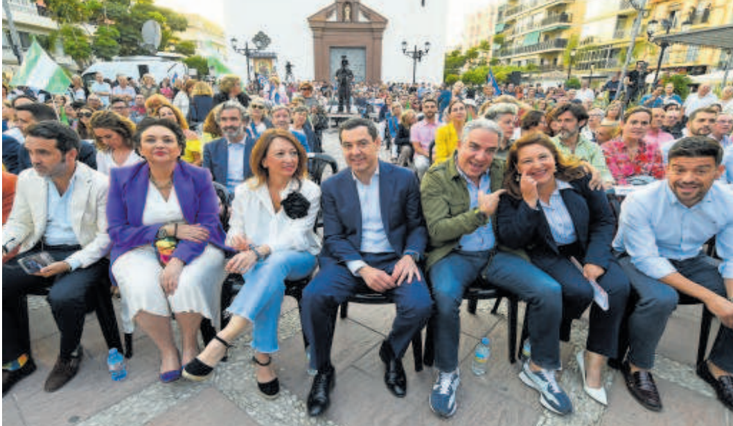
Juanma Moreno durante el mitin en Fuengirola (Málaga)