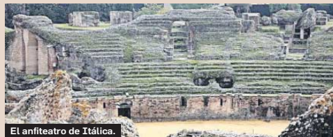
El anfiteatro de Itálica.

Enclave Arqueológico de Villarcos (Cuevas de Almanzora, Almería), Enclave Monumental Castillo de Belalcázar (Córdoba), Enclave Monumental Sinagoga de Córdoba, Museo Arqueológico y Etnológico de Granada, Enclave Arqueológico Dolmen de Soto (Trigueros (Huelva), Enclave Arqueológico de Turóbriga (Aroche, Huelva), Museo de Artes y Costumbres Populares del Alto Guadalquivir (Cazorla, Jaén), Museo de Úbeda (Jaén), Enclave Arqueológico Puente Tablas (Jaén), Enclave Arqueológico de Acinipo (Ronda, Málaga), Enclave Arqueológico Mezquitas Funerarias (Málaga), Enclave Arqueológico Dólmenes de Valencina (Valencina de la Concepción, Sevilla), Enclave Monumental San Isidoro del Campo (Santiponce, Sevilla).