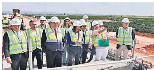
Vista del Pago de Enmedio desde el viaducto de la autovía de acceso Norte.

una obra que, a pesar de los numerosos inconvenientes, no sólo se ha desbloqueado, sino que ahora encara su recta final. Este viaducto completará una carretera que ya soporta 30.000 vehículos diarios y permitirá a La Rinconada y San José seguir creciendo de cara a su futura y