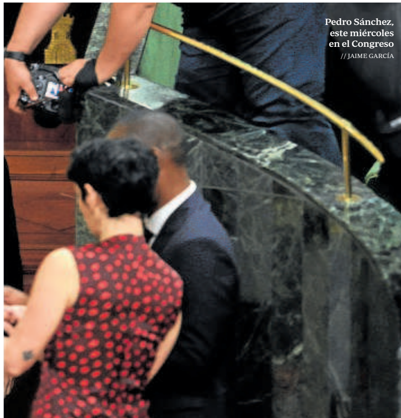
Pedro Sánchez, este miércoles en el Congreso

En seis meses, los transcurridos desde la investidura de Sánchez en noviembre, el Ejecutivo ha pasado muchos apuros hasta para convalidar decretos. En enero sacó dos con el apoyo 'in extremis' de Junts y vio cómo se tumbaba un tercero.