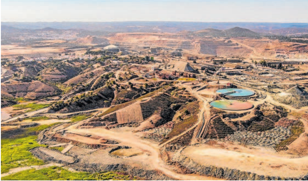
La mina que Atalaya Mining explota en Riotinto