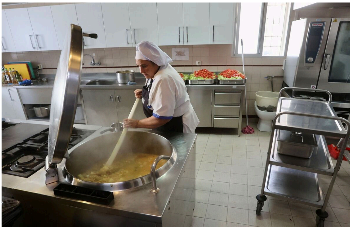
La cocina del Comedor Social Nuestra Señora del Rosario, en Triana.

Por su parte, Sor Purificación ha referido que gracias a la ayuda de entidades como el Banco de Alimentos, su institución puede alimentar a más de 500 personas al día. Como dato, ha puntualizado que durante 2023, dicho servicio atendió a más de 3.840 personas.