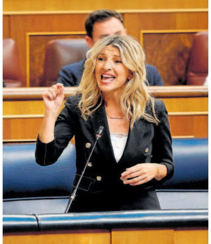
Yolanda Díaz, vicepresidenta segunda del Gobierno y líder de Sumar

Después, el PP pedía cumplir con el compromiso de alcanzar el 2% del producto interior bruto (PIB) en la inversión en Defensa. Algo que sí respaldó el PSOE —este mismo lunes la ministra del ramo, Margarita Robles, reiteró la necesidad de alcanzar ese objetivo—, pero que rechazó Sumar. Lo mismo sucedió con la reclamación de volver a condenar la invasión rusa de Ucrania y de enviar material bélico al país de Zelenski, donde los socialistas se sumaron a los populares, pero no