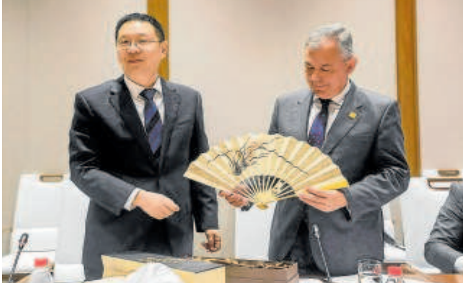
El alcalde de Sevilla, José Luis Sanz, en un acto ayer en China