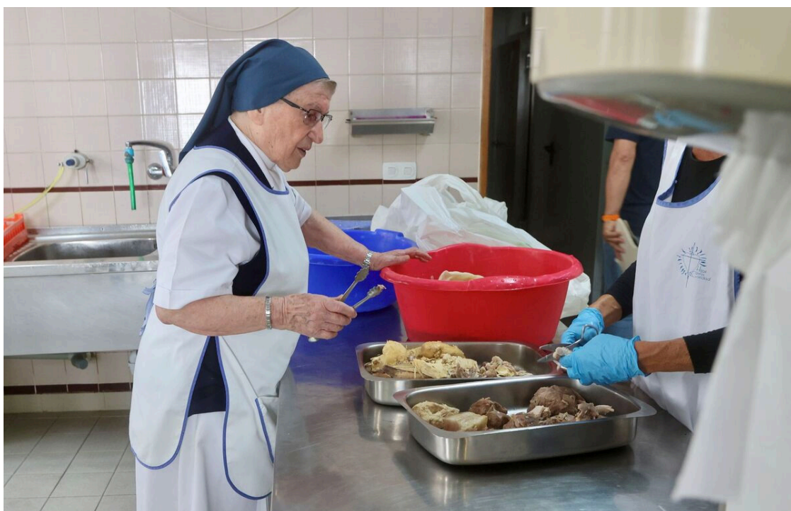
Preparación del almuerzo en el Comedor Social de Triana.

Los alimentos más necesarios y solicitados en esta ocasión son aceite de oliva, leche, arroz,