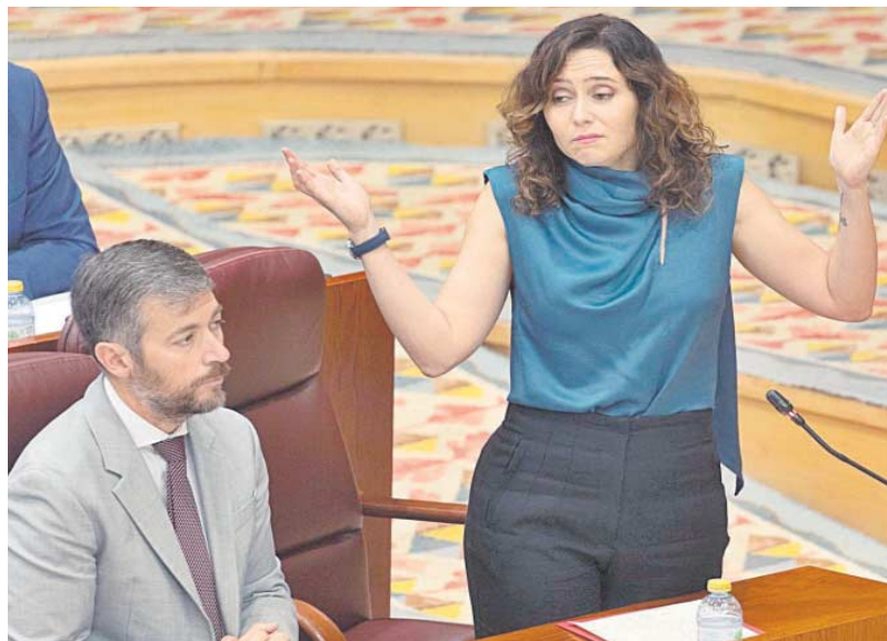
La presidenta madrileña, Isabel Díaz Ayuso, interviene ayer en la Asamblea de Madrid.