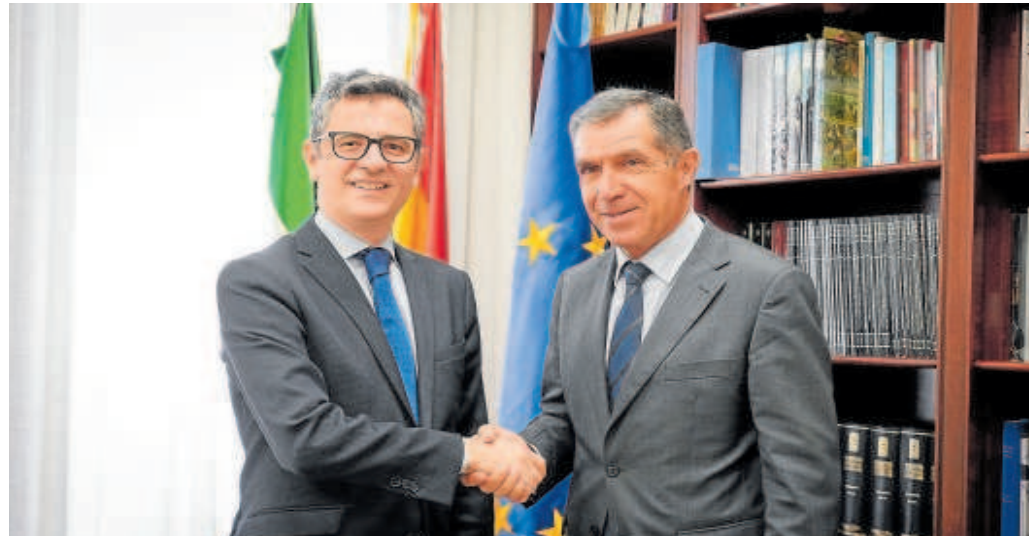
El ministro Bolaños junto al presidente del TSJA, Lorenzo del Río

aseguró que luchar contra el cibercrimen es una prioridad para el gobierno de la Junta y puso ejemplo la próxima creación de la Agencia de Ciberseguridad de Andalucía.