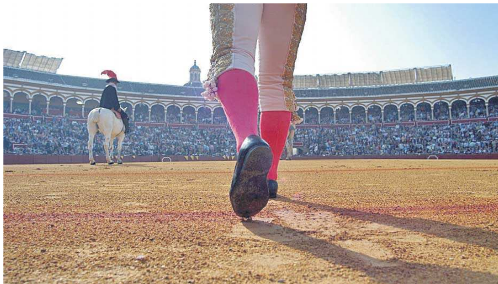
Paseillo deslumbrante en el ruedo de la plaza de la Maestranza, que celebra su ciclo taurino en coincidencia con la fiesta que se vive en el real.

● La situación económica, el peso del abono o las distintas ordenanzas municipales han influido en la arquitectura del ciclo taurino