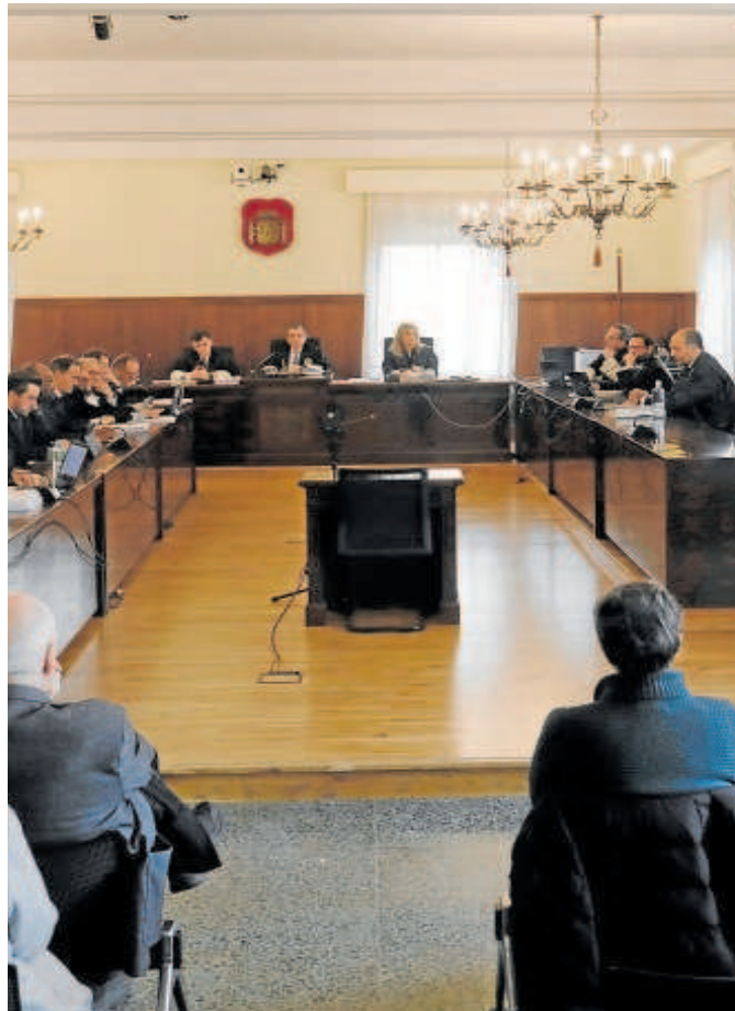
Una de las sesiones de juicio contra la excúpula de la UGT // RAÚL DOBLADO

Goicoechea negó también que Soralpe financiara a la UGT pero sí reconoció que el sindicato le anticipaba dinero con préstamos debido a la falta de liquidez de la sociedad «para cubrir pagos corrientes en momentos puntuales y luego se devolvían». De ahí, según explicó, el desfase detectado por la Guardia Civil en las facturas: UGT pagó 5,2 millones a Soralpe aunque la facturación por los servicios prestados era de sólo 2,5 millones, por lo el sindicato le transfirió 2,7 millones más. «Teníamos falta de tesorería. Nos encargamos de acondicionar y equipar esos locales para