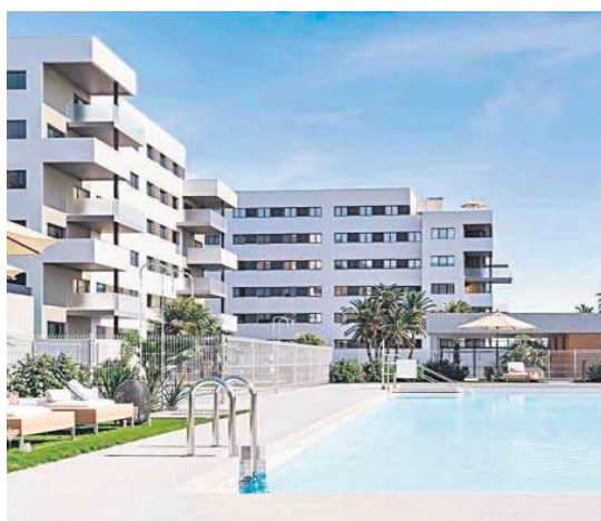
Promoción Insur Atenea en Dos Hermanas.

El importante incremento de negocio de la actividad de promoción viene en parte explicado por la entrega en este trimestre de parte de las viviendas de promociones de Madrid que quedaron pendientes de entregar en el último trimestre del pasado ejercicio y que seguirán entregándose a lo largo del segundo trimestre de 2024.