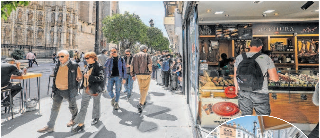
Imágenes, ayer, de los comercios de la Avenida de la Constitución

Tras el cierre de las últimas dos zapaterías, sólo quedan bares, heladerías con veladores a las que se suman tiendas de souvenirs y cambio de moneda. Todo para los turistas