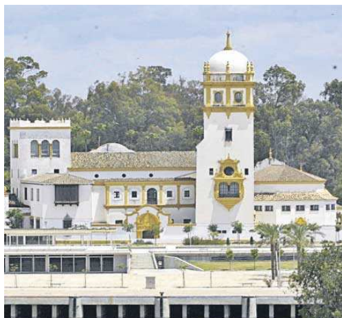
Vista del Conservatorio de Danza desde la otra orilla del Guadalquivir.

También está en estudio la dotación de un ordenanza de la segunda sede en la próxima Relación de Puestos de Trabajo (RPT) y se han mantenido reuniones con el Instituto Andaluz de Patrimonio Histórico y el Ayuntamiento de Sevilla para estudiar el traslado, custodia e incluso rehabilitación de los cuadros de Gustavo Bacarizas que se encuentran en la sede del Conservatorio. Del Pozo reiteró que "estamos traba-