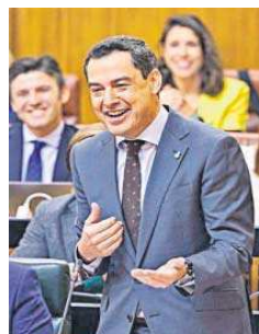
Juanma Moreno en el pleno de ayer.