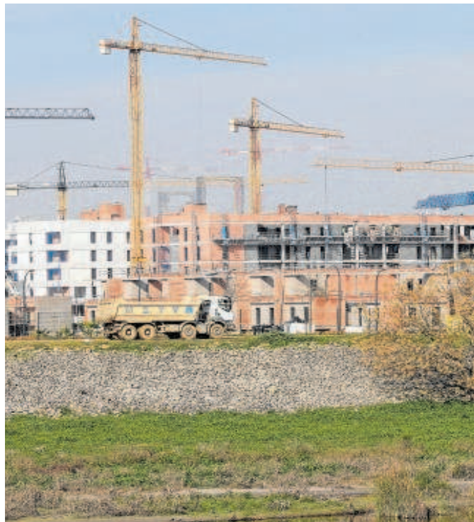
Imagen de obras en Palmas Altas

En el Consistorio dicen que la zona es un lugar de «expansión natural pretendida, sobre todo, por familias jóvenes»