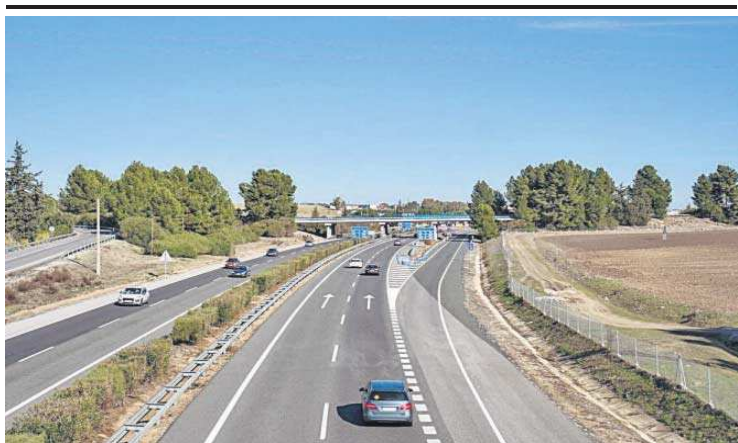
La autopista a Cádiz (AP-4) en el tramo de Las Cabezas.