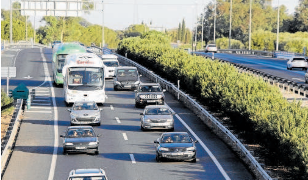
La autopista AP-4 tendrá un tercer carril entre Dos Hermanas y Las Cabezas // JUAN FLORES