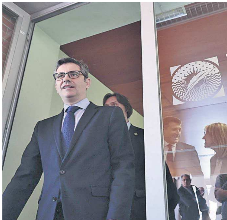
El ministro Félix Bolaños, ayer, en la Universidad Pablo de Olavide, en Sevilla.

“El plan A del Gobierno es que lleguemos a un acuerdo con el PP y que podamos renovar el CGPJ”, dijo Félix Bolaños antes de añadir que el primer partido de la oposición está “ante la última oportunidad para atender al clamor de la carrera judicial” de que se pacte la sustitución de los vocales que lle-