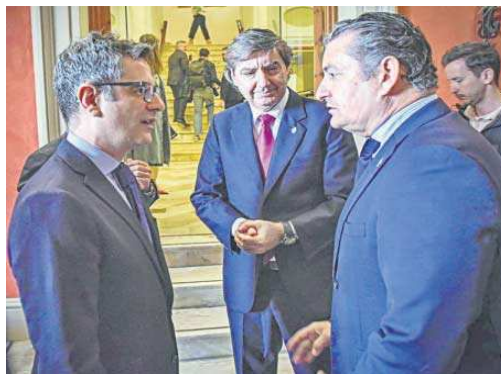
Félix Bolaños y Antonio Sanz charlan junto a Óscar Fernández León.

Bolaños se mostró de acuerdo con la trascendencia que tiene un problema de nuevo cuño que no sólo está relacionada con la protección de datos, "sino también a cuestiones que afectan a la seguridad nacional". "Estamos realizando la mayor transformación de la Justicia en décadas, la vamos a llevar desde el siglo XIX al siglo XXI. La transformación digital es una transformación como no se ha visto en décadas", reiteró el ministro durante su alocución.