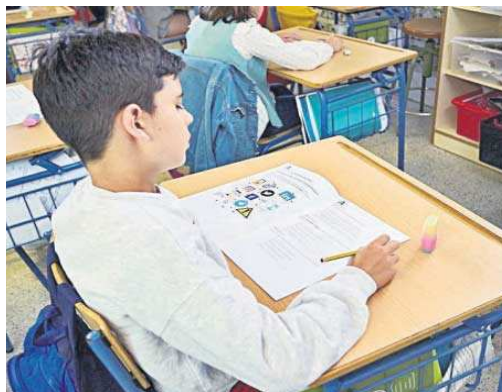
Un alumno realiza el ejercicio de Lengua Castellana y Literatura.

nos. Para ello, se realizan tres ejercicios. El primero, desarrollado ayer, concierne a Lengua Castellana y Literatura. El segundo, hoy, es del primer idioma extranjero. El tercero, mañana, se refiere ya a las Matemáticas.