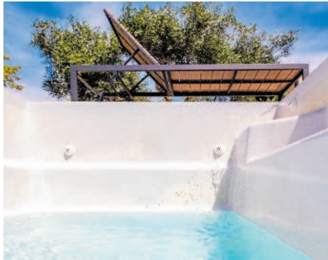
Piscina de verano sin llenar

La Junta de Andalucía ha dado así un giro en su posición en la provincia de Málaga. Si hace sólo un mes fijó un límite de 200 litros por persona y día y planteó que cada ayuntamiento debía