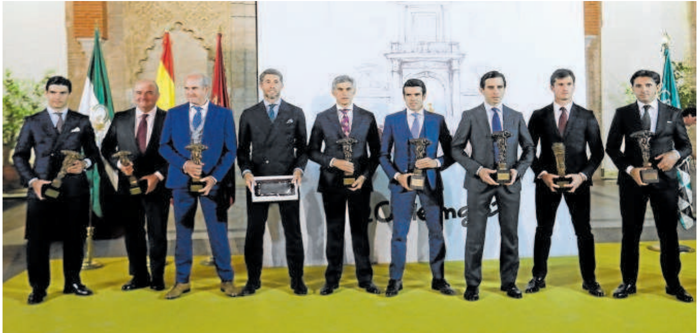
Los premiados muestran sus galardones ayer en el Patio de la Montería del Real Alcázar