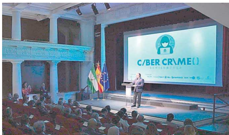
Un momento del congreso 'Cybercrime Sevilla'.

Ambos consideran “necesario” e “imprescindible” trabajar desde la colaboración entre administraciones y empresas para avanzar en ciberseguridad ante “el desafío” que supone el aumento de la ciberdelincuencia. El ministro ha