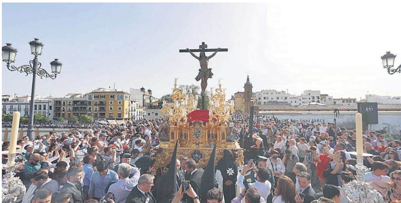
El Cristo de la Expiración en una soleada tarde de Viernes Santo cruzando el Puente de Triana camino de Sevilla.

Distribuido para CONFEDERACIÓN DE EMPRESARIOS DE SEVILLA * Este artículo no puede distribuirse sin el consentimiento expreso del dueño de los derechos de autor.