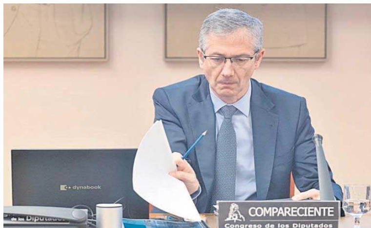
El gobernador del Banco de España, Pablo Hernández de Cos, ayer en el Congreso.