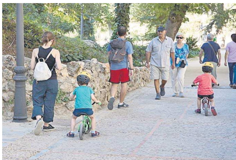
Varios familias con niños disfrutando de un parque.

En el otro lado de la balanza, la mayoría del crecimiento en la población se da en el Área Metropolitana. “De hecho, se ha detectado que no sólo se mueve hacia el área metropolitana la población de la