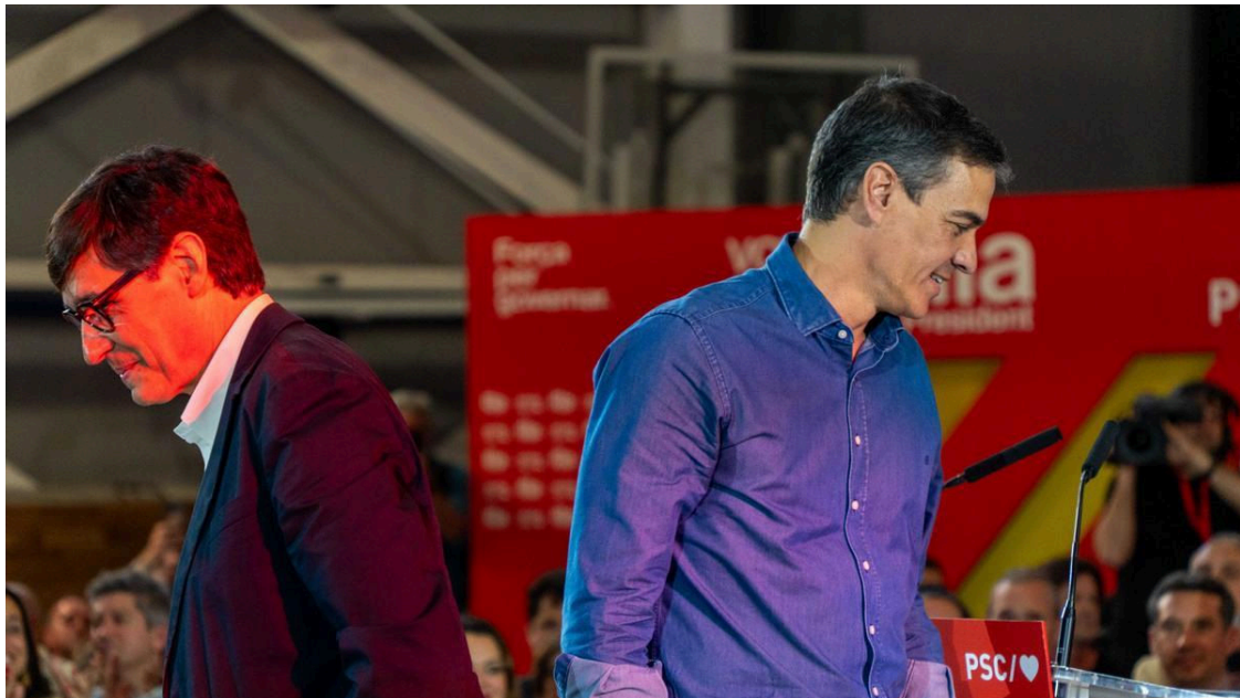
Salvador Illa y Pedro Sánchez.

Activado el cronómetro hacia las elecciones catalanas del domingo las encuestas confirman que la gobernabilidad de Cataluña no será fácil. Días atrás, en pleno retiro de Pedro Sánchez y mientras el presidente meditaba sobre su destino, un dirigente del PSOE andaluz, con muchos trienios ya en el carné, escribió el siguiente mensaje: Tampoco queda tanta legislatura, tras las catalanas solo puede quedar uno, o Pedro Sánchez o Salvador Illa.