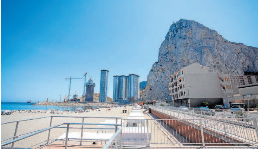
El Peñón de Gibraltar // SERGIO RODRÍGUEZ