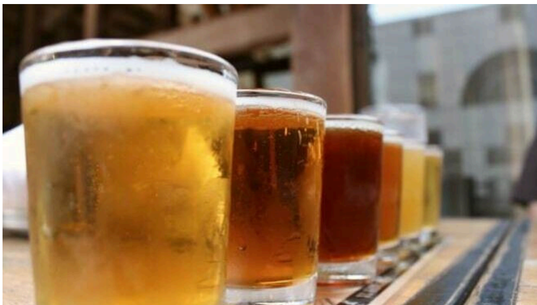
Cervezas. / (Sevilla)

La Cruzcampo es una de las cervezas con más recorrido de España. Su fundación se remonta a comienzos del siglo XX y desde entonces se ha convertido en uno de los iconos que moldean la imagen de la ciudad. Tan es así que esta bebida alcohólica ha sido objeto de numerosos comentarios a lo largo de los años sobre su sabor, la temperatura a la que se sirve e incluso su consistencia.