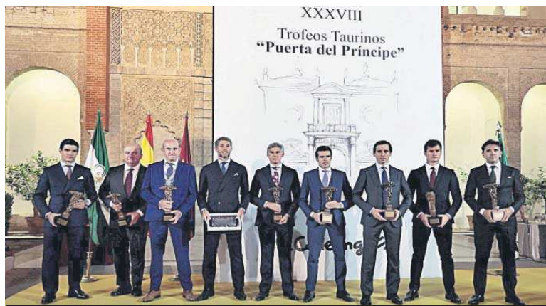
Foto de familia de los premiados en el evento celebrado anoche en los Reales Alcázares.