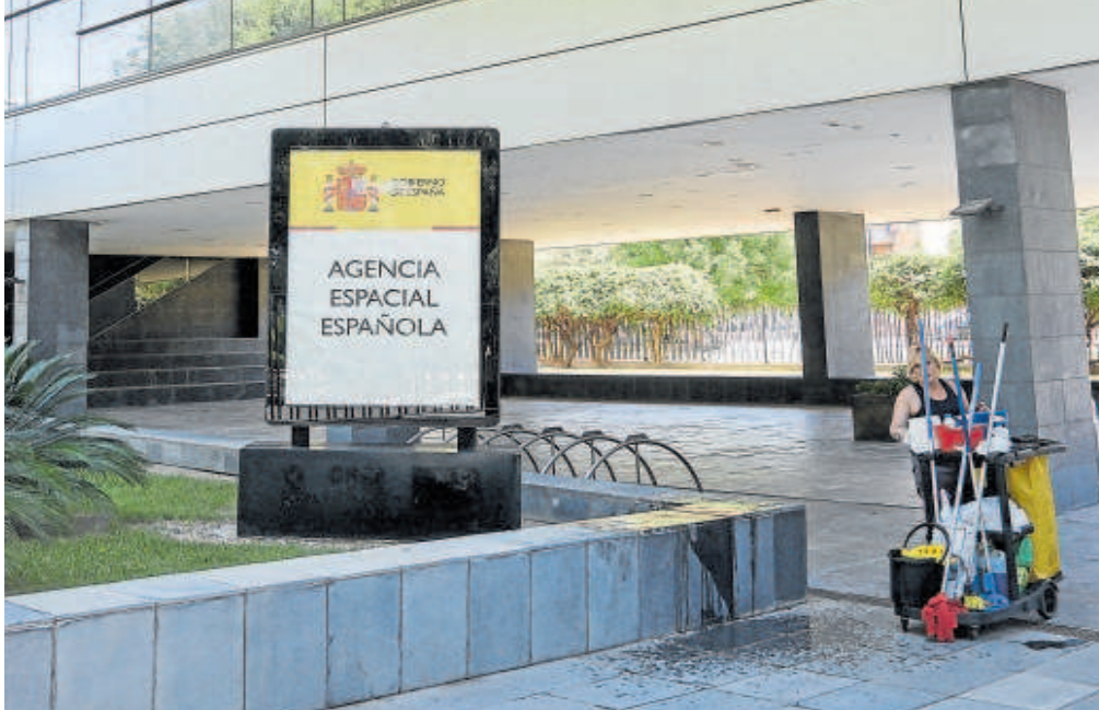
Edificio de la Agencia Espacial Española ayer