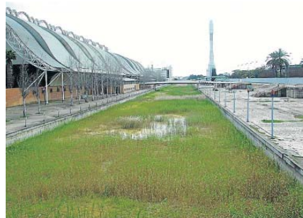
Estado de abandono del Canal de la Expo.

que el PP llevara el citado proyecto el miércoles al Consejo de la Gerencia de Urbanismo y se quedara finalmente en el cajón al no cosechar los apoyos de las formaciones. Una cuestión que