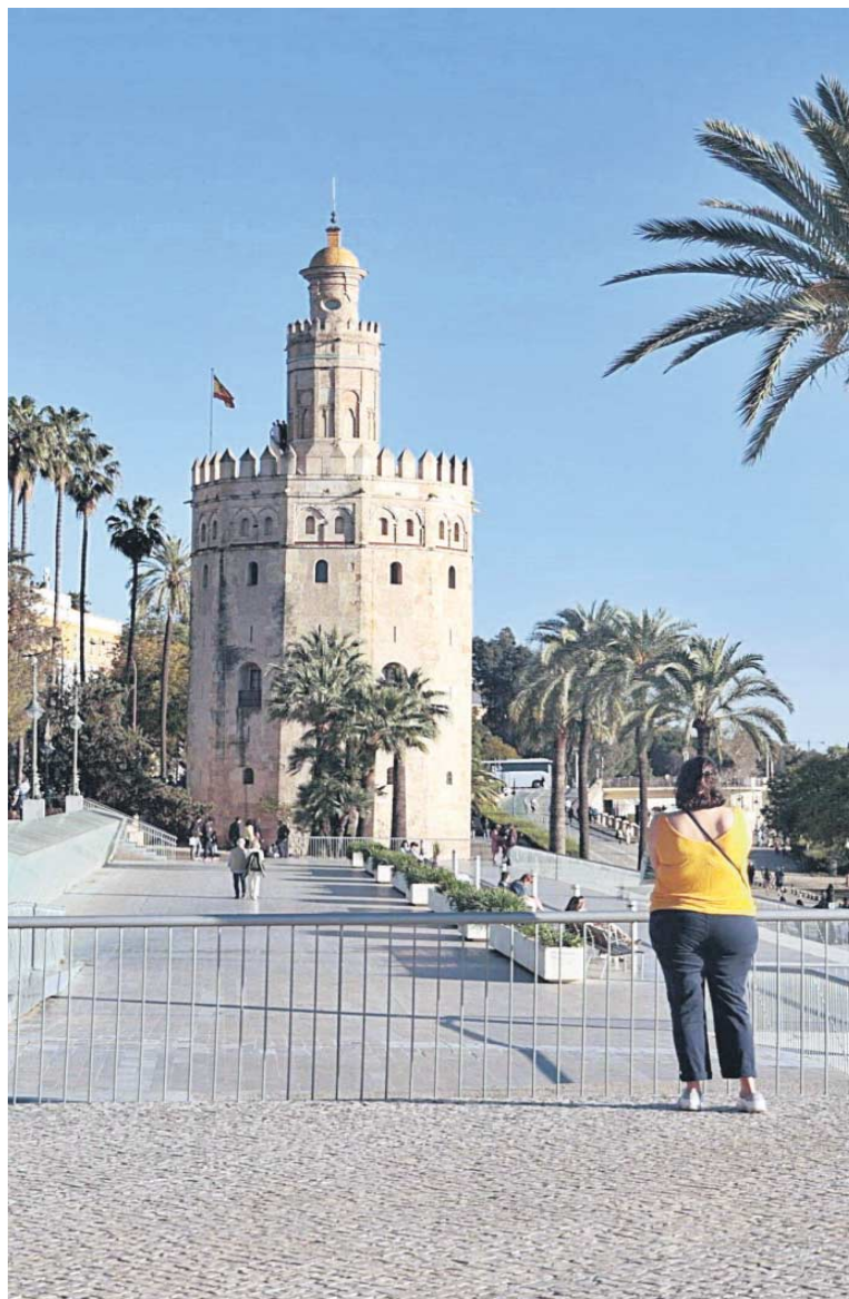
Una mujer observa la Torre del Oro desde el Paseo Marqués de Contadero.

● Urbanismo adjudica a Heliopol la adquisición, instalación y el mantenimiento de tres tramos de velas con una longitud de 168 metros