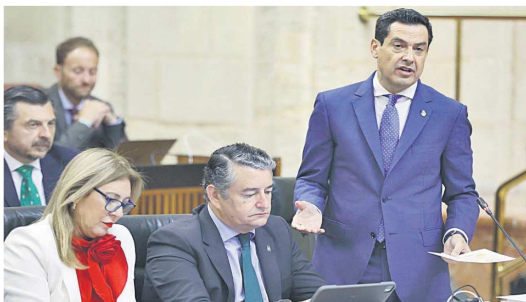
El presidente de la Junta, Juanma Moreno, durante la sesión de control al Gobierno en el Parlamento.

● Moreno levanta la voz frente a las “singularidades” con la Generalitat ● María Jesús Montero defiende que la región ha recibido 44.350 millones más en los últimos seis años