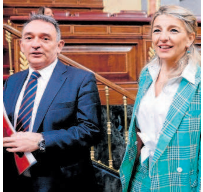
Enrique Santiago y Yolanda Díaz, en el Congreso de los Diputados

Sumar estará liderado por cuatro personas en el proceso de interinidad que se abre tras la dimisión de Yolanda Díaz, que asumió responsabilidades por los malos resultados en las elecciones europeas del 9-J. El Grupo Coordinador decidió ayer crear un equipo gestor interino compuesto por cuatro miembros de la Ejecutiva: la