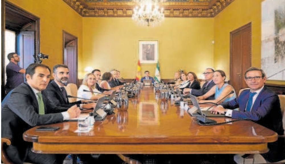
Reunión del Consejo de Gobierno de Andalucía en el inicio de la legislatura