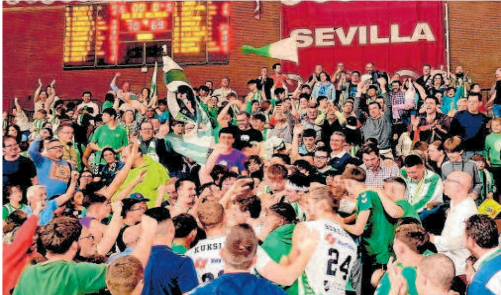
Los jugadores del Betis Baloncesto celebran alborozados con la afición una victoria en San Pablo

El Betis Baloncesto asegura no haber recibido este curso dinero de las administraciones; el Unicaja, en ACB, ha logrado 2,5 millones de euros de patrocinios institucionales