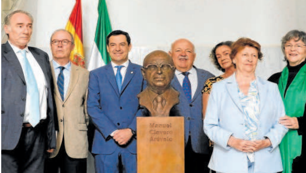
El presidente andaluz, en la inauguración del busto de Manuel Clavero en el Parlamento