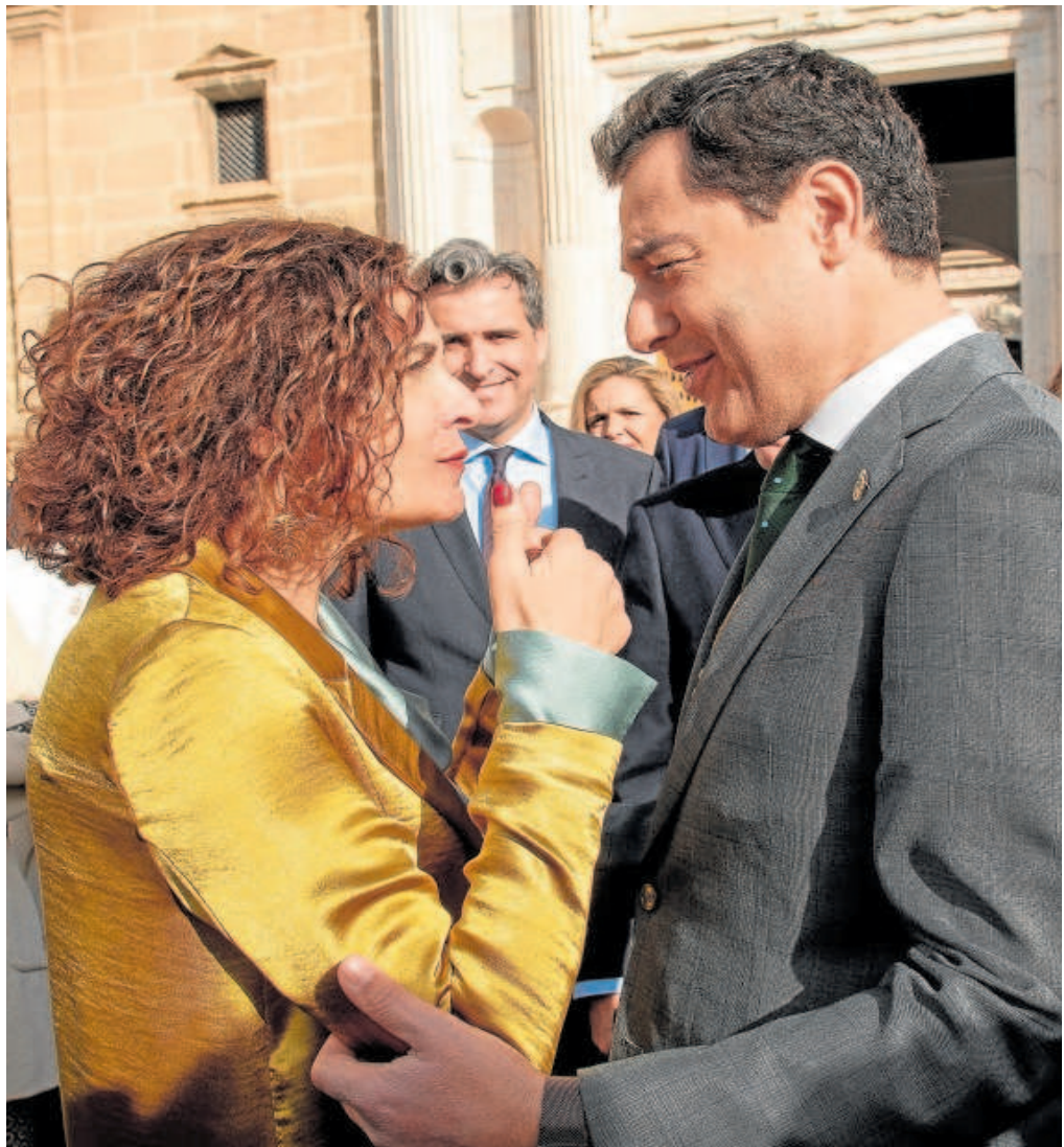
La ministra María Jesús Montero y Juanma Moreno

Sólo cuatro días desde las europeas ha tardado en prender la mecha y abrirse el primer frente de esta nueva etapa (ha habido muchos en meses anteriores) entre el presidente andaluz y la ministra María Jesús Montero. Todo