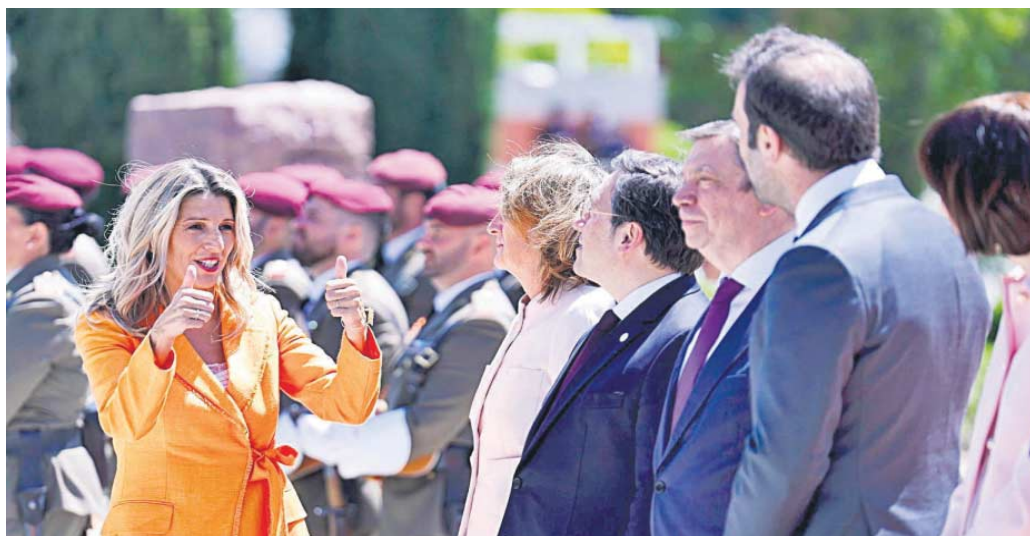
La vicepresidenta segunda, Yolanda Díaz, en la ceremonia con honores militares previa al inicio de la reunión de alto nivel entre España y Turquía.

En la formación se afanaron en subrayar que Díaz mantiene el liderazgo político del socio minoritario en el Gobierno, además de seguir en la ejecutiva y continuar en la presidencia del grupo plurinacional en el Congreso. Es decir, no hay una sucesión de Díaz como referente de la confluencia sino que el relevo se acota a las funciones organizativas. El portavoz del grupo parlamentario, Íñigo Errejón, proclamó que la vicepresidenta segunda sigue siendo su "mayor activo político y electoral". Antes, la ministra de Sanidad, Mónica García, dijo que la coalición sigue "firme, estable" y "robusta" con buena relación entre todos los partidos. Eso sí, socios de Sumar como Más Madrid, IU y Compromís ya han apuntado que el futuro del espacio pasa por dar más peso a las organizaciones políticas.