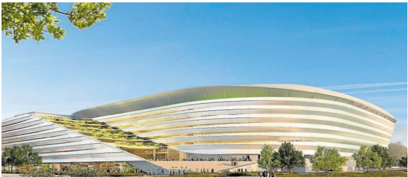
Recreación virtual del aspecto que tendrá el nuevo Benito Villamarín tras su proyecto de reforma

Gensler también ha destacado por realizar diseños como: BMO Stadium, en los Ángeles, de Los Ángeles Football Club; y el Q2 Stadium de Austin, donde juega sus partidos el Austin FC, ambos de la MLS (Major League Soccer); o el Snapdragon Stadium, de San Diego State University.