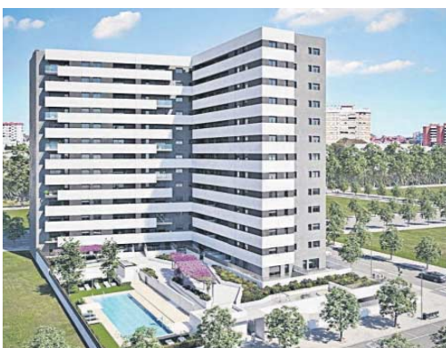
Recreación del edificio que levantará la promotora Metrovacesa.

para el distrito San Pablo-Santa Justa. Con este proyecto, pasamos una nueva página, como también lo hemos hecho con la fábrica de tabacos de Los Remedios, el edificio de la antigua comisaría de la Gavidia, la Fábrica de Vidrio, el entorno de Santa Justa, la algodonera de Alcosa, Palmas Altas, Pitamo, Hacienda del Rosario, La Florida o Barqueta, por poner algunos ejemplos", comentaron los implicados en el nuevo barrio de la ciudad.