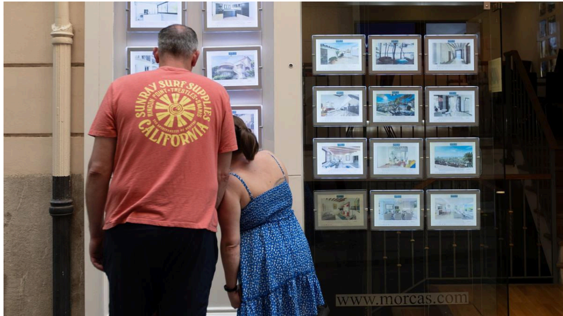
Dos personas observan los anuncios de viviendas en venta en una inmobiliaria.

Los avales ICO para compra de primera vivienda impulsados por el Ministerio de Vivienda y el Instituto del Crédito Oficial (ICO) ya están en marcha, pero ¿a cuántas personas podrán beneficiar? ¿Cuáles son los pros y los contras a los que se enfrentarán los beneficiarios? Por un lado, debemos tener en cuenta que esta ayuda está dirigida a menores de 35 años o personas con menores a cargo que vayan a comprar su primera vivienda . Por otro, que el Gobierno ha fijado dos límites: el primero en el precio de compraventa de la vivienda (entre 200.000 y 325.000 euros en función de la comunidad en la que se ubique el inmueble) y el segundo en el salario máximo que podrán cobrar los beneficiarios: hasta 37.800 euros brutos anuales por persona (el doble si se compra en pareja).