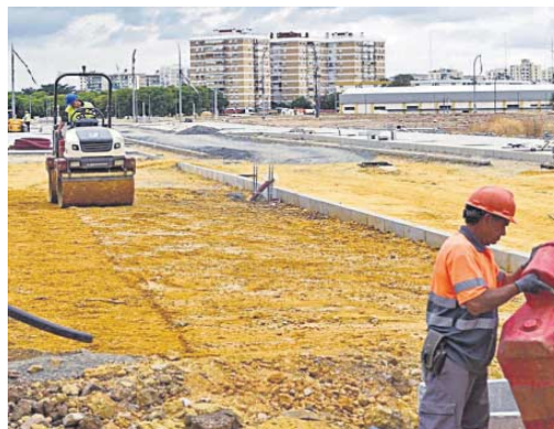
Varios operarios trabajan en la reurbanización de la parcela.

Ilermo Vázquez Consuegra, el francés Jean Nouvel, el británico Norman Foster, y el japonés Arata Isozaki. El proyecto quedó en un cajón del Ayuntamiento.