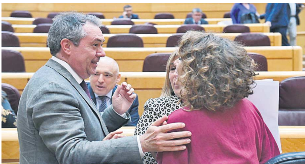
Juan Espadas saluda a la vicepresidenta María Jesús Montero en el Senado.