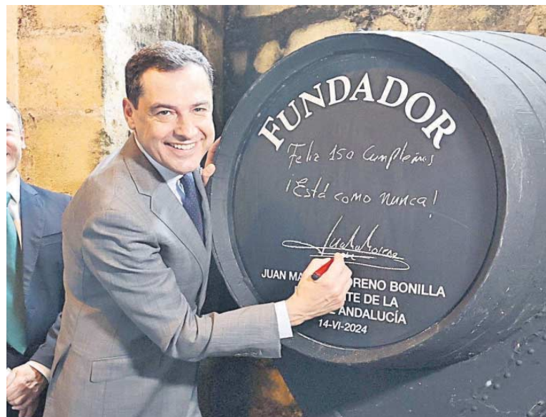
El presidente de la Junta, Juanma Moreno, en el 150 aniversario de bodegas Fundador.

Juan Espadas, su contrincante socialista, tenía un rechazo del 28%, mientras que generaba tranquilidad al 20%. También entusiasmo, pero Espadas no era un líder transversal, como sí lo es Moreno, tampoco lo era Macarena Olona, el cartel de Vox, que provocaba rechazo al 42,3% de los sondeos. Esta conjunción explica cuál fue el éxito del PP en esas elecciones, presentar a Juanma Moreno como un baluarte ante la extrema derecha de Vox sin ser agresivo con la izquierda y, en especial, con el centro izquierdo donde el PSOE pesca muy bien. En ese mismo sondeo, el 46,7% de los sondeos explicaba que la no entrada de Vox en el Gobierno les generaba tranquilidad y al 29%, entusiasmo.