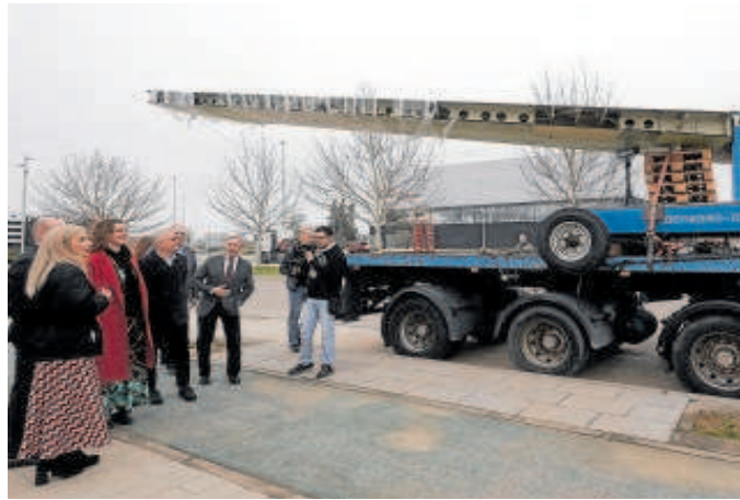
Recepción del centro Aeroespacial de La Rinconada // MANUEL GÓMEZ