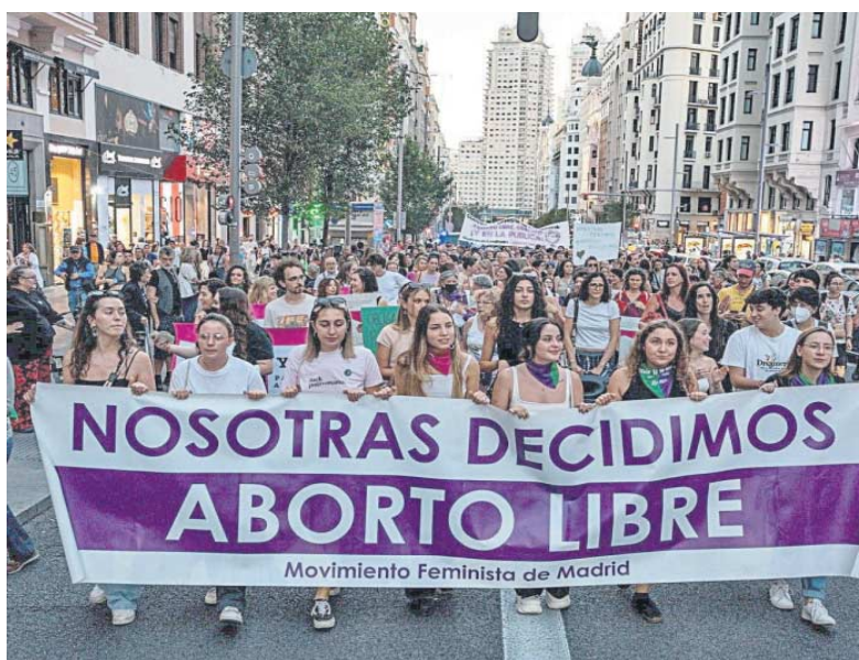
Manifestación a favor del aborto en Madrid.