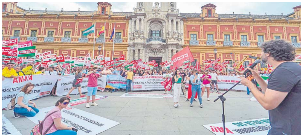
Cientos de personas se concentran en frente de la sede de la Junta de Andalucía, ayer en el Palacio de San Telmo de Sevilla.