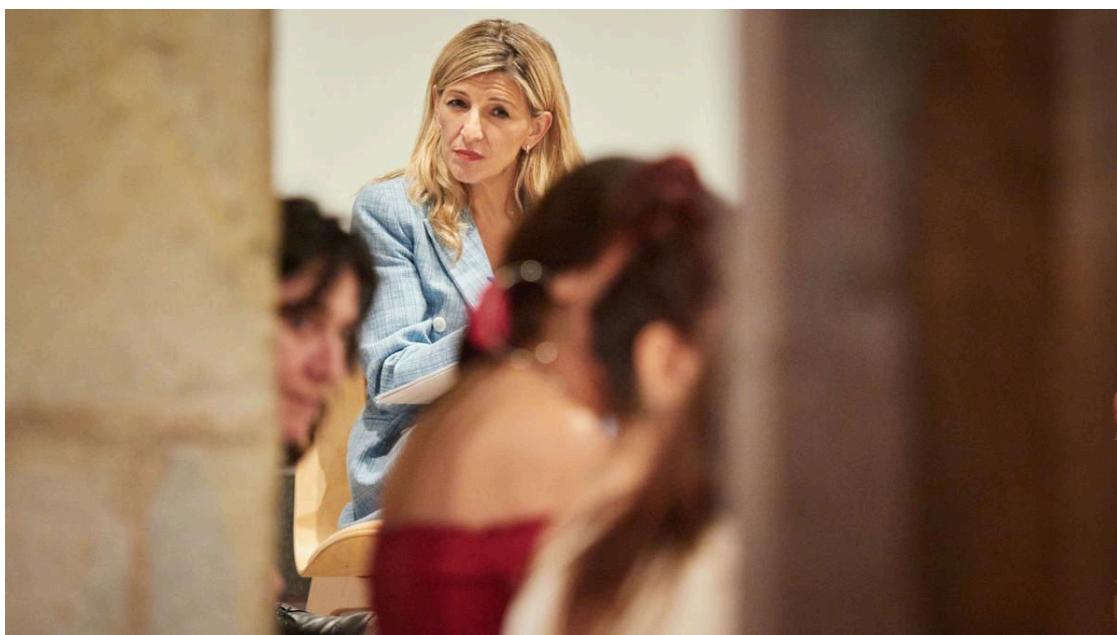
La vicepresidenta segunda del Gobierno, Yolanda Díaz, en un acto este viernes.

La negociación de una financiación "singular" para Catalunya se ha convertido en la piedra angular de las conversaciones entre el PSC y ERC para conseguir la investidura de Salvador Illa . Ese debate, en el que socialistas y republicanos entiende por "singular" cosas distintas, se ha trasladado este martes al Congreso, donde debería ser aprobado cualquier pacto.