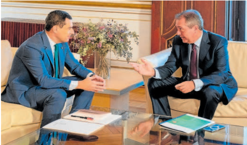
Juanma Moreno durante una reunión con Juan Espadas