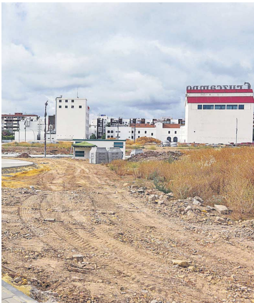
Estado actual de los suelos de La Cruz del Campo.