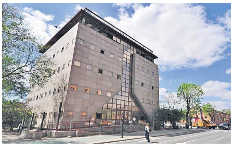
El edificio que acogerá un apartahotel en la avenida de Las Razas esquina Cardenal Bueno Monreal.

Pese a la cantidad de años que ha estado abandonada, la estruc-