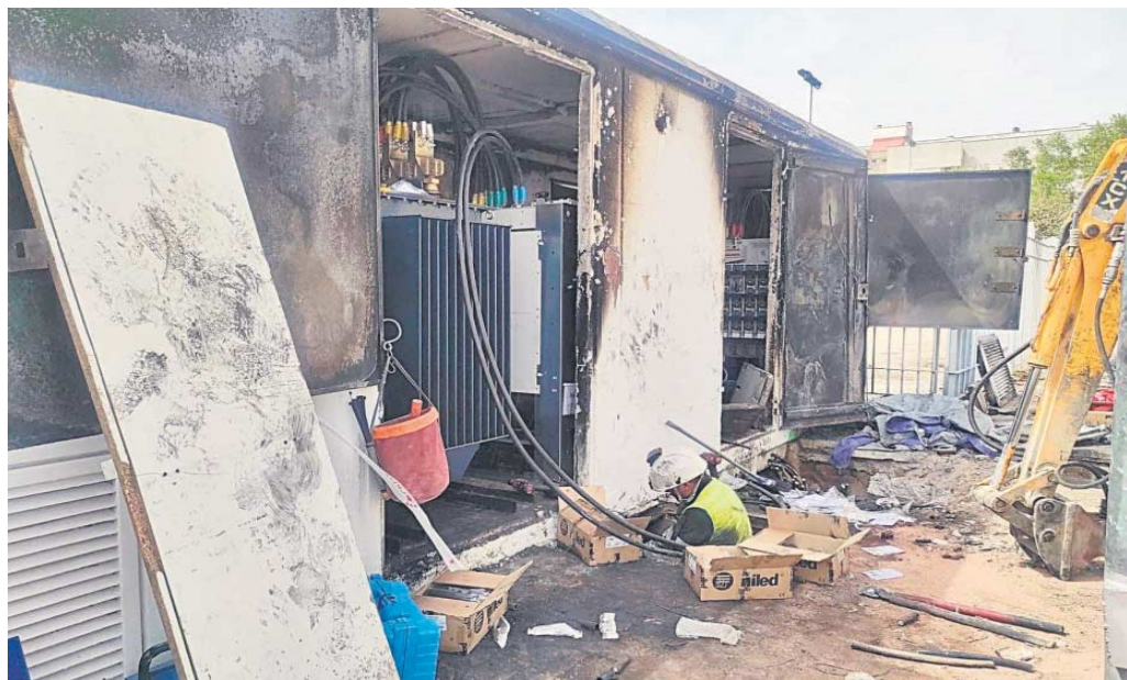
Un operario de Endesa trabaja en la reparación de un centro de transformación que salió ardiendo.

● La Junta abre expediente a Endesa por anomalías en las instalaciones de la red de los barrios