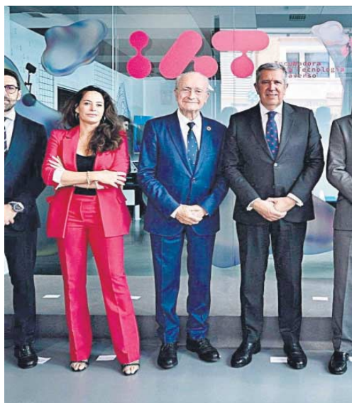
Un momento de la inauguración de la IAT del Metaverso de Málaga.

Otra es TwIndustry , que trabaja con gemelos digitales y para compañías como VW, Tesla, Seat o Airbus y que desarrolla una línea de negocio pionera en España con una programa informático propio. También se alberga a Made in verse , que escanea a personas mediante un traje de captura y movimiento que se le enfun-