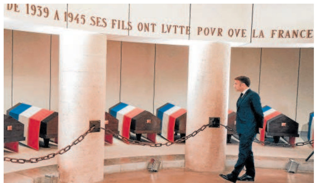
Macron visitó ayer el monumento conmemorativo de Mont-Valerien en Suresnes, a las afueras de París

«El presidente amplió el retraso económico, llevando al límite la falta de crecimiento pagado con deuda y déficits públicos. Amplió el sentimiento de desposesión y hundimiento de las clases medias, perdiendo el control de las cuentas de la nación, del orden público y la inmigración. Macron también ha tomado riesgos diplomáticos graves, desmesurados, sin tener los medios militares para garantizarlos». A juicio de Baverez, la incapacidad macroniana para hacer respetar el orden y un cierto rigor en las cuentas públicas ha minado la credibilidad de los partidos tradicionales «abriendo las puertas» a los populismos, que hoy son las fuerzas mayoritarias en todos los sondeos.