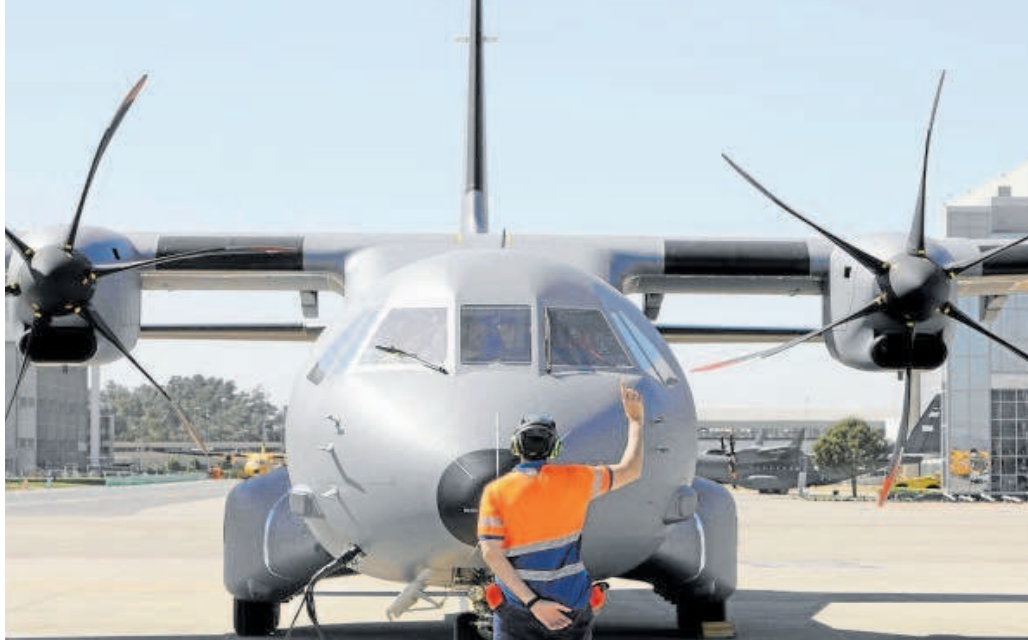
Un operario junto a un avión C295 en las instalaciones de Airbus