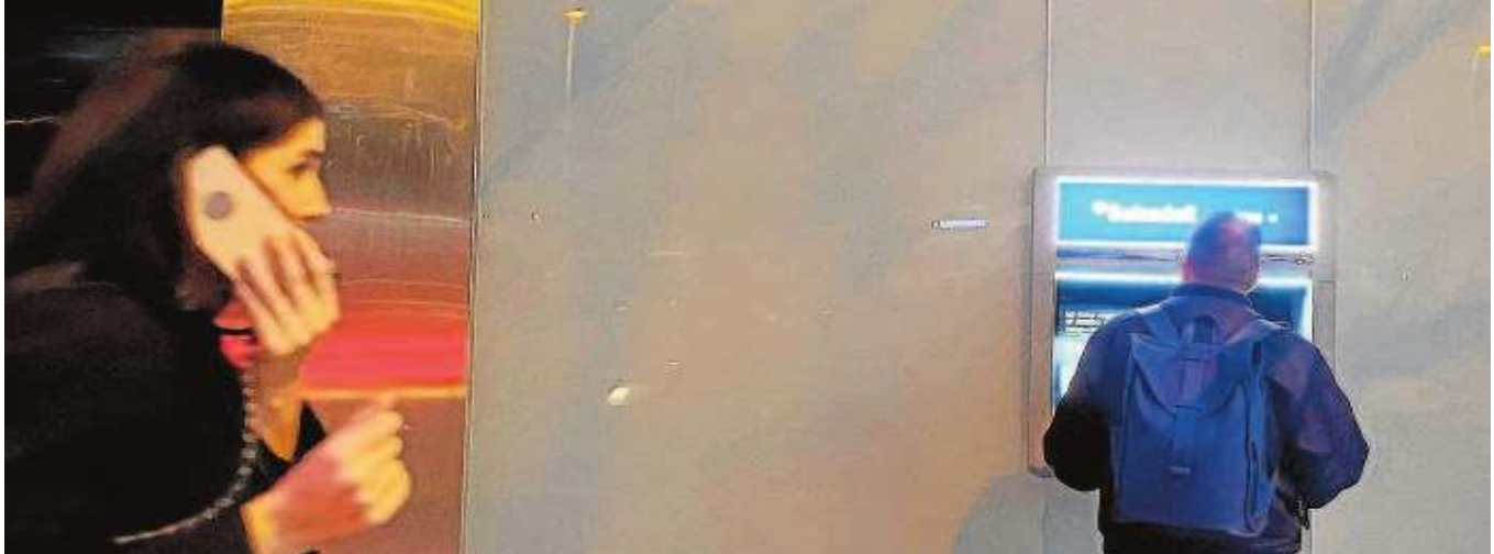
Un hombre utiliza el cajero automático de una oficina bancaria en Barcelona

Distribuido para CONFEDERACIÓN DE EMPRESARIOS DE SEVILLA * Este artículo no puede distribuirse sin el consentimiento expreso del dueño de los derechos de autor.