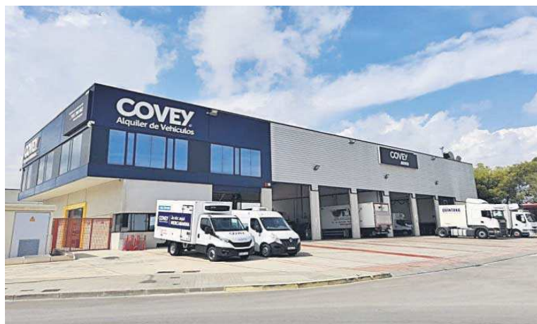
Instalaciones de Covey Alquiler en Mercabarna.