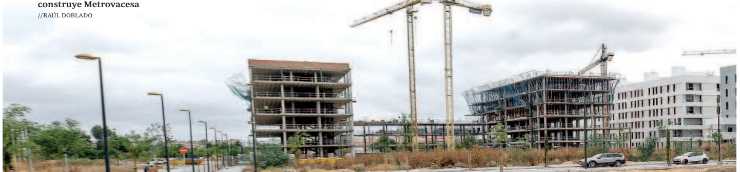
Estado en el que se encuentran las obras de las promociones que construye Metrovacesa

Las nuevas promociones que construye Emvivesa llevarán los nombres de las antiguas puertas de Sevilla. La primera en arrancar el pasado mes de junio fue el 'Residencial Puerta Jerez', compuesto por 137 viviendas y una inversión de más de 22 millones. Esta misma semana, el alcalde José Luis Sanz y la consejera de Fomento, Rocío Díaz, colocaron la primera piedra de otras