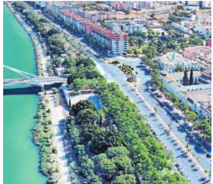
Imagen aérea del entorno del puente de la Barqueta

La intervención incluirá reformas a nivel de cimentación, fachadas, cubiertas, canalones e instalaciones de los distintos servicios, tales como las redes de saneamiento, electricidad y fontanería. En cuanto a su financiación, el Estado aportará 2,4 millones, el Ayuntamiento 1,2 millones y la Junta de Andalucía 1,1 millones. Los vecinos asumirán únicamente el 6,86% del proyecto, equivalente a 1.163 euros en cada caso.