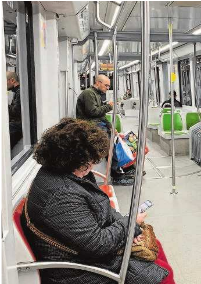
Varios usuarios en el interior de un vagón de la línea 1 del Metro

La cifra de promedio de viajeros en los primeros seis meses fue de 2 millones de usuarios al mes y de 66.558 pasajeros al día