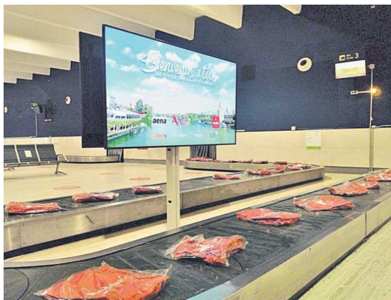
Zona de llegadas del aeropuerto de San Pablo.

Por su parte, el Observatorio de Infraestructuras de Sevilla, tras conocer la entrada en vigor del referido reglamento europeo, pidió ayer al Ministerio de Transportes, al que le queda casi un año para acabar su estudio sobre la conexión entre San Pablo y la