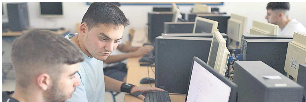
Alumnos de una FP Dual en Alcalá de Guadaíra.