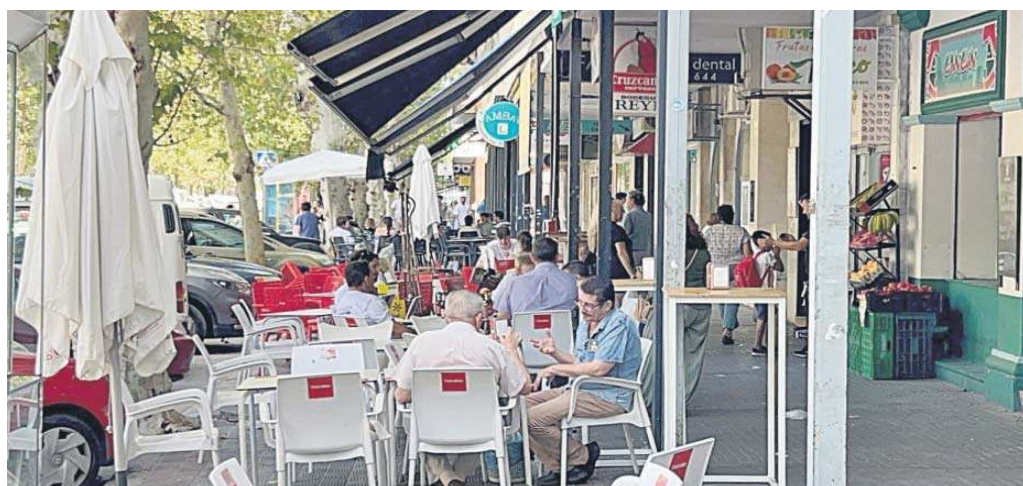
Veladores ocupando buena parte de una acera.