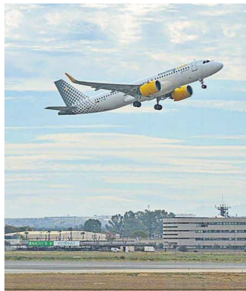
Un avión despegando del aeropuerto de San Pablo.

La ciudad es víctima de los efectos del gran fenómeno de la pos-pandemia, el turismo masivo, pero nadie proyecta un plan global de respuesta que nos permita mantener con vigor el sector terciario del que vivimos en buena medida, pero que sea posible