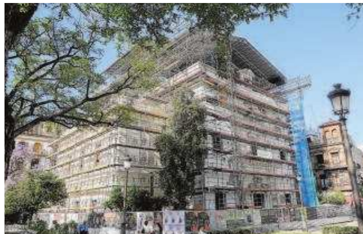
Obras de rehabilitación de la antigua iglesia de San Hermenegildo

En el verano de 2023 se solicitaron los correspondientes informes al Instituto de España, al Instituto del Patrimonio Cultural de España, a la Junta de Andalucía, a la Universidad de Sevilla y al Ayuntamiento para declararlo lugar de memoria democrática. En el texto del Parlamento de Andalucía se destacaba que «ha sido testigo de una larga y trascendente historia», mientras que en el de Instituto Español se incidía en su relevancia «en la historia del constitucionalismo y del parlamentarismo españoles».