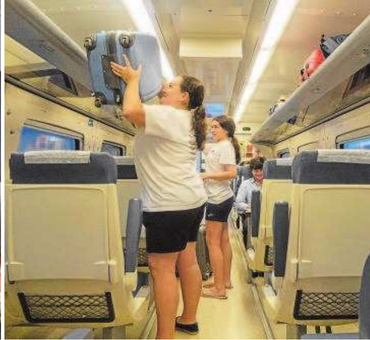
Viajeros subiendo en la estación de Huelva a uno de los trenes con destino a Sevilla

po para recoger a mi nieta», indica. Sobre el AVE asegura que es «muy necesario aunque no creo que lo vayan a poner. Huelva está olvidada en todos los sentidos».