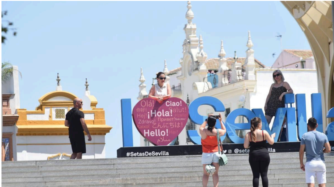
Más de 15.000 anuncios de pisos ilegales de Sevilla en las plataformas digitales.