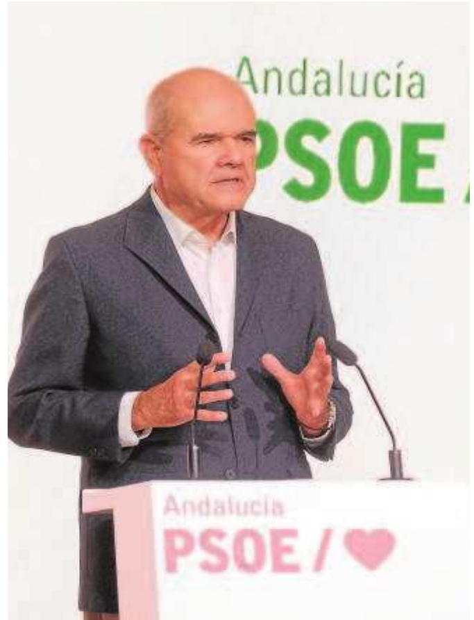
El expresidente de la Junta de Andalucía Manuel Chaves, el jueves

En 2014, Susana Díaz anunció que los imputados deberán dejar sus escaños, «todos es todos», aclaró cuando los periodistas le repreguntaron. Dicho y hecho. Sus antecesores tuvieron que entregar sus actas en el Congreso y el Se-