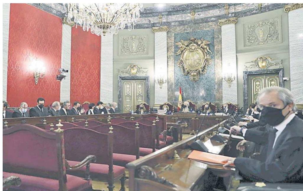
La vista de los recursos de los ERE en el Tribunal Supremo.