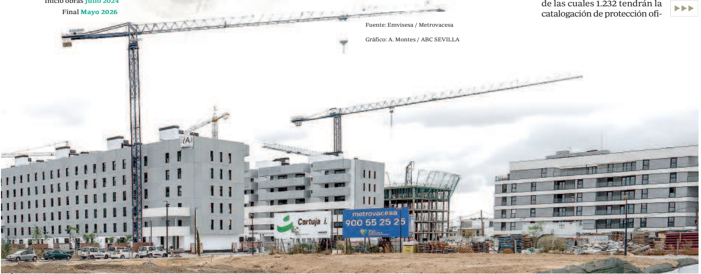
Gráfico: A. Montes / ABC SEVILLA