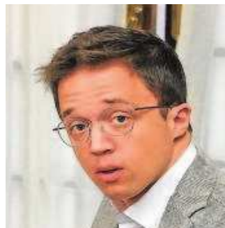
Íñigo Errejón