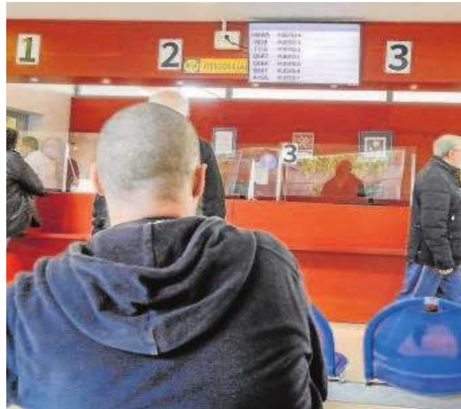
Imagen de un centro de salud de Sevilla

Para el 40% restante, «la normalidad es que si pides cita un 18 de julio te la den como pronto para el 30 de julio, con