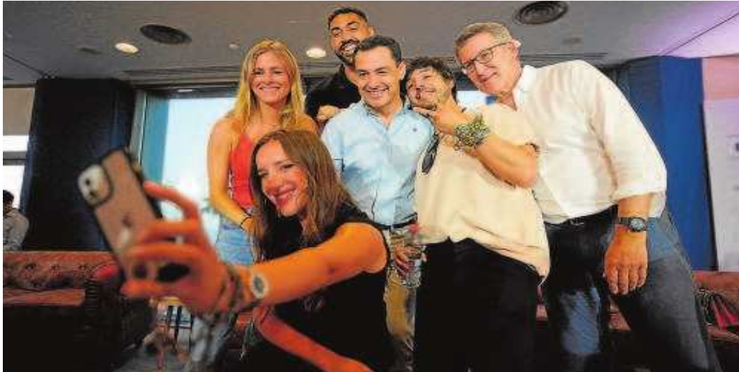
Alberto Núñez Feijóo y Juanma Moreno, ayer en la escuela de verano de Nuevas Generaciones en Torremolinos