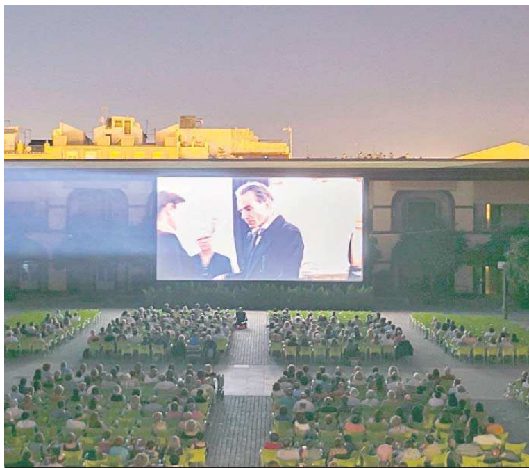
Una imagen del cine de verano de la Diputación.

Sevilla despierta en primavera con el Miércoles de Ceniza, pero se olvida del verano. Hasta desahoreó el torneo de verano en el que los dos equipos de la ciudad hacían de anfitriones y el campeón se llevaba un trofeo salido del taller de orfebrería de Marmolejo que sus hijos paseaban por la ciudad. Un trofeo que sueña a Transición, a juzgar por los victores que uno escuchaba antes de uno de los partidos: "Ni Suárez ni Tierno, el Betis al Gobierno". Cuando Adolfo Suárez llegó al Gobierno en 1976 y Enrique