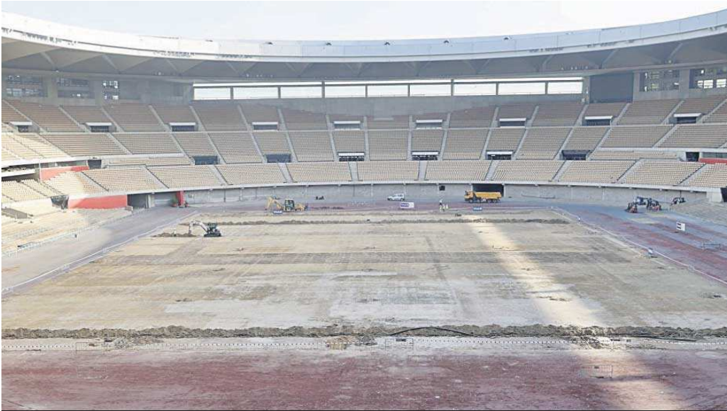
Operarios trabajan en el interior del estadio de la Cartuja.

Distribuido para CONFEDERACIÓN N DE EMPRESARIOS DE SEVILLA * Este artículo no puede distribuirse sin el consentimiento expreso del dueño de los derechos de autor.