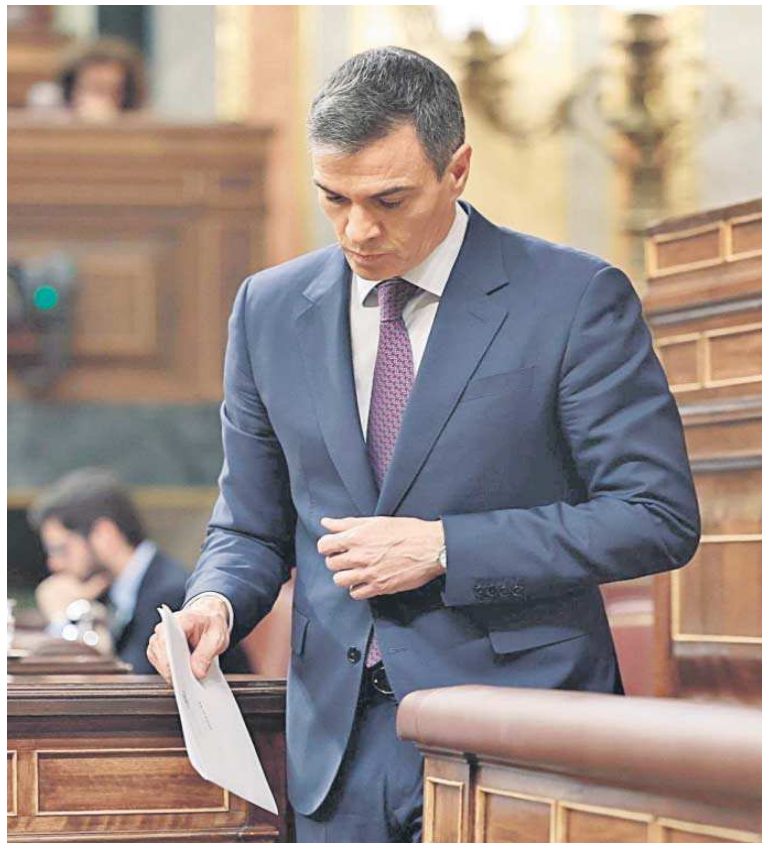
El presidente del Gobierno, Pedro Sánchez, antes de una intervención en el Congreso.

Enmarca en ese contexto la investigación que se sigue contra su esposa, Begoña Gómez, por un presunto tráfico de influencias y ante la que el viernes ella se acogió a su derecho a no declarar porque su defensa no ve garantías sufi-