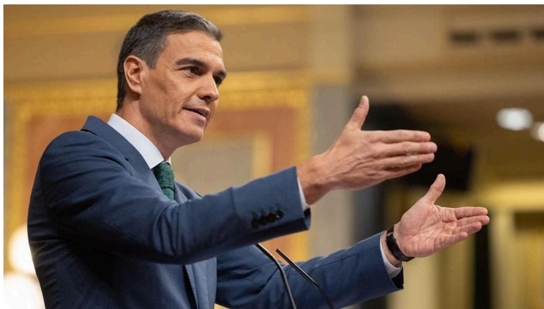
El presidente del Gobierno, Pedro Sánchez, durante su intervención en el Congreso para presentar el plan de recuperación.

El Gobierno arrancará este lunes la ronda de contactos con los grupos parlamentarios para concretar las medidas de un plan de regeneración con el que se pretende retomar la iniciativa y rellenar la actividad parlamentaria a la espera de los Presupuestos. En Moncloa rebajan así las prisas y alejan un calendario inmediato de aplicación . Su previsión es que en septiembre continúen las conversaciones, no solo con grupos políticos, sino también con el sector de los medios de comunicación , a quien afectará la principal pata del plan.