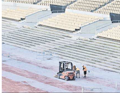
El recinto llegará a los 70.000 espectadores tras la primera fase.

● La Junta apunta que la segunda fase de la remodelación del interior del estadio comenzará en el primer trimestre de 2027