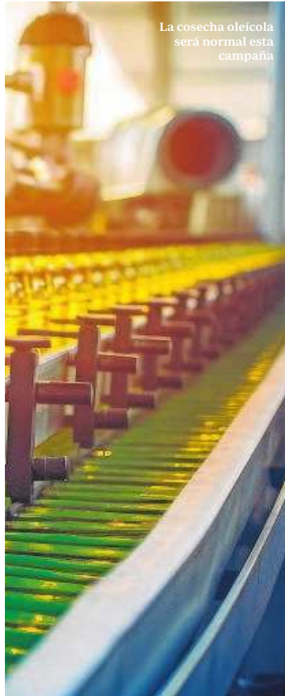
La cosecha oleícola será normal esta campaña