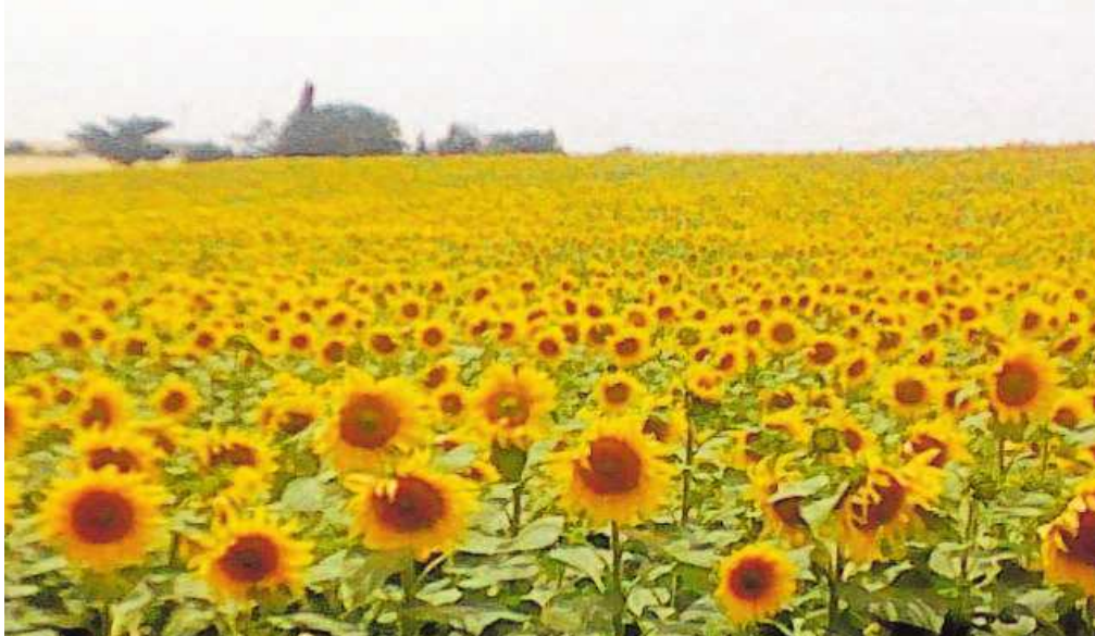
El cultivo de girasol ha tenido buen desarrollo en Andalucía // V.F.