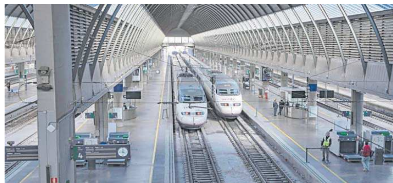
Dos trenes en el interior de la estación de Santa Justa.

guardar el equilibrio entre vecinos y visitantes. Seguimos perdidos con el debate sobre la tasa turística, gastamos energías en si se debe cobrar o no en un monumento en particular y en unas ordenanzas para que en unos cuantos bares se pueda beber cerveza en la calle. Nadie habla de un plan integral como los que han aprobado las ciudades que van muy por delante de nosotros a la hora de afrontar este problema.