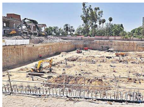
Estado de los trabajos que se desarrollan actualmente.