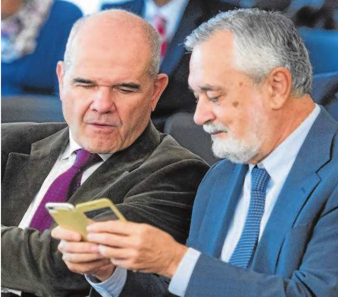
Los expresidentes de la Junta de Andalucía Manuel Chaves y José Antonio Griñán, en el juicio de la pieza política del caso ERE en 2018