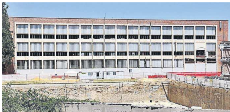
El edificio del Cubo, una de las construcciones que se mantendrá del antiguo recinto fabril.