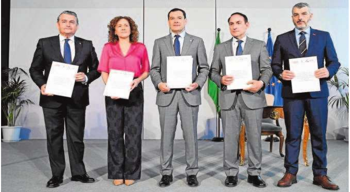
Juanma Moreno con los representantes de UGT y CCOO en Andalucía, el consejero Sanz y el presidente de los empresarios andaluces