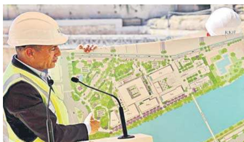
El presidente de KKH muestra un plano aéreo del proyecto.

Hasta aquí la reurbanización externa, que debe estar acabada en el otoño de 2025. La segunda fase se acometerá en el interior del antiguo complejo tabacalero, concebido como un gran y nuevo parque para la ciudad. Destacan tres puntos claves en su concepción. El nuevo hotel de gran lujo para el que ya se prepara la zona de cimentación, el edificio del Cubo y las dos plazas que se crearán: una frente al hotel y otra que servirá de conexión entre el Cubo y la capilla de la Hermandad de las Cigarreras. No debe olvidarse la gran avenida que atravesará este recinto desde Juan Sebastián Elcano has-