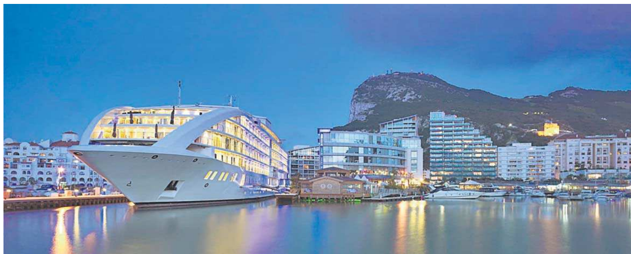
El barco hotel de la empresa finlandesa que se encuentra atracado en Gibraltar.