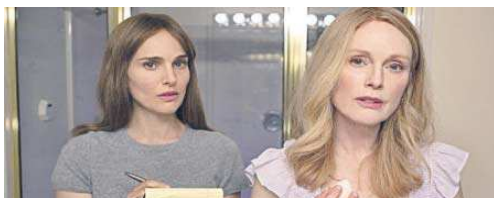
Una imagen de 'Secretos de un escándalo' (2023, Todd Haynes).

El domingo 28, la tunecina Entre las higueras reivindica a las