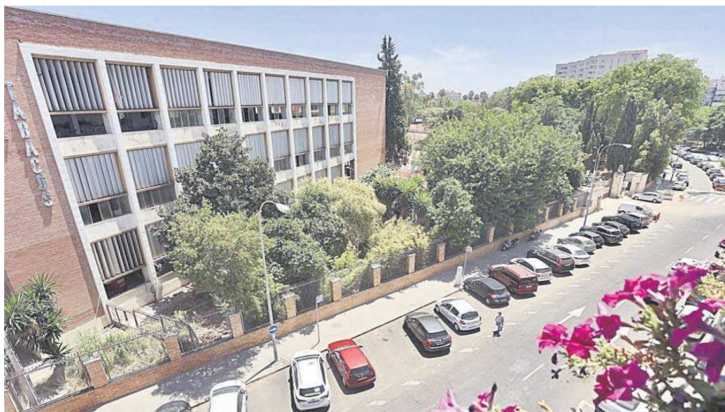
El muro que rodea la antigua Altadis y que supone una barrera en Los Remedios.

La asistencia del gobierno local a este encuentro obedeció a las obras de reurbanización externa, que comenzarán la segunda semana de agosto. Es uno de los compromisos adquiridos por el grupo inversor con el Ayuntamiento para mejorar la imagen del entorno de Altadis y, sobre to-