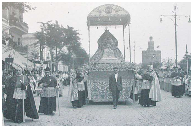
La Virgen de los Reyes por el Paseo de Colón durante la procesión del Congreso Mariano de 1929.

Con el nuevo itinerario se da solución a varias cuestiones de seguridad. Una era el importante lunar de los Jardines del Cristina. El Consistorio advirtió de que en ellos se concentrarían, embolsadas, un importante número de personas. Desde este céntrico enclave, los fieles tendrían la posibilidad de disfrutar