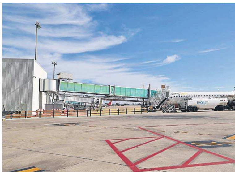
Pistas del aeropuerto de Sevilla.