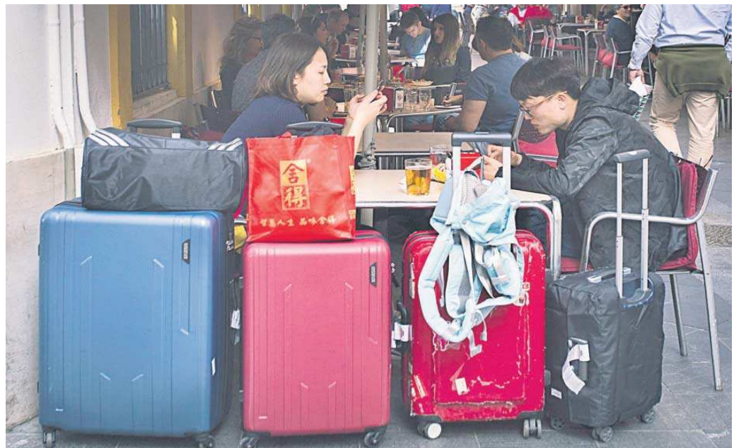
Turistas asiáticos sentados en el velador de un bar del centro de Sevilla.

El voto del alcalde impidió que prosperara la moratoria del PSOE para los pisos turísticos