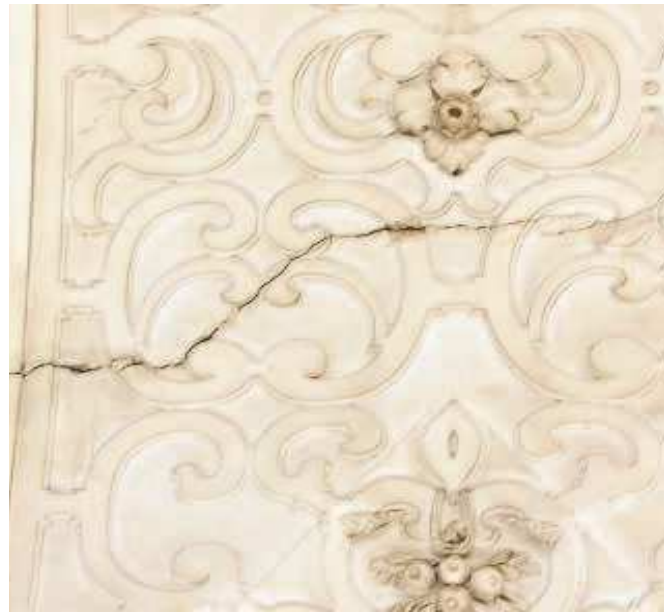
Grietas aparecidas en La Caridad tras intervenir las Atarazanas

La majestuosidad del templo lo convierte en uno de los lugares favoritos de los sevillanos para casarse. La Caridad junto a otras iglesias como la Basílica de Jesús del Gran Poder o la parroquia de la Magdalena, cuenta con largas listas de espera para poder escoger día. En