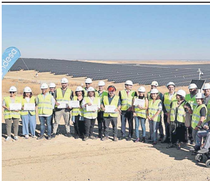
Asistentes a la inauguración de la nueva planta solar de Endesa en Sevilla.

La construcción de la instalación, que producirá 200 GWh al año -equivalente al consumo energético anual de 57.000 familias-, ha generado 300 empleos directos y otros 60 indirectos. También han colaborado empresas locales como Elmya y Siemens y se ha aplicado la última tecnología, como el uso de láser escáner para el estudio topográfico, drones para tender