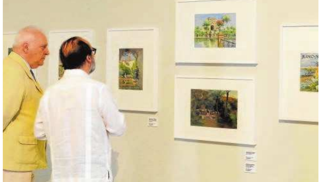
Más de 100 piezas de la colección de ABC conforman esta exposición // RAÚL DOBLADO