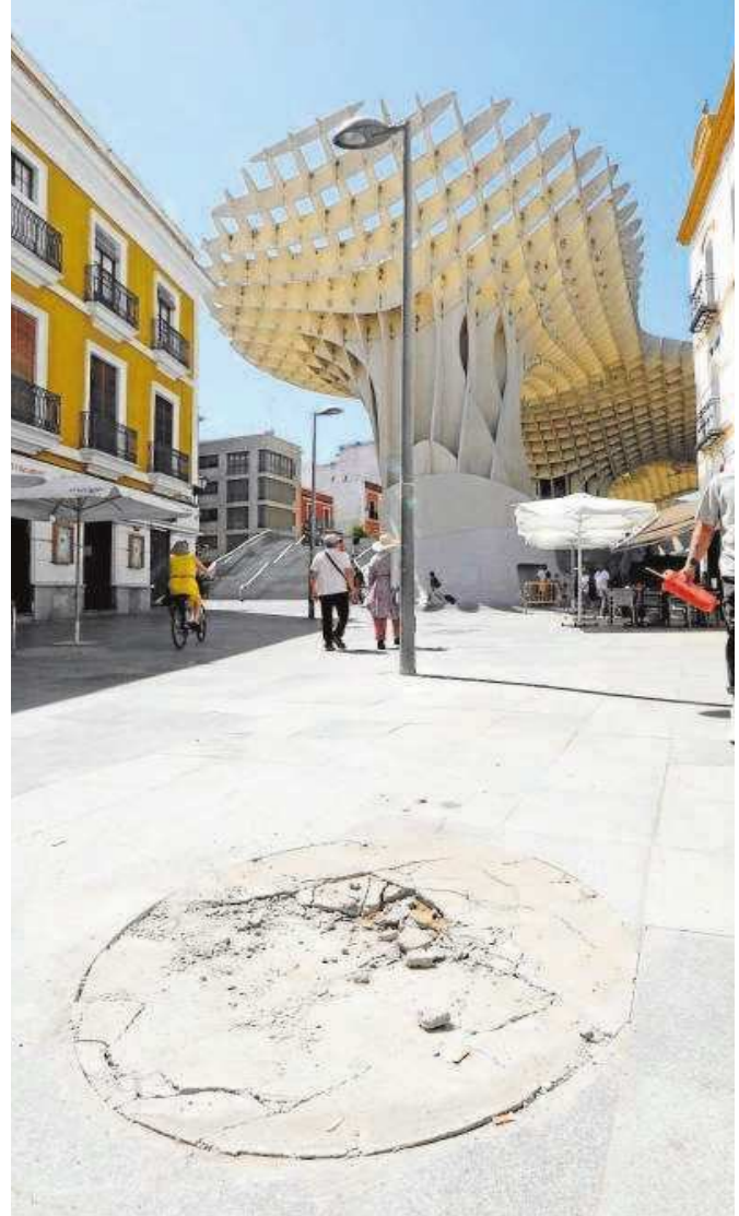
Una de las fuentes ya eliminadas en las obras de Regina

Por otro lado, los cruces con las calles transversales, tanto con Jerónimo Hernández, como con San Juan de la Palma, presentan un pavimento muy deteriorado «que ha acabado convirtiendo en cierto modo a estos encuentros en fronteras que restan continuidad al carácter peatonal de la vía, a pesar de conectar espacios de gran interés turístico como la iglesia o la Plaza del Pozo Santo, o de conducir a edificios históricos como la Casa de los Artistas», señala el proyecto. Por ello, «se realizará una nueva pavimentación en los cruces con las calles Jerónimo Hernández y San Juan de la Palma, utilizando un pavimento tradicional como el adoquín de Gerena. Asimismo, se incorporarán maceteros de diferentes tamaños para las plantas, que serán artesanales de barro y que llevarán el logo identificativo de la zona y el del Ayuntamiento».