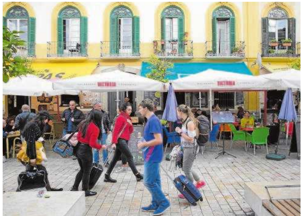
Un grupo de turistas se dirige a su apartamento de alquiler vacacional en Málaga

«Hoy lo decimos desde el Campo de Gibraltar alto y claro: no estamos en contra del turismo, pero sí de este modelo que expulsa a nuestros vecinos y vecinas de nuestros barrios» y genera «empleo precario», concluyeron.