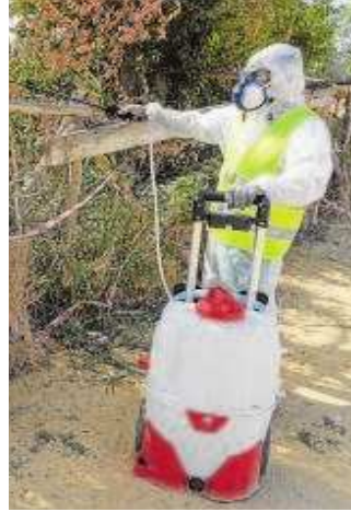
Un operario fumigando

Aunque el caso sea probable, Coria del Río está en nivel 5 de riesgo, el máximo, y se aplican las medidas en relación a esta situación, tal como añaden las mismas fuentes. La Consejería, a través de la Dirección General de Salud Pública y Ordenación Farmacéutica, detectó el pasado lunes la presencia de virus del Nilo Occidental en nuevas capturas de mosquitos realizadas entre el 8 y 12 de julio en los municipios sevillanos de Almensilla, Villamanrique de la Condesa, Los Palacios y Villafranca y Utrera, con lo que