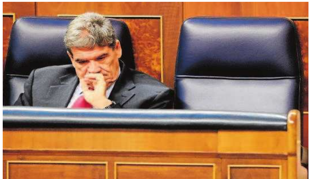
José Luis Escrivá, ministro de Transformación Digital y Función Pública

Tratados. Cree la Comisión que tal prohibición es un obstáculo en el mercado único y limita el acceso a las pensiones complementarias, aunque no cuestiona los importes deducibles. El hecho de que España permita transferencias nacionales, pero no transfronterizas de derechos de pensión en regímenes complementarios de pensión también puede ser contrario a las libertades del mercado interior.