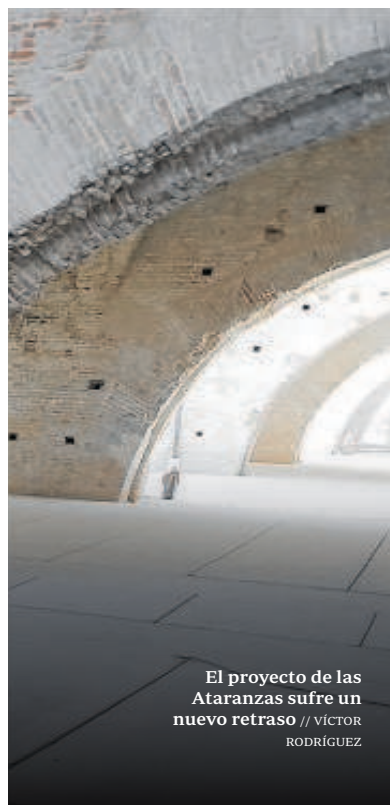
El proyecto de las Atarazanas sufre un nuevo retraso // VÍCTOR RODRÍGUEZ

bajar a la cota original del siglo XIII, la elección de un elemento metálico como el zinc para algunas de las cubiertas del edificio y la ubicación de escaleras mecánicas.