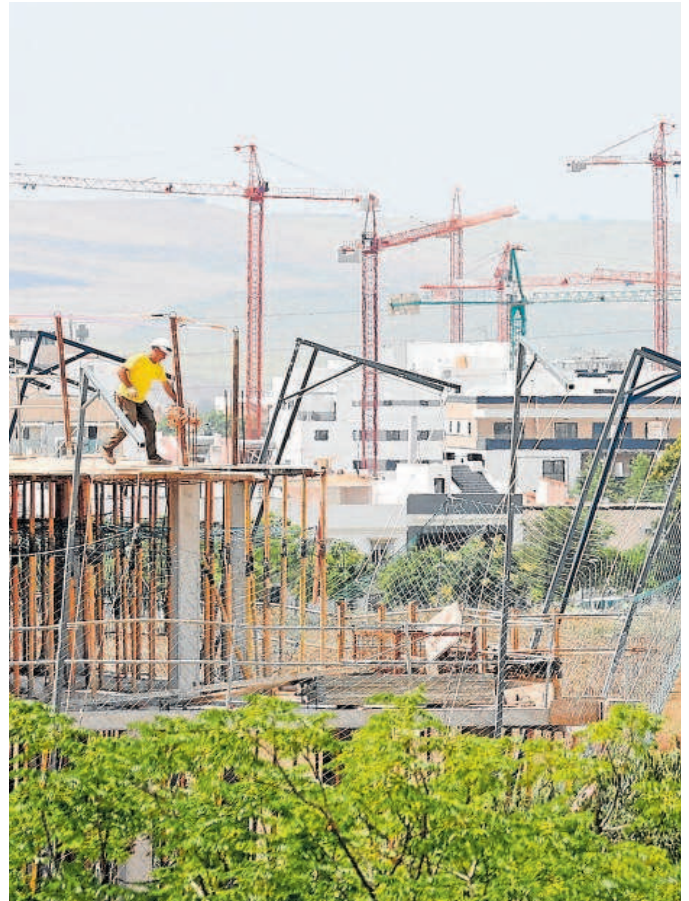
Promoción de viviendas // VALERIO MERINO

La Junta defiende su norma de pisos turísticos y el PP andaluz pone a Cádiz de ejemplo por no dar licencias