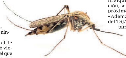
Imágen de un mosquito del género Culex, transmisor del virus del Nilo

«No tenemos recursos económicos ni los medios técnicos y humanos para desarrollar una fumigación a gran escala»