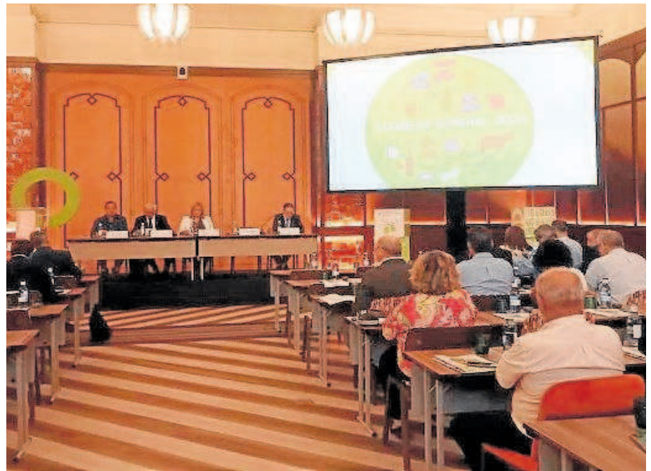
Asamblea de Cooperativas Agro-alimentarias