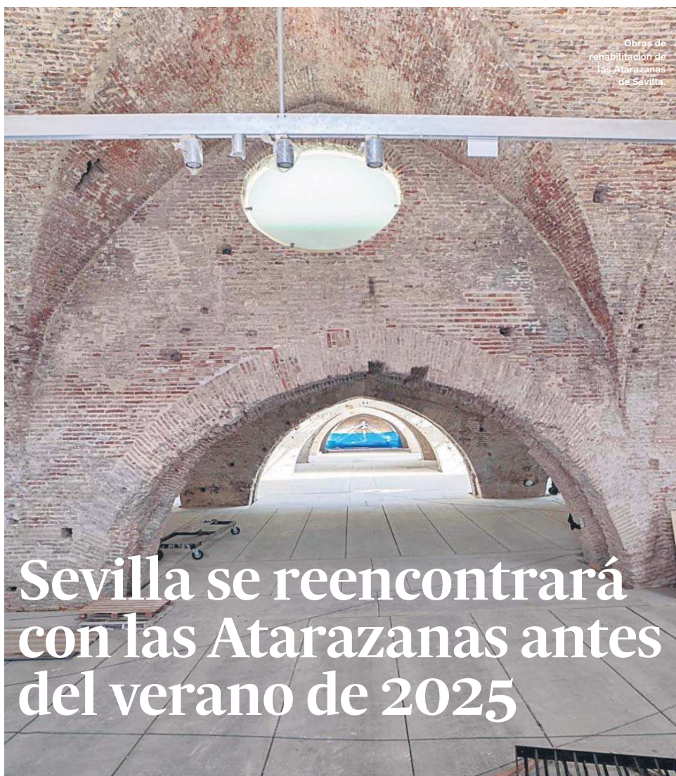
Obras de rehabilitación de las Atarazanas de Sevilla

Aunque el titular prefirió ser cauto en cuanto a dar una fecha concreta, sí que ha confirmado que se abrirá al público el próximo año. “Todo depende de que la empresa vaya al ritmo correcto, pero en este caso todo está yendo razonable bien”, apuntó Bernal. Este espacio funcionará de manera temporal hasta que las obras del Arqueológico finalicen entre 2026 y 2027.