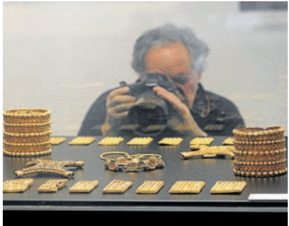
Una imagen del Tesoro del Carambolo // RAÚL DOBLADO

El Museo Arqueológico de Sevilla, instalado desde 1946 en el que fuera pabellón de Bellas Artes de la Exposición Iberoamericana de 1929, es un edificio neorrenacentista obra del arquitecto