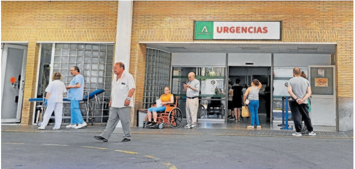
Usuarios a las puertas de un centro sanitario de Andalucía