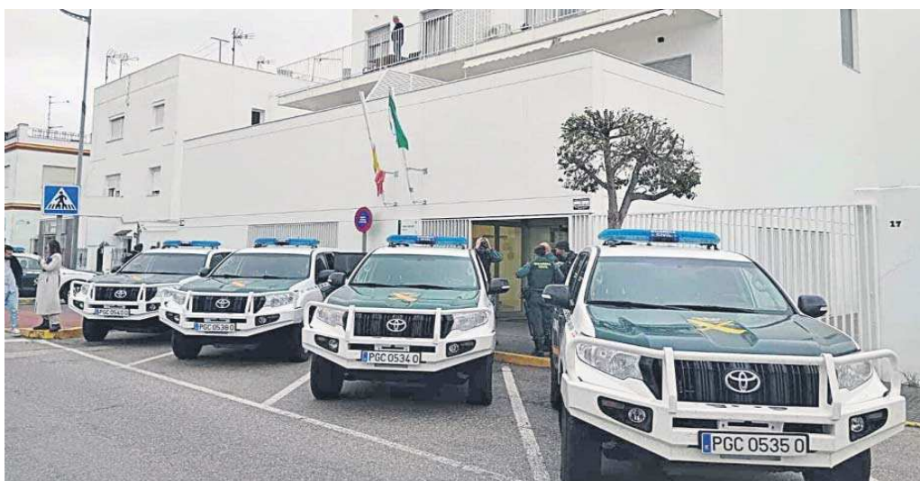
Vehículos de la Guardia Civil aparcados delante de los juzgados del Campo de Gibraltar.

● Van a unificar los partidos judiciales de Algeciras, La Línea y San Roque; y habrá un juzgado exclusivo de violencia en Algeciras