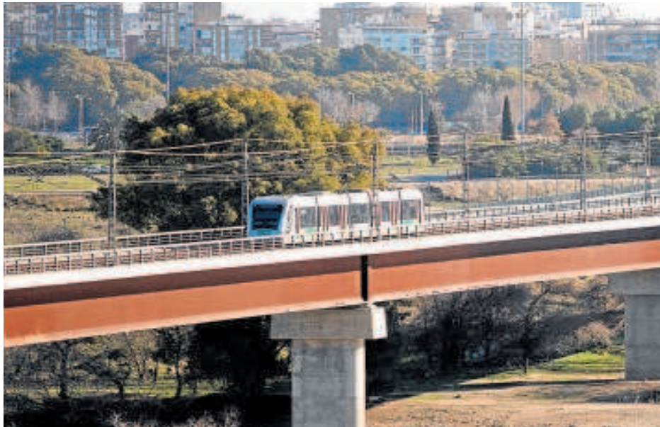
El Metro circulando por las vías de San Juan de Aznalfarache